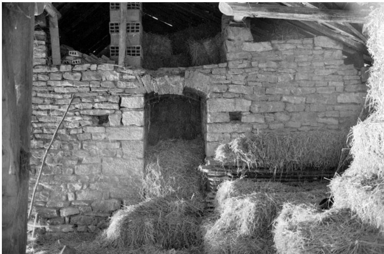
Porte d'enfournement du 2e four (four intérieur).