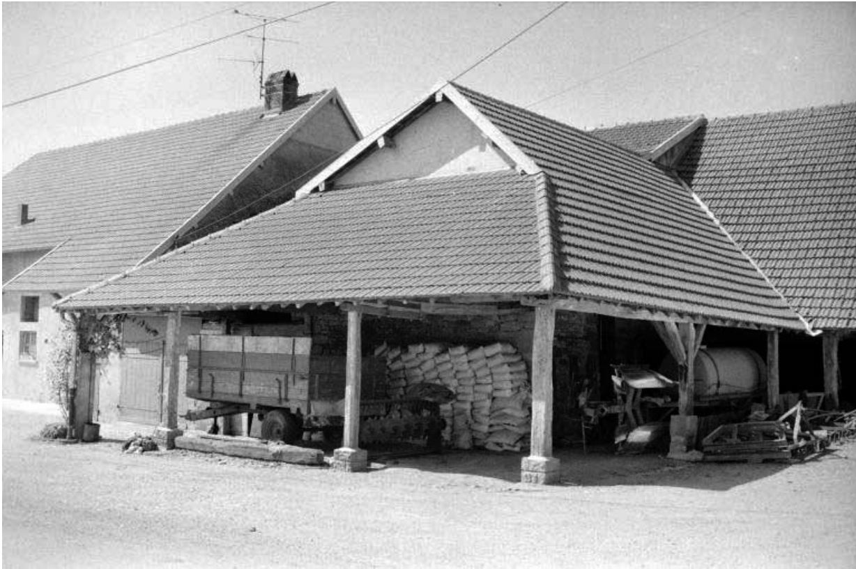
Corps de bâtiment abritant le 1er four.