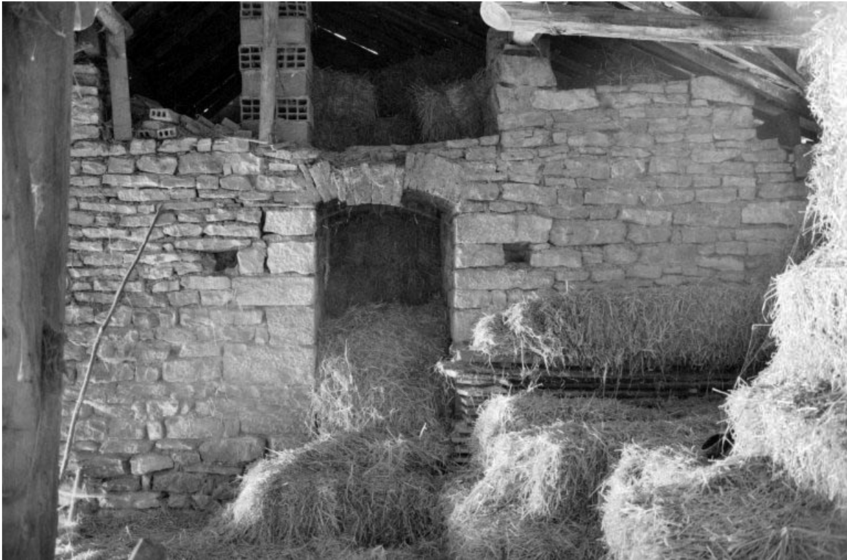
Porte d'enfournement du 2e four (four intérieur).