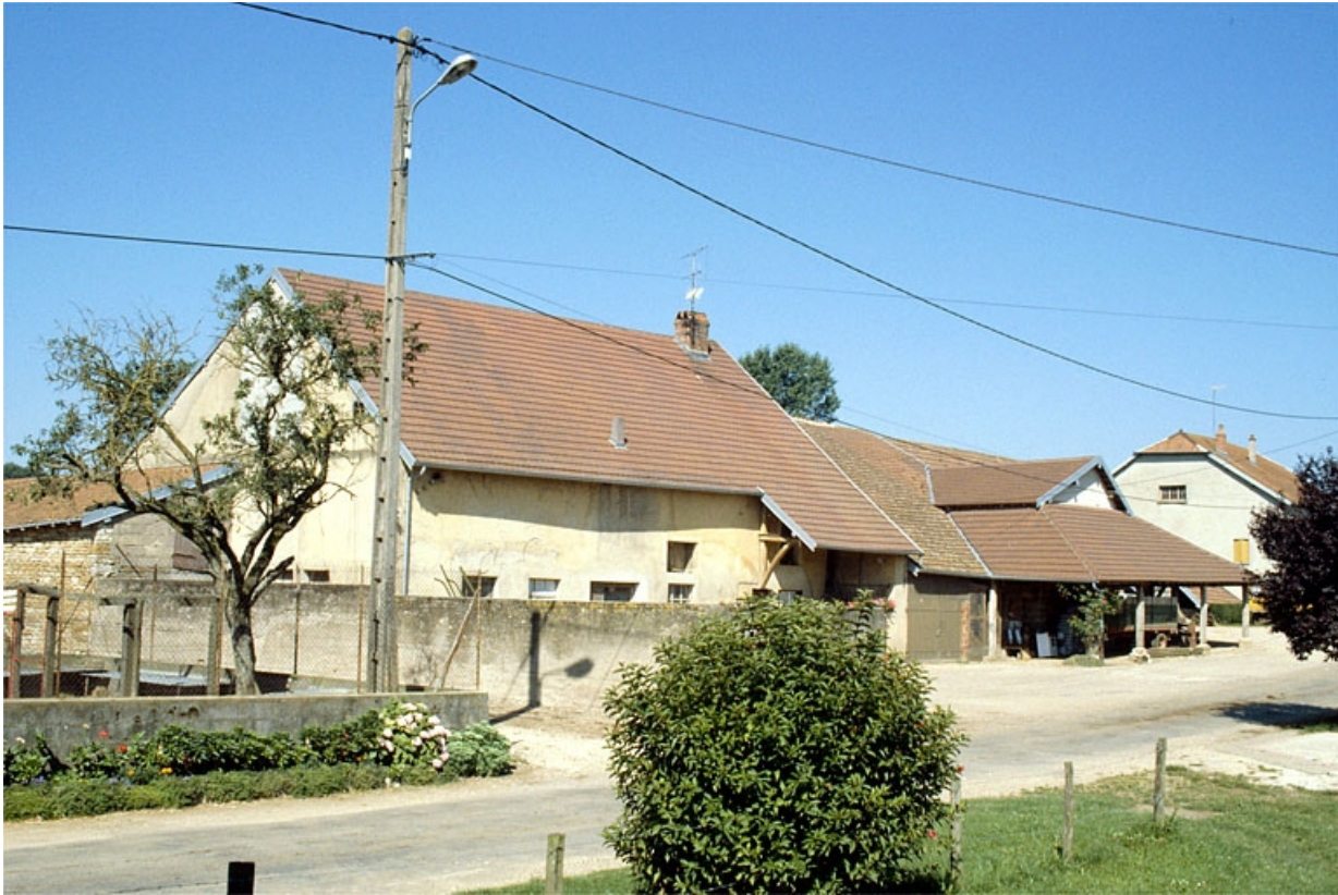
Vue d'ensemble, depuis l'est.