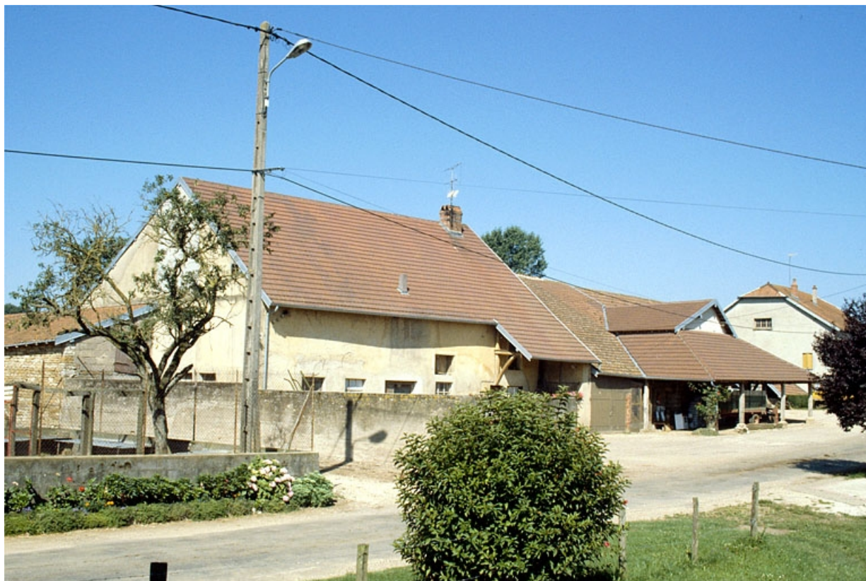
Vue d'ensemble, depuis l'est.