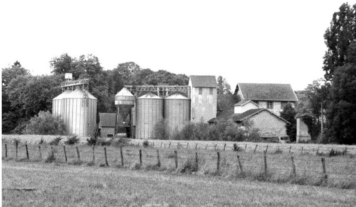
Vue d'ensemble, depuis le nord-ouest.