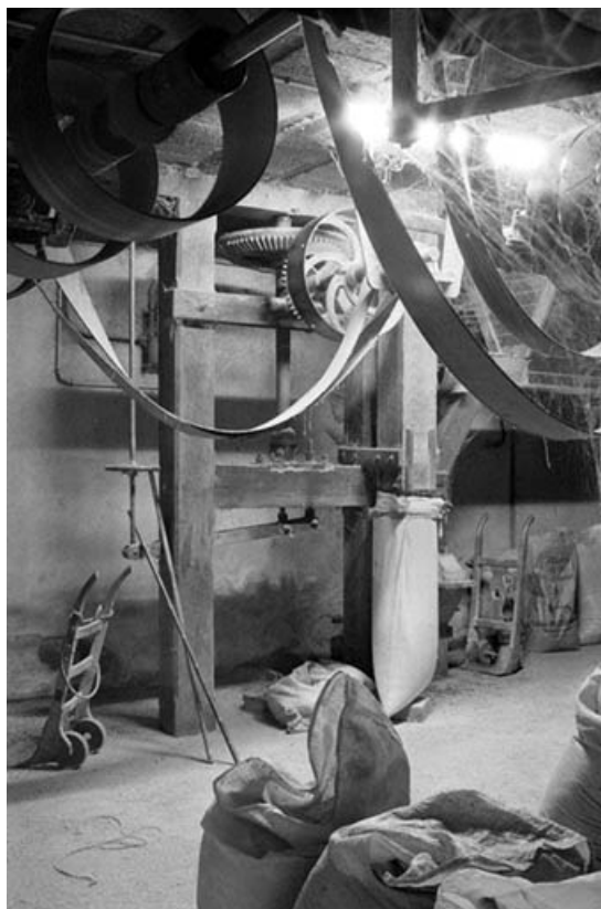
Minoterie (G), étage de soubassement : systèmes d'entraînement et d'allège d'une paire de meules. 39, Vaudrey rue du Moulin