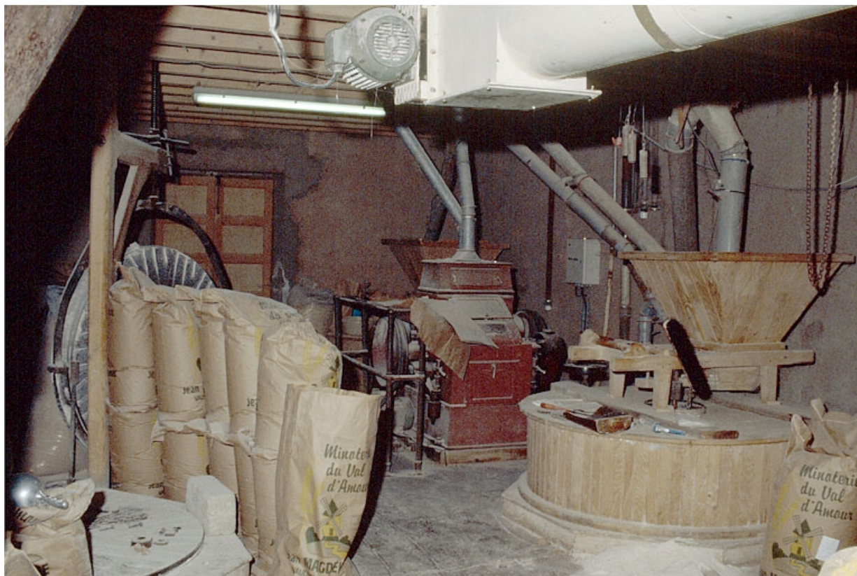
Minoterie (G), rez-de-chaussée : intérieur de l'atelier de fabrication. 39, Vaudrey rue du Moulin