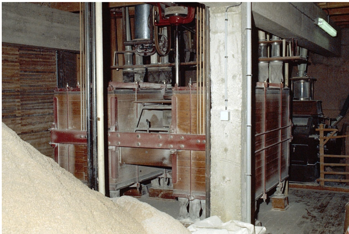
Minoterie (H), rez-de-chaussée : plansichter. 39, Vaudrey rue du Moulin