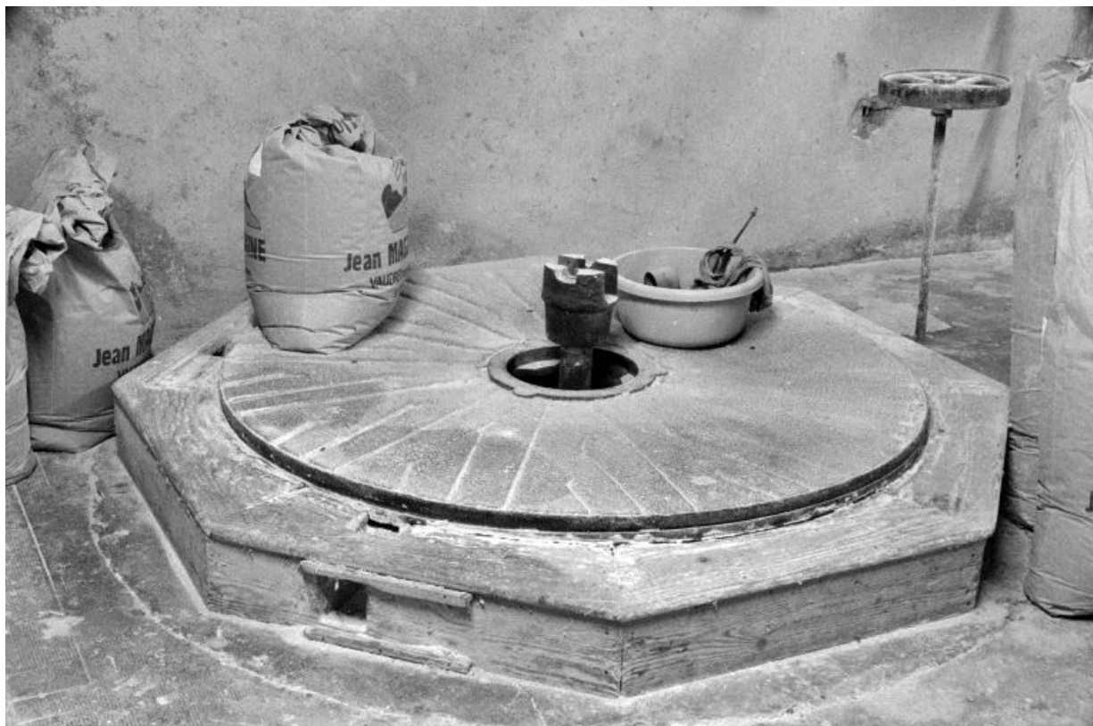
Minoterie (G), rez-de-chaussée : meule inférieure en cours de rhabillage.