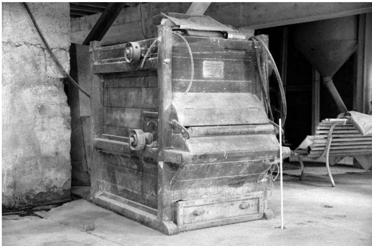
Minoterie (H), étage de soubassement : nettoyeuse à sacs Lhuillier. 39, Vaudrey rue du Moulin