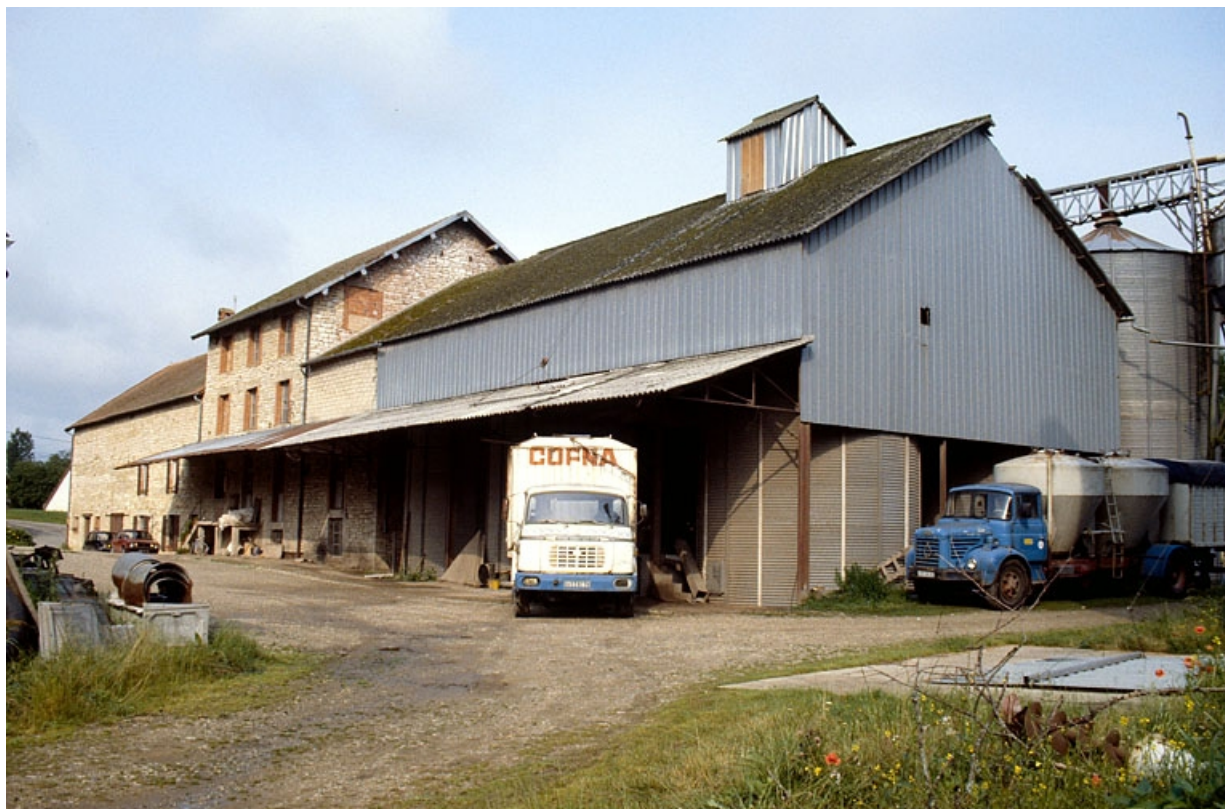
Hangar (E) et minoterie, depuis l'est. 39, Vaudrey rue du Moulin