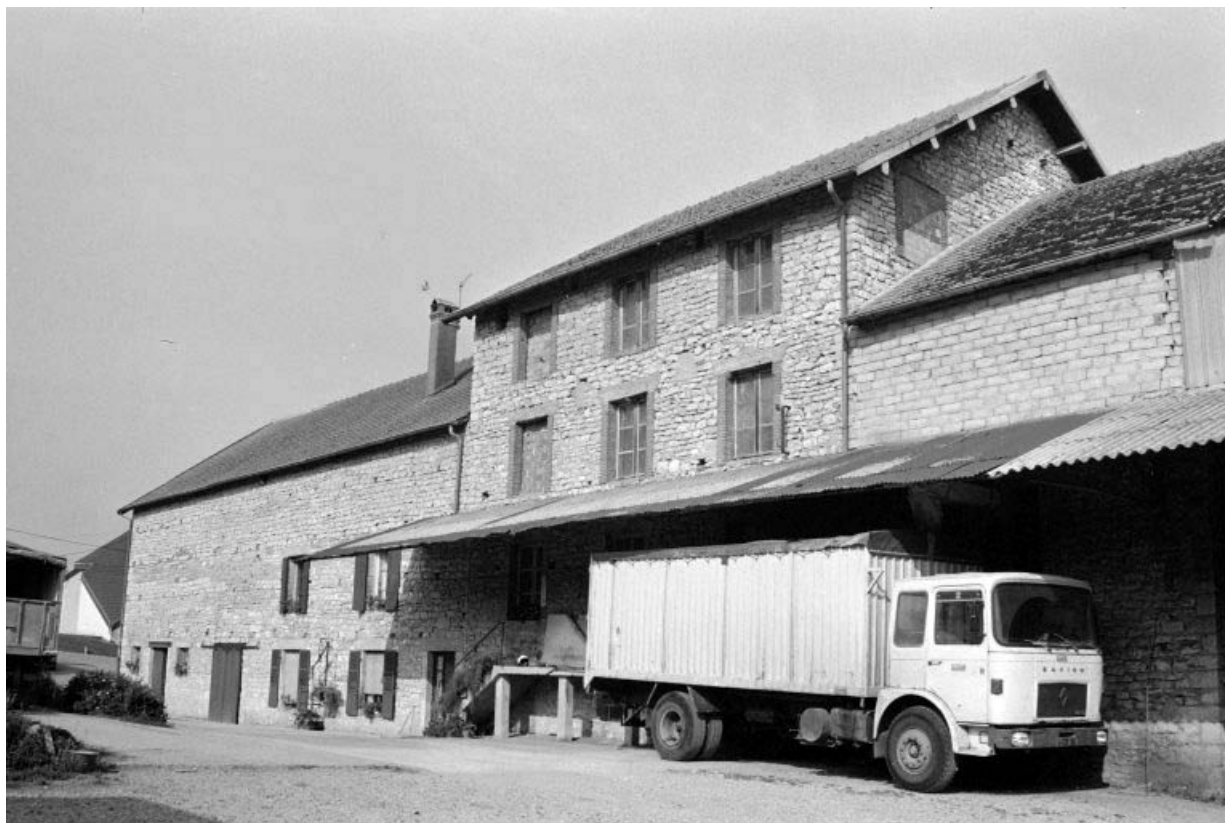
Minoterie (G, H) et logement patronal (I). 39, Vaudrey rue du Moulin