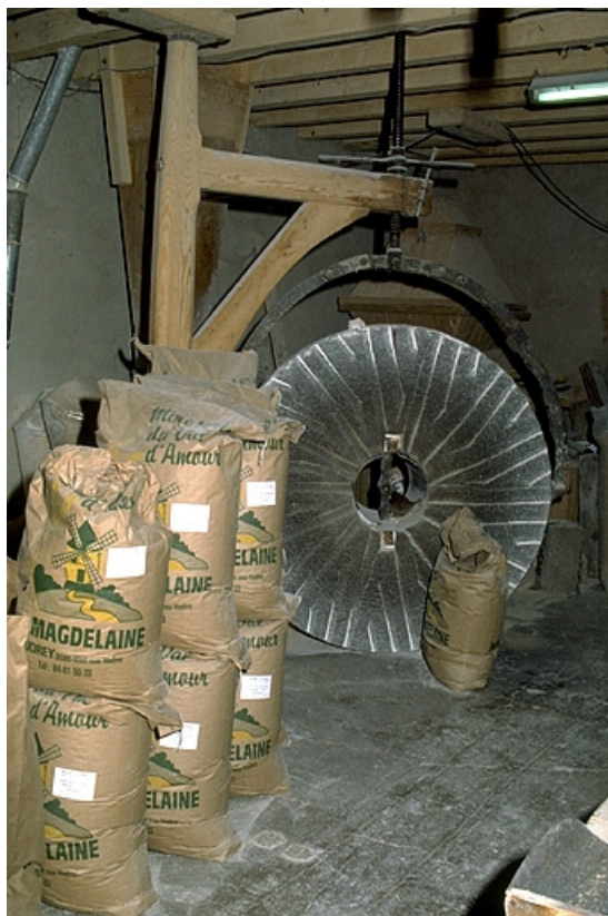
Minoterie (G), rez-de-chaussée : potence et meule. 39, Vaudrey rue du Moulin