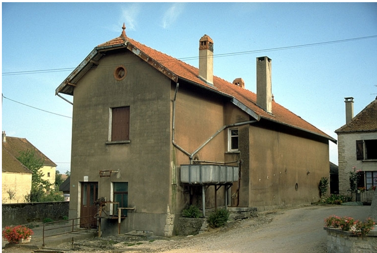
Fromagerie (A), vue de trois quarts droit. 39, La Loye