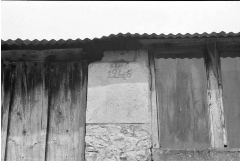
Atelier de fabrication (D) : date portée sur le pilier central du mur sud.

39, La Vieille-Loye C.D. 240, lieudit : le Raigu