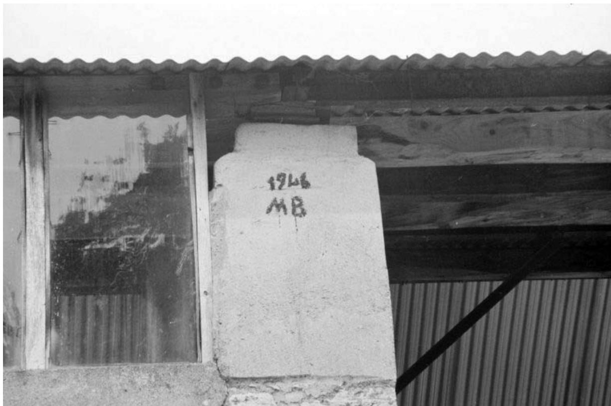
Atelier de fabrication (D) : date portée sur le pilier de l'angle est.

39, La Vieille-Loye C.D. 240, lieudit : le Raigu