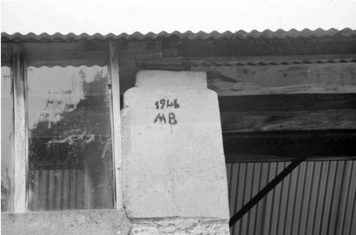
Atelier de fabrication (D) : date portée sur le pilier de l'angle est.

39, La Vieille-Loye C.D. 240, lieudit : le Raigu