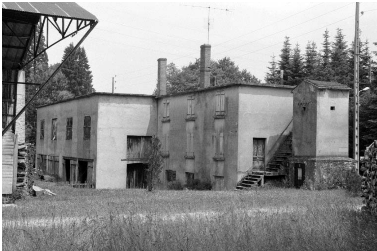
Transformateur (C), logement patronal (B) et atelier de fabrication (A), depuis le sud-ouest. 39, La Vieille-Loye C.D. 240, lieudit : le Raigu