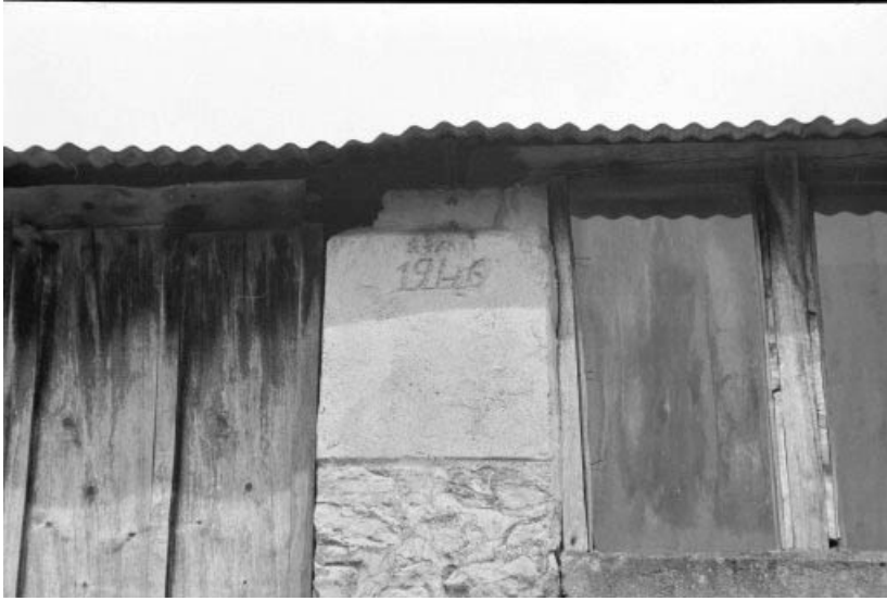
Atelier de fabrication (D) : date portée sur le pilier central du mur sud.

39, La Vieille-Loye C.D. 240, lieudit : le Raigu