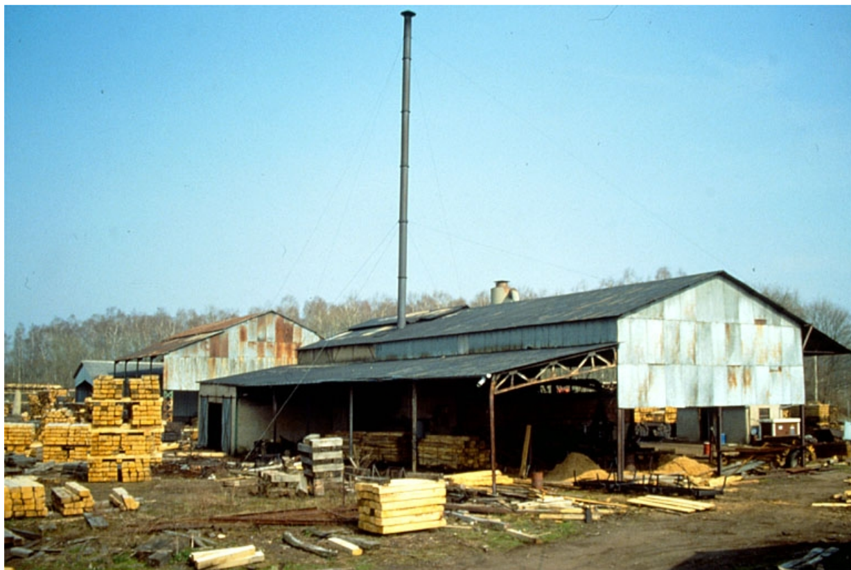
Atelier de créosotage (C) : façades postérieure et latérale gauche.