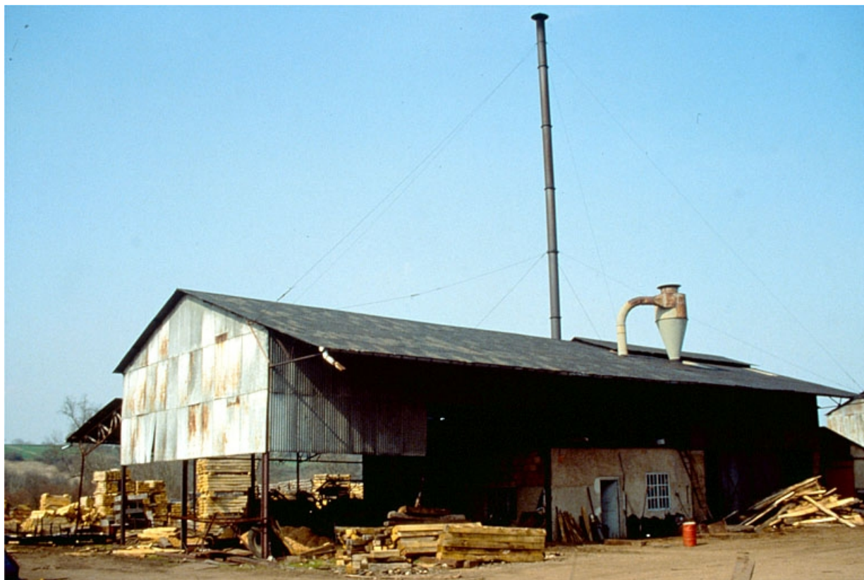
Atelier de créosotage (C) vu de trois quarts gauche.