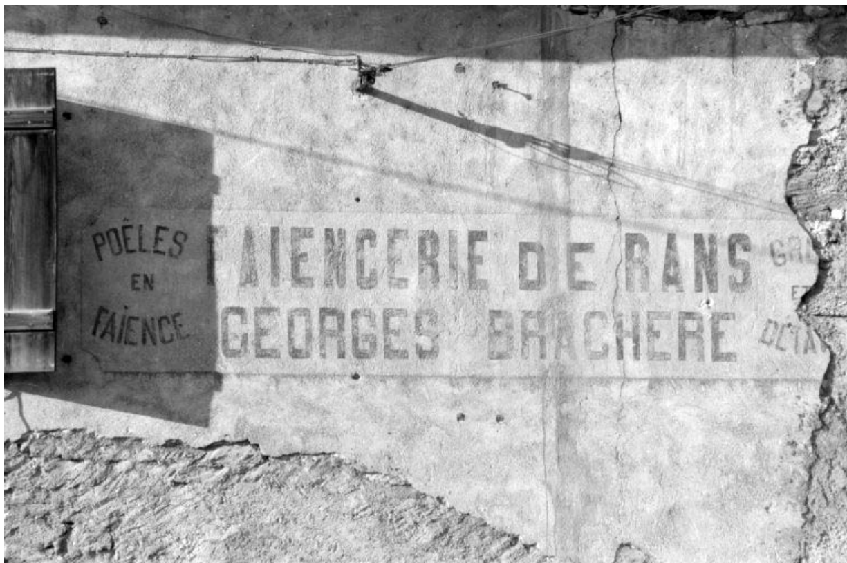
Détail de l'inscription peinte en façade.