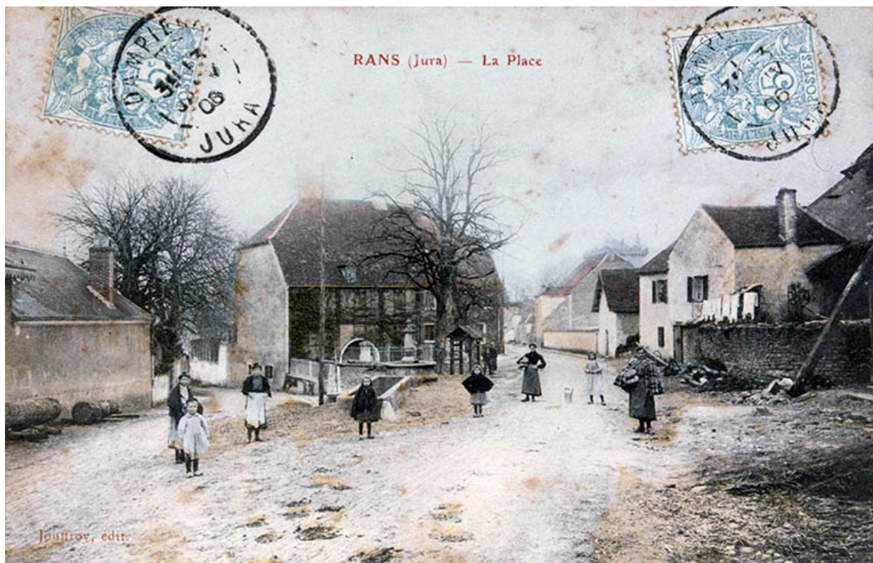
Rans (Jura) - La Place.