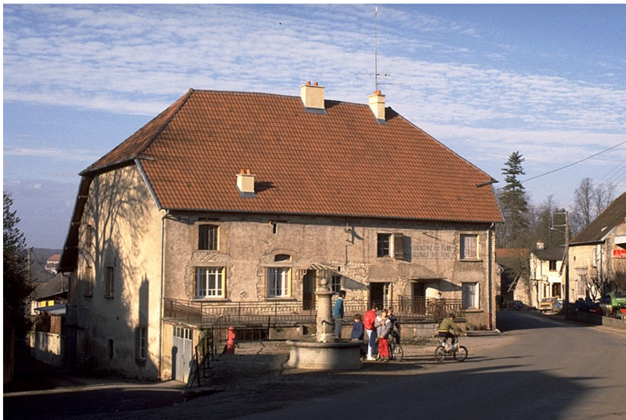
Maison (autrefois atelier de fabrication, pièce de séchage et logement patronal), vue de trois quarts gauche. 39, Rans