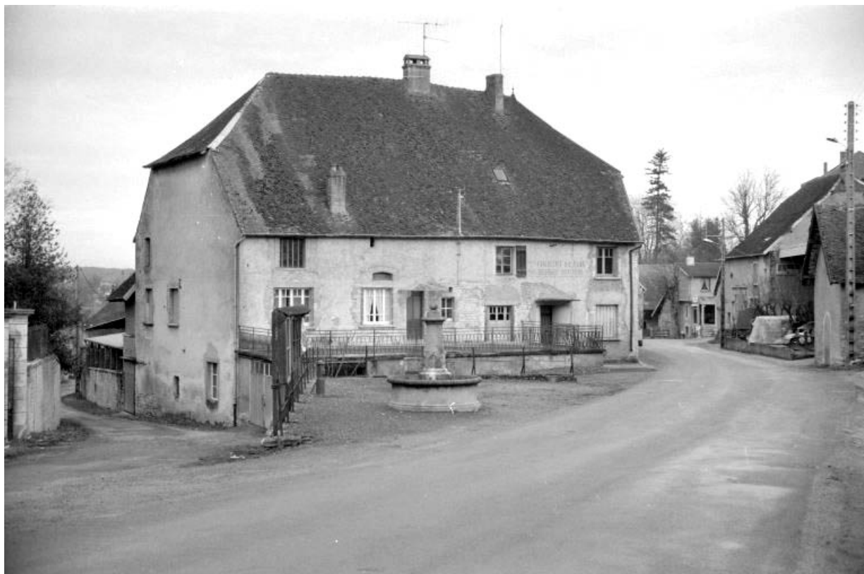
Maison (autrefois atelier de fabrication, pièce de séchage et logement patronal), vue de trois quarts gauche. 39, Rans