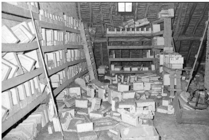
Moules de fabrication (dans l'étage de comble de la maison).