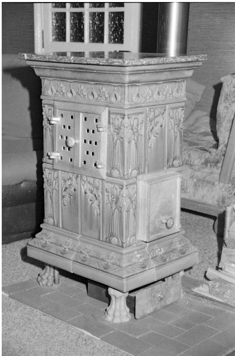
Poêle fabriqué par la faïencerie.