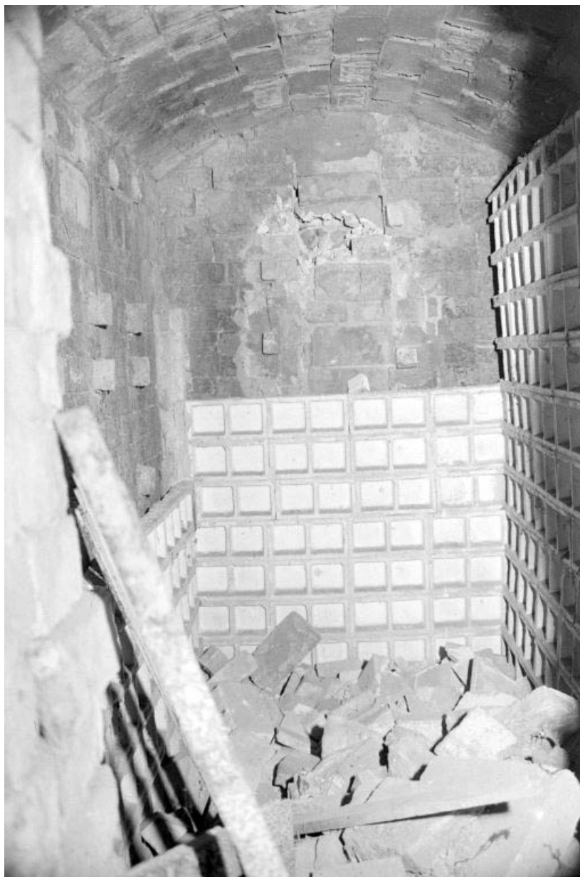
Intérieur du four : le mouflage.