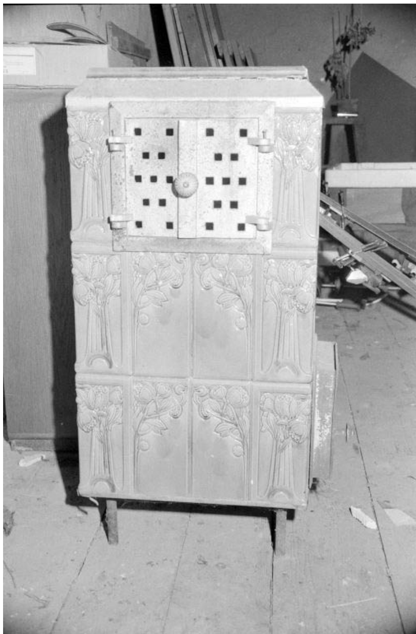
Poêle fabriqué par la faïencerie (exemplaire incomplet). 39, Rans