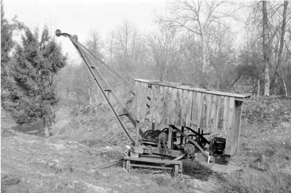
Grue sur voie étroite dans l'ancienne carrière.