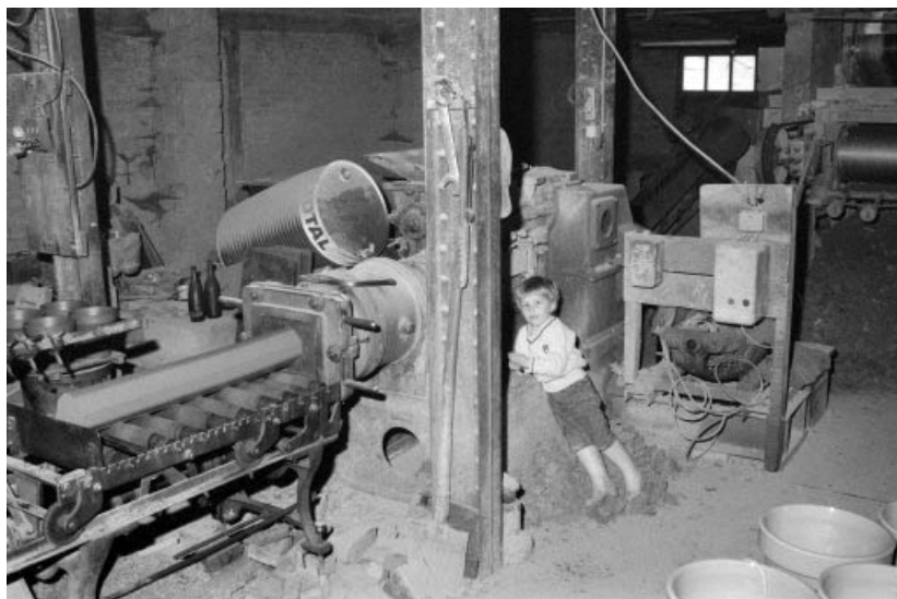
Boudineuse SOLIERE (2).