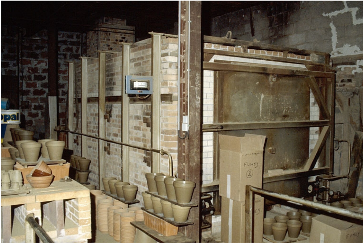
Four au fuel à flamme renversée (10).