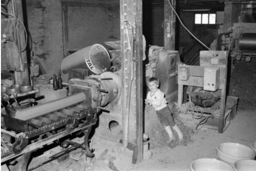
Boudineuse SOLIERE (2).