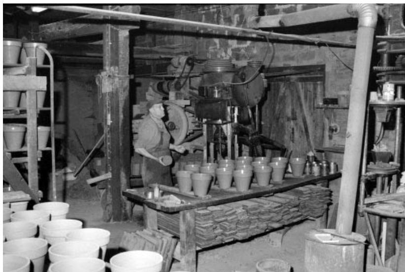
Fabrication des pots de fleur par M. Martin.