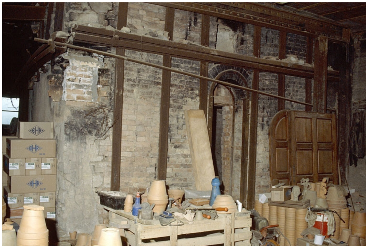
Four au bois à flamme directe (1).