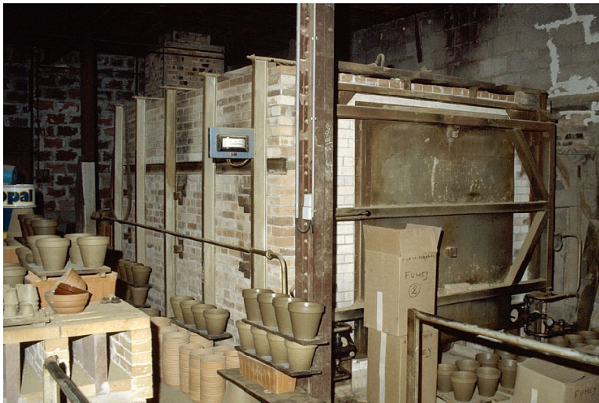
Four au fuel à flamme renversée (10). 39, Étrepigny rue Haute