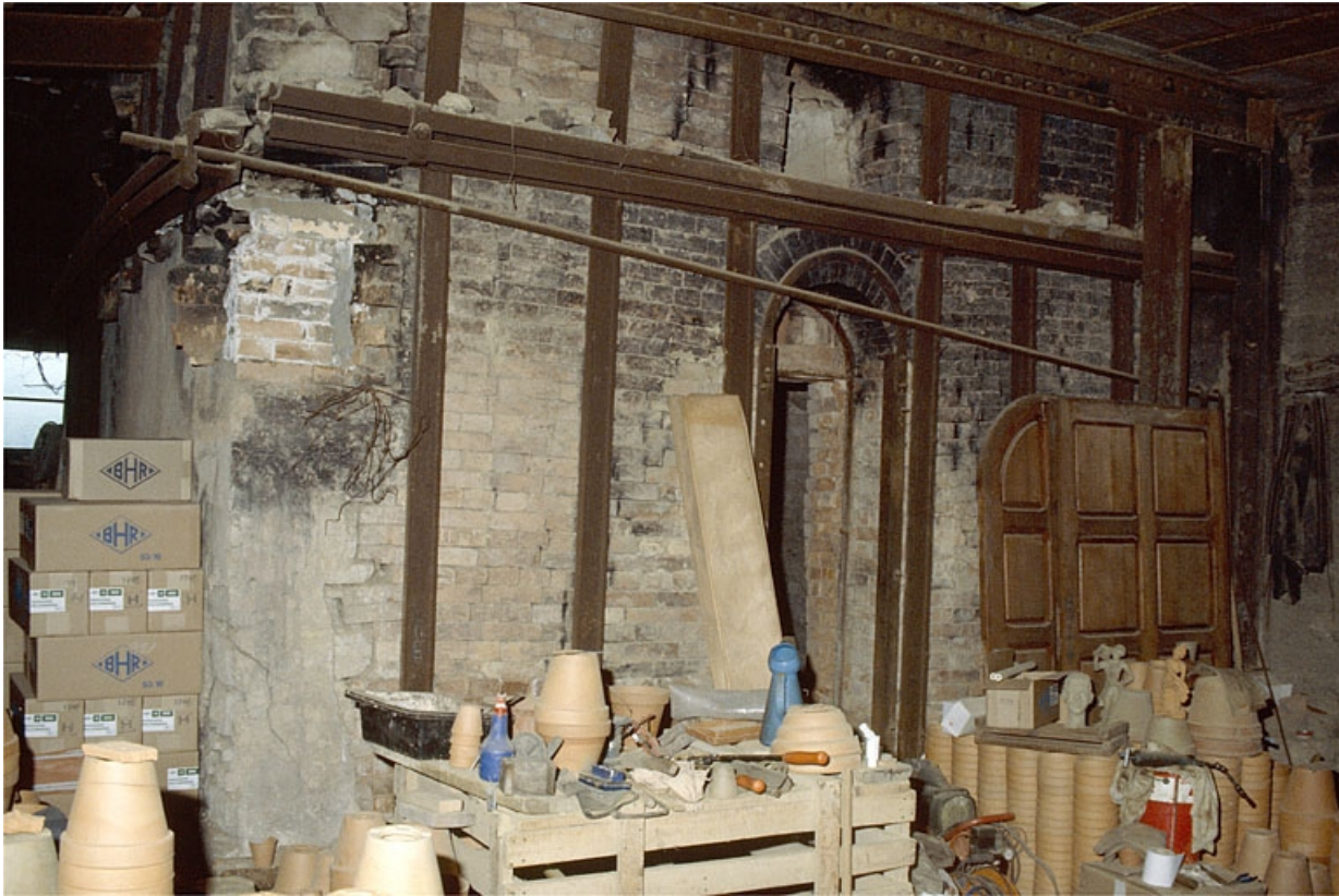
Four au bois à flamme directe (1).