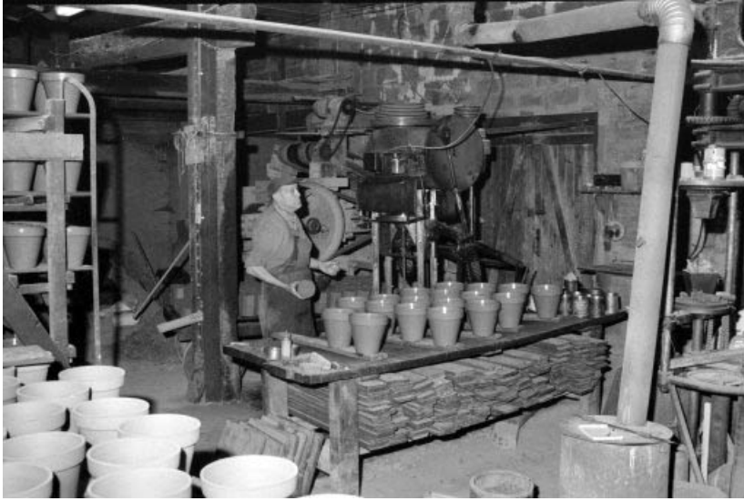
Fabrication des pots de fleur par M. Martin.