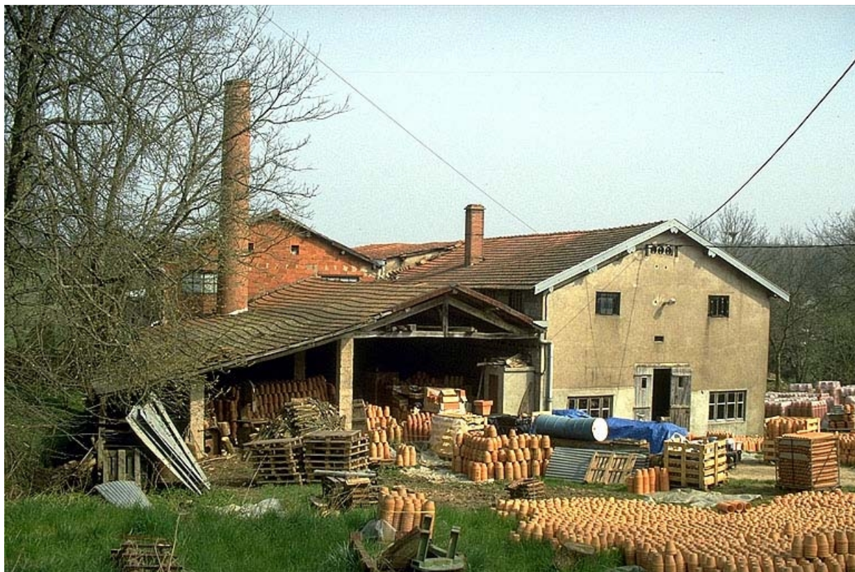
Vue d'ensemble depuis le nord-ouest.