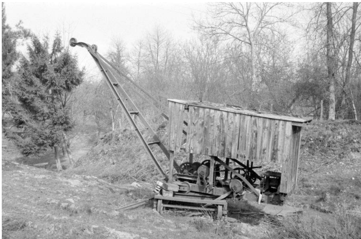
Grue sur voie étroite dans l'ancienne carrière.