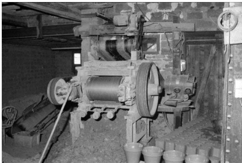
Broyeur UNICERAM (5). A droite, pâtons au sortir de la boudineuse et avant moulage. 39, Étrepigny rue Haute