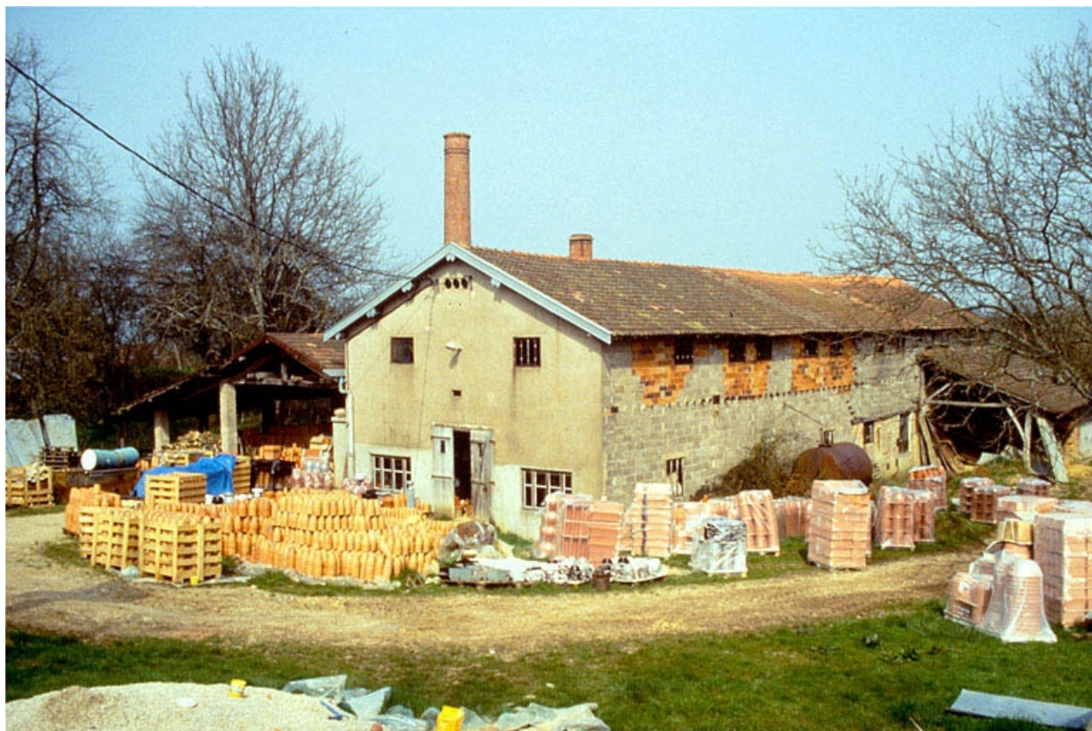
Façades antérieure et latérale droite.