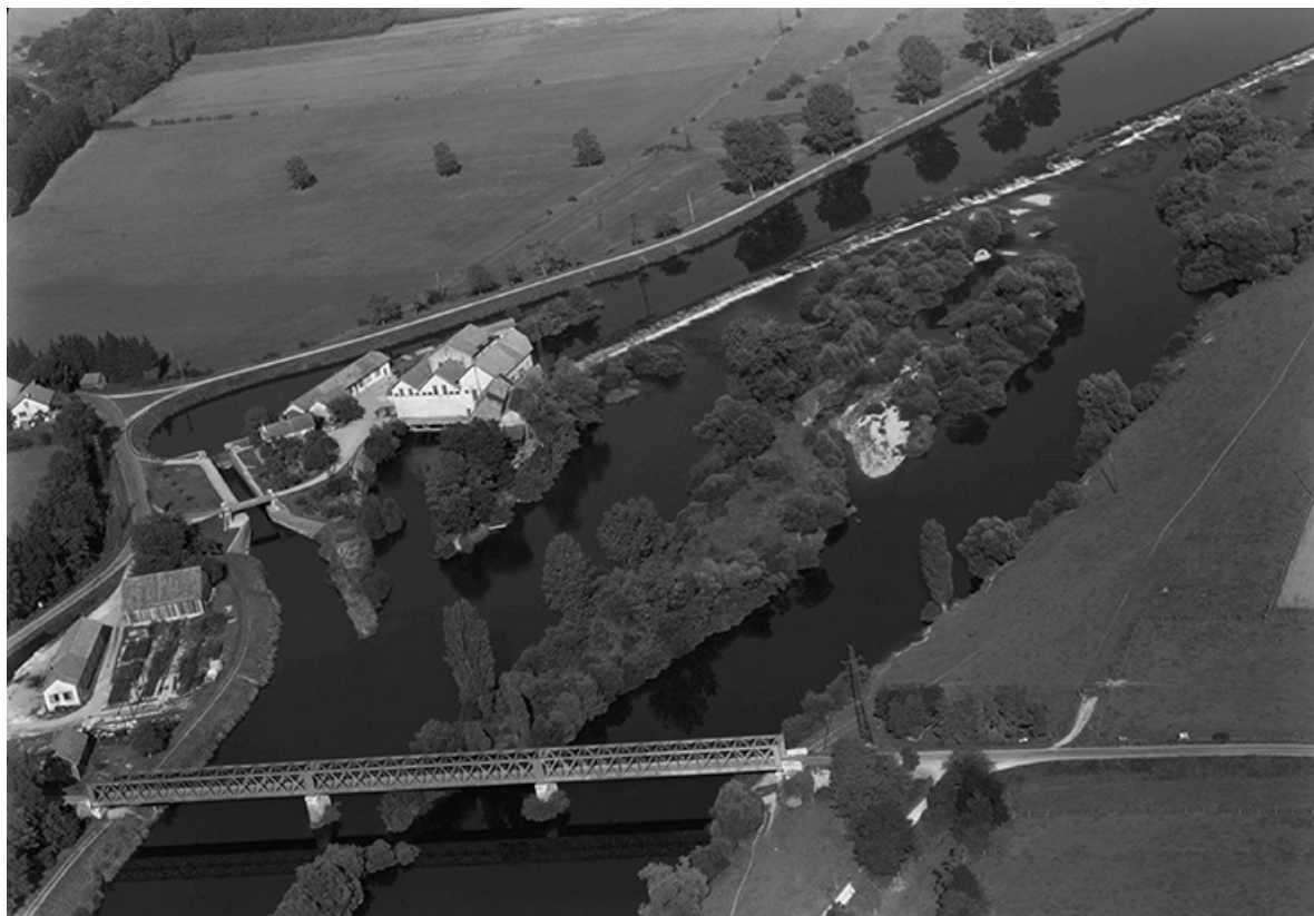
Vue aérienne en 1956.