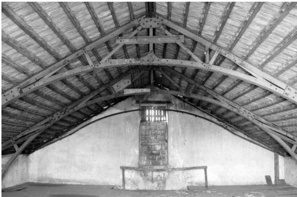
Ancien atelier de fabrication (b2), étage en surcroît : détail de la charpente et mur pignon ouest. 39, Salans, lieudit : le Moulin du Pré