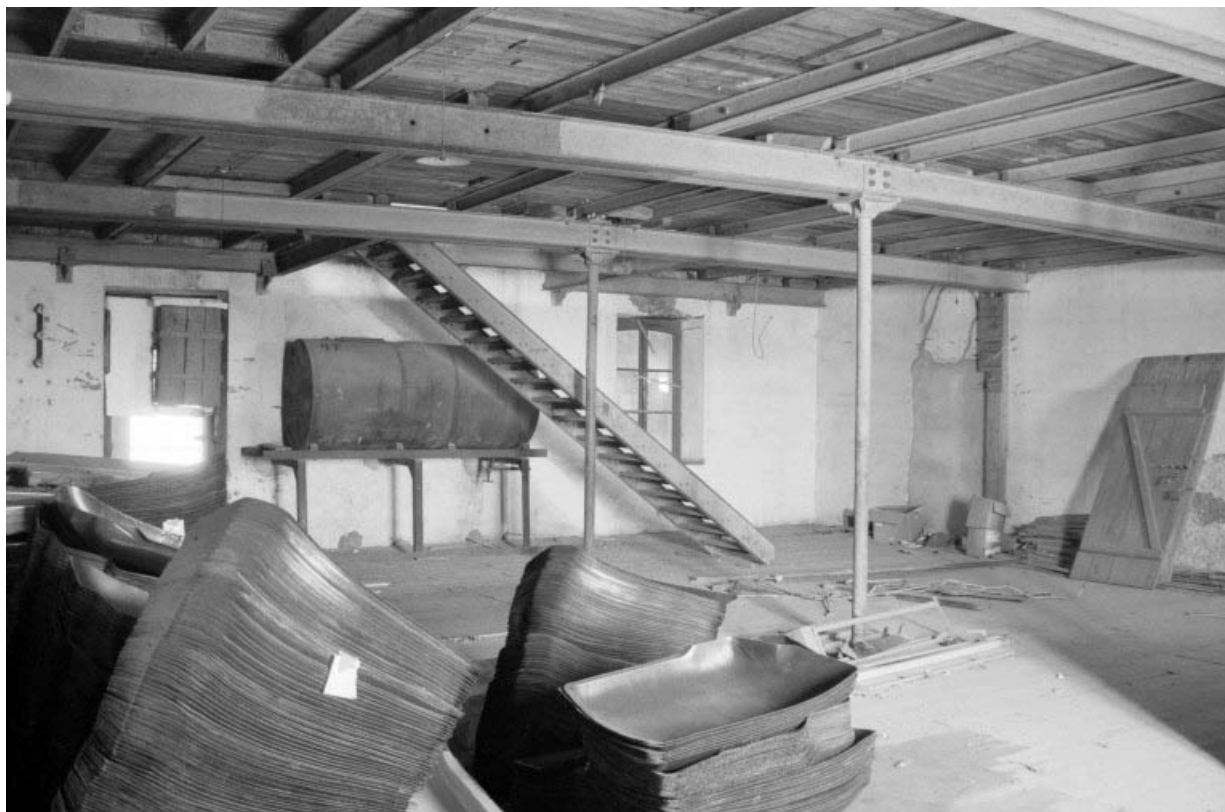
Ancien atelier de fabrication (b2) : pièce au 2e étage.