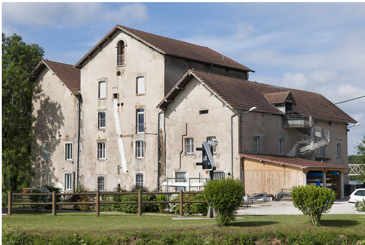
Murs-pignons est vus de trois quarts droite.