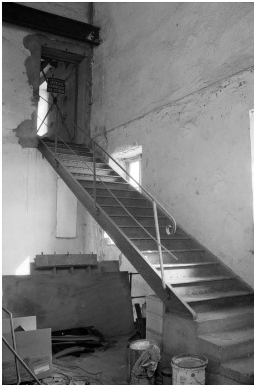
Salle des machines à vapeur (b3) : escalier.