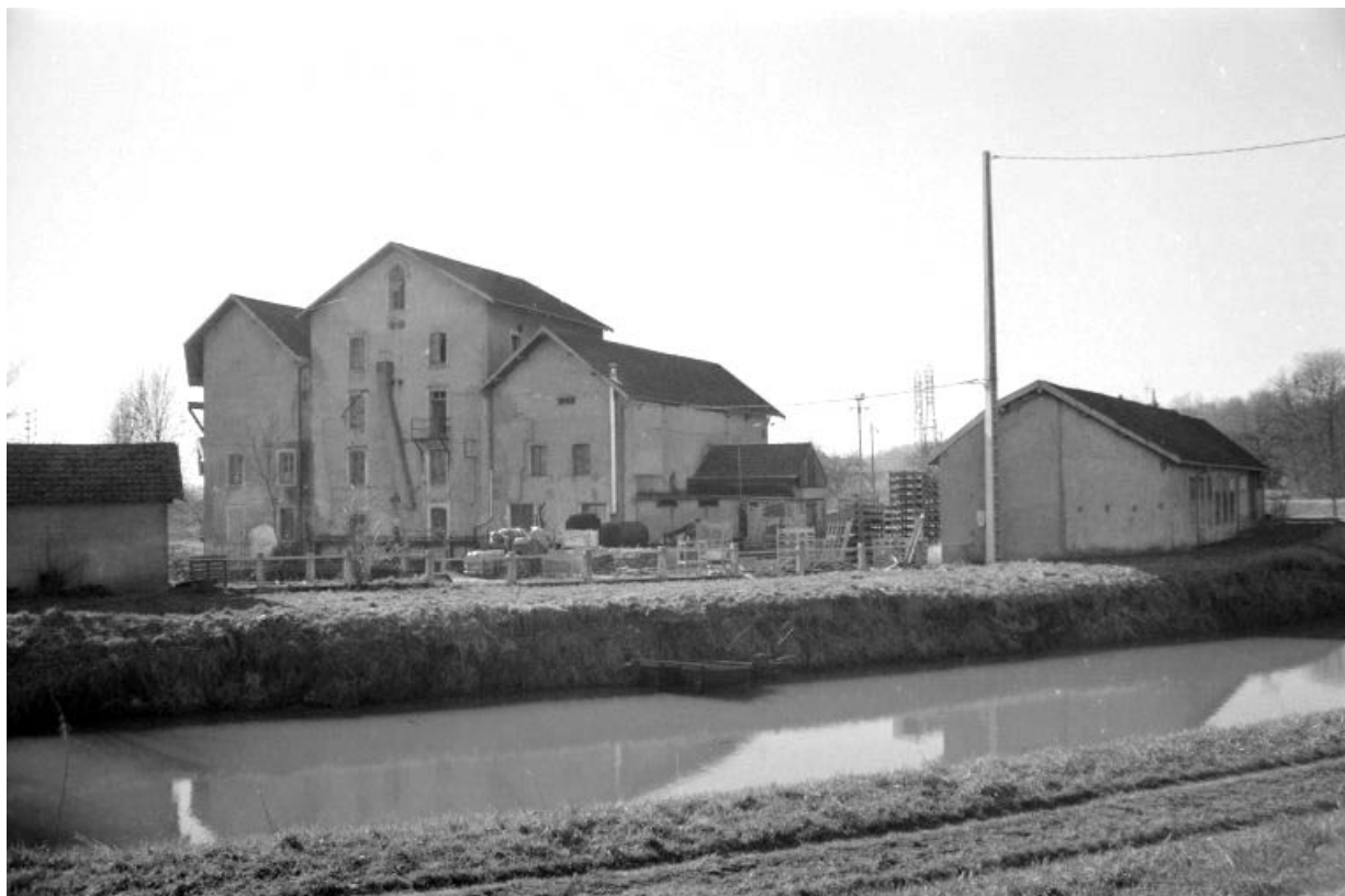
Vue d'ensemble depuis le nord-est : centrale et laboratoire.