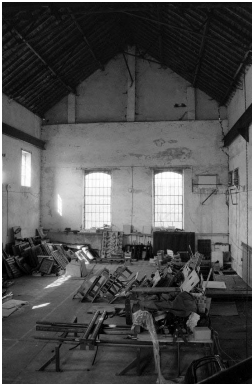
Salle des machines à vapeur (b3) : intérieur (vaisseau).