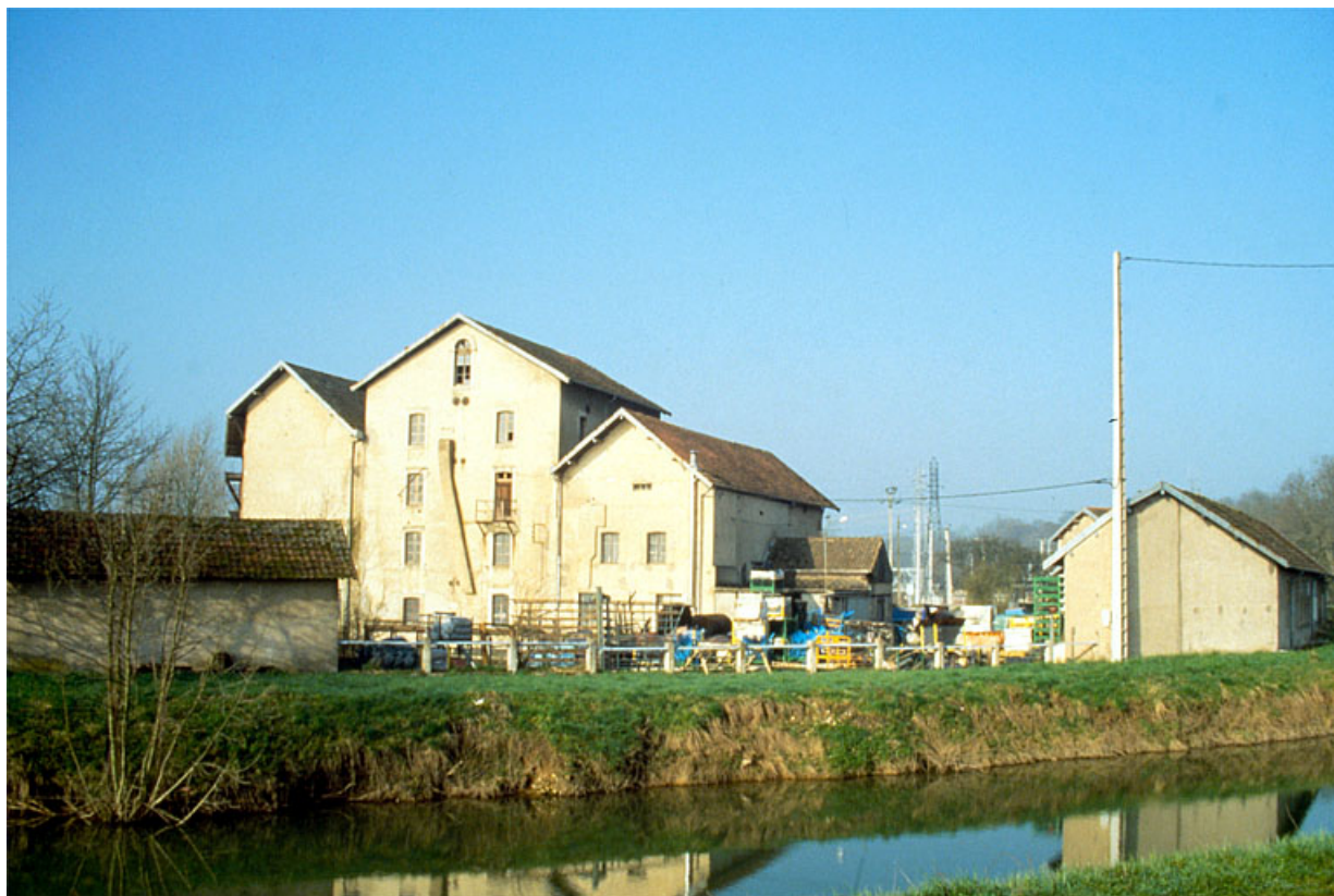
Vue d'ensemble depuis le nord-est : centrale et laboratoire.