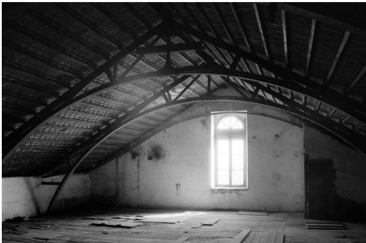
Ancien atelier de fabrication (b2), étage en surcroît : détail de la charpente et mur pignon est.