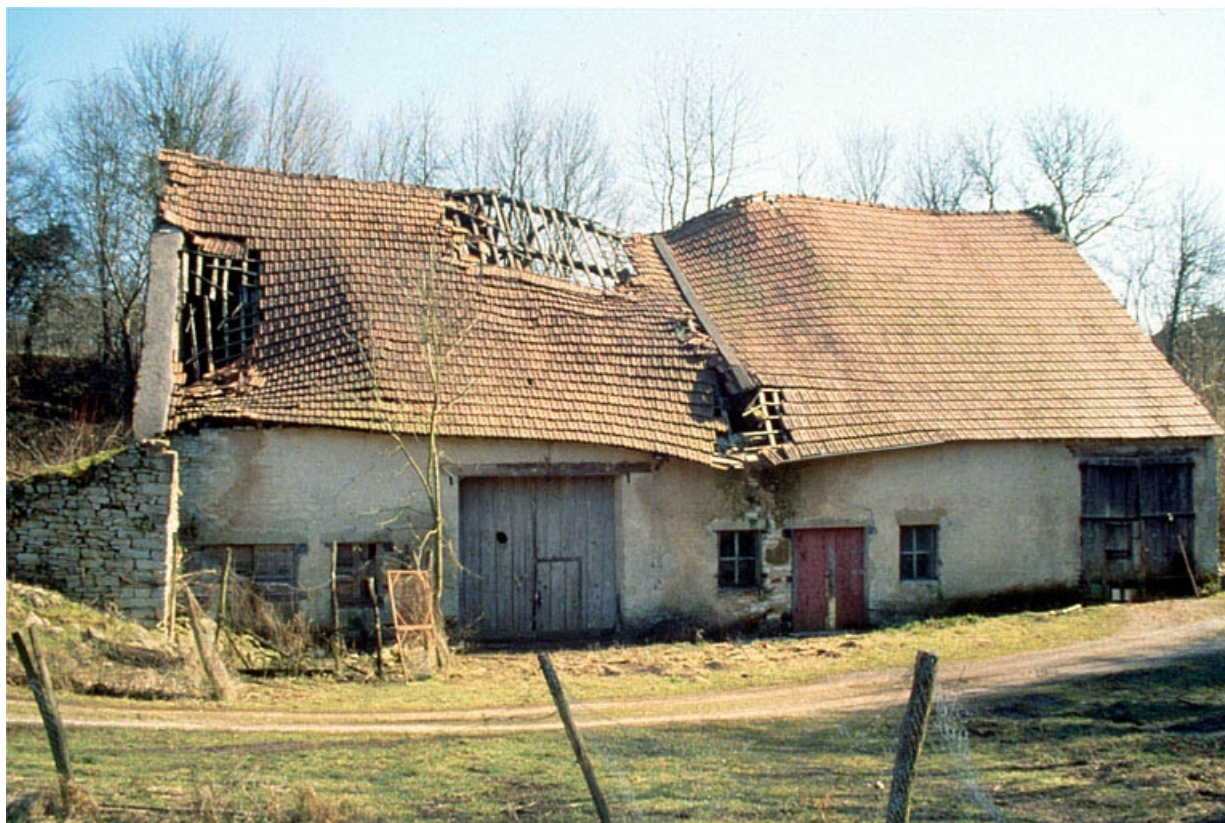
Façade antérieure de l'ancienne halle à charbon.

39, Dampierre, 1 chemin du Patouillet, lieudit : les Minerais