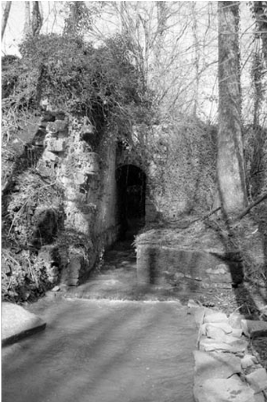
Coursière au débouché du bassin de retenue.

39, Dampierre, 1 chemin du Patouillet, lieudit : les Minerais