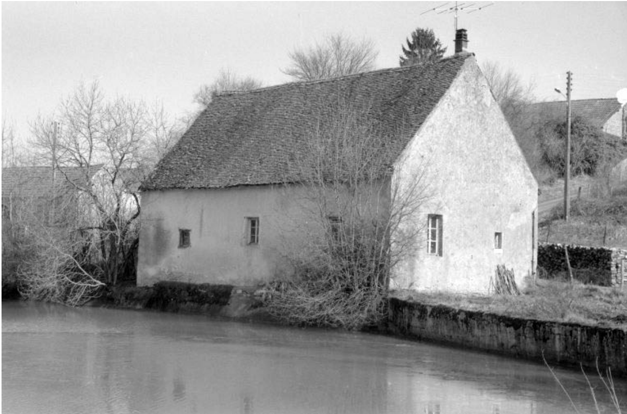
Façades postérieure et latérale gauche du logement.

39, Dampierre, 1 chemin du Patouillet, lieudit : les Minerais