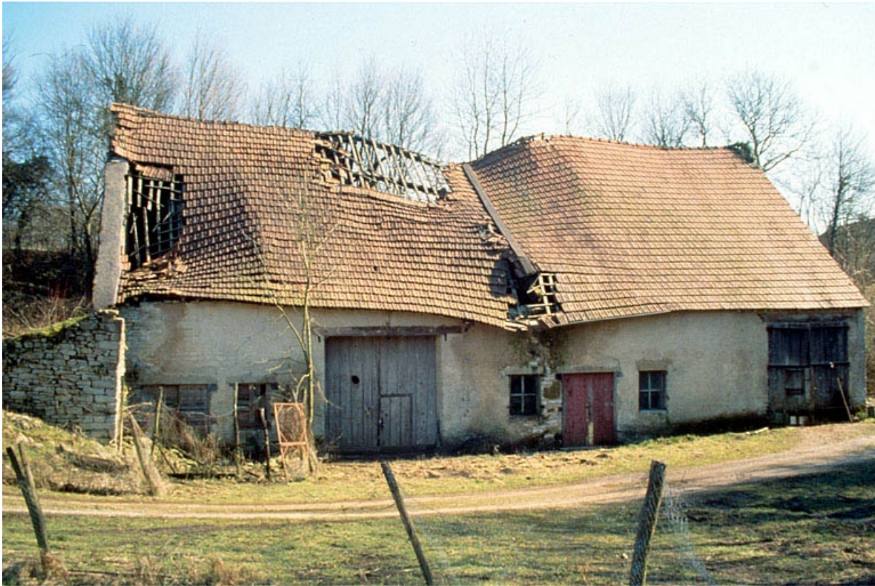
Façade antérieure de l'ancienne halle à charbon.

39, Dampierre, 1 chemin du Patouillet, lieudit : les Minerais