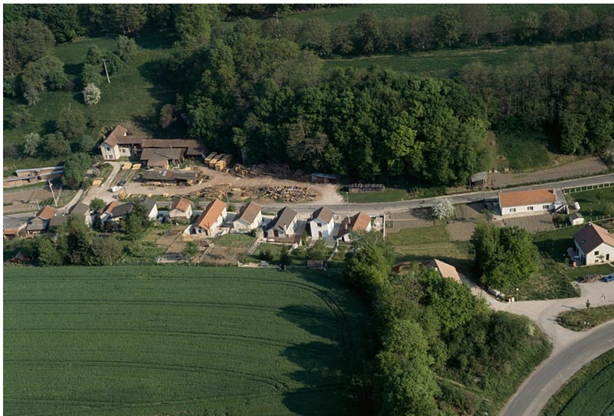
Vue d'ensemble depuis le sud, photographie aérienne.