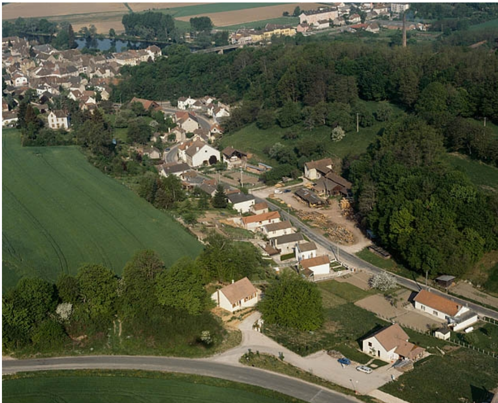
Vue d'ensemble depuis l'est, photographie aérienne.