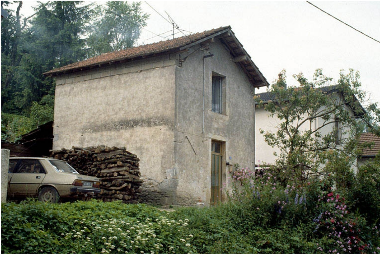
Maison n° 36, rue de Salans vue de trois quarts gauche.