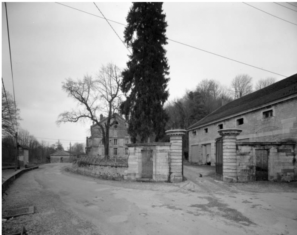
Vue d'ensemble depuis le village.

39, Fraisans, 14, 16 rue de la Vieille Forge