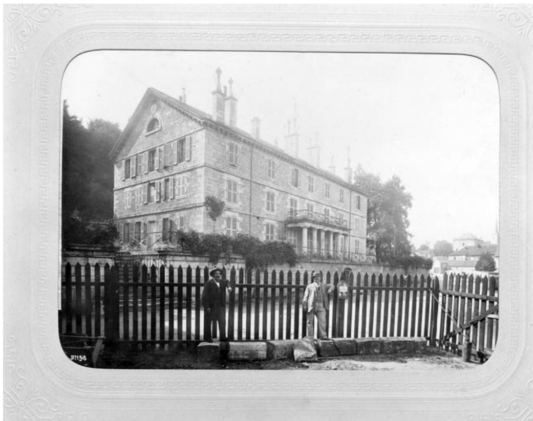
La Gérance vue de trois quarts gauche, à la fin du 19e siècle.

39, Fraisans, 14, 16 rue de la Vieille Forge