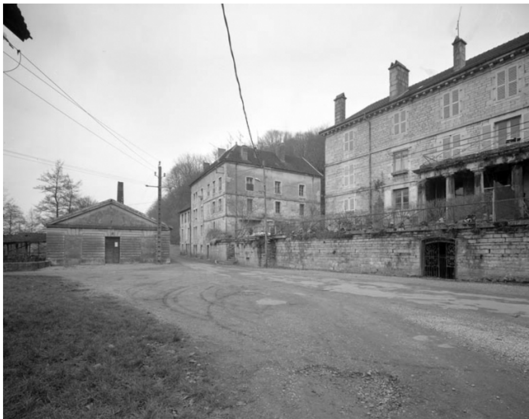
Vue d'ensemble : Sénat, logement de contremaître et Gérance.

39, Fraisans, 14, 16 rue de la Vieille Forge