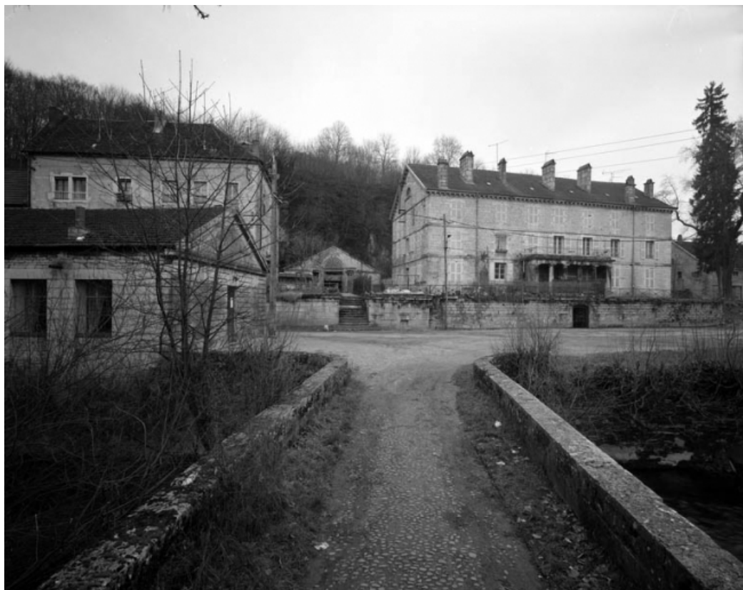
Vue d'ensemble depuis l'îlot.

39, Fraisans, 14, 16 rue de la Vieille Forge