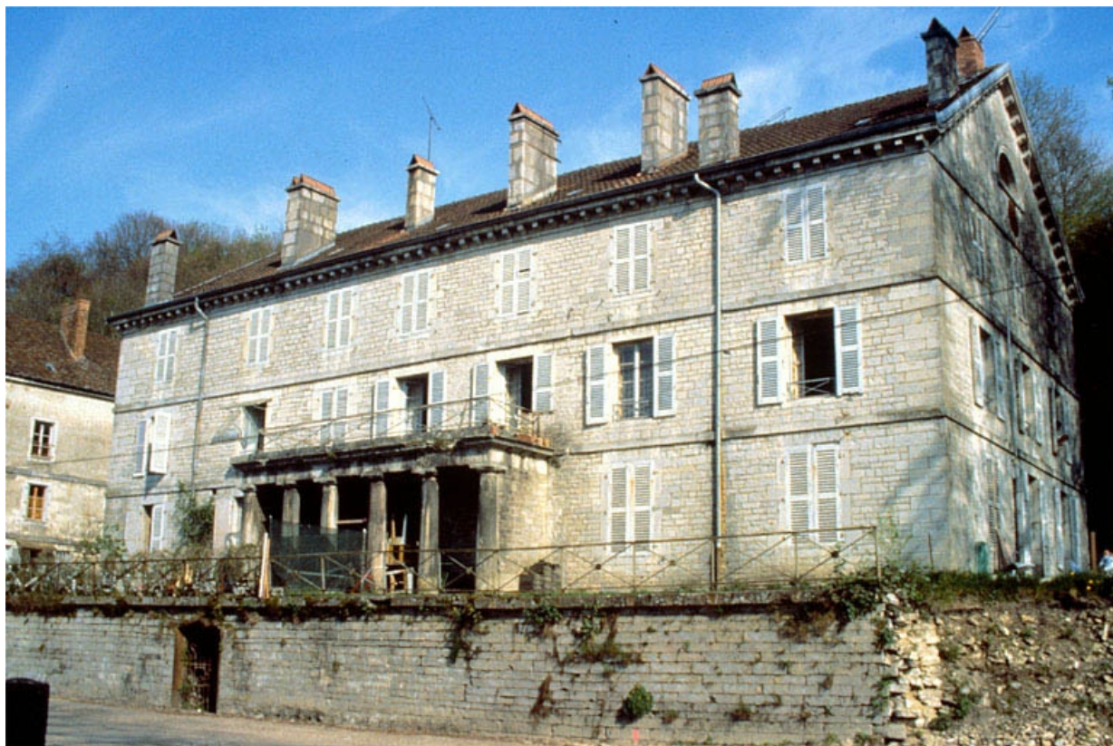
La Gérance vue de trois quarts droit.

39, Fraisans, 14, 16 rue de la Vieille Forge