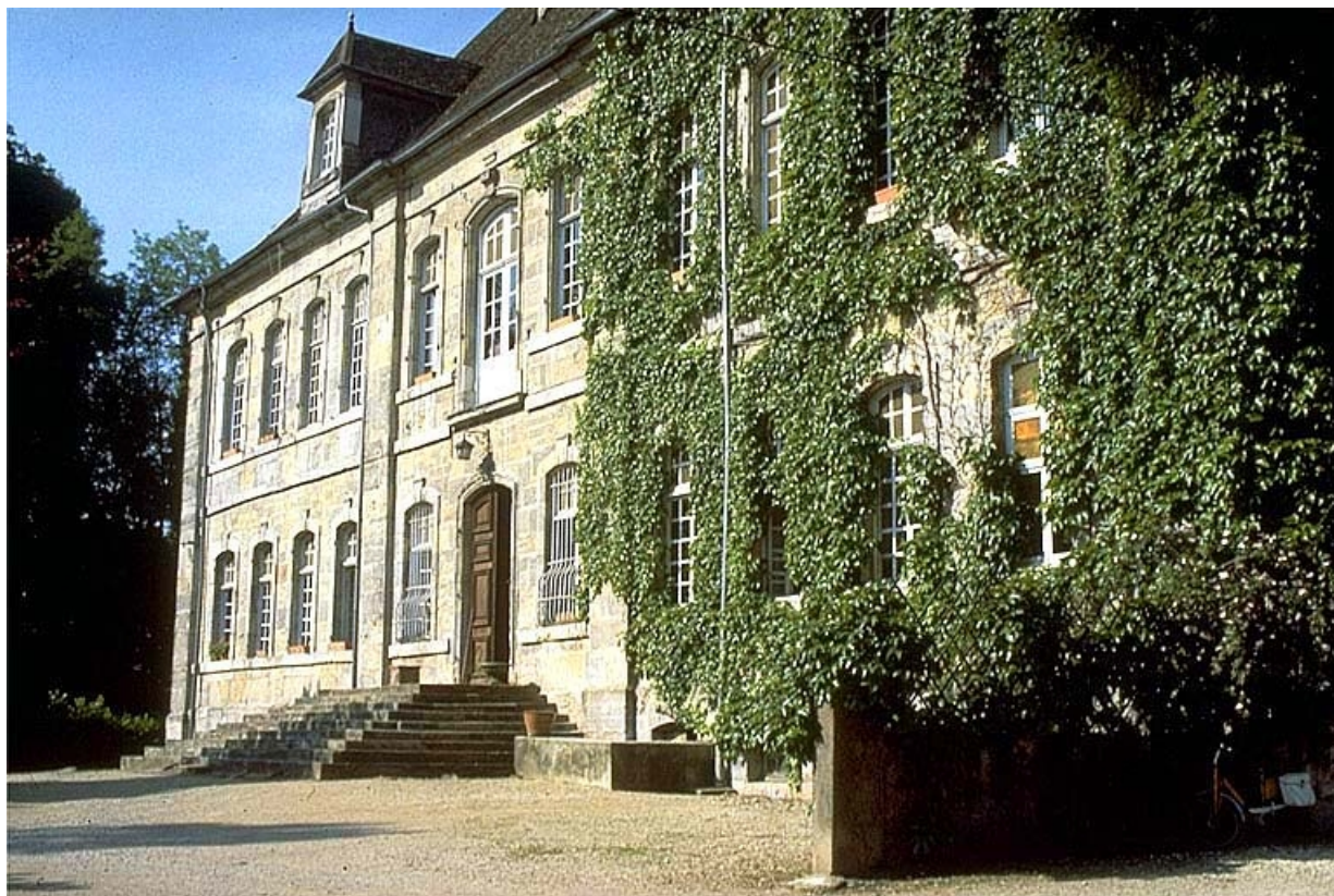
Façade antérieure du logement patronal, vue de trois quarts droit.