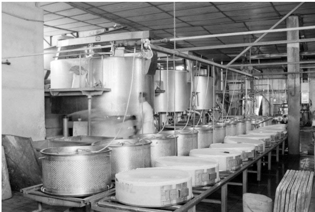
Intérieur de l'atelier de fabrication, à l'étage. Presses au premier plan, 3 cuves de 8000 l. à gauche. 39, Rouffange rue de la Fontaine