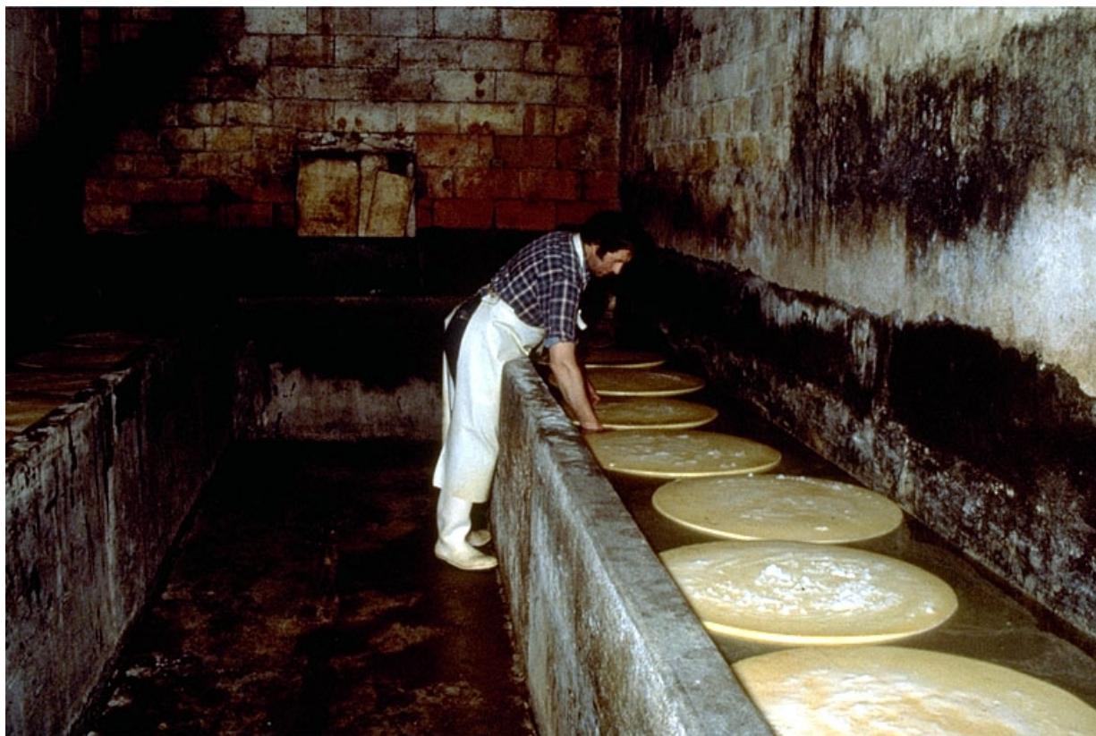
Intérieur d'une cave à saumure, au rez-de-chaussée.