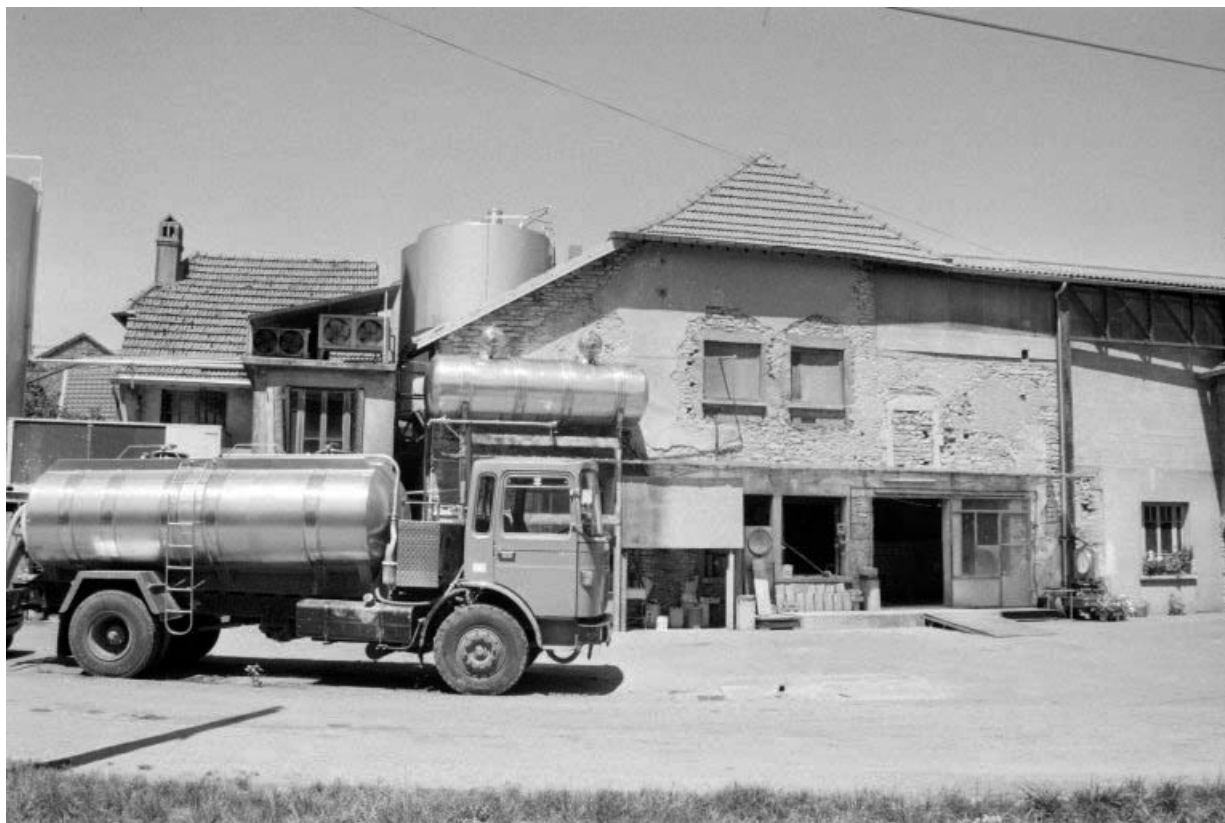
Façade antérieure de l'atelier de fabrication.