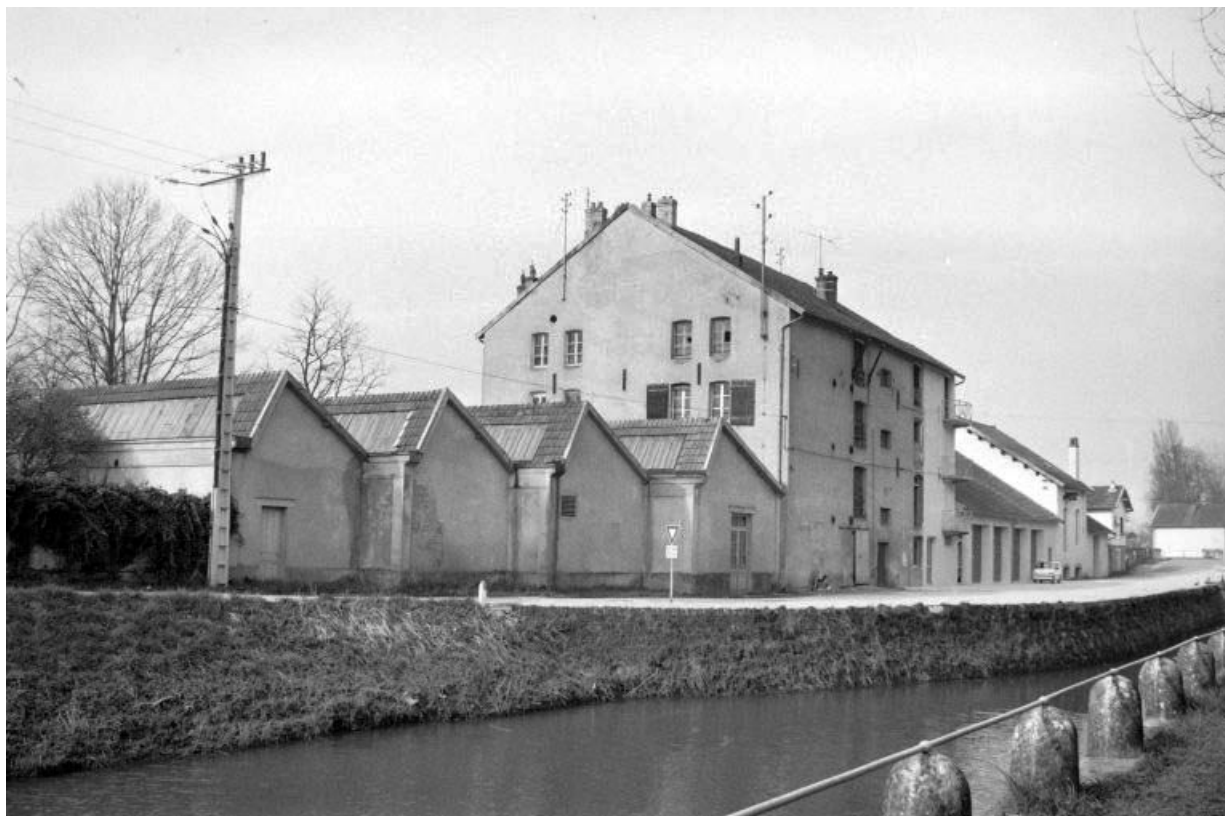
Façade antérieure vue de l'est.