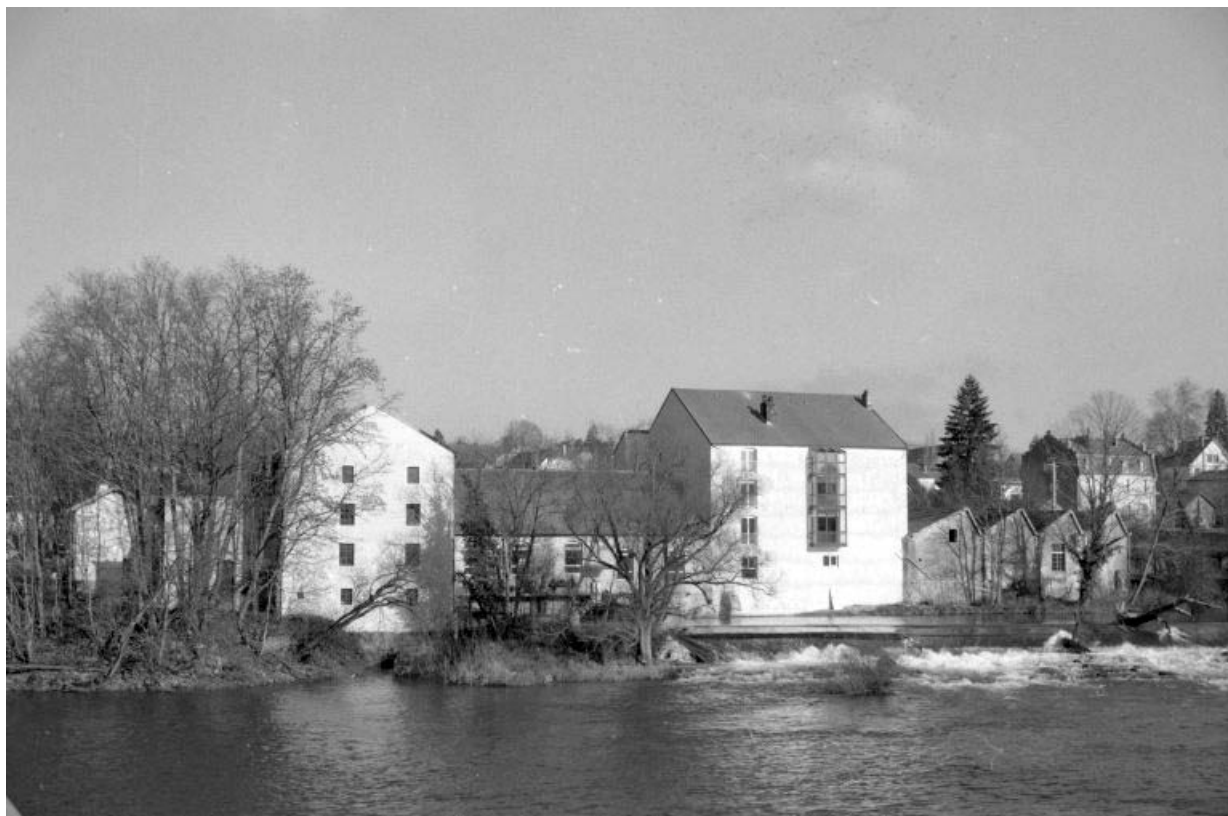
Vue d'ensemble depuis le sud, en 1990.