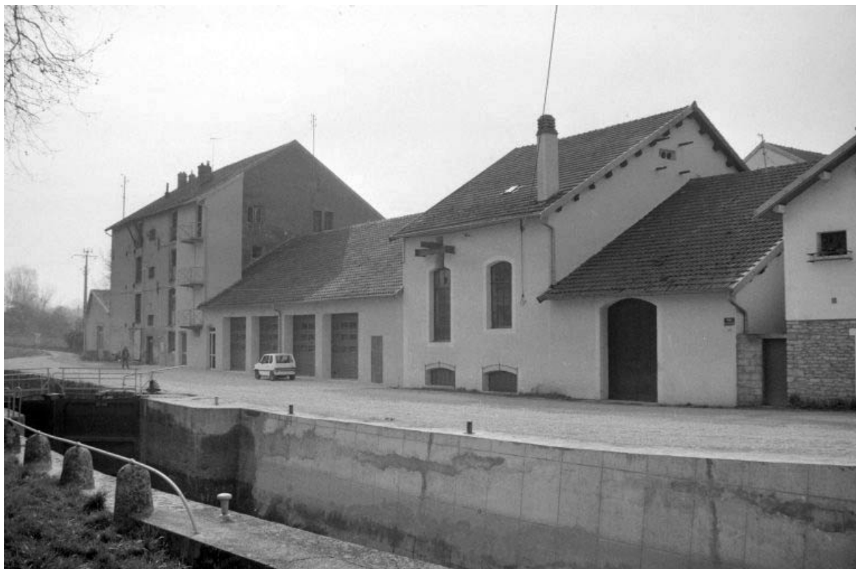
Façade antérieure vue de l'ouest.