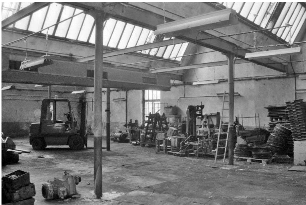
Vue intérieure des ateliers couverts en shed.