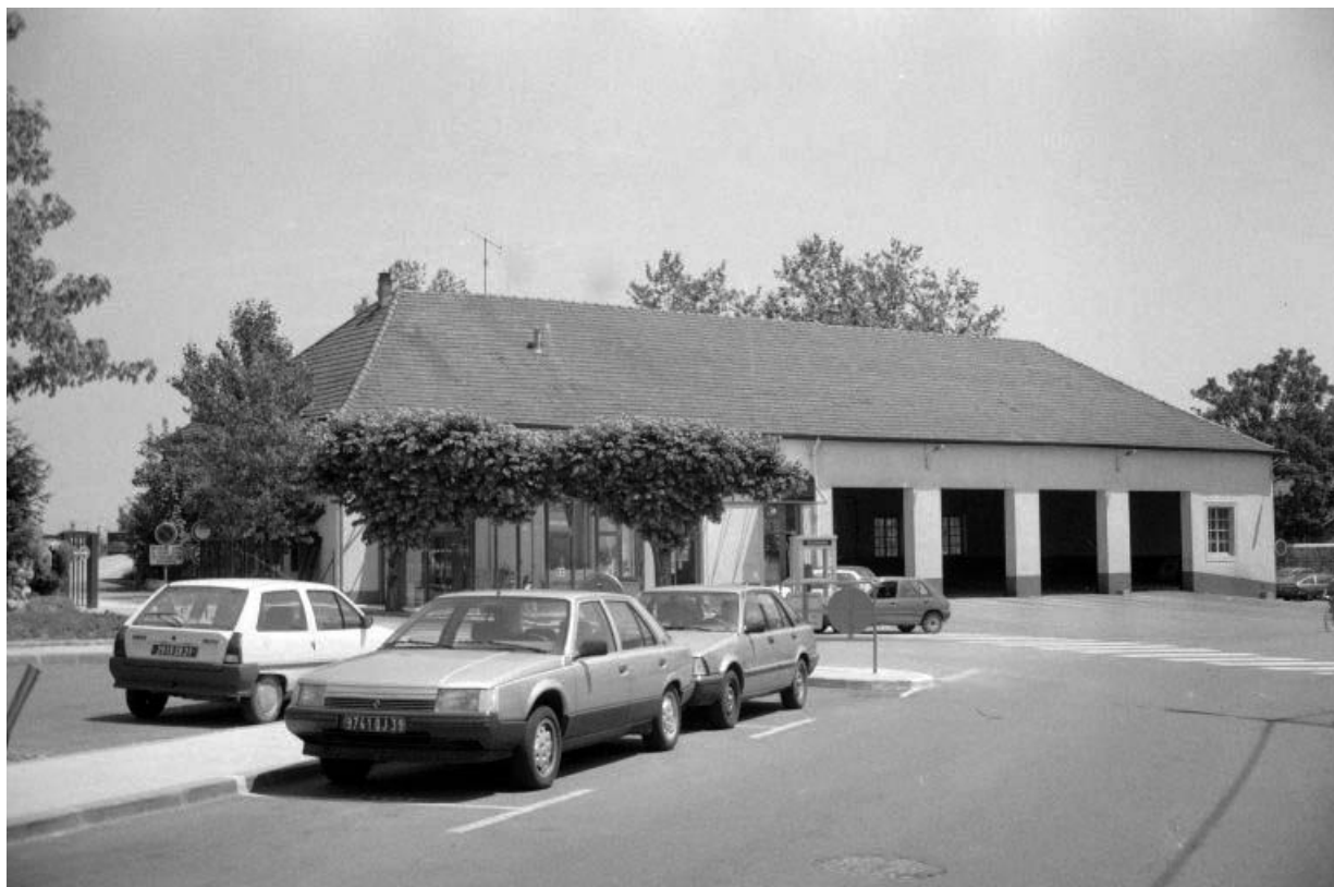
Vue d'ensemble depuis le jardin, au nord.