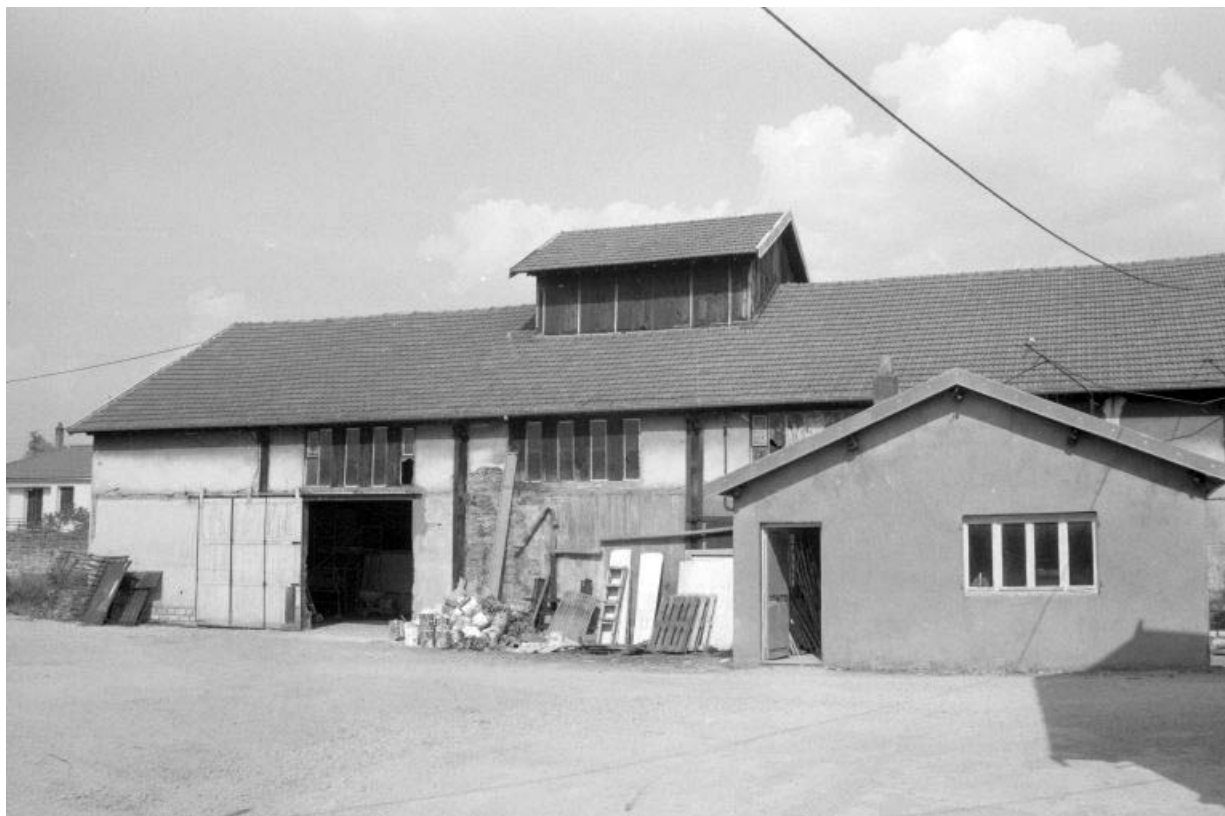
Façade antérieure de l'atelier de fabrication et du bureau (G).