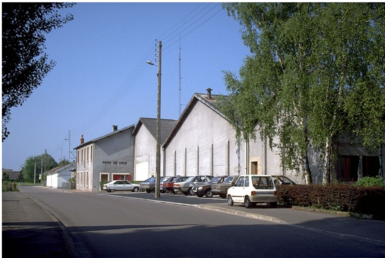
Façade antérieure vue de l'est.