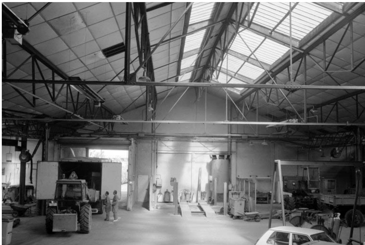
Intérieur de l'atelier de fabrication.