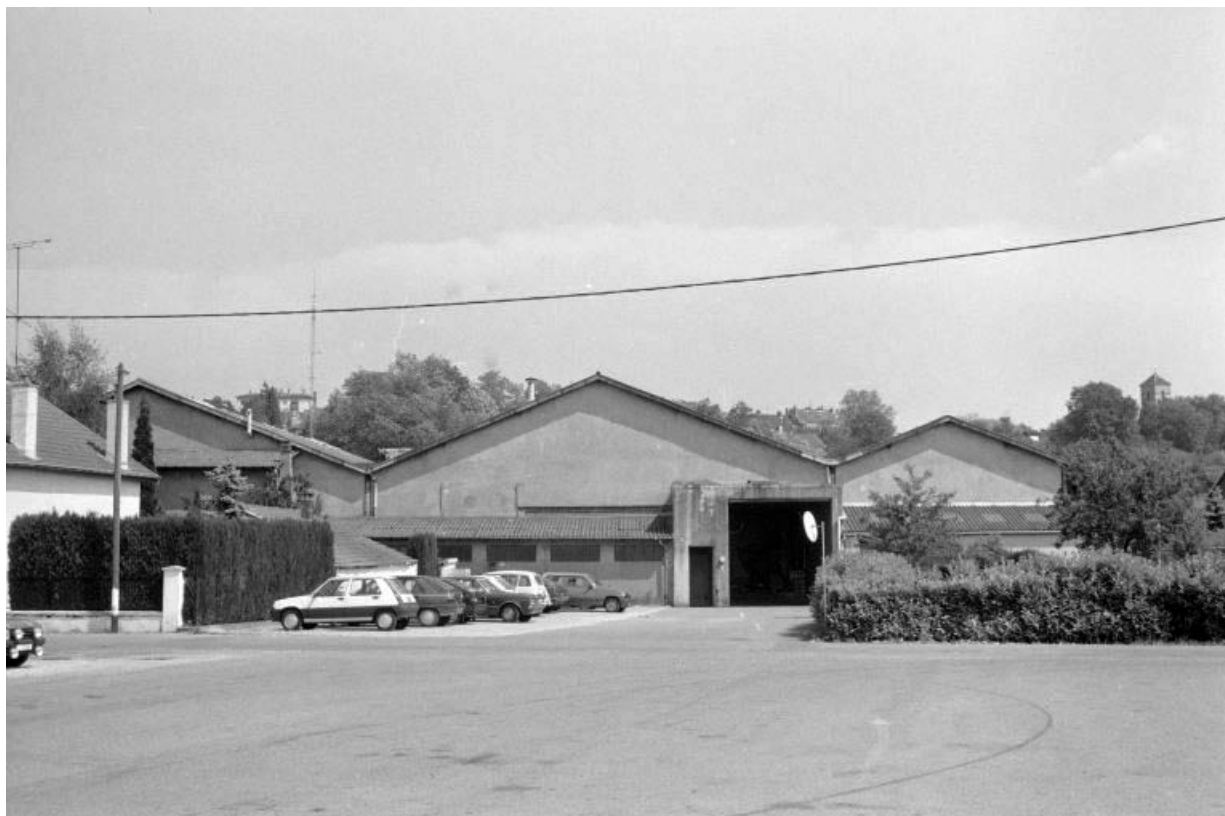
Façade postérieure vue de l'ouest.