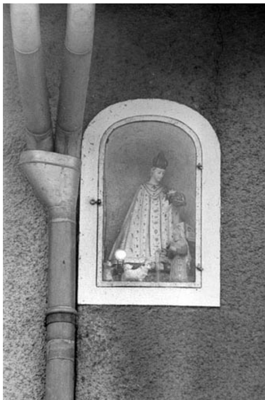
Statuette de la Vierge, sur la façade latérale gauche. 39, Ranchot 2e briqueterie