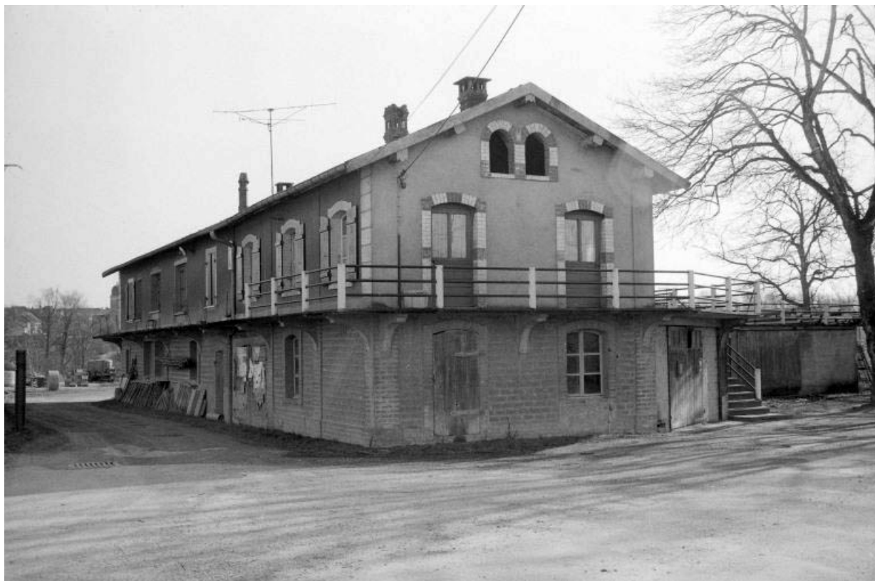
Façades antérieure et latérale gauche vues du nord.