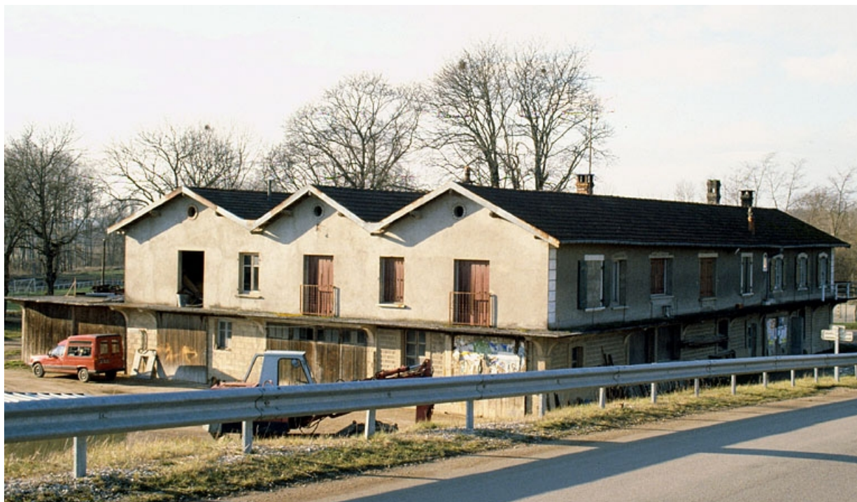
Façades postérieure et latérale gauche vues de l'est.