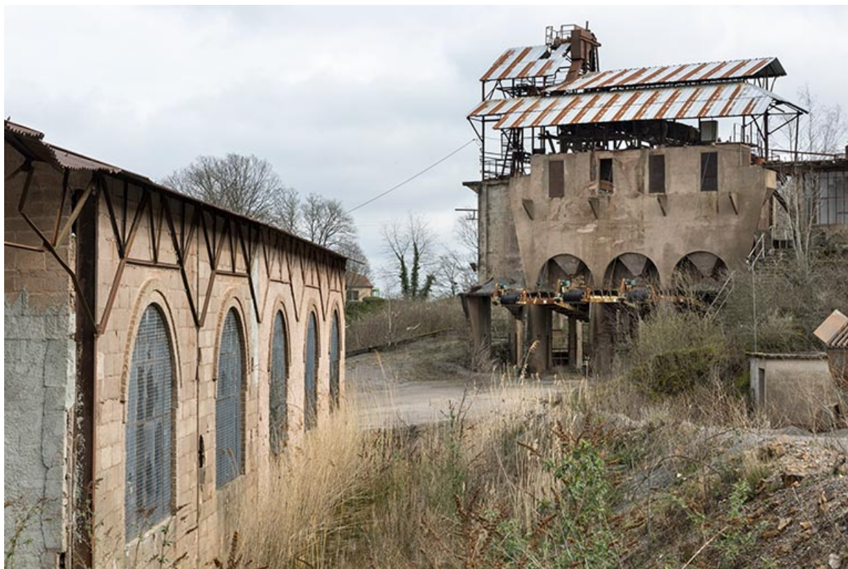
Poste de lavage (C), depuis le hangar (G). 39, Moisey, lieudit : Bois de la Serre