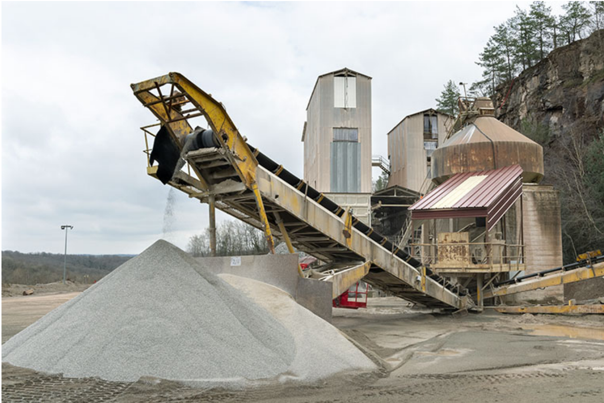
Nouvelles installations : poste de concassage et tapis roulant.