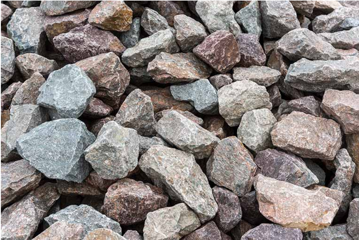
Carrière : roche concassée.