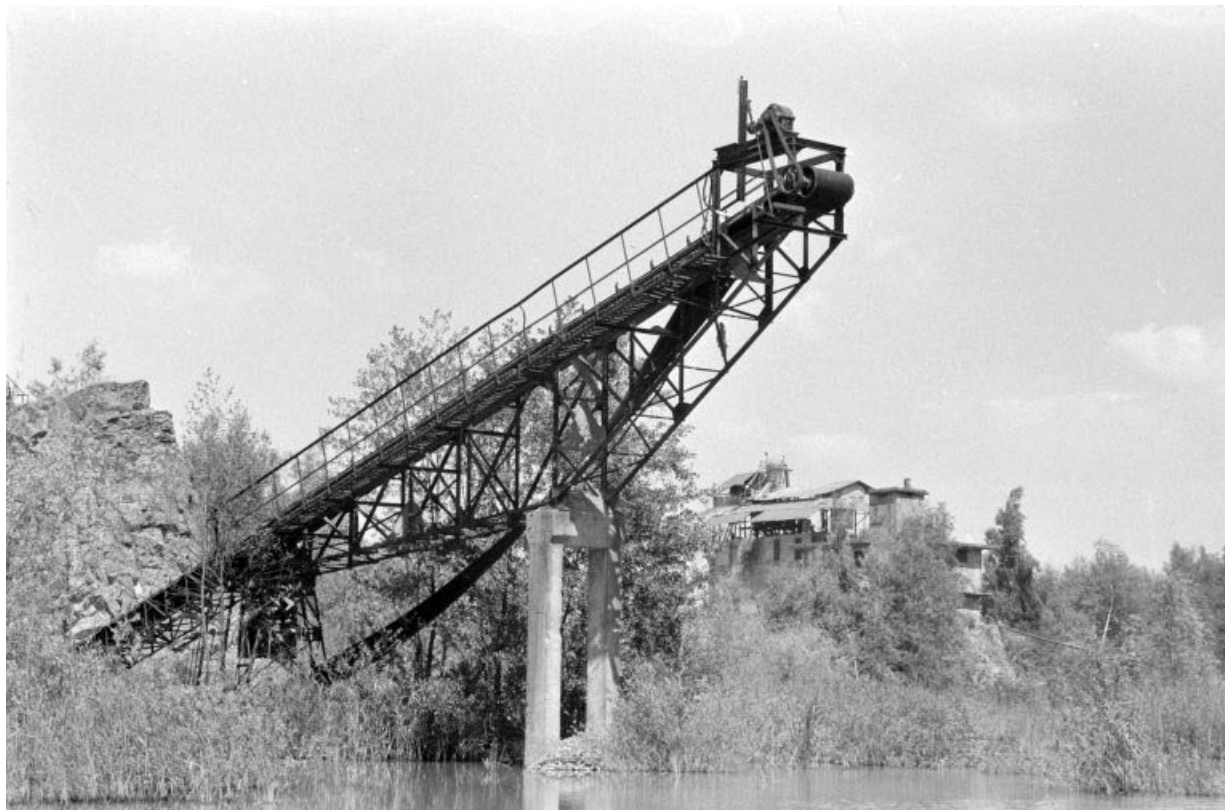
Anciennes installations vues de l'ouest : le transporteur.