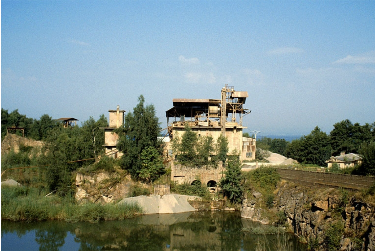
Vue d'ensemble, depuis l'est. Etang au premier plan, poste de lavage (C) au centre, bureau (A) à droite, anciennes installations à gauche.