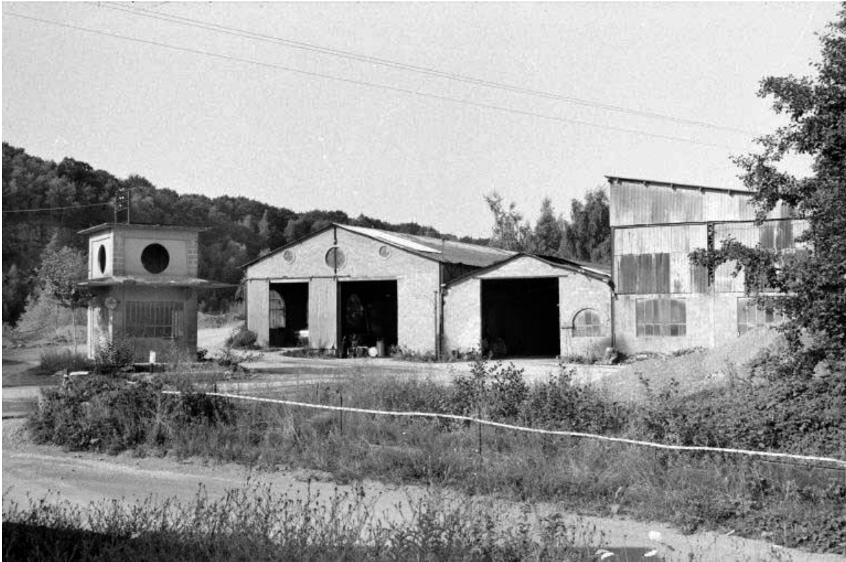
Ancien bâtiment de la bascule (E) et hangar (G).