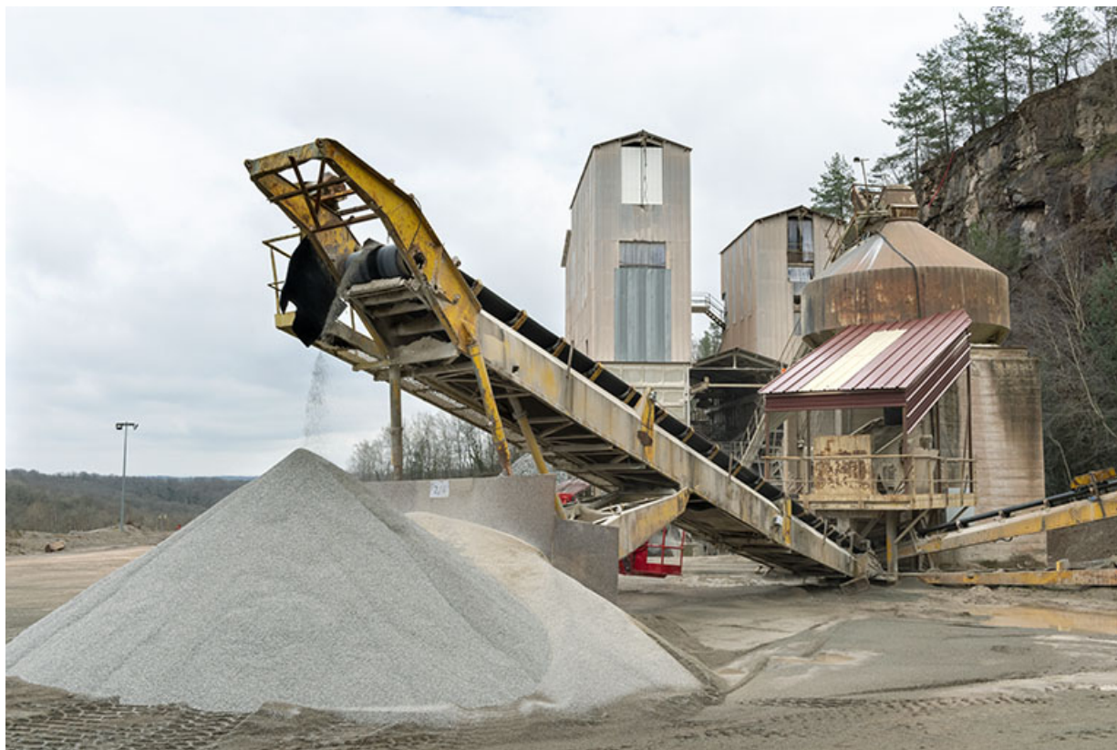
Nouvelles installations : poste de concassage et tapis roulant.