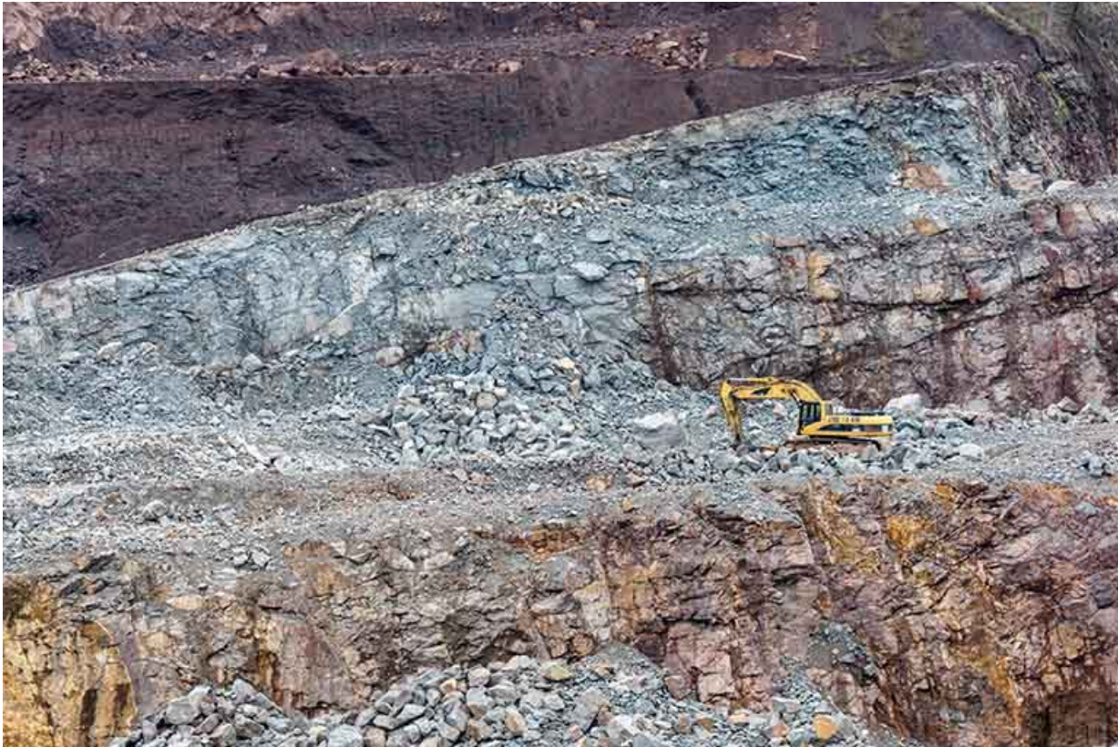
Carrière : front d'exploitation et pelle mécanique.