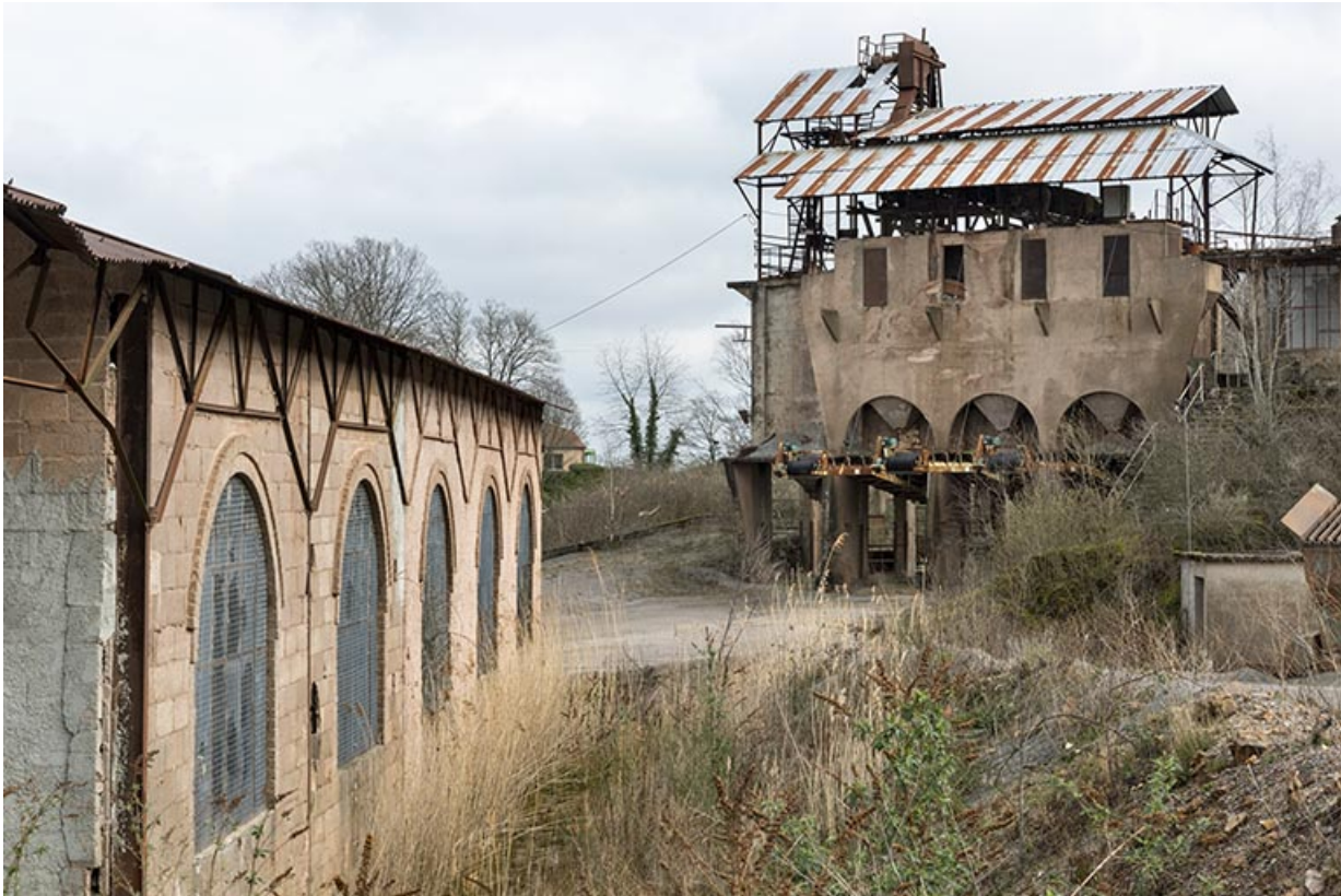
Poste de lavage (C), depuis le hangar (G).