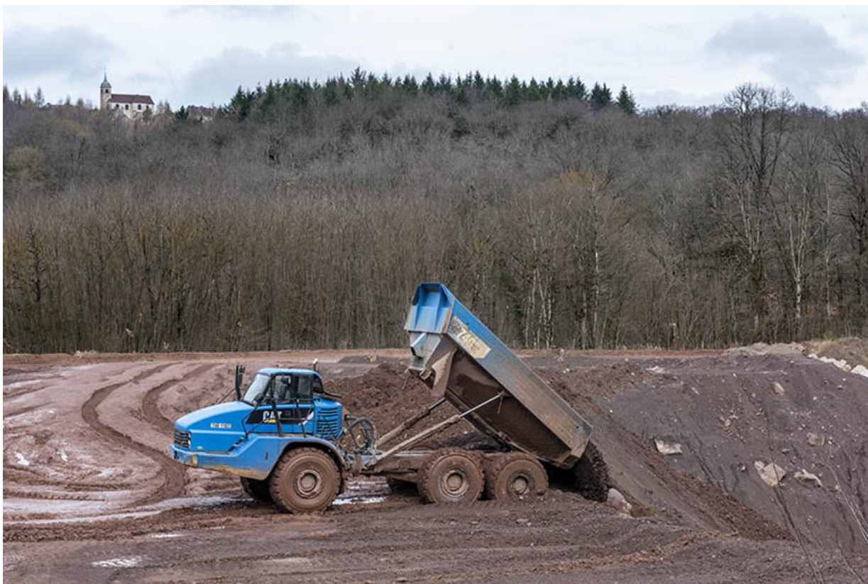
Carrière : évacuation des morts terrains à l'aide d'un camion articulé.