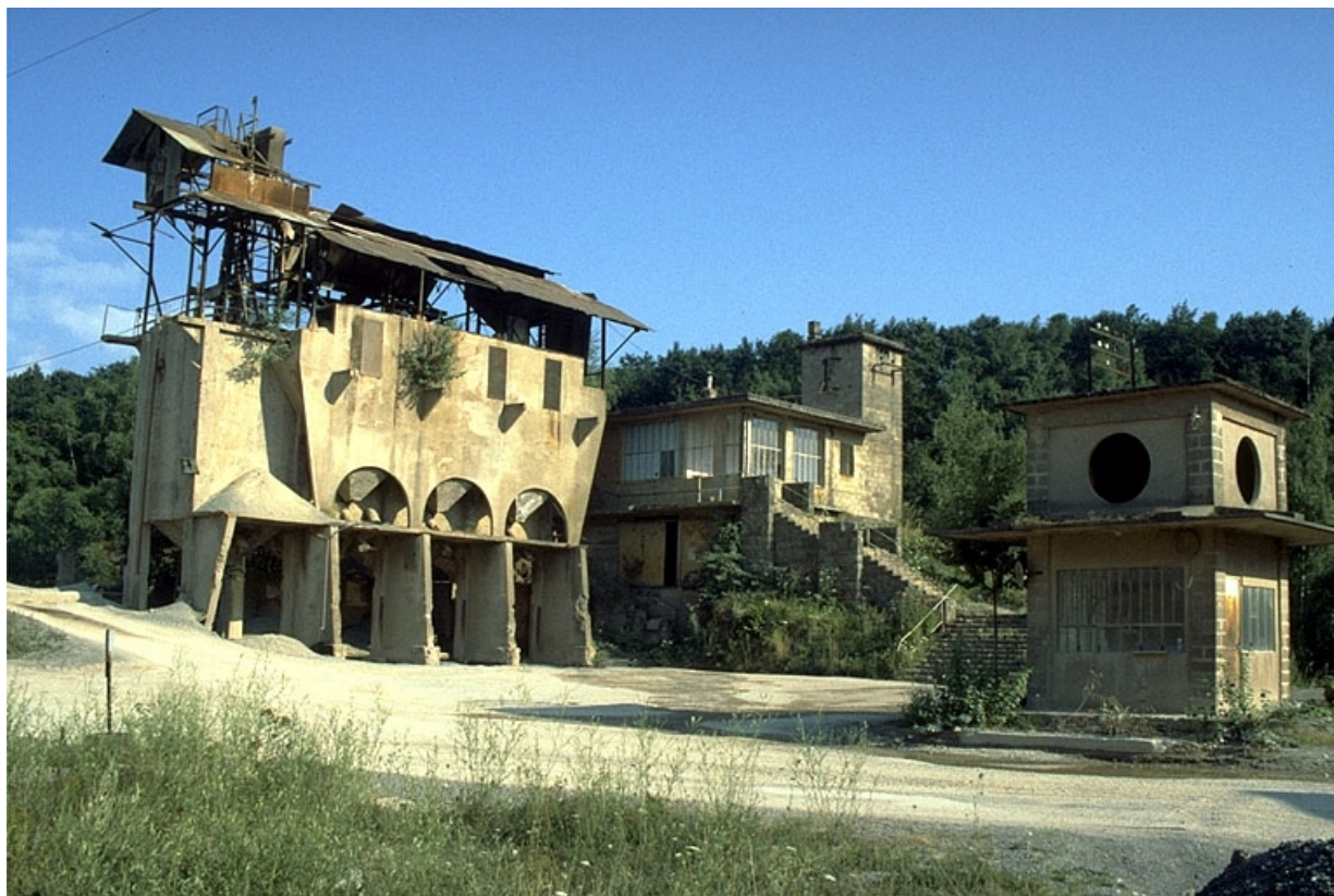
Poste de lavage (C), poste de surveillance (D) et ancien bâtiment de la bascule (E).