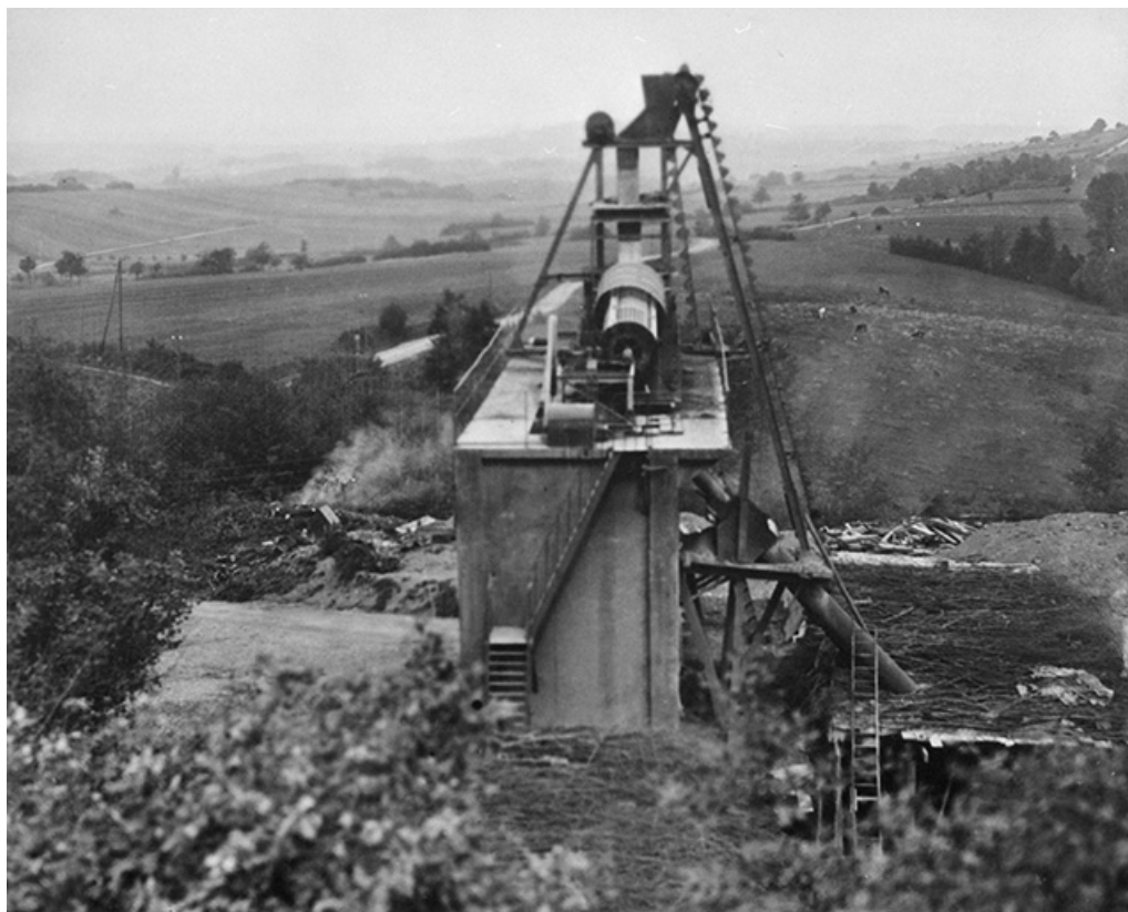
Installation de triage après concassage.