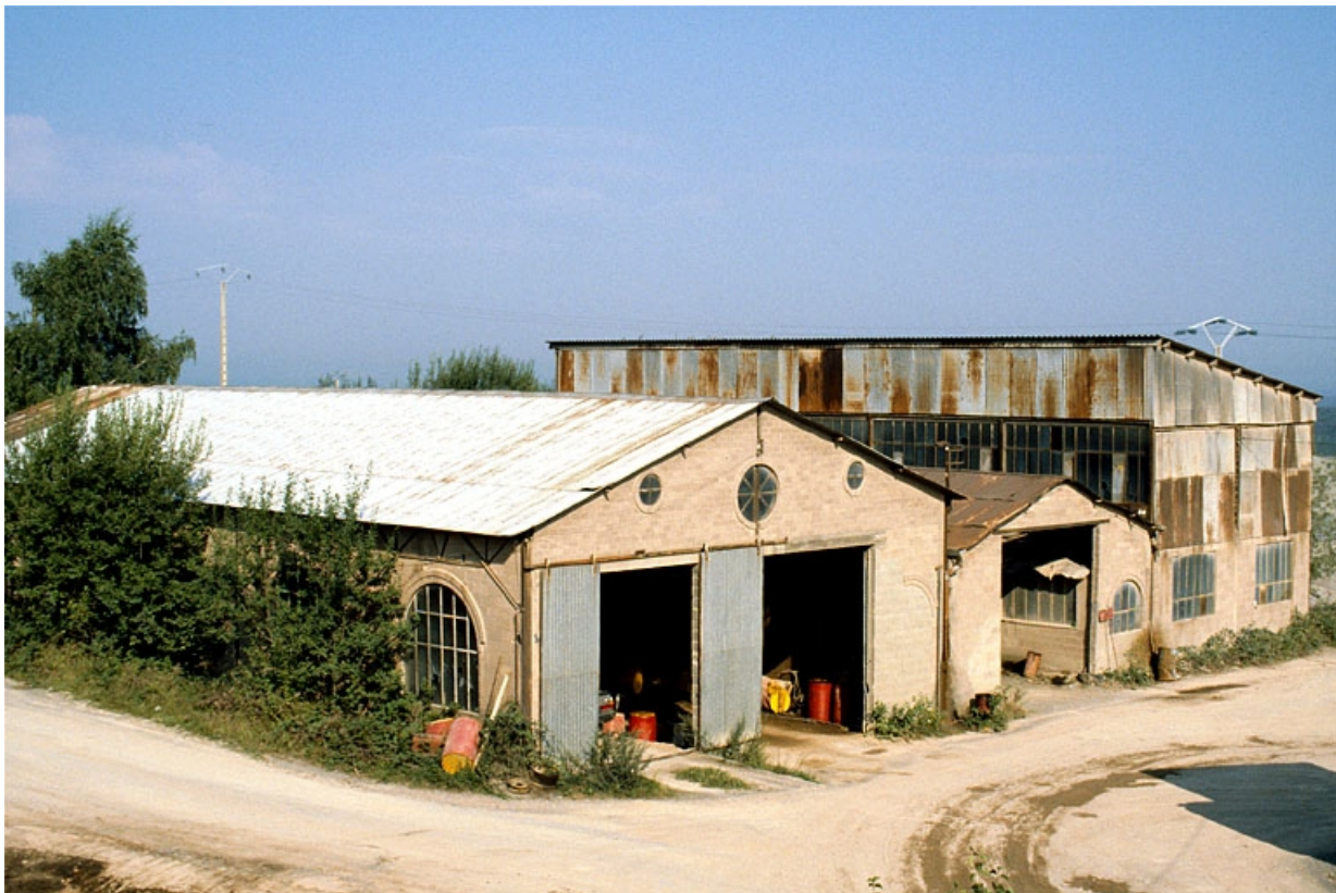
Hangar (G) vu du sud-est.