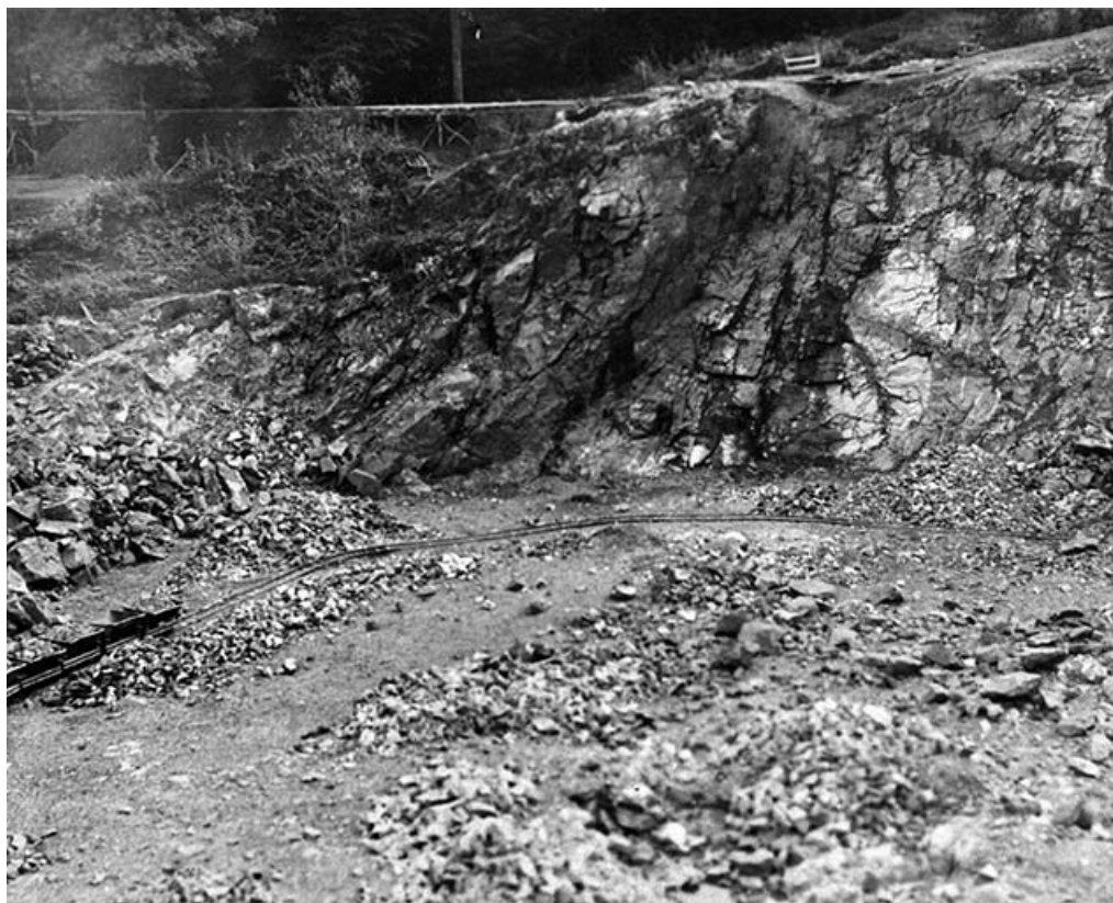
Le front de taille de la carrière.