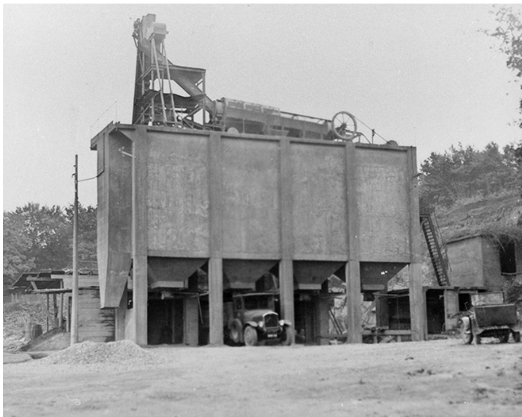
Poste de concassage (C) vu de l'ouest.