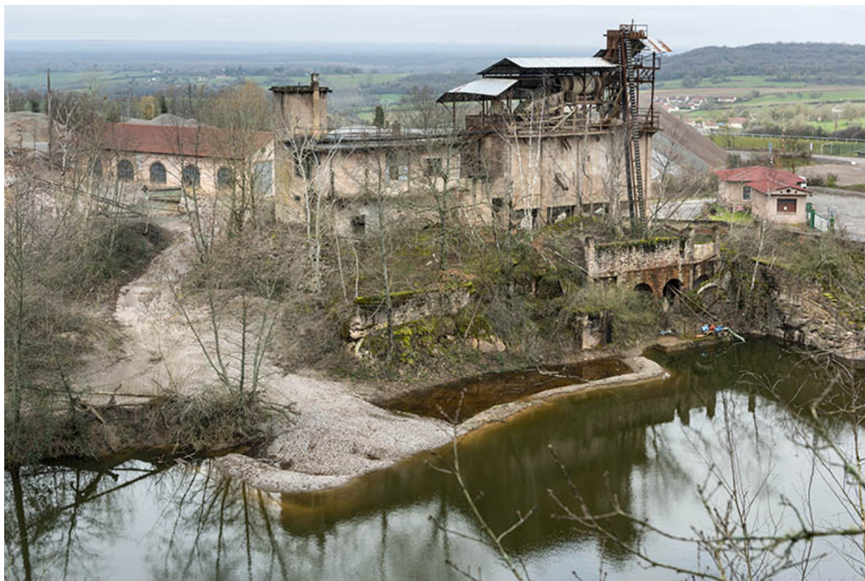
Vue plongeante sur l'ancien site.