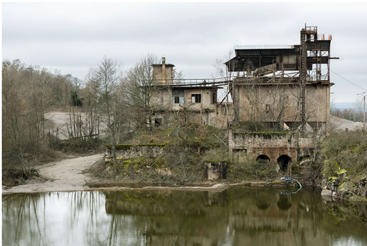
Vue d'ensemble, depuis l'est. Etang au premier plan, poste de lavage (C) au centre.