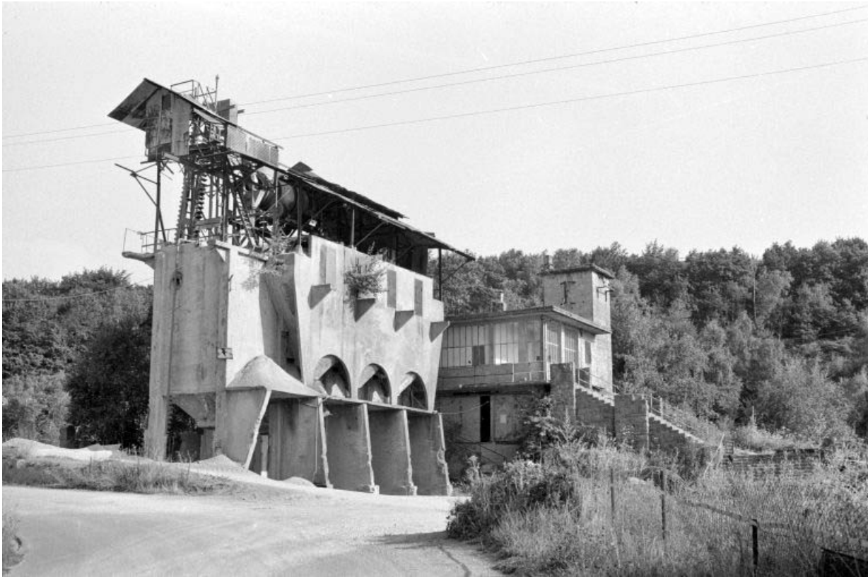
Poste de lavage (C) et poste de surveillance (D) vus depuis le nord. 39, Moisey, lieudit : Bois de la Serre