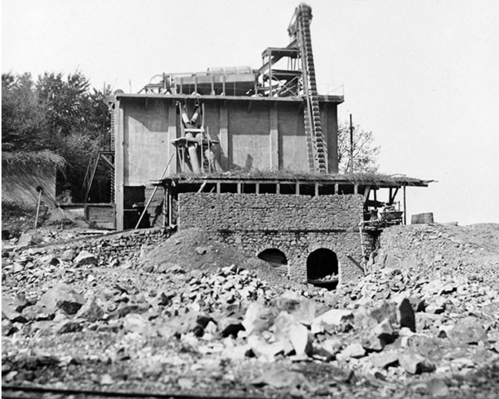
Poste de concassage (C) vu de l'est. 39, Moisey, lieudit : Bois de la Serre