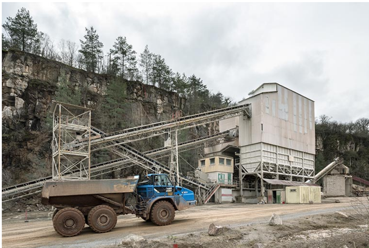
Nouvelles installations : poste de concassage, avec camion.