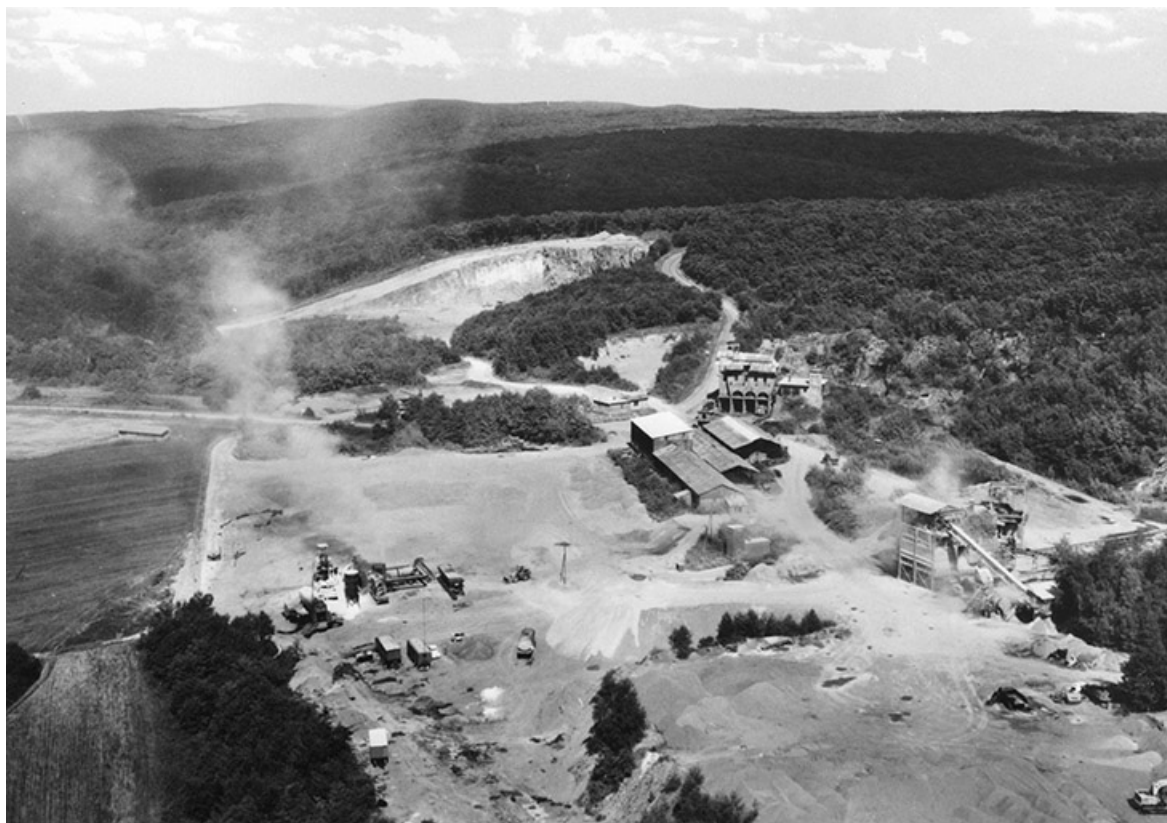
Moisey (39. Jura). Vue aérienne. Les carrières, après 1968.