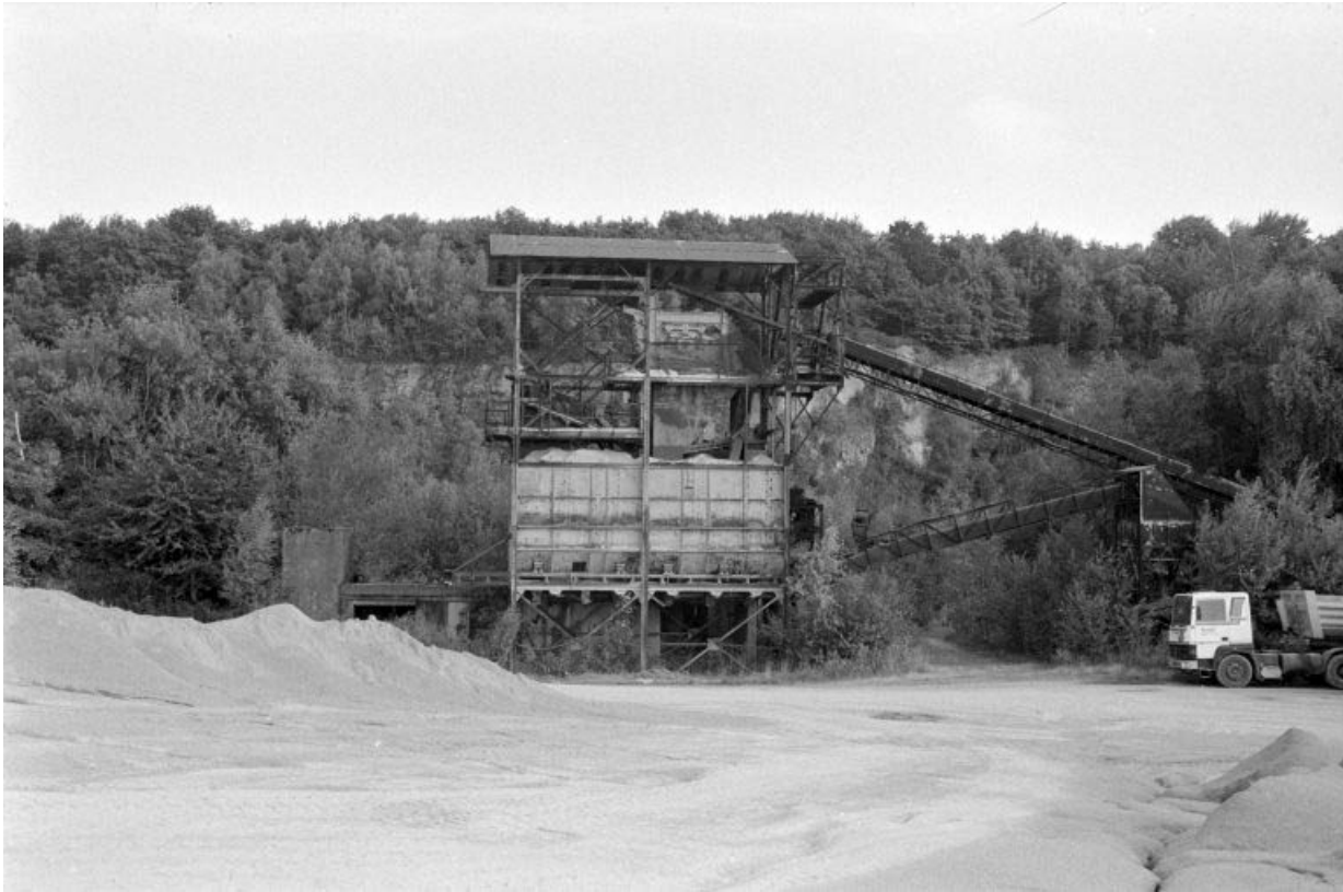
Anciennes installations vues du nord-ouest : poste de concassage (I).