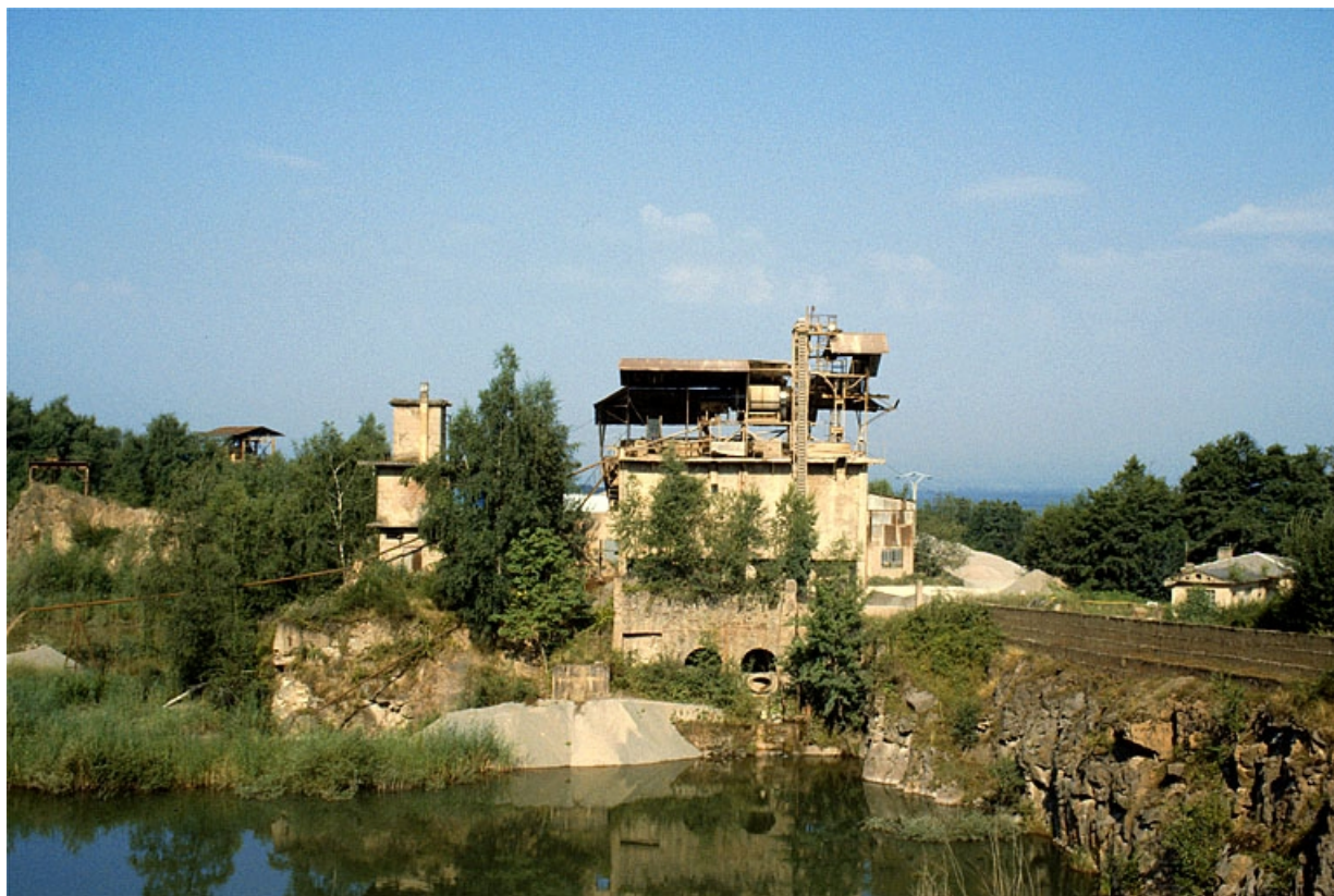
Vue d'ensemble, depuis l'est. Etang au premier plan, poste de lavage (C) au centre, bureau (A) à droite, anciennes installations à gauche.