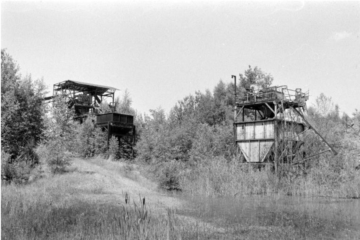
Anciennes installations : trémie et poste de concassage (I).