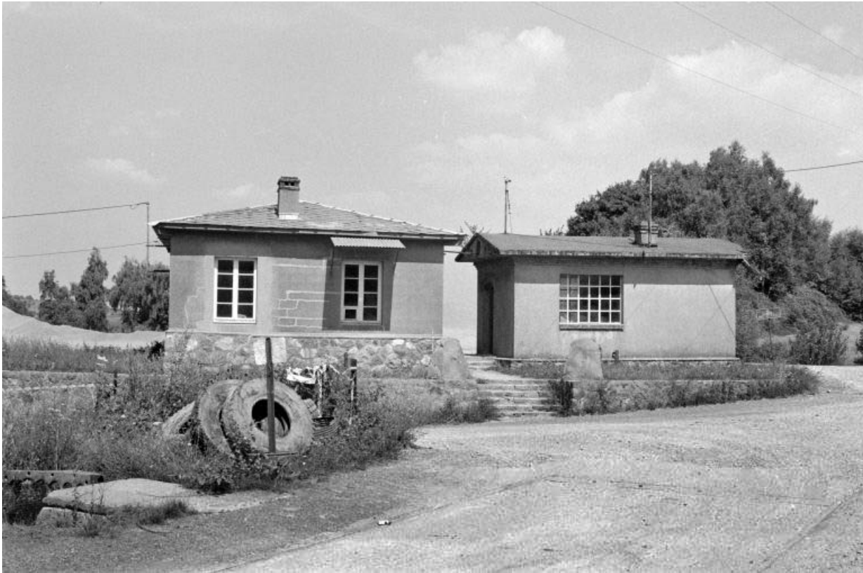
Bureau (A) et bâtiment de la bascule (B), vus de l'ouest.