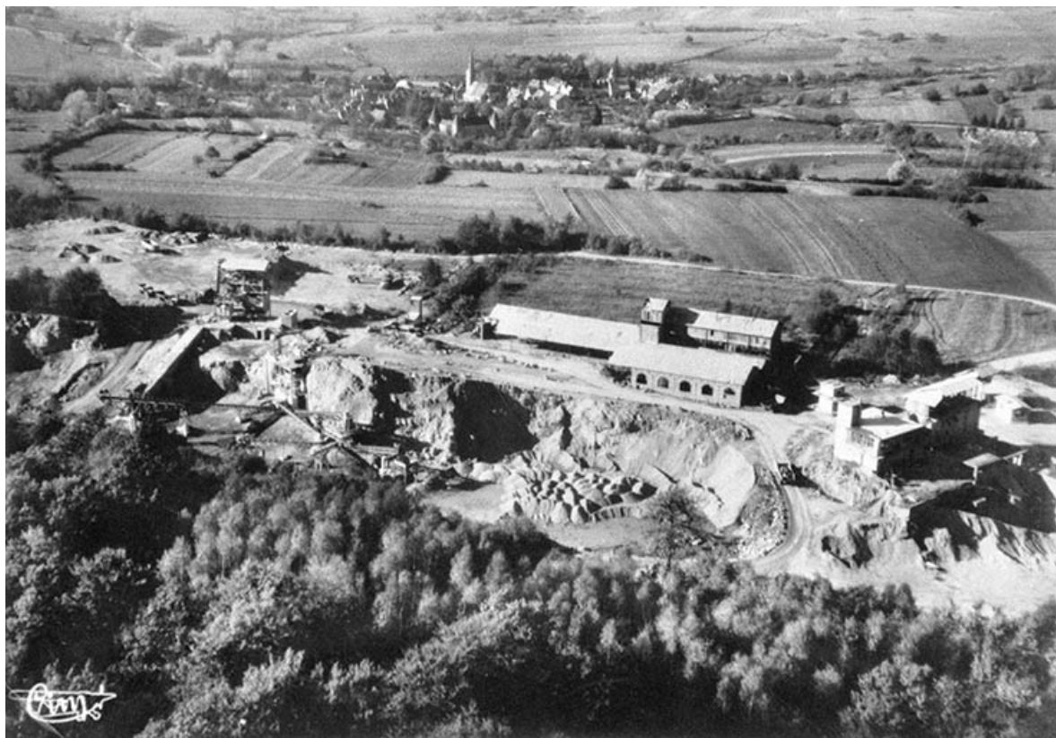
Moisey. Vue générale [vue aérienne].