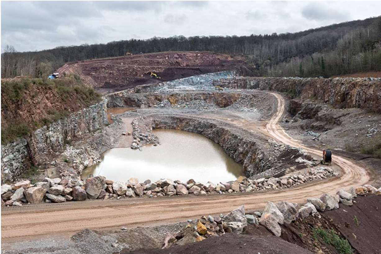
Vue d'ensemble de la carrière, depuis l'ouest.