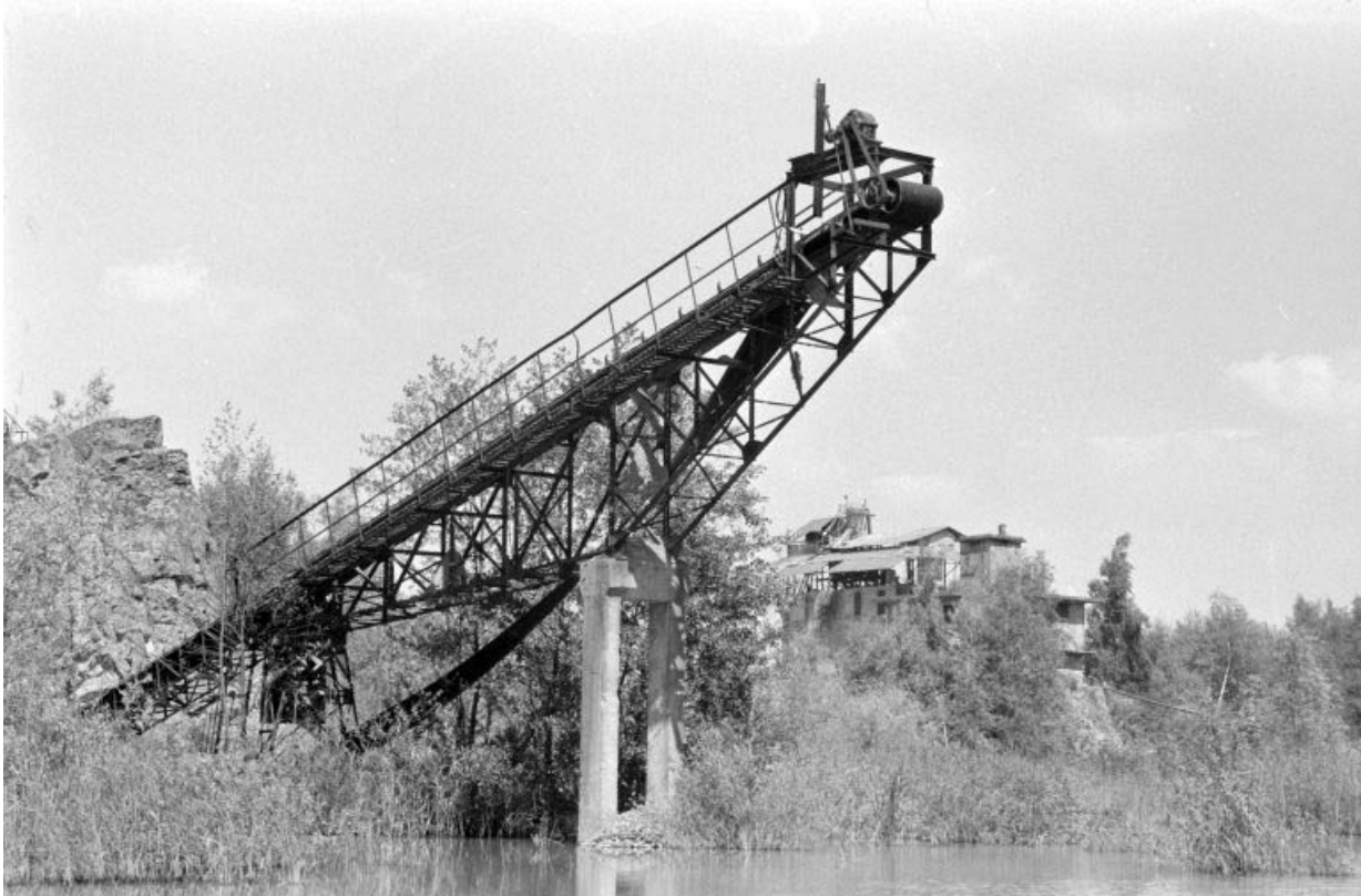
Anciennes installations vues de l'ouest : le transporteur.