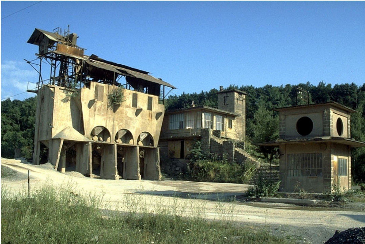
Poste de lavage (C), poste de surveillance (D) et ancien bâtiment de la bascule (E).