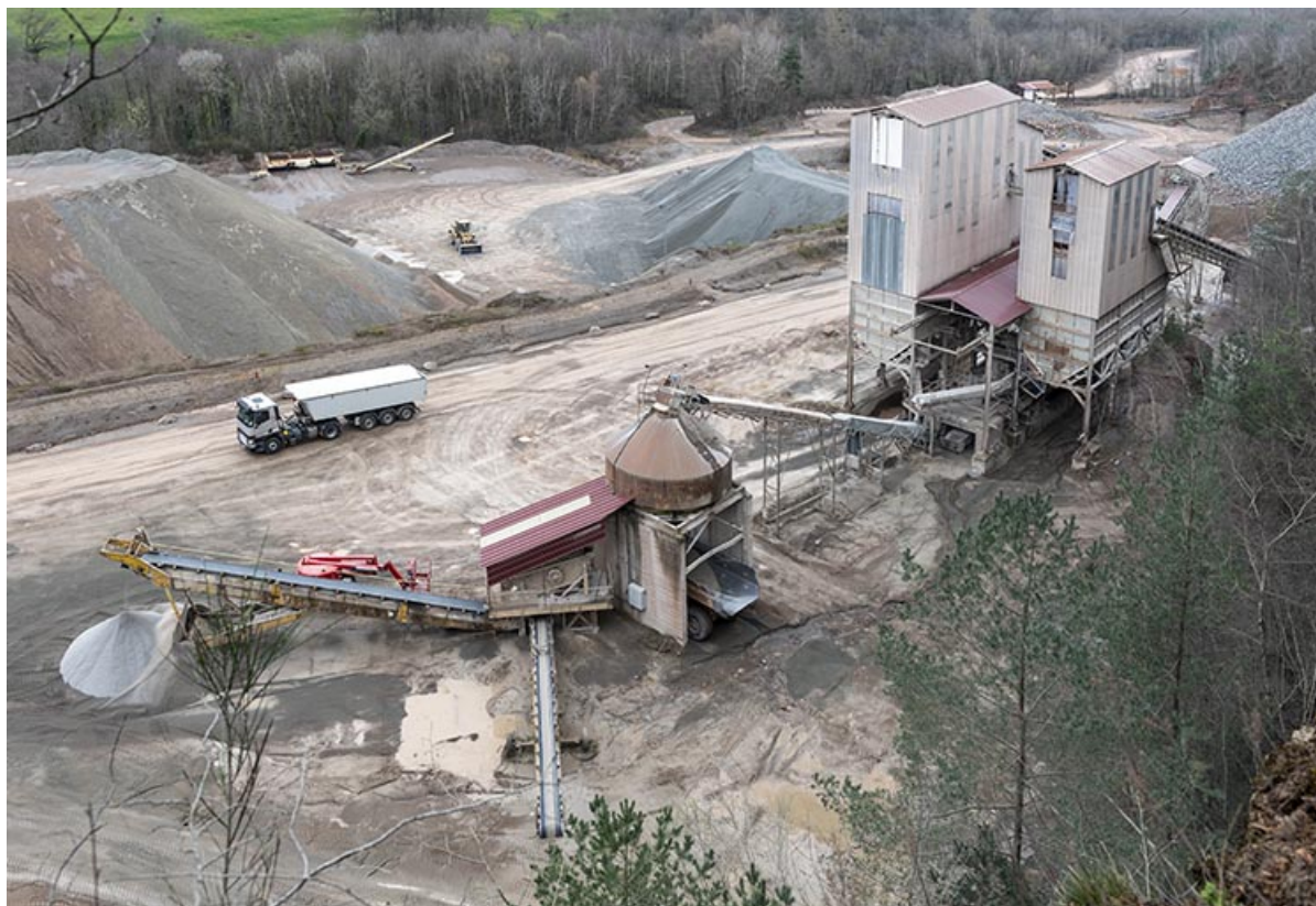
Vue d'ensemble plongeante sur les nouvelles installations de concassage, avec camion.