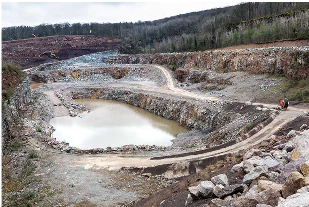
Vue d'ensemble de la carrière, depuis l'ouest.