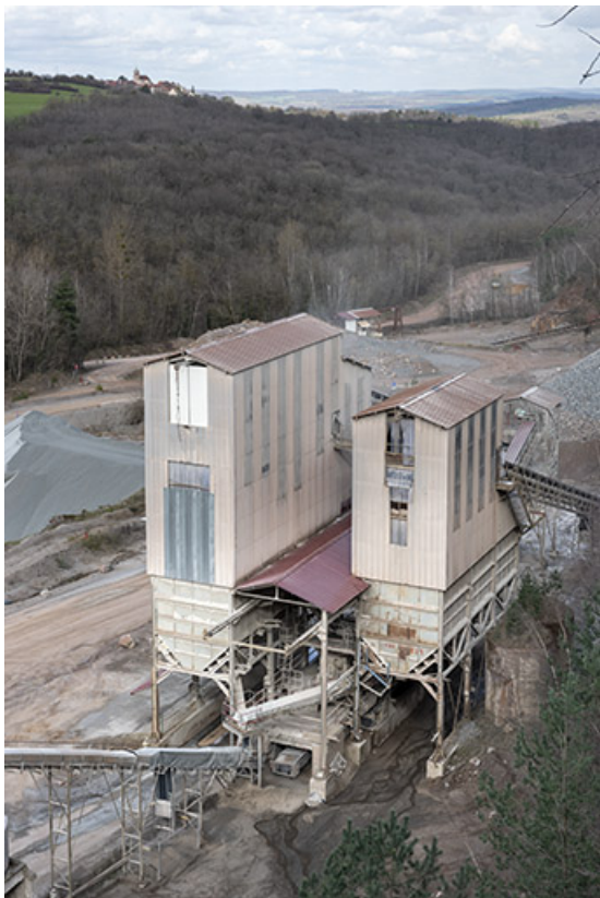
Vue plongeante sur les nouvelles installations de concassage.