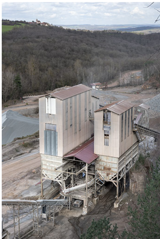
Vue plongeante sur les nouvelles installations de concassage.