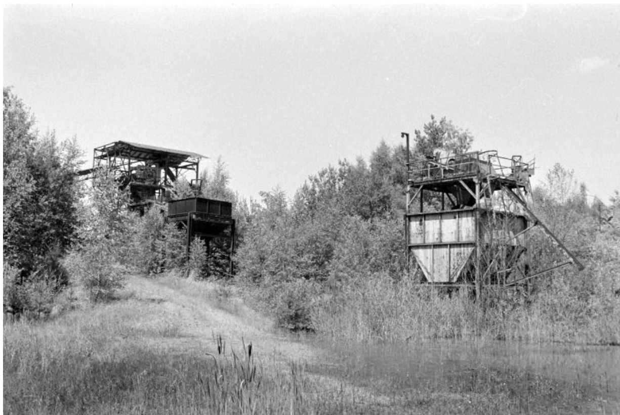
Anciennes installations : trémie et poste de concassage (I).