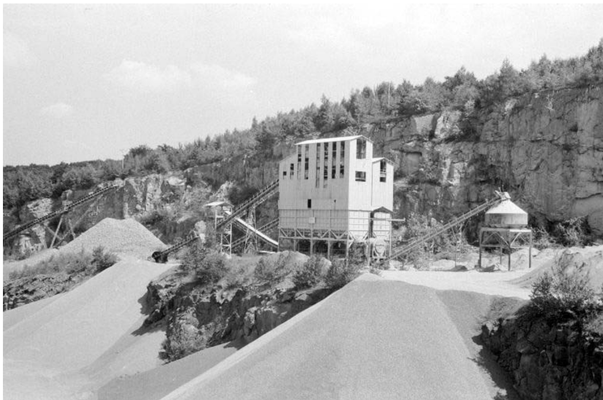
Site d'extraction et nouvelles installations de concassage.