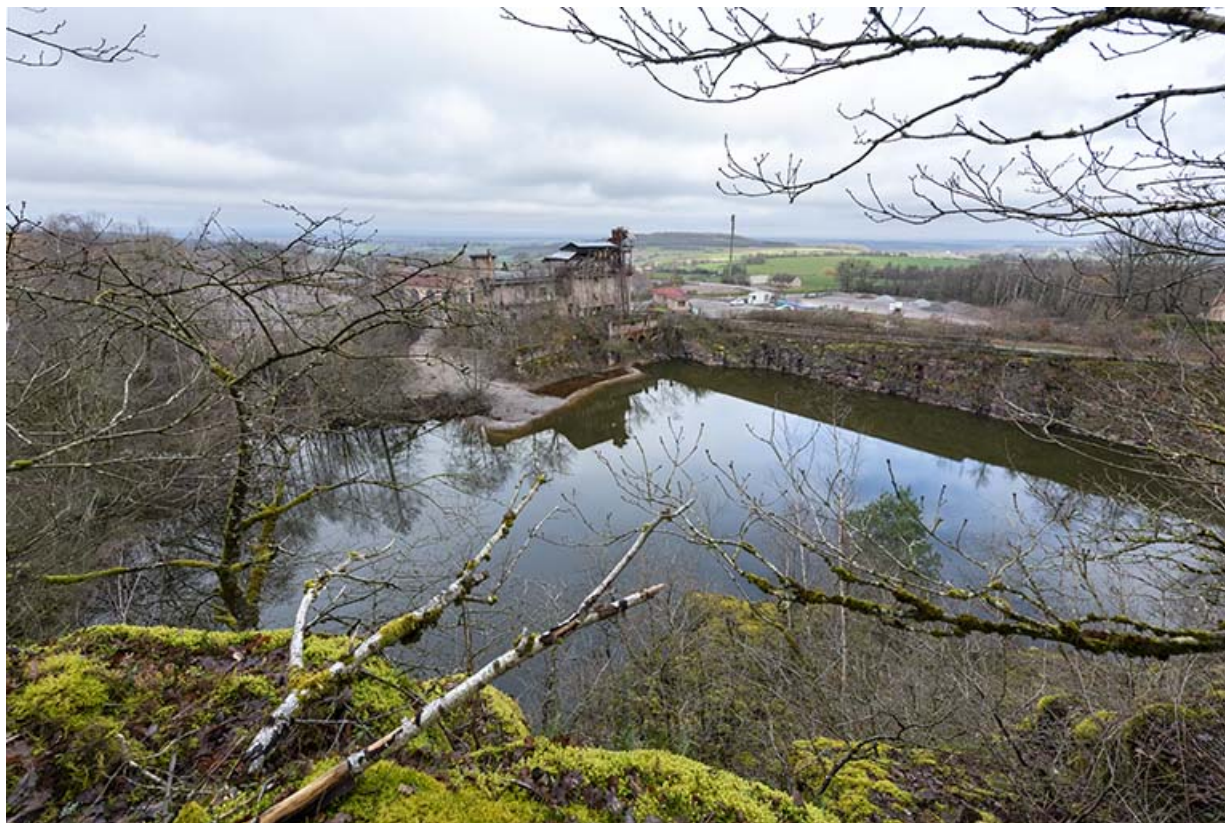
Vue d'ensemble de l'ancien site, depuis le sud-est.