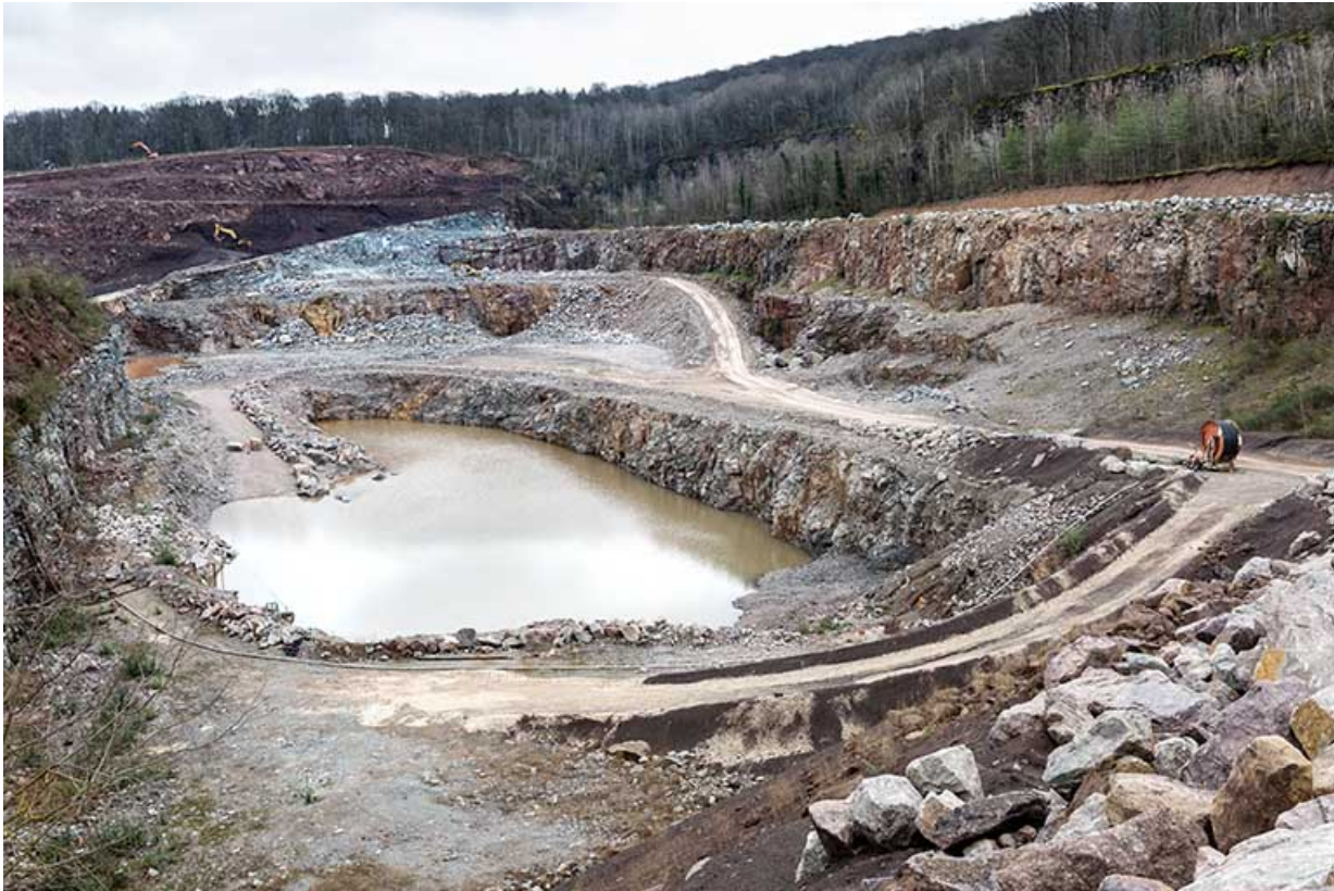
Vue d'ensemble de la carrière, depuis l'ouest.