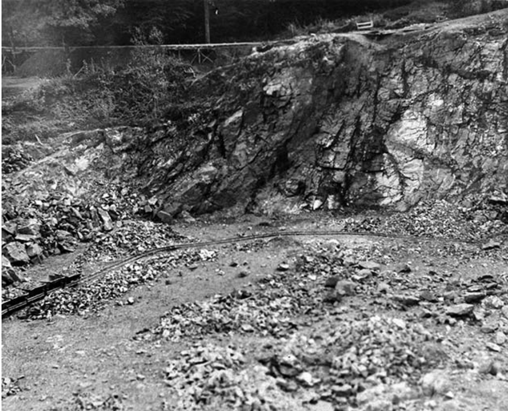
Le front de taille de la carrière.