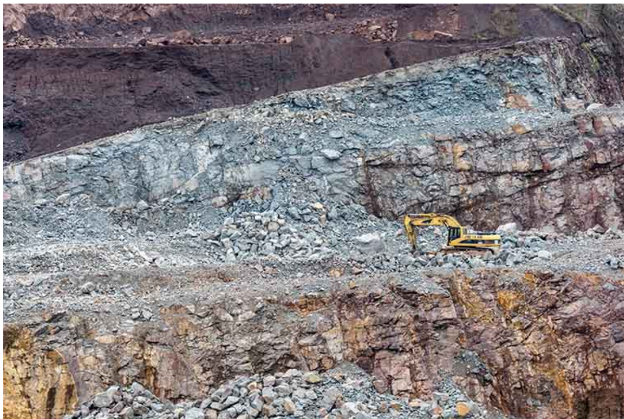
Carrière : front d'exploitation et pelle mécanique.