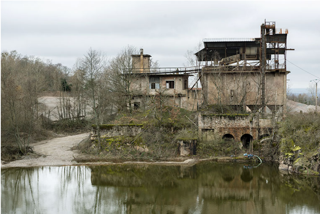
Vue d'ensemble, depuis l'est. Etang au premier plan, poste de lavage (C) au centre.