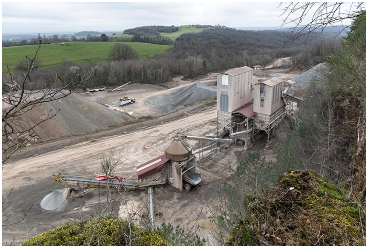
Vue d'ensemble plongeante sur les nouvelles installations de concassage.