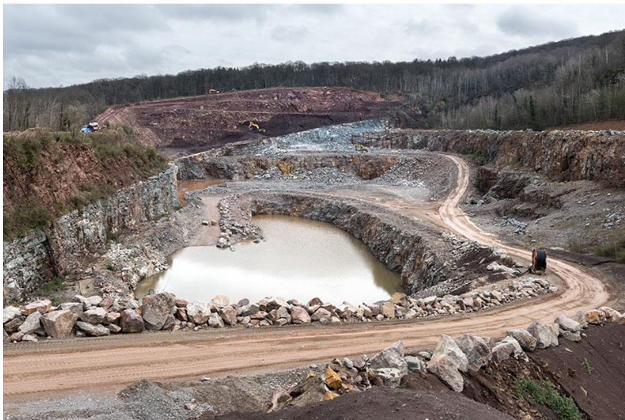
Vue d'ensemble de la carrière, depuis l'ouest.