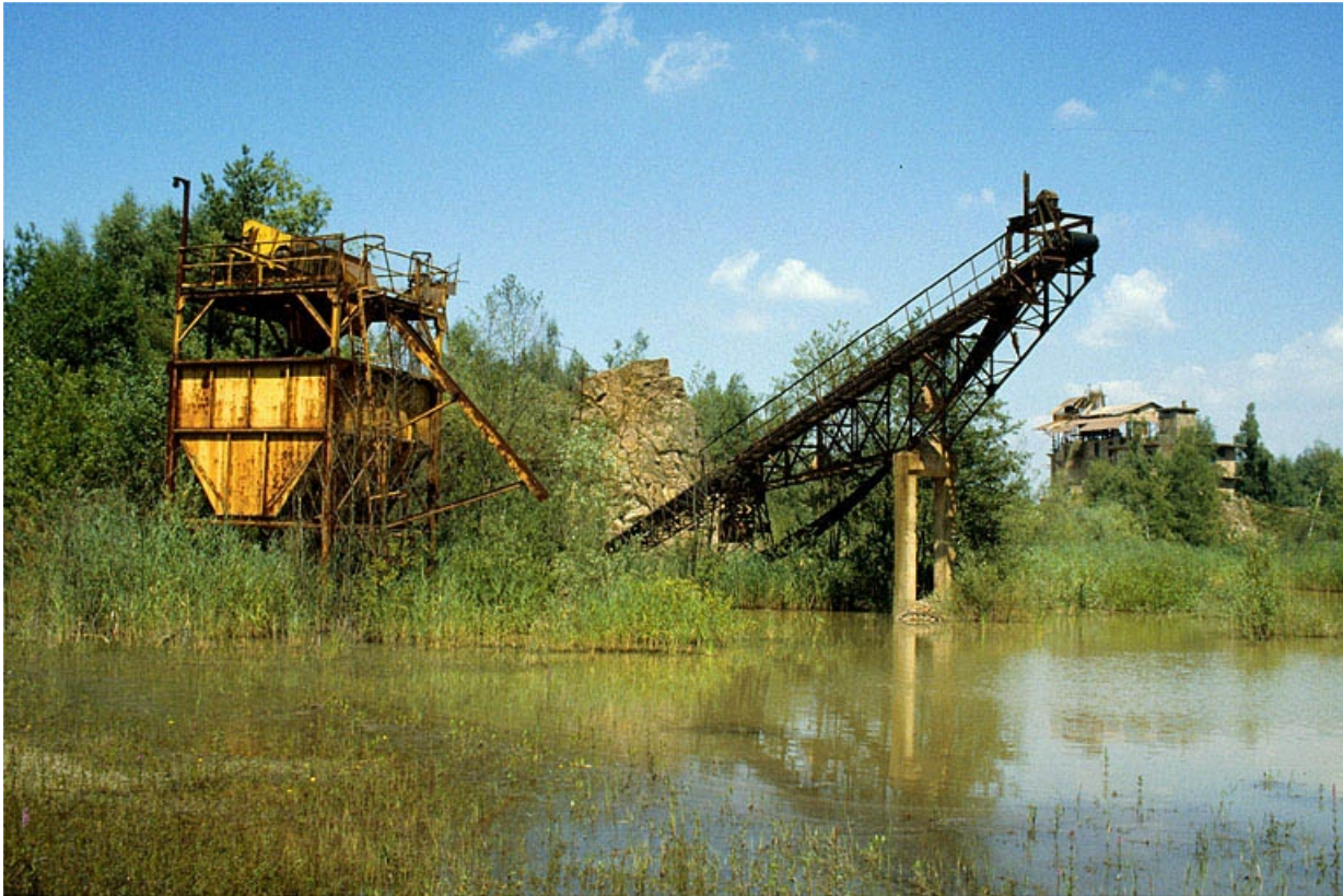
Anciennes installations vues de l'ouest.