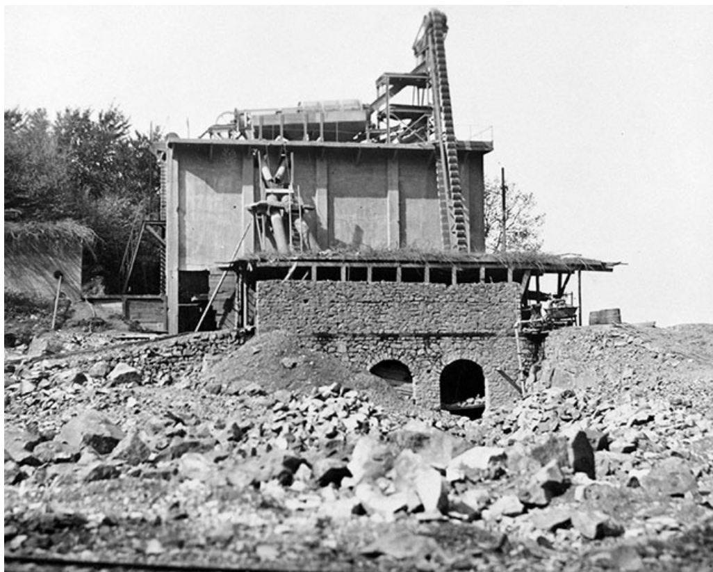
Poste de concassage (C) vu de l'est. 39, Moisey, lieudit : Bois de la Serre