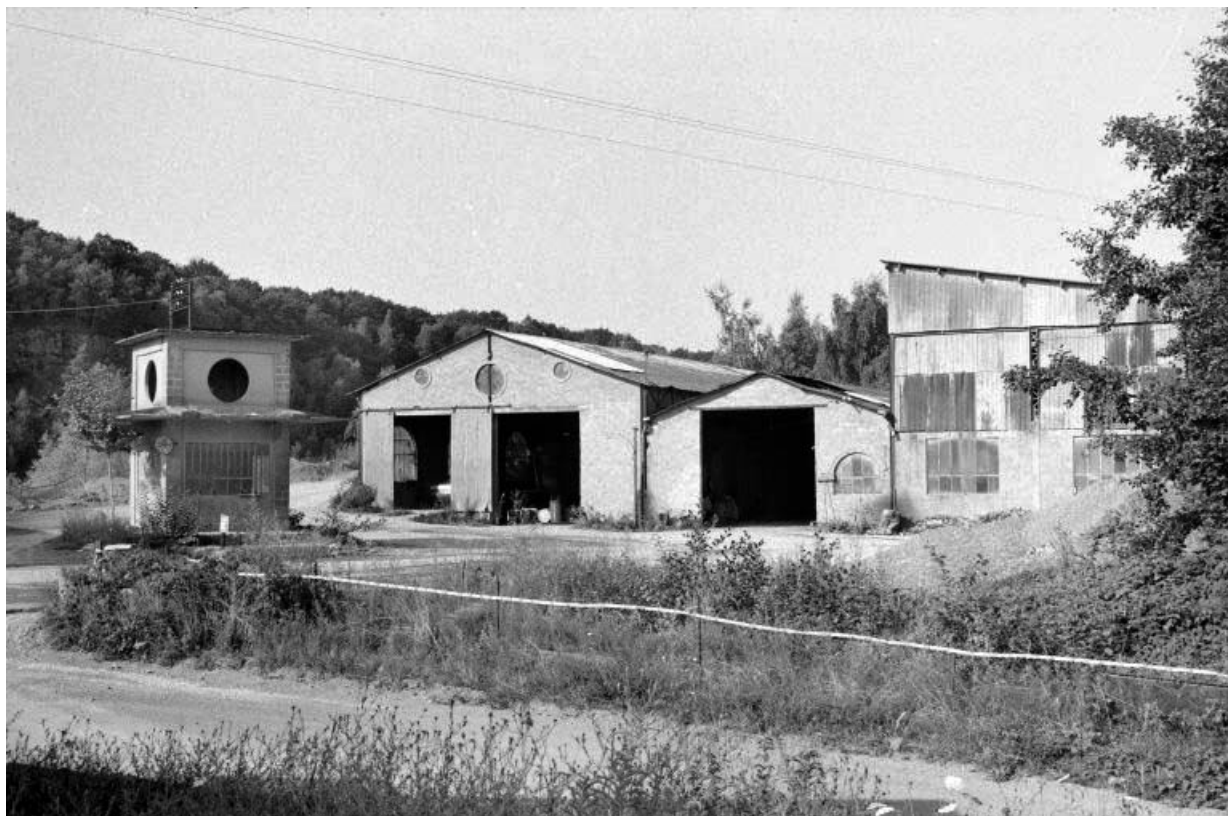
Ancien bâtiment de la bascule (E) et hangar (G).