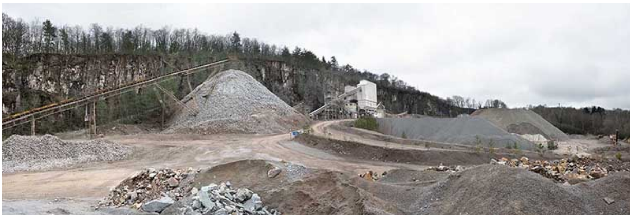
Vue d'ensemble des nouvelles installations, depuis le nord-est.