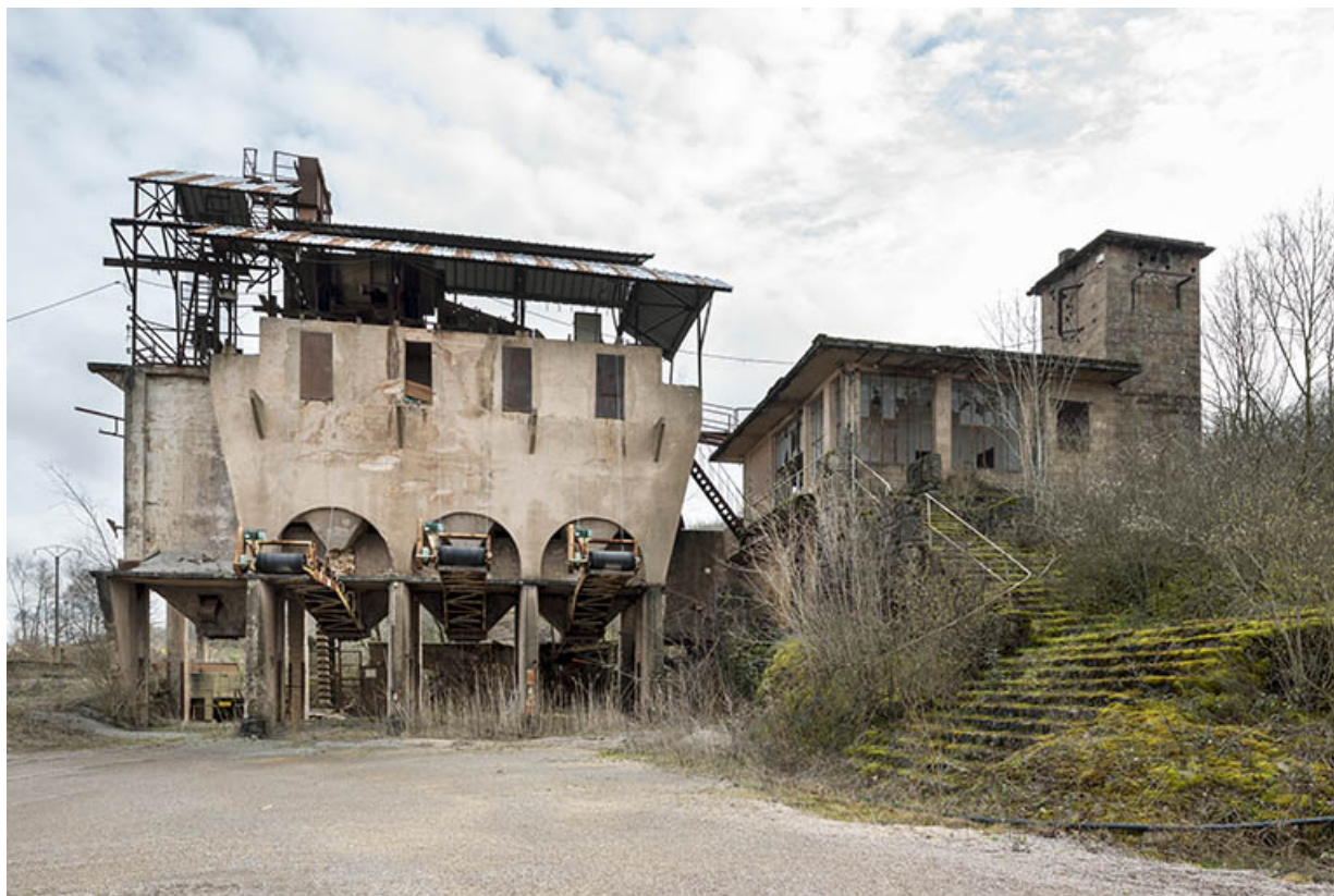
Poste de lavage (C) et poste de surveillance (D).