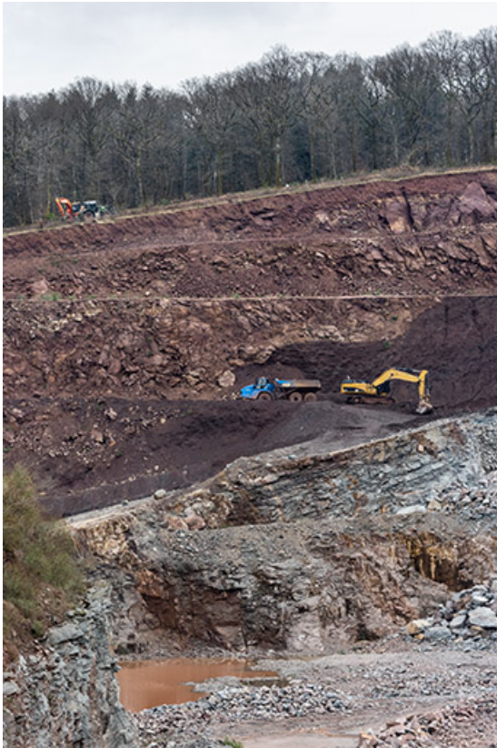
Carrière : découverte à la pelle mécanique.