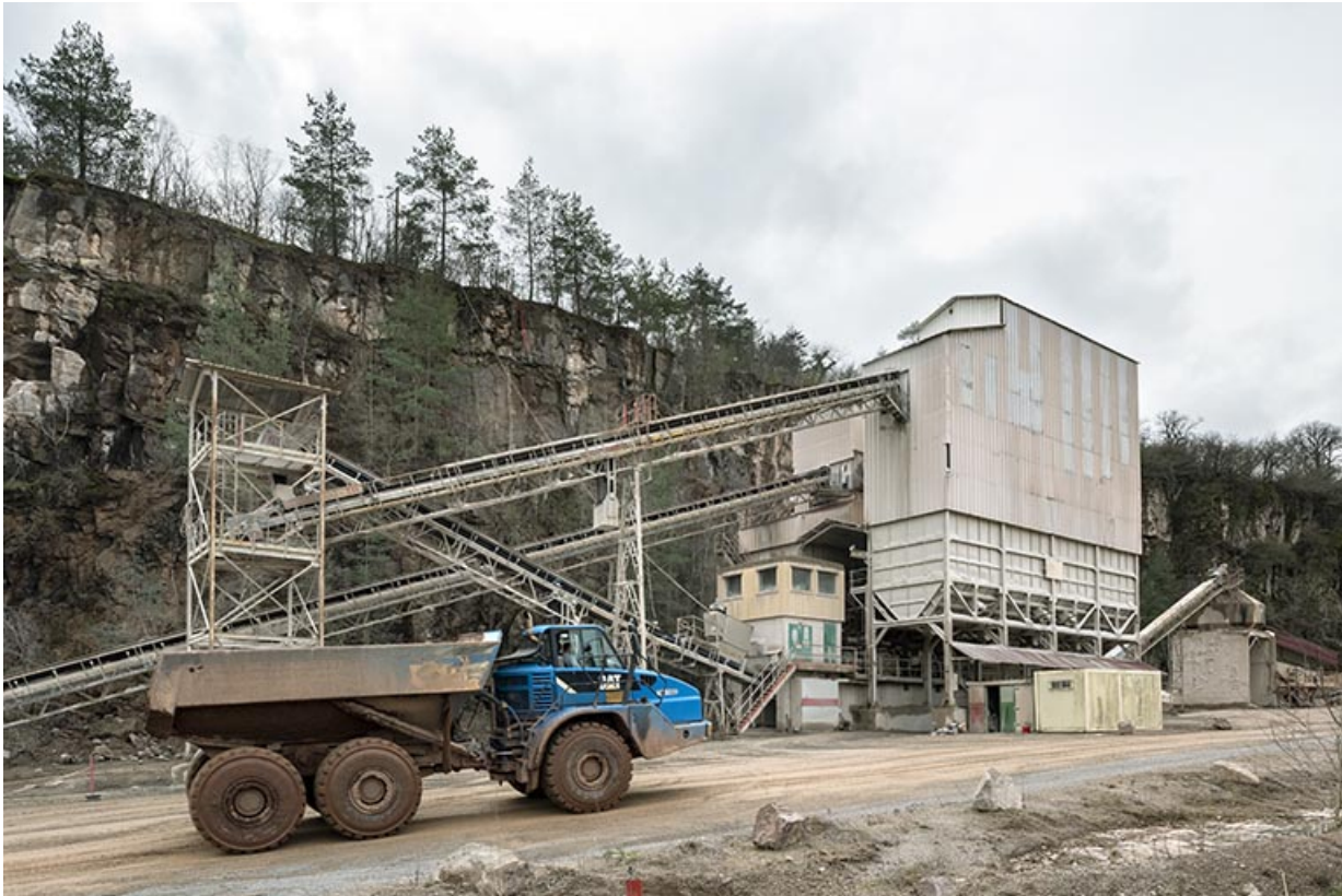
Nouvelles installations : poste de concassage, avec camion.