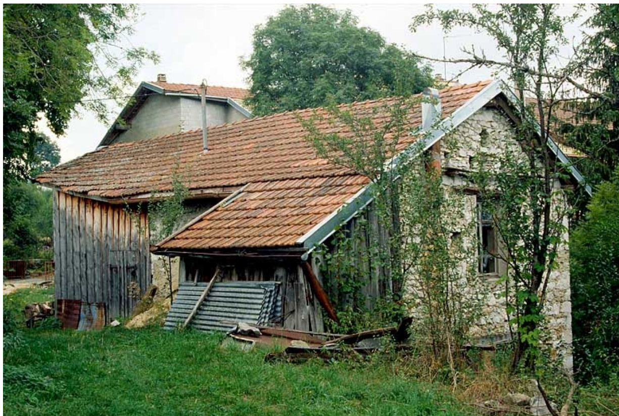
Façades postérieure et latérale droite. 39, Viry