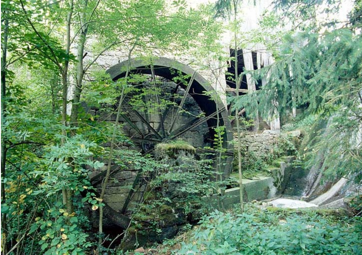
Roue hydraulique verticale.