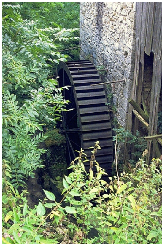
Vue en plongée de la roue hydraulique. 39, Viry