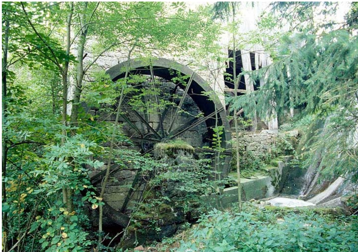
Roue hydraulique verticale.