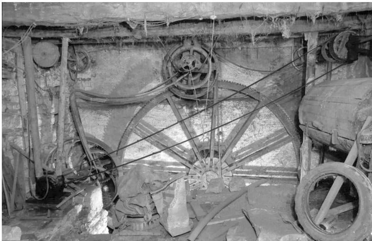
Intérieur de la salle des machines. Moteur électrique, transmission de la roue hydraulique et tonneau de polissage. 39, Viry