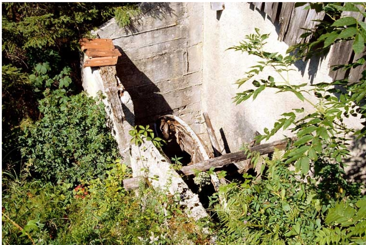
Vestige de la roue en dessus.