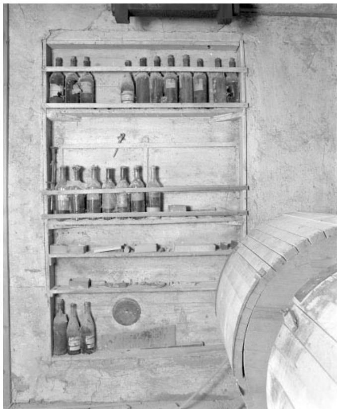
Placard à bouteilles de vernis et de laque.