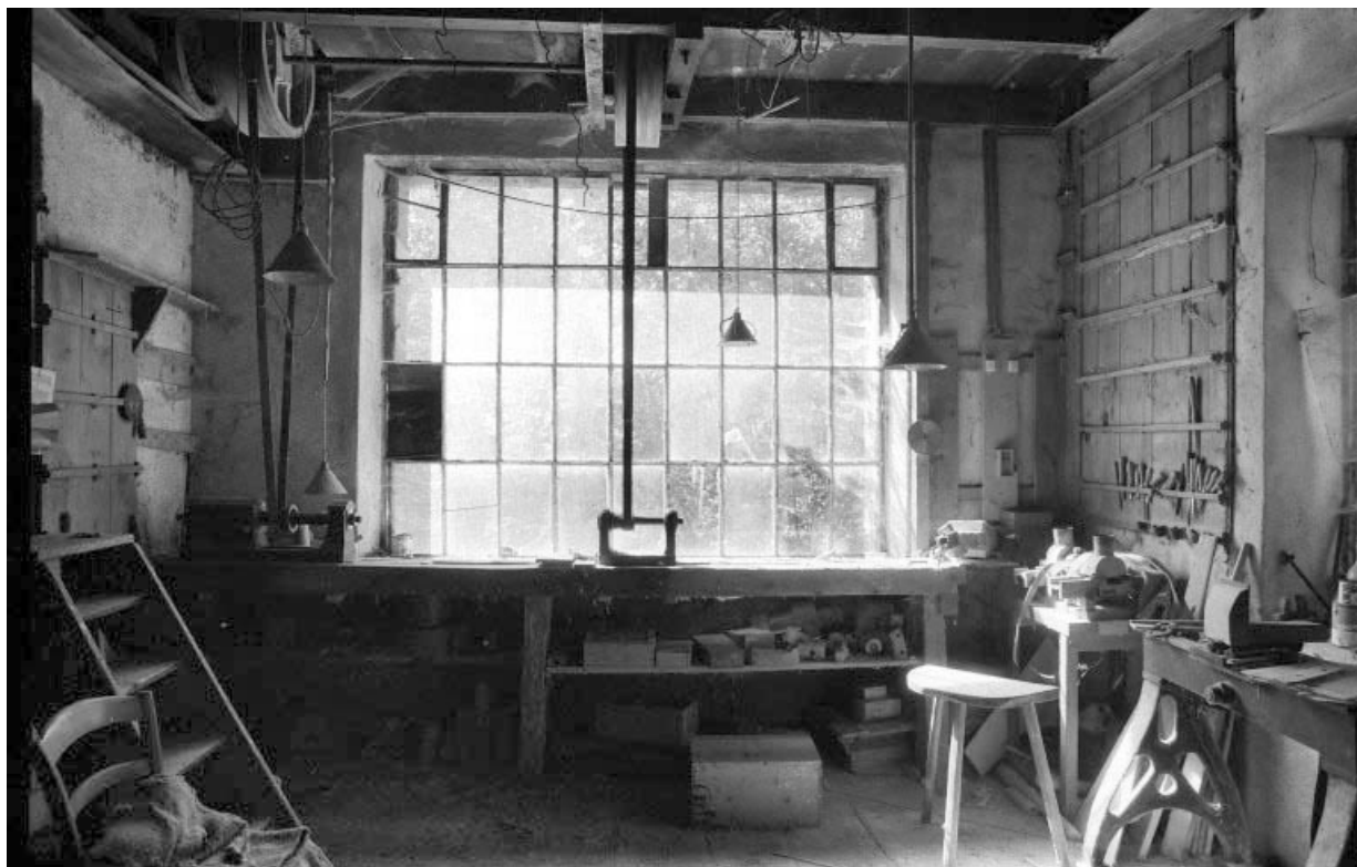
Intérieur d'un atelier de fabrication (bâtiment E).