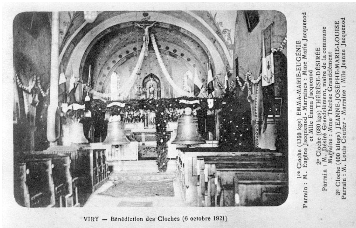
Viry - Bénédiction des cloches (6 octobre 1921).