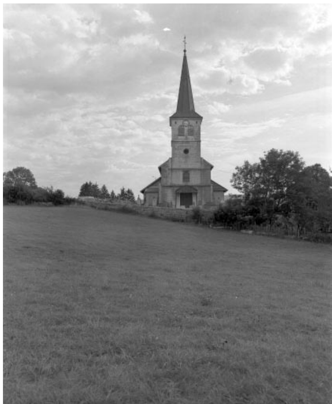
Vue de situation depuis l'ouest.