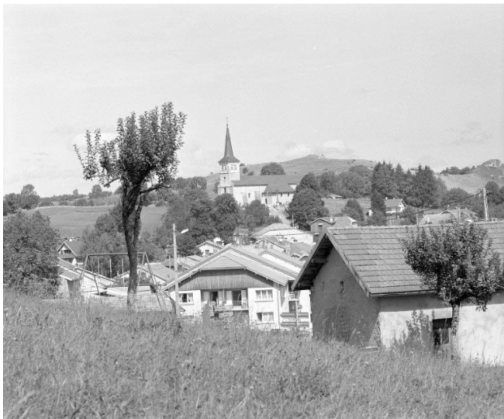
Vue de situation depuis le sud.