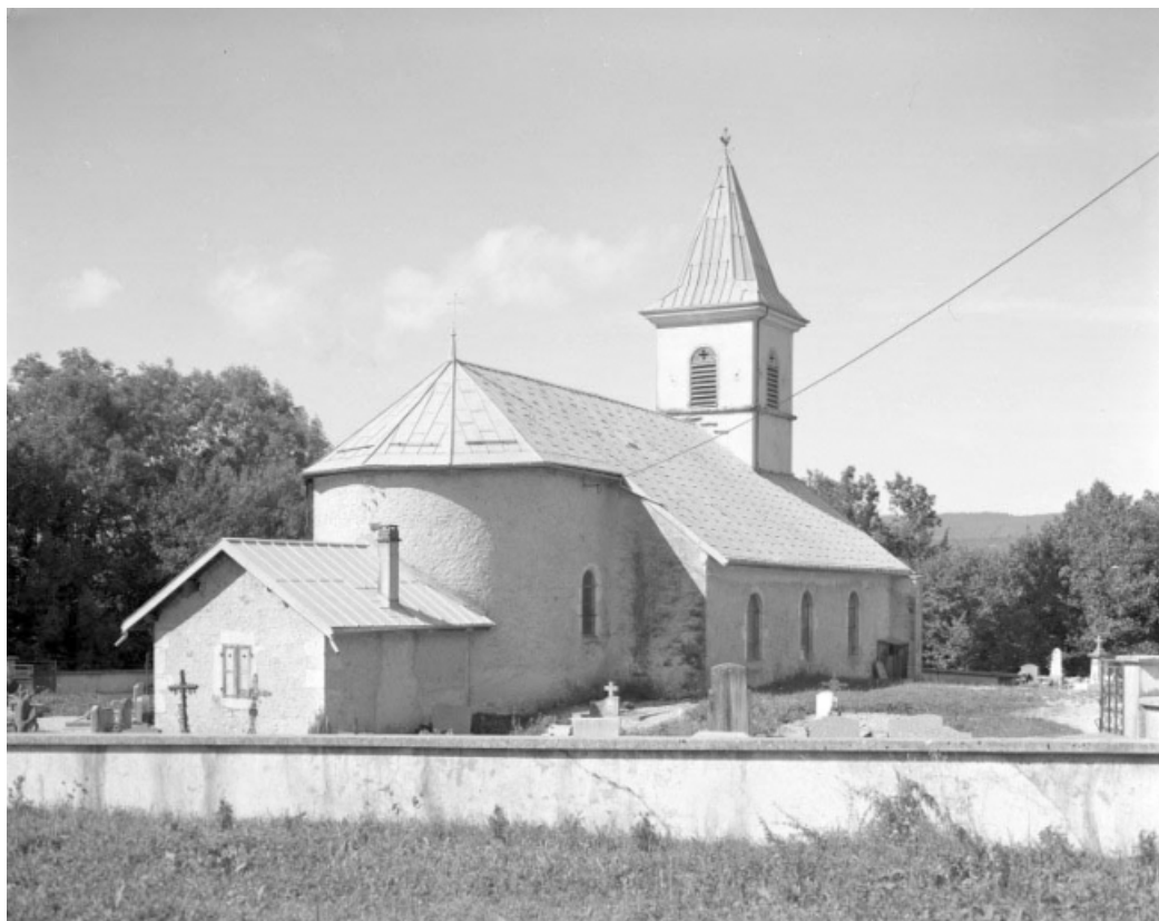
Extérieur : abside et face nord.