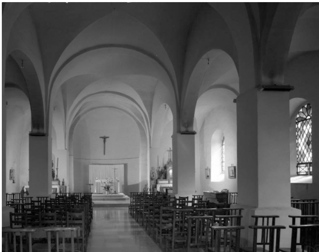
Intérieur : vue générale du vaisseau central depuis l'entrée.