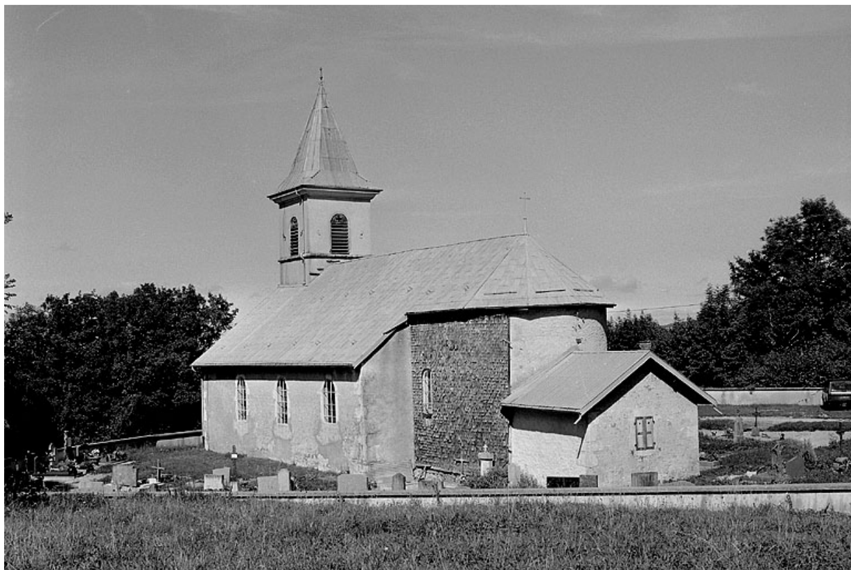
Extérieur : abside et face sud.