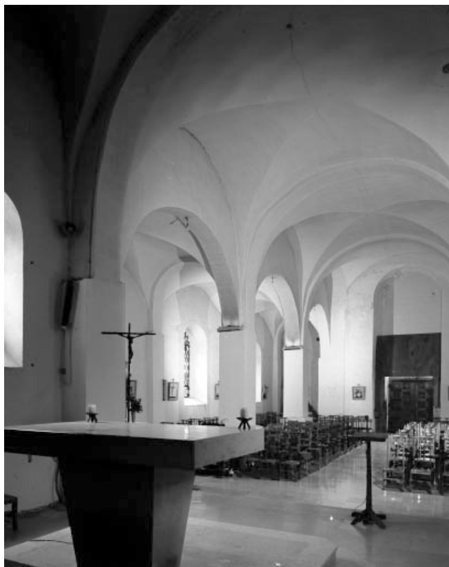
Intérieur : élévation sud du vaisseau central et du bas-côté sud vus depuis le chœur (vue verticale). 39, Larrivoire