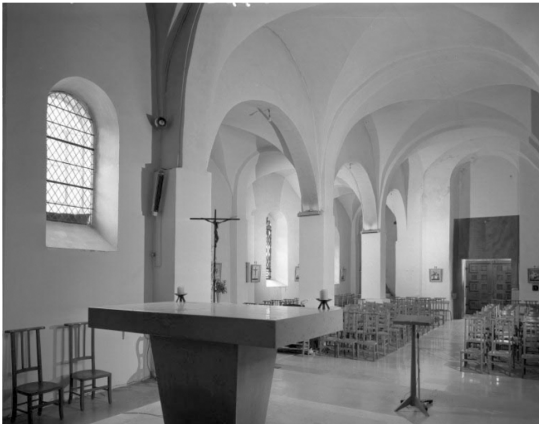
Intérieur : élévation sud du vaisseau central et bas-côté sud vus depuis le chœur (vue horizontale). 39, Larrivoire