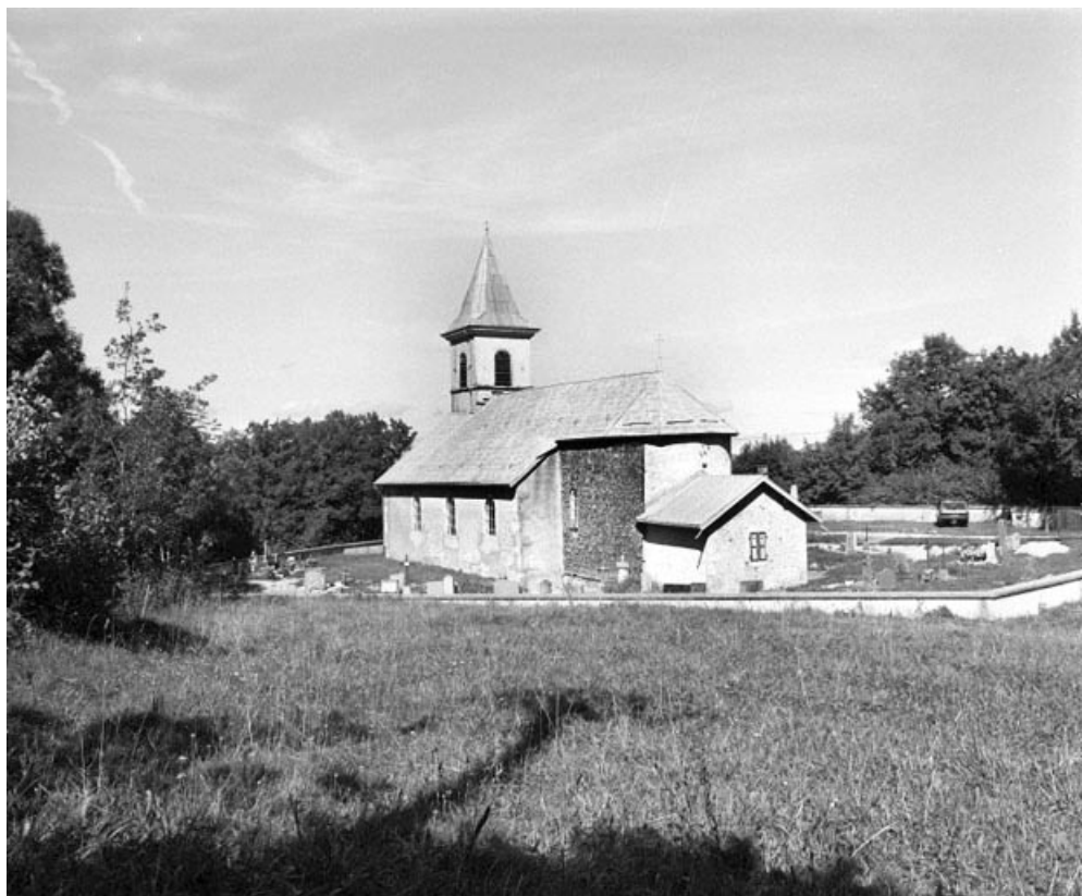
Extérieur : vue générale depuis le sud-ouest.