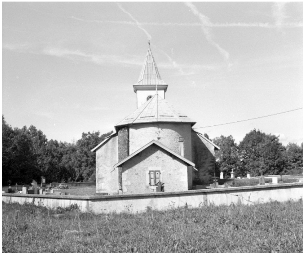
Extérieur : l'abside vue de face.