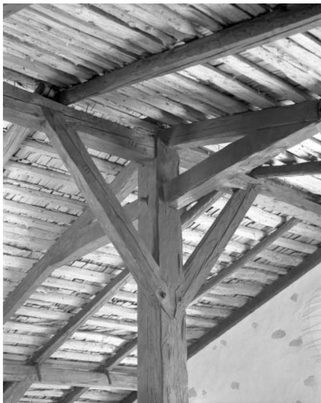
Détail de la charpente : assemblage du poteau avec la faiène.

39, Les Moussières, lieudit : au Montechoux