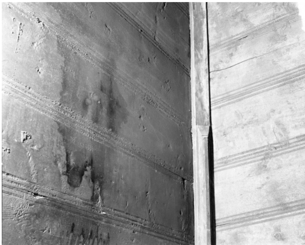
Intérieur du conduit de la cheminée en bois, détail du départ des montants verticaux dans lesquels viennent s'encaster les planches horizontales.

39, Les Moussières, lieudit : au Montechoux