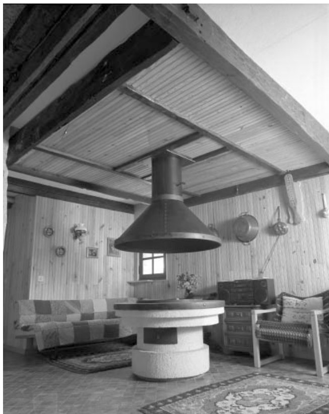
Le départ de la cheminée en bois au rez-de-chaussée.

39, Les Moussières, lieudit : au Montechoux