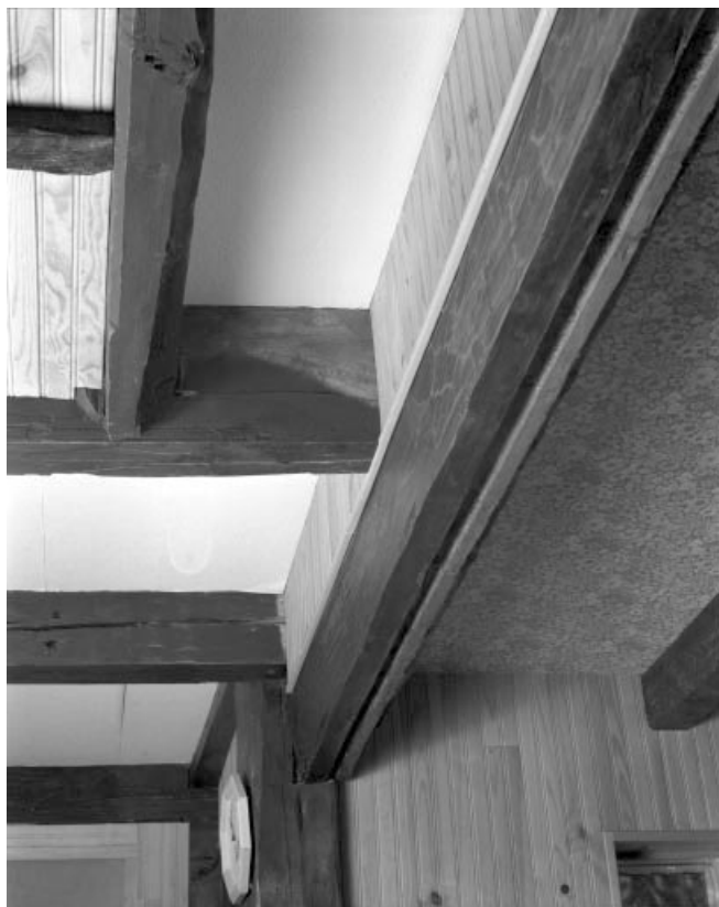
Détail de la rainure de la poutre dans laquelle venait se loger les planches de la cloison en bois, entre la cuisine et la grange. 39, Les Moussières, lieudit : au Montechoux