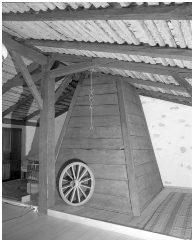
La cheminée en bois dans sa partie située dans la grange haute.

39, Les Moussières, lieudit : au Montechoux