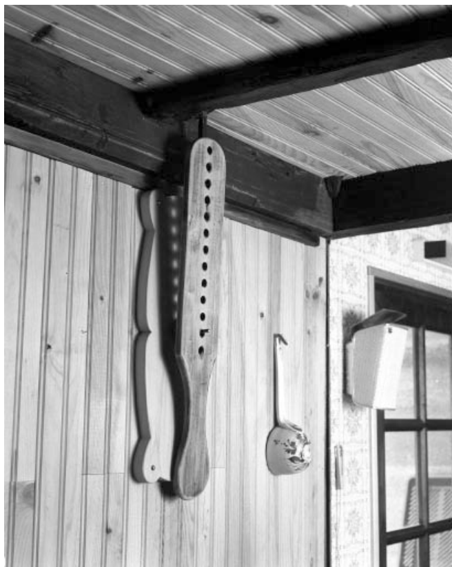
Détail de l'instrument en bois permettant d'ouvrir plus ou moins les volets fermant la cheminée en bois.

39, Les Moussières, lieudit : au Montechoux