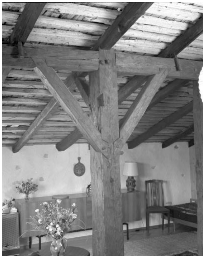
Détail de la charpente : assemblage d'un poteau avec la panne. Il manque une contre fiche dans le plan parallèle à la pente du toit. 39, Les Moussières, lieudit : au Montechoux