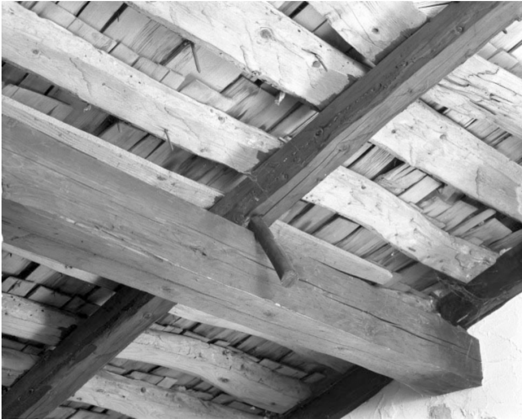
Détail d'une cheville en bois empêchant les chevrons de glisser.

39, Les Moussières, lieudit : au Montechoux