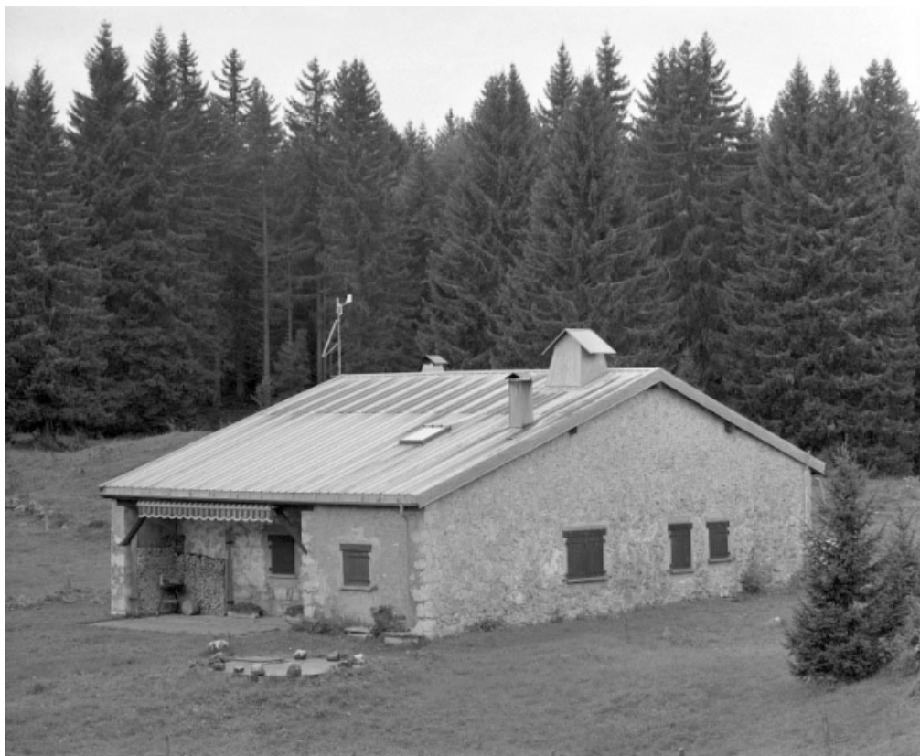
Façade antérieure et face droite.