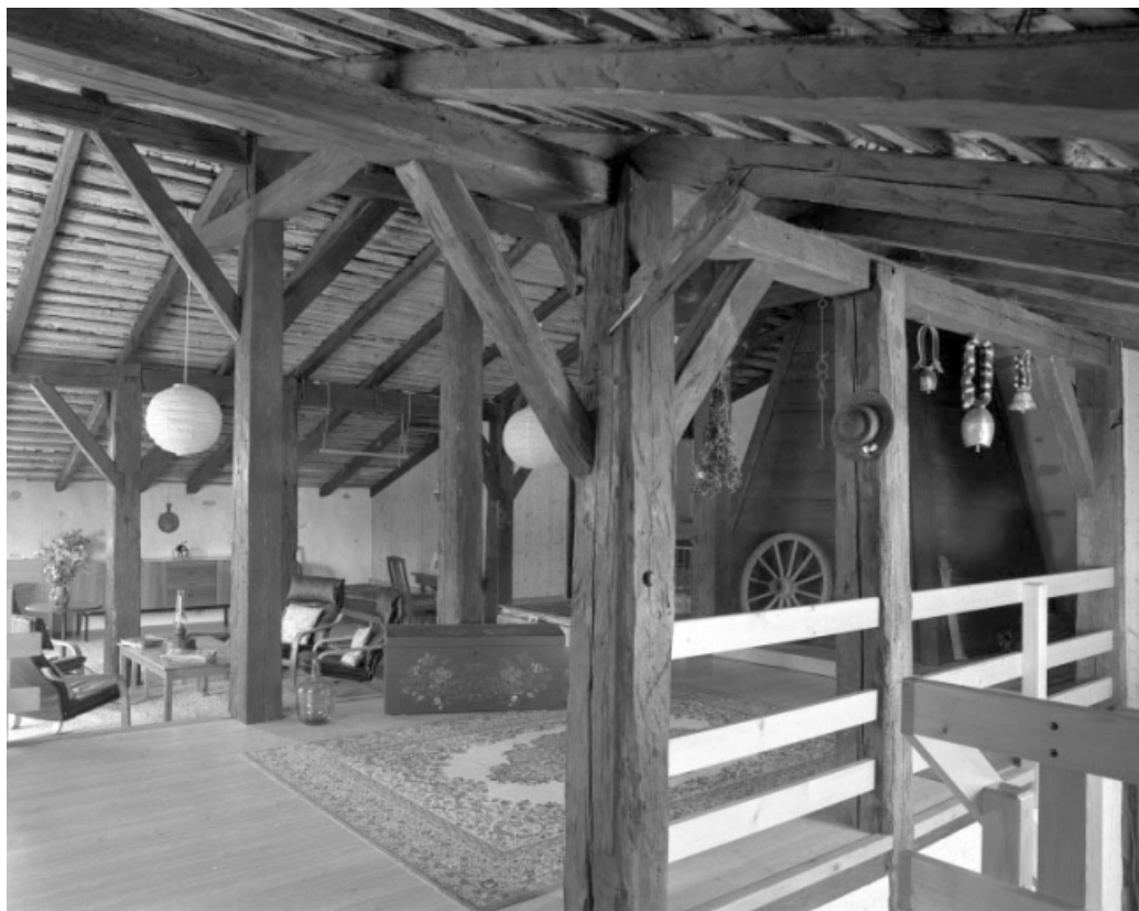
La grange haute : vue générale de la charpente sur poteaux.

39, Les Moussières, lieudit : au Montechoux