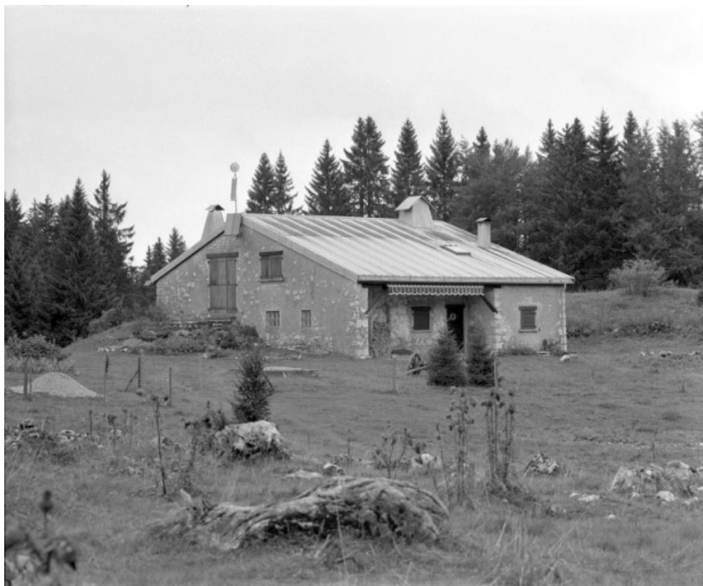
Façade antérieure et face gauche.