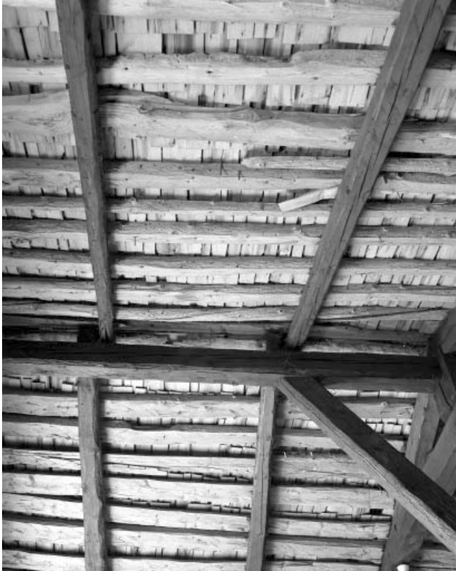
Détail de la couverture depuis la grange haute : les tavillons sont encore posés sous la couverture en tôle actuelle. 39, Les Moussières, lieudit : au Montechoux