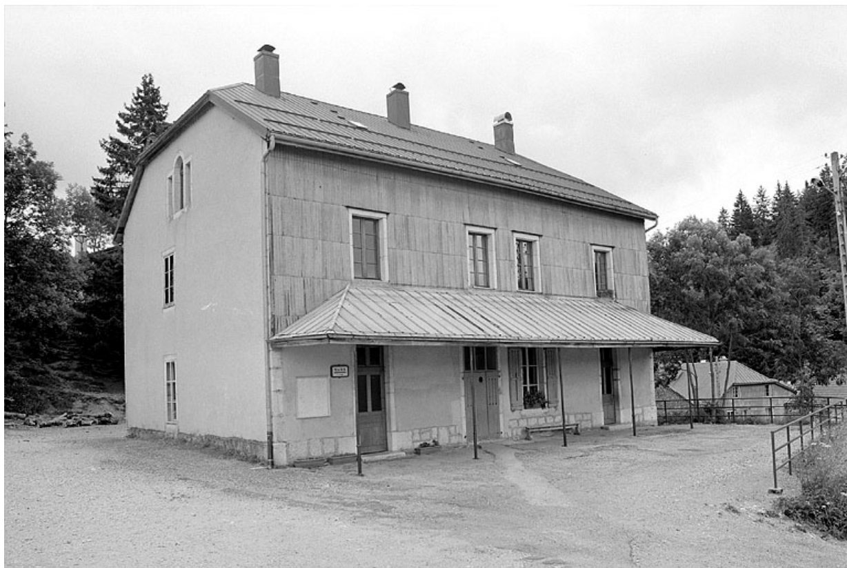
Façade antérieure et face gauche.