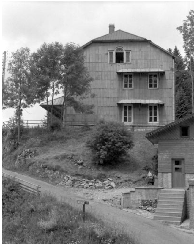
Face droite depuis le Chemin Départemental 25. 39, Les Moussières