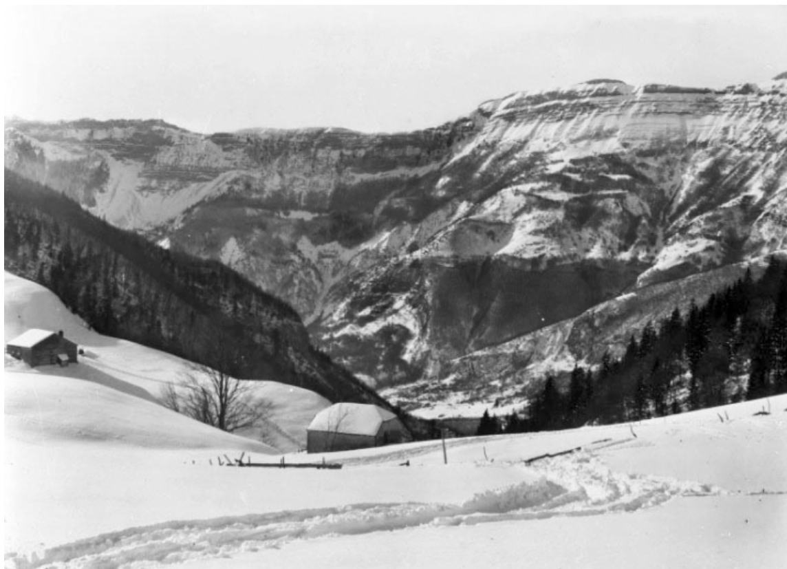
Vue sur la vallée de la Valsérine (Ain), depuis la Borne au Lion. 39, La Pesse