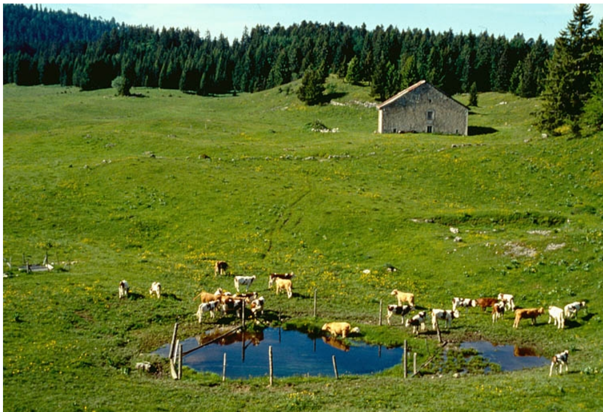
Paysage du Haut-Jura et troupeau de vaches montbéliardes. 39, La Pesse