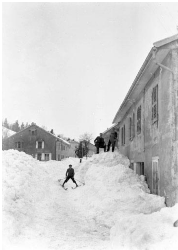
Village sous la neige (la Pesse).