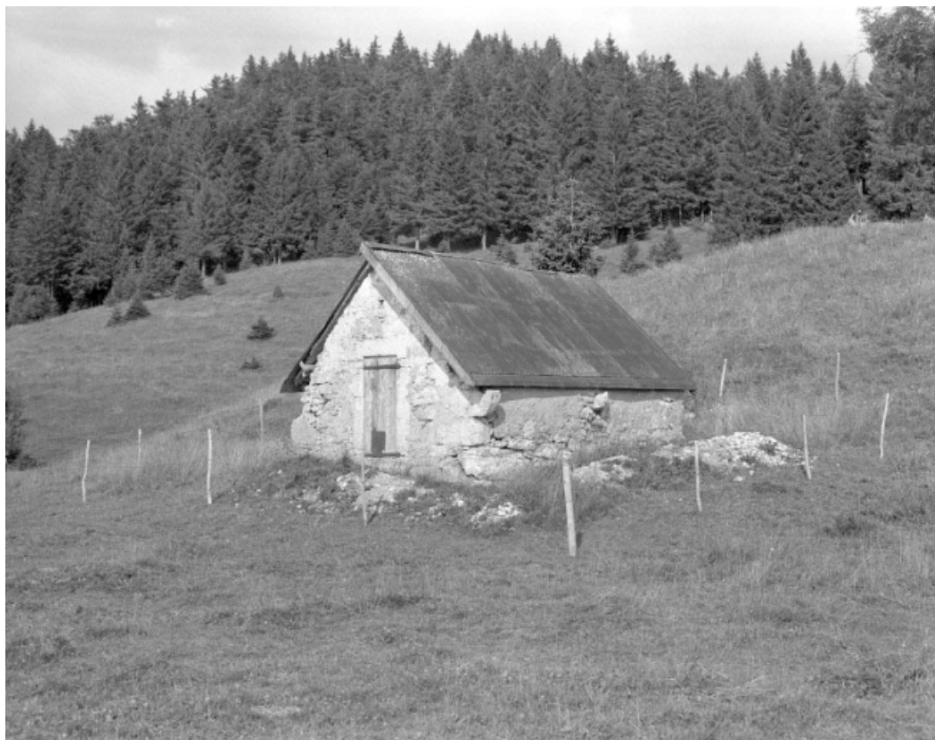
Grenier fort au Pas Rouge.