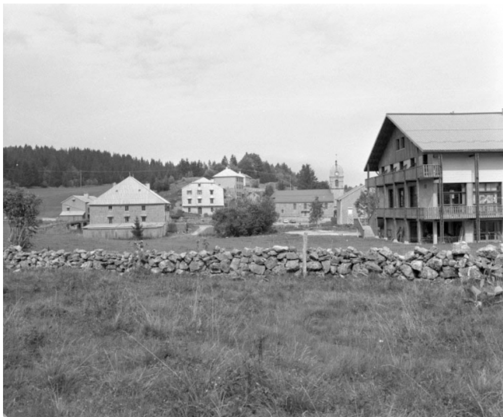
Le village de la Pesse depuis la route menant à Désertin.