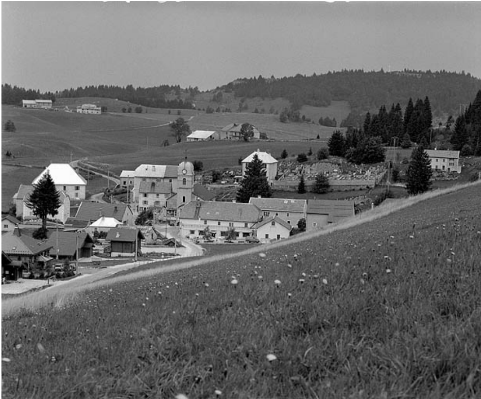
Le village de la Pesse, vue rapprochée.