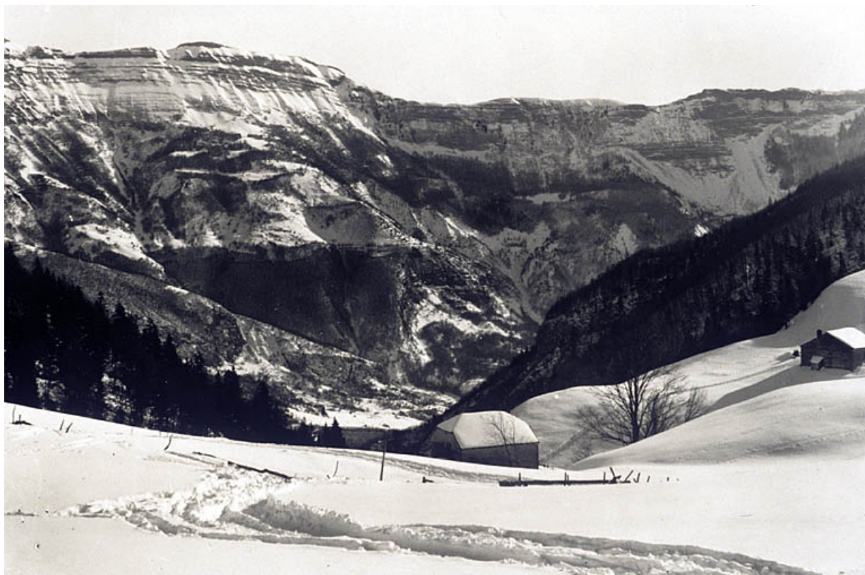
Vue sur la vallée de la Valserine (Ain), depuis la Borne au Lion. 39, La Pesse