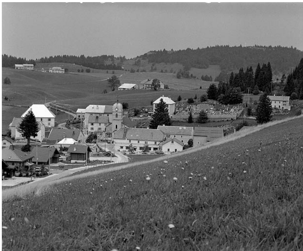
Le village de la Pesse, vue rapprochée.