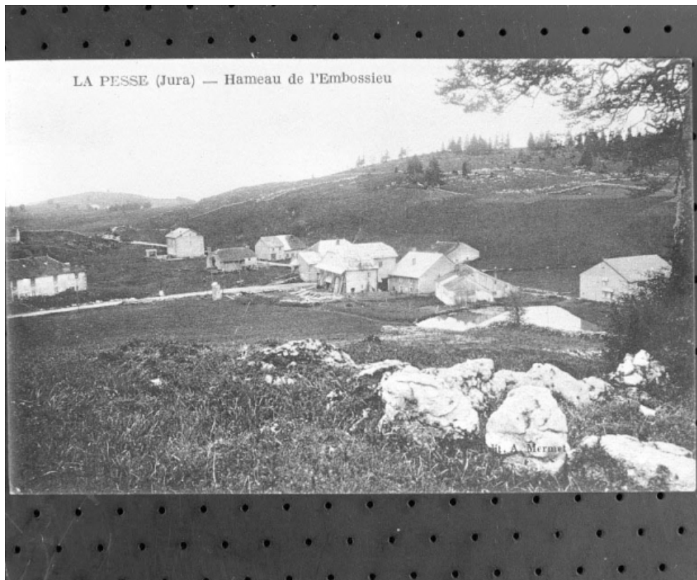
Le hameau de l'Embossieu.