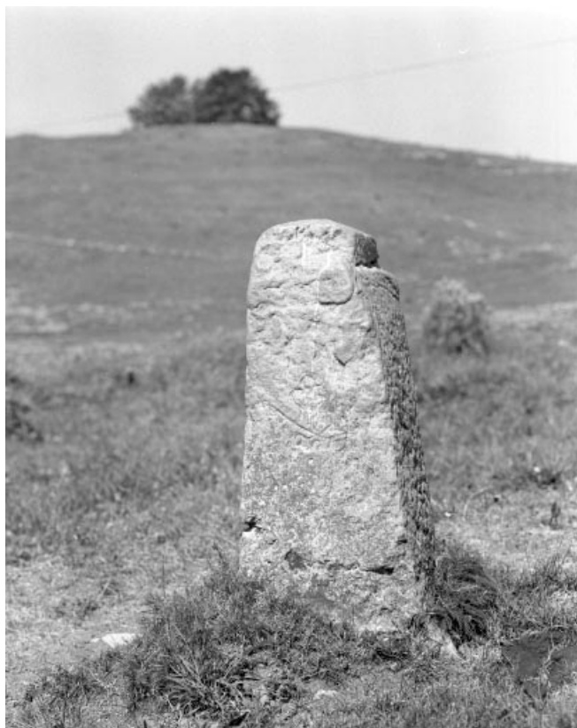
Borne du Nerbier, face orientée vers le Royaume de France.