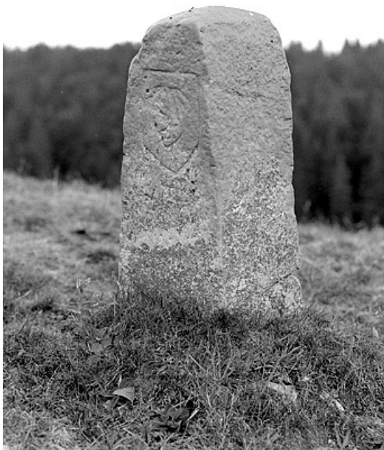
Borne du Nerbier, face orientée vers la Franche-Comté.