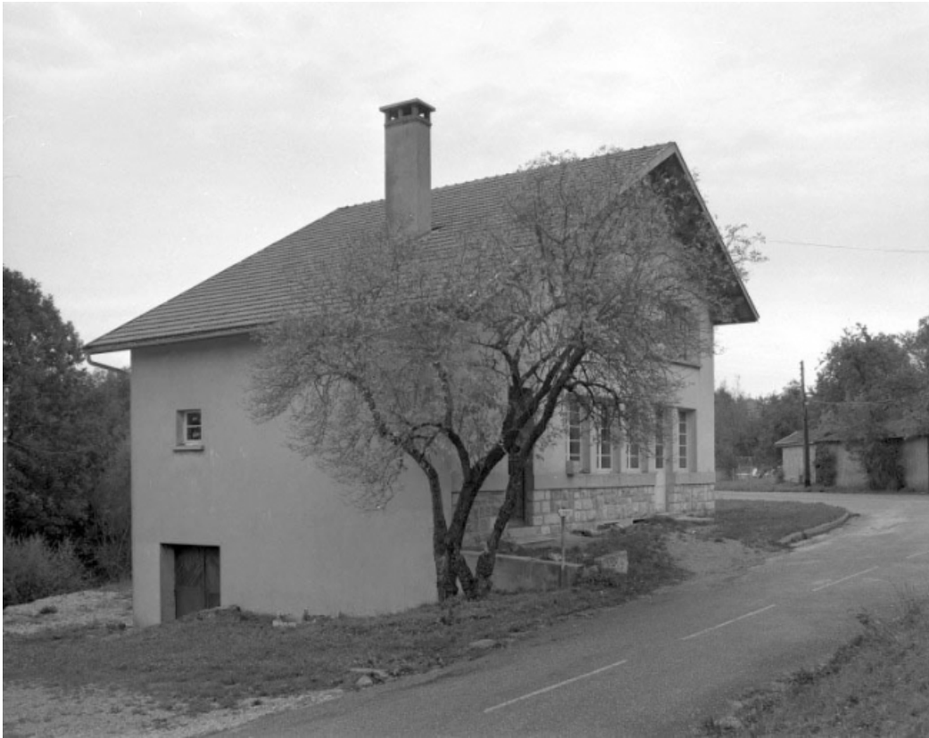
Façade antérieure et face gauche.