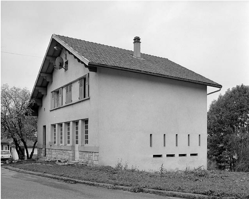
Façade antérieure et face droite.