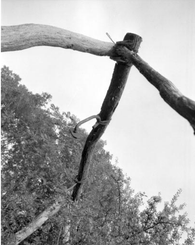
Détail des crochets retenant les câbles qui permettaient de descendre le lait jusqu'à la fromagerie. 39, Larrivoire