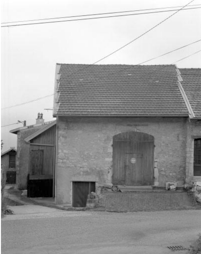
Façade postérieure de la ferme, sur la rue.