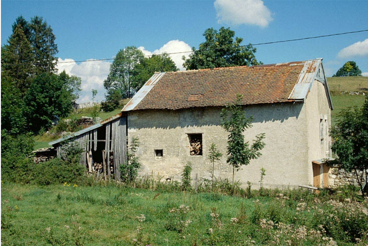
L'ancien chalet de fromagerie de Viry.