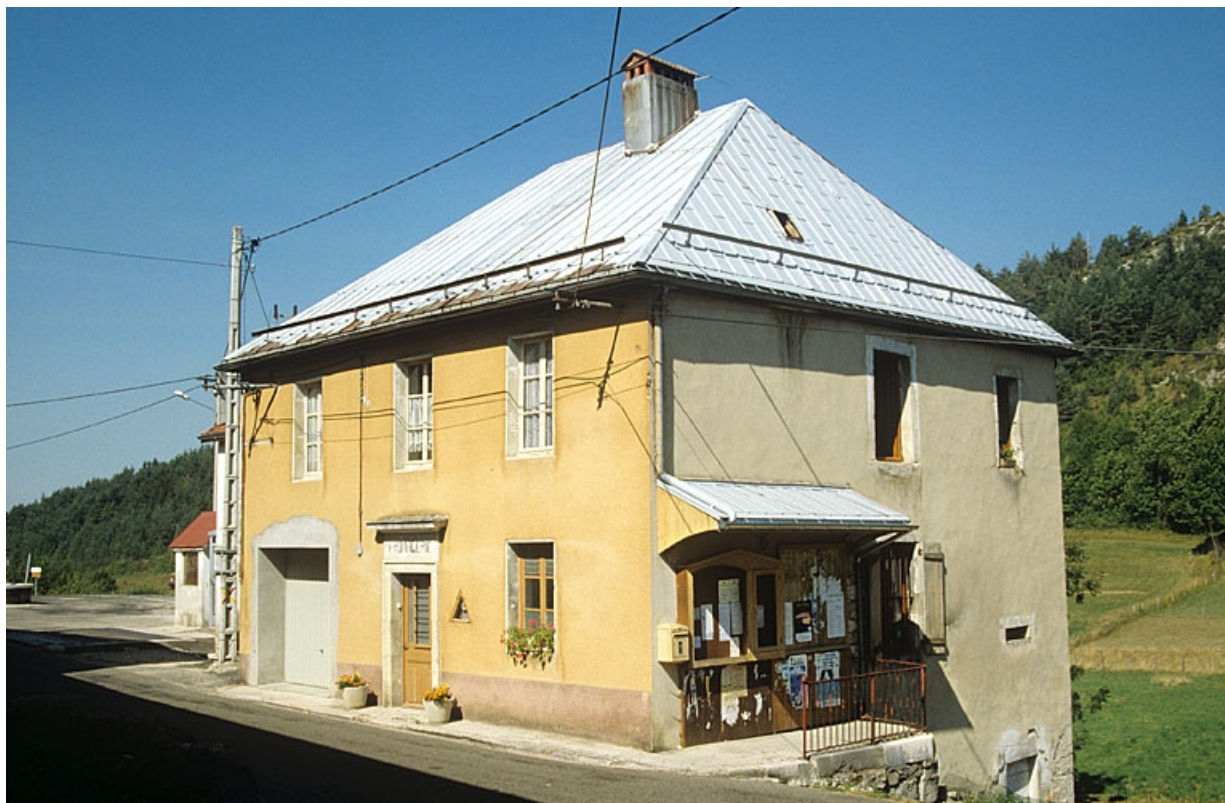
La Mairie-Ecole-Fromagerie de Choux.