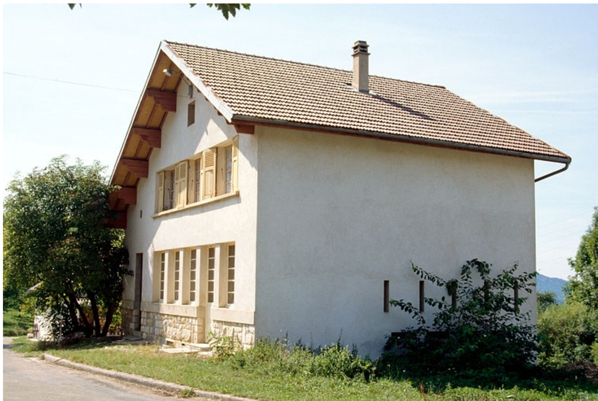
La fromagerie de Larrivoire reconstruite après-guerre.