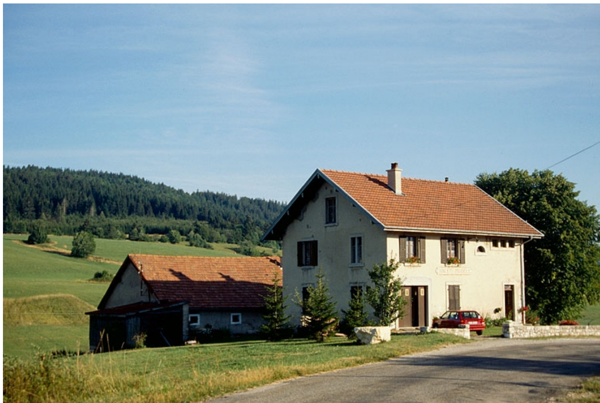
La fromagerie de Désertin, sur la commune des Bouchoux.