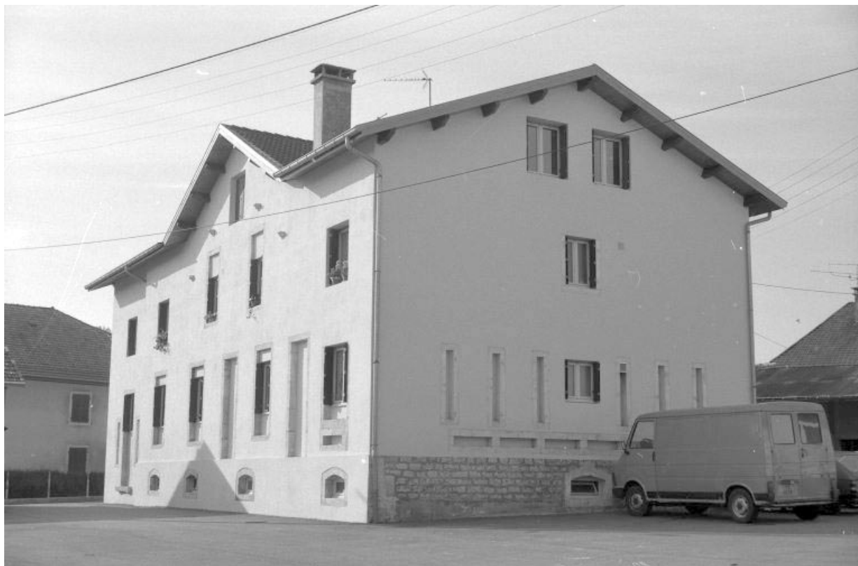
Le chalet modèle de Viry, façade postérieure et face gauche.