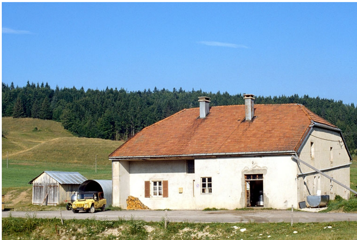
La fromagerie de Bellecombe, à Boulème, installée dans une ancienne ferme.