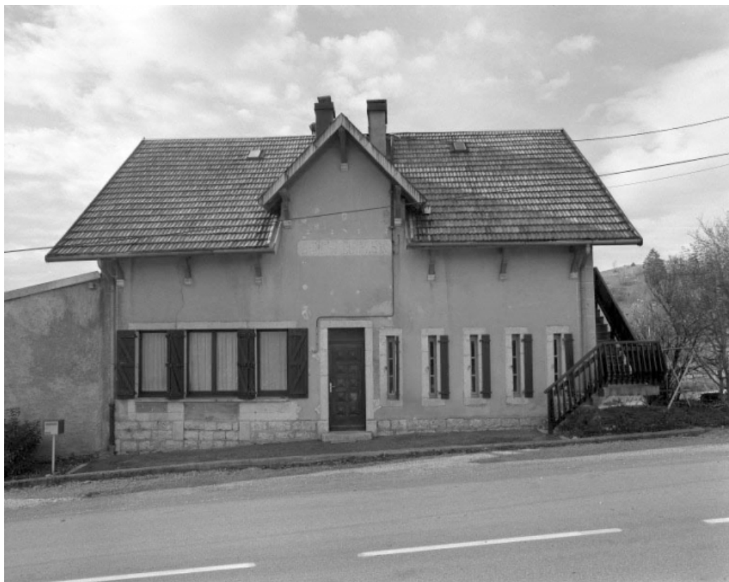
Façade antérieure du chalet du Rosay.