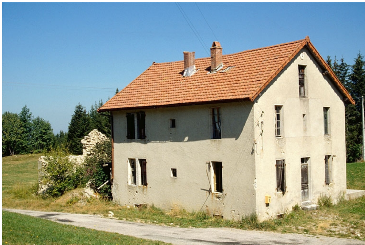
La fromagerie de sur la Roche, sur la commune des Bouchoux.