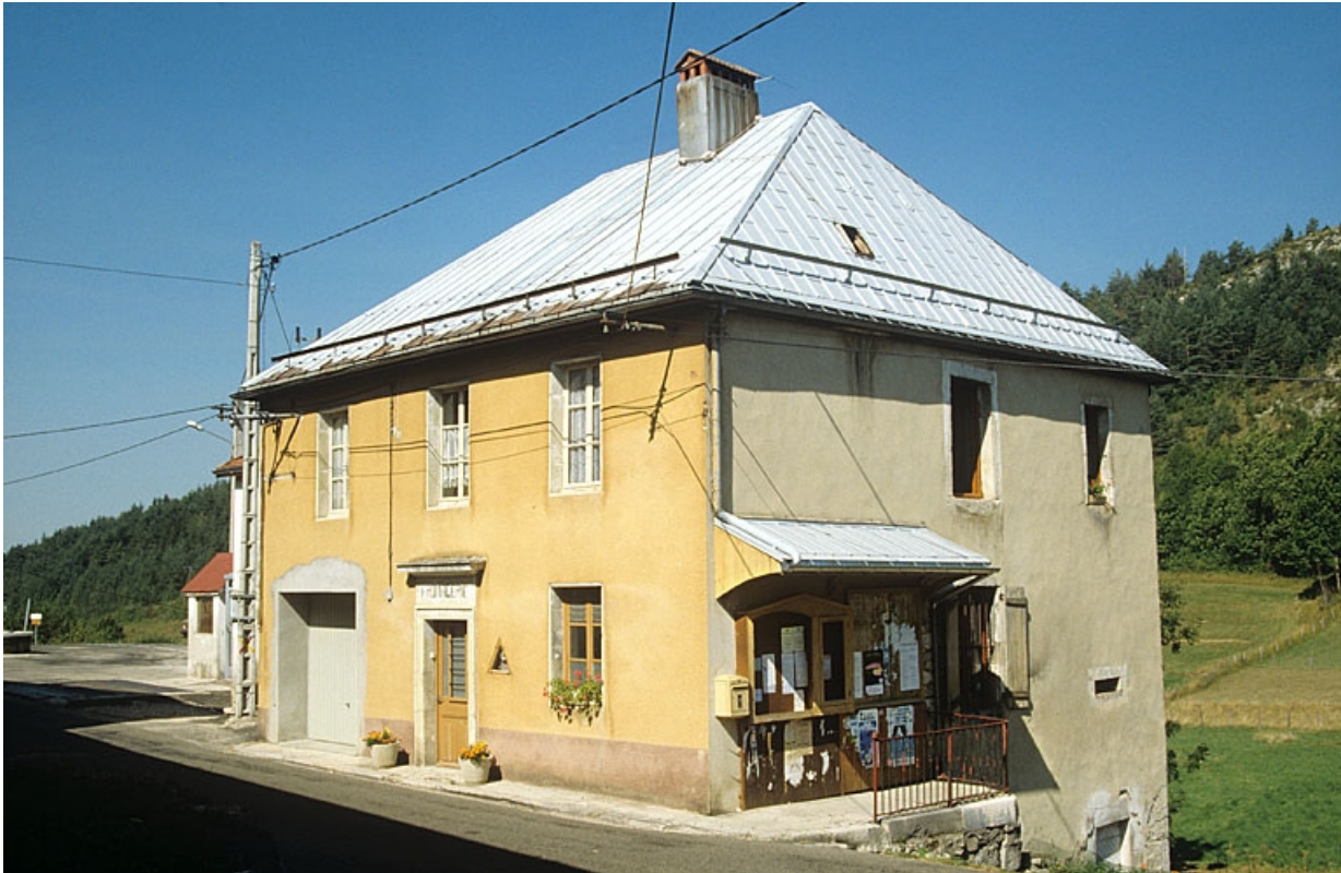
La Mairie-Ecole-Fromagerie de Choux.