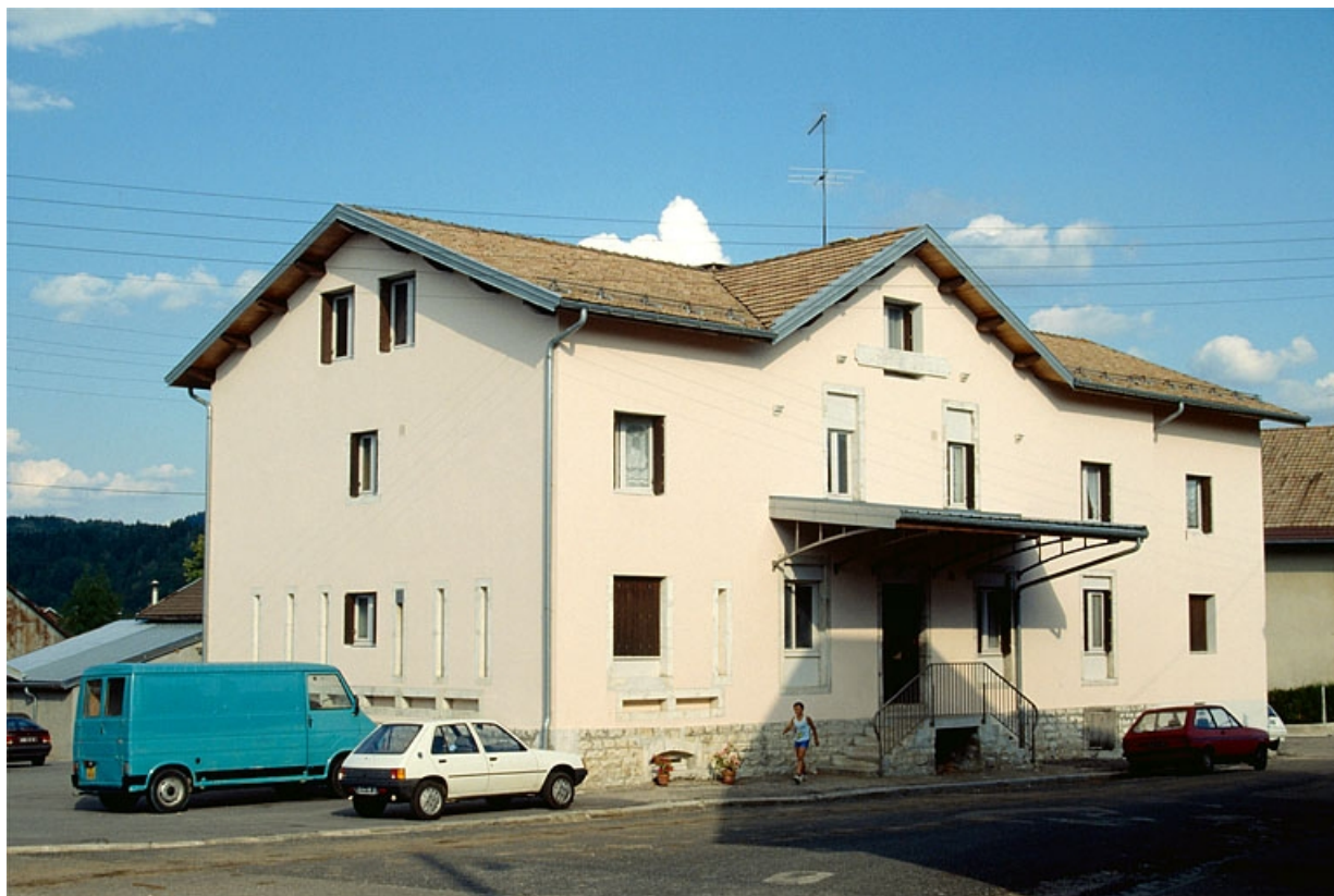
Le chalet modèle de Viry, façade antérieure et face gauche.