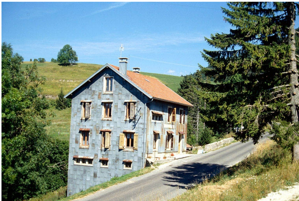
La fromagerie des Bouchoux.