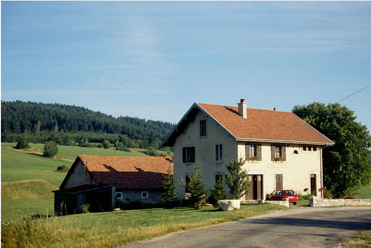
La fromagerie de Désertin, sur la commune des Bouchoux.