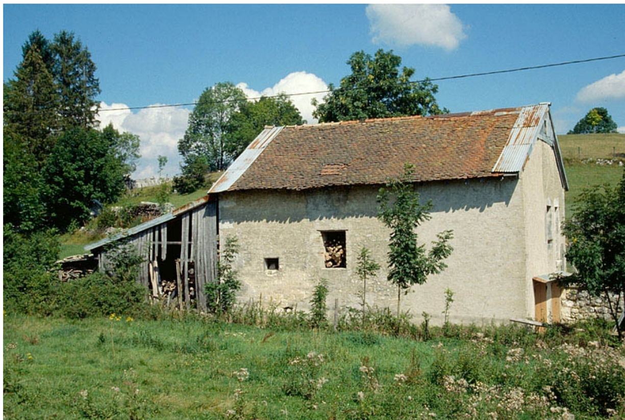
L'ancien chalet de fromagerie de Viry.