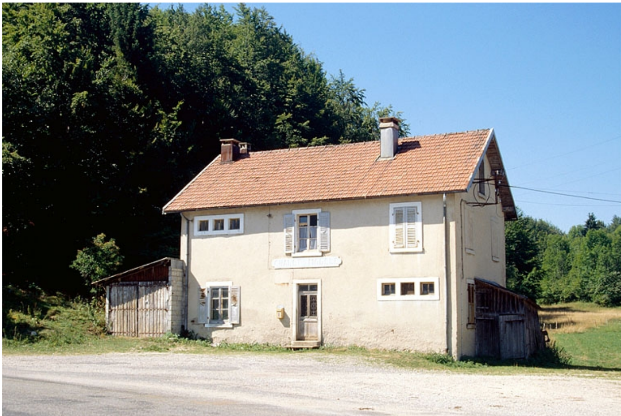
La fromagerie de la Tailla, sur la commune des Bouchoux.