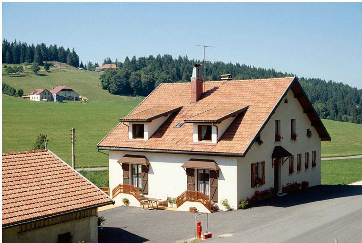
La fromagerie des Moussières transformée en logement.