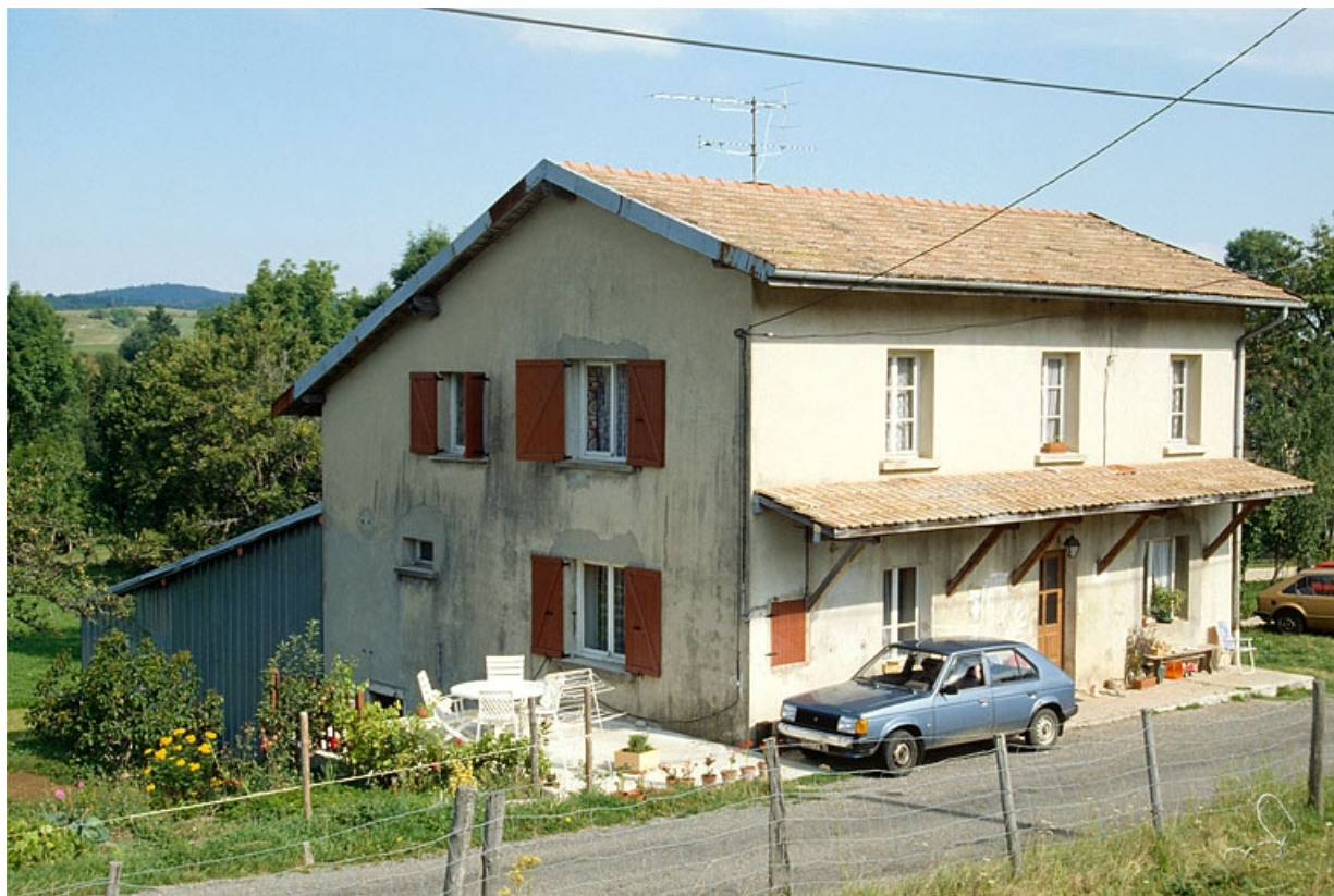
La fromagerie de la Tour sur la commune de Viry.