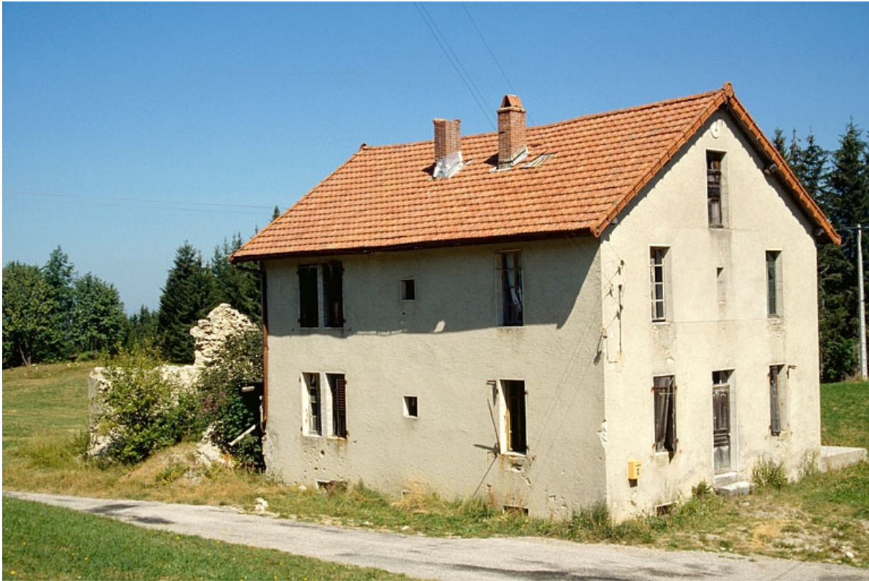
La fromagerie de sur la Roche, sur la commune des Bouchoux.