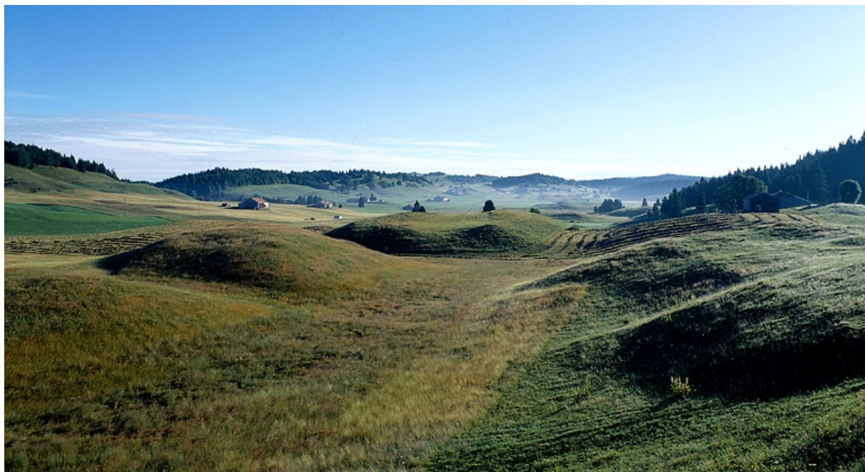
Paysage de combes.