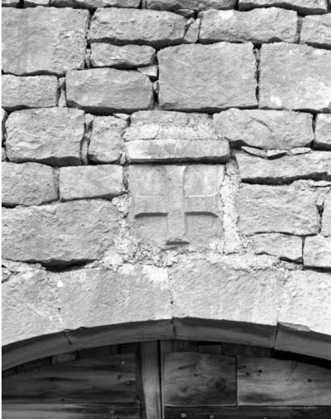
Les Bouchoux, ferme située au lieu-dit La Combe de Léary : écusson situé au-dessus de la porte cochère.