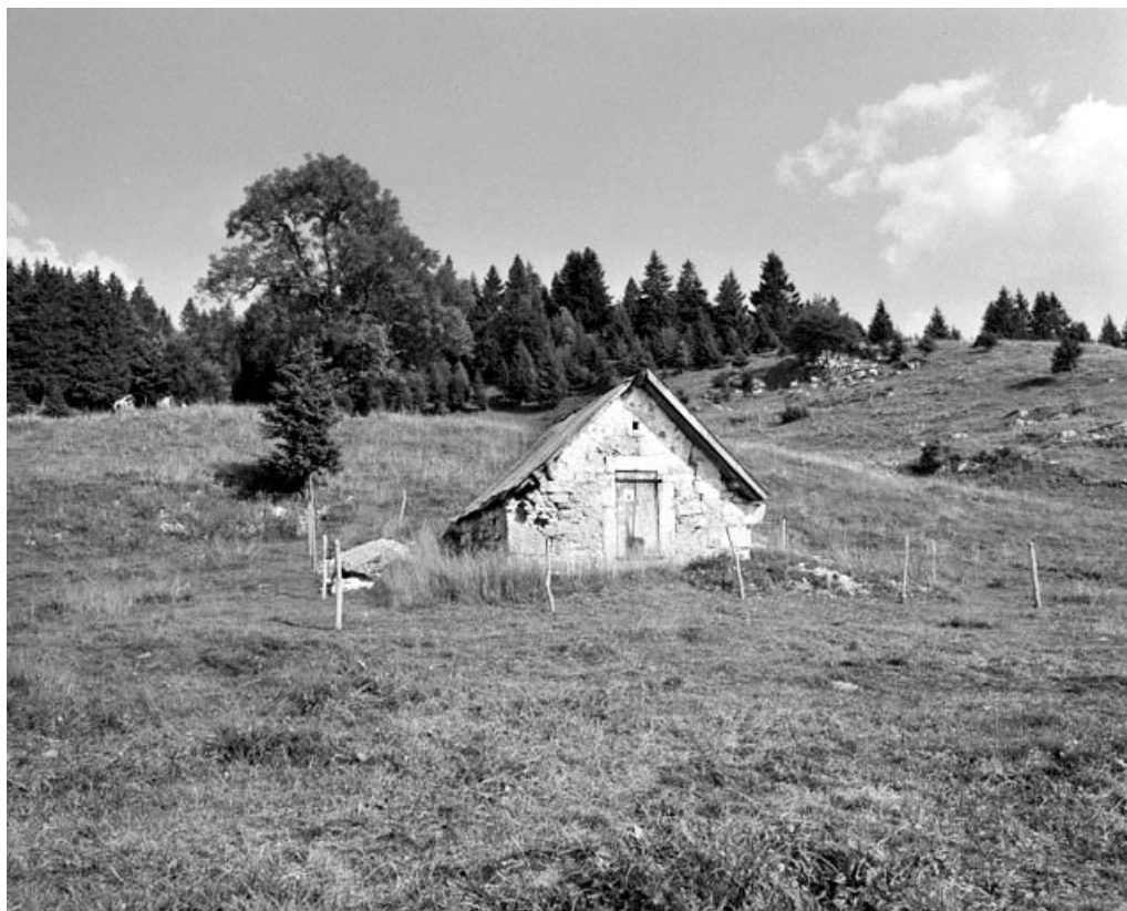
La Pesse : grenier fort situé au lieu-dit Le Pas Rouge.