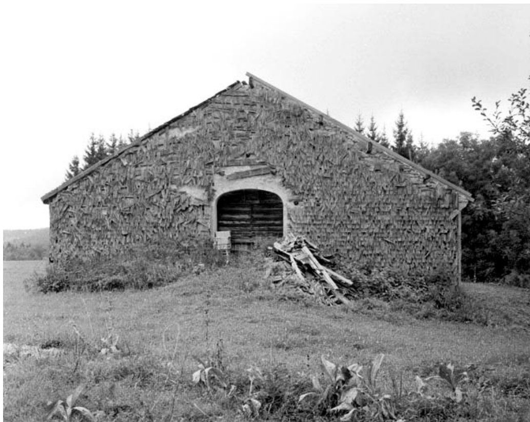
Les Bouchoux, ferme située au lieu-dit Sur Beau Regard : face gauche d'une ferme couverte d'un essentage de tavaillons.