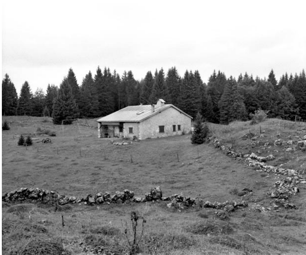
Les Moussières, ferme située au lieu-dit Montechoux : ferme appelée «loge», vue d'ensemble.