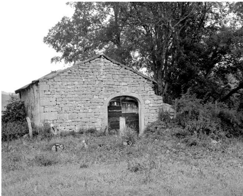
Les Bouchoux, ferme située au lieu-dit La Combe de Léary : pignon d'une ancienne ferme avec appareillage soigné.