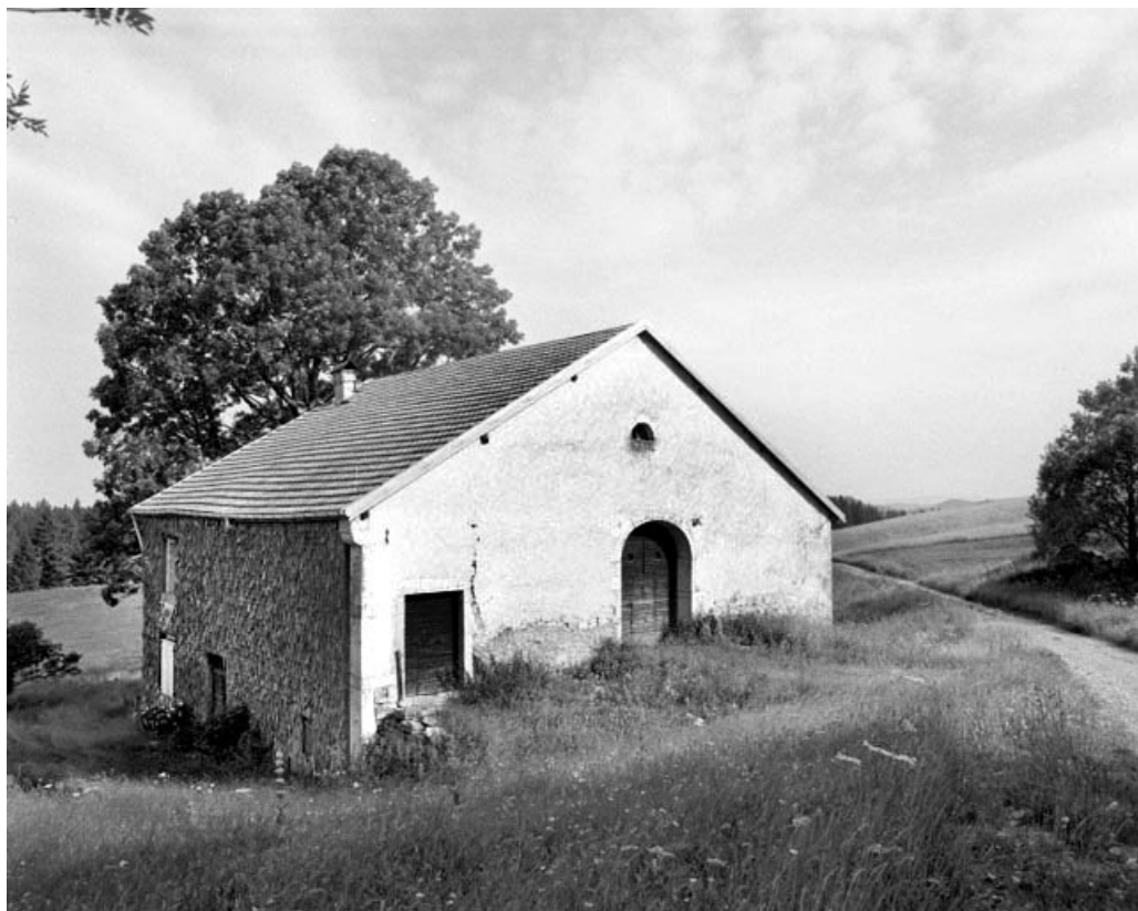
La Pesse, ferme située au lieu-dit Le Reculet : accès à la grange haute par le terrain naturel.