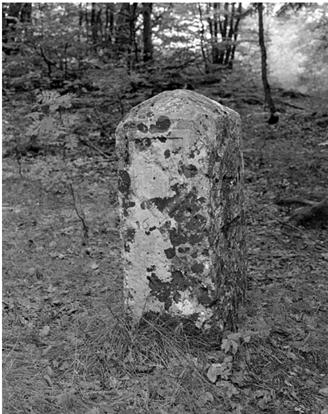
Armes de Franche-Comté.