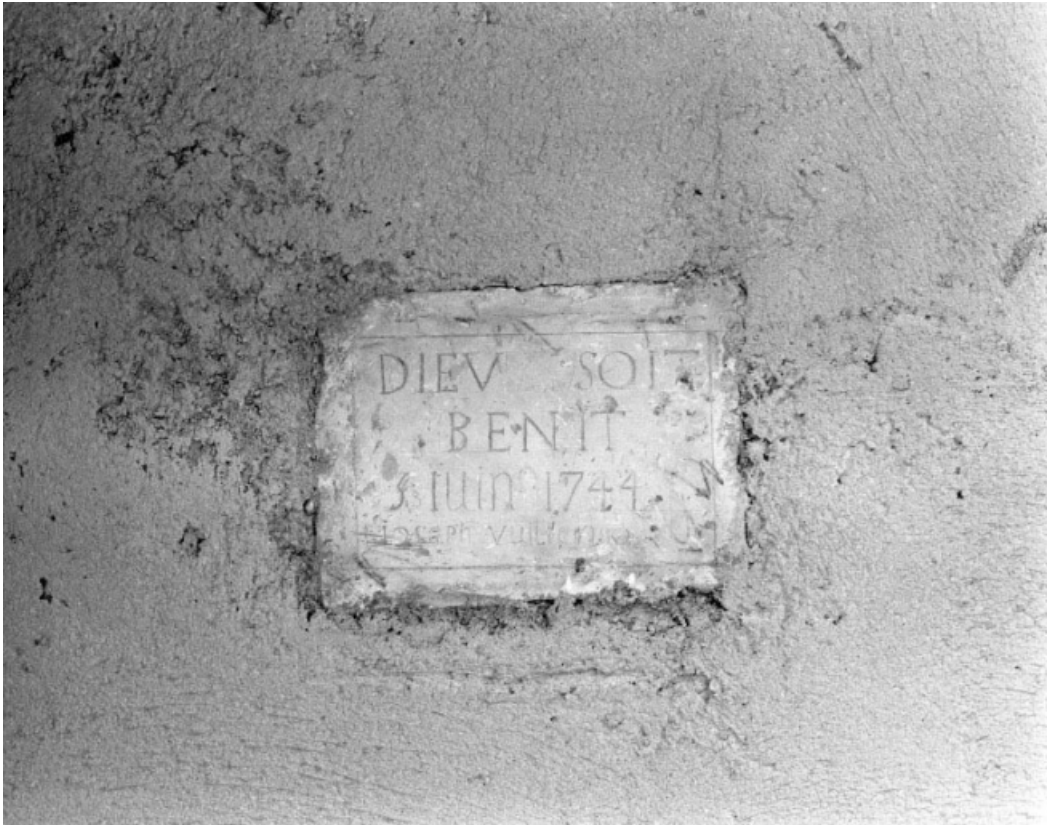
Détail de la plaque avec inscription au-dessus du linteau de l'accès au logis.