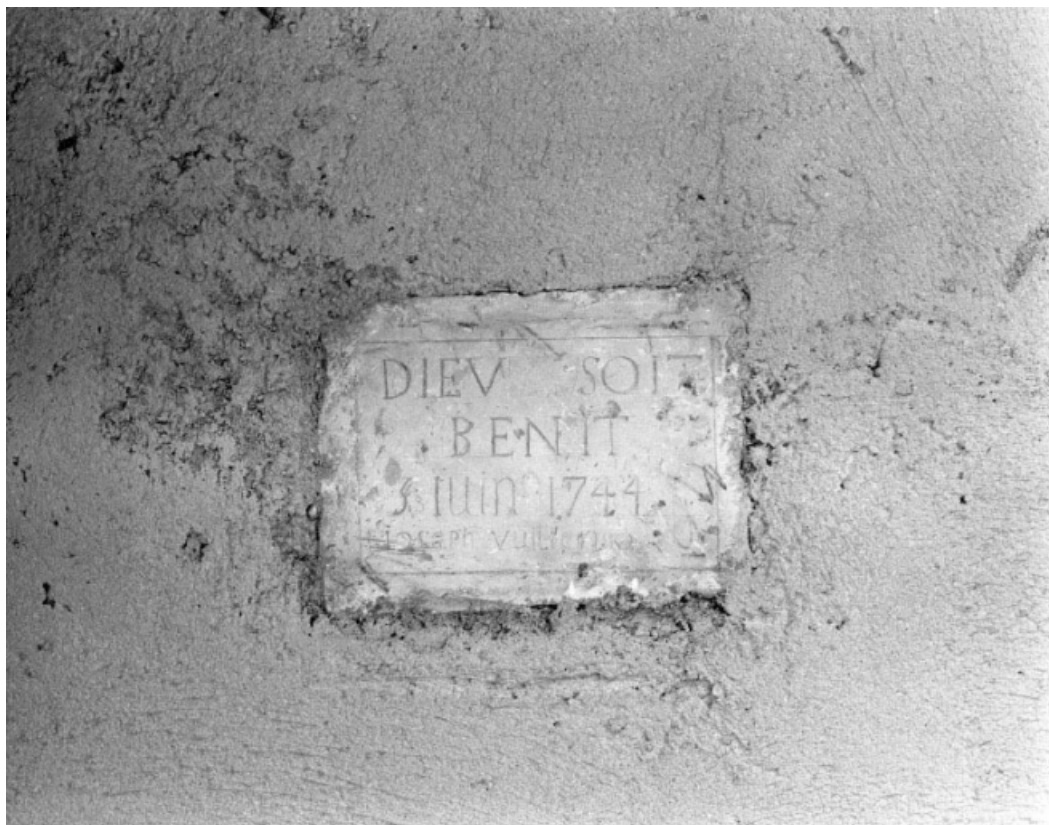
Détail de la plaque avec inscription au-dessus du linteau de l'accès au logis.