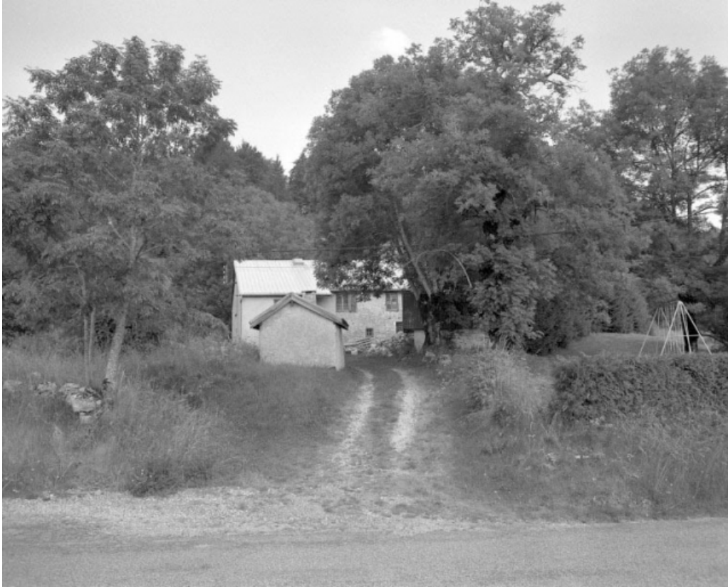
Vue générale de la ferme avec au premier-plan le fournil.