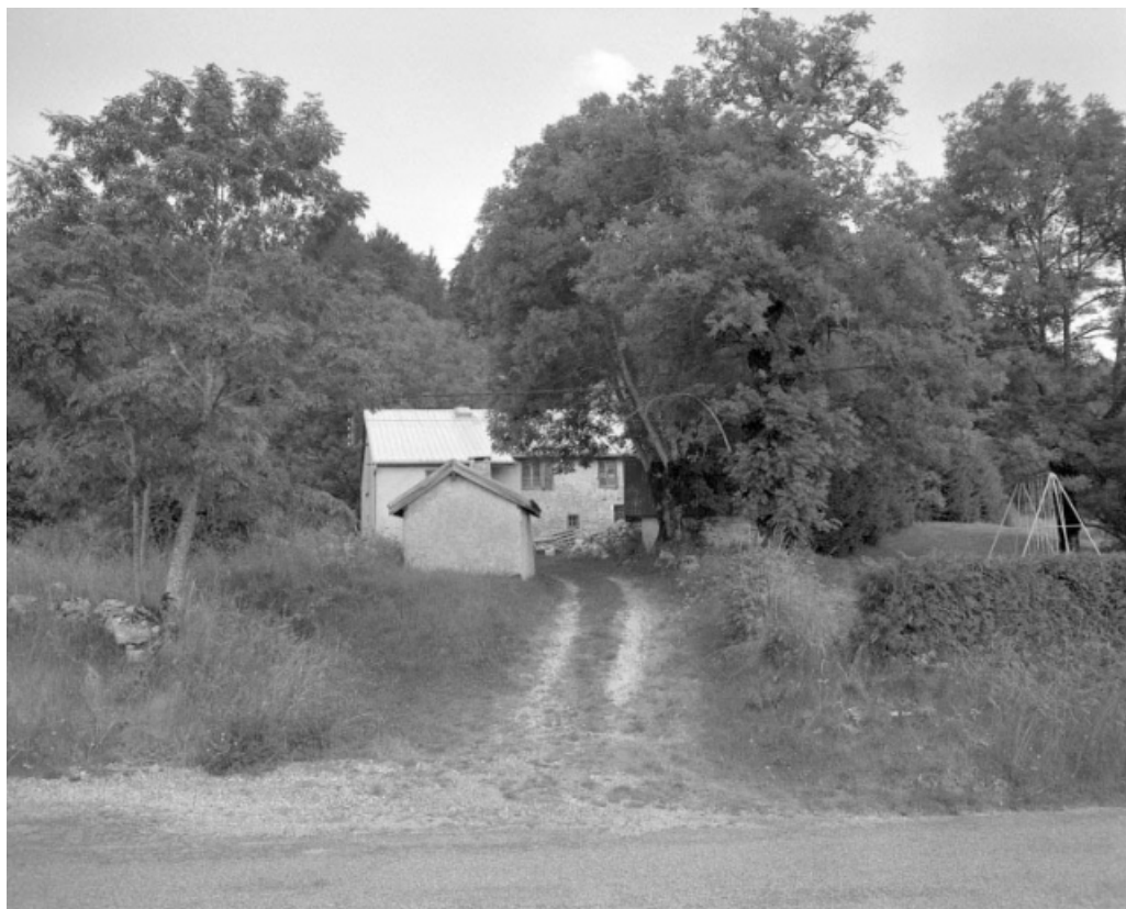
Vue générale de la ferme avec au premier-plan le fournil.