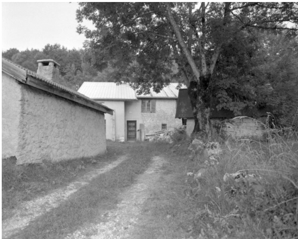
Façade antérieure avec en premier-plan, le fournil à gauche et le grenier fort, à droite.