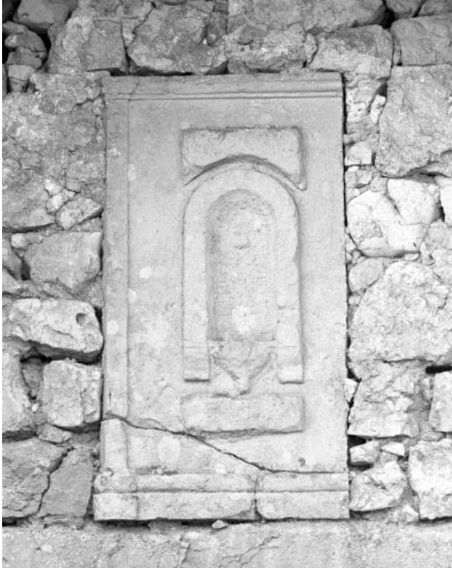
La niche au-dessus de la porte du grenier fort.