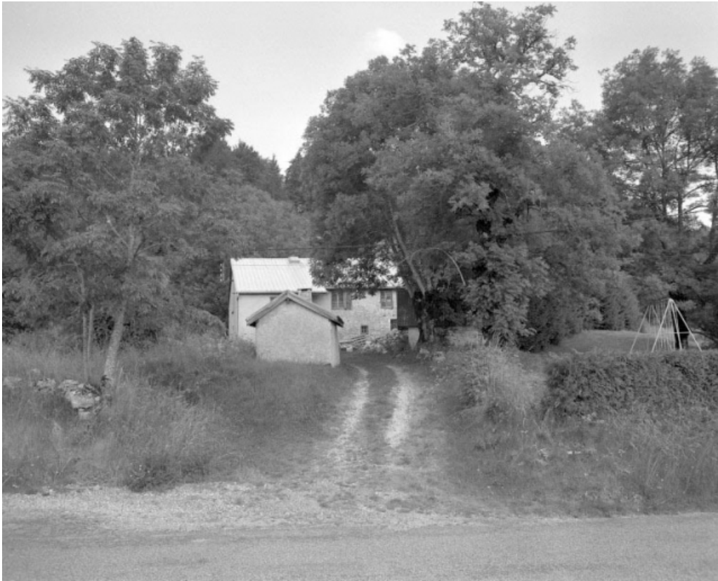
Vue générale de la ferme avec au premier-plan le fournil.