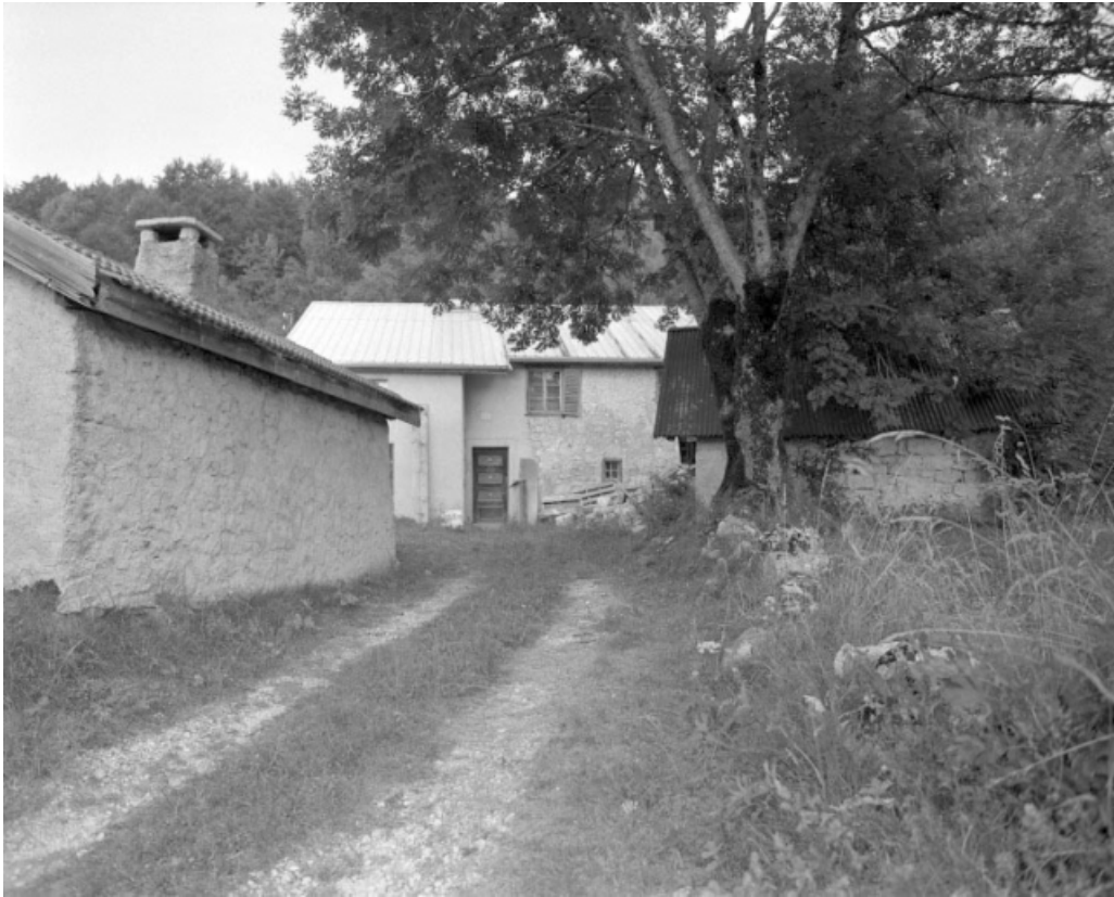
Façade antérieure avec en premier-plan, le fournil à gauche et le grenier fort, à droite.