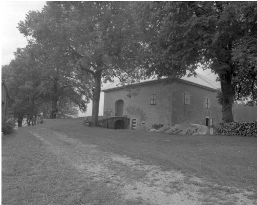
Façade postérieure et face latérale gauche.