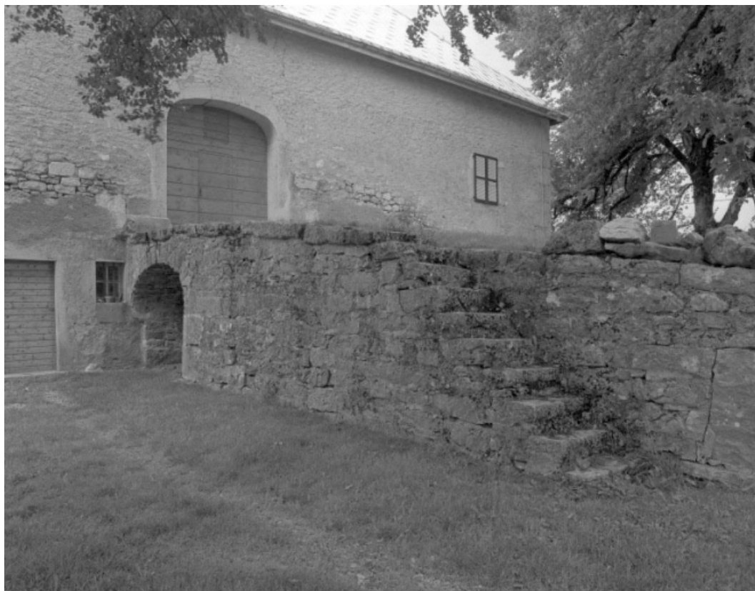
Façade postérieure avec accès à l'étable et à la grange haute par un pont de grange.