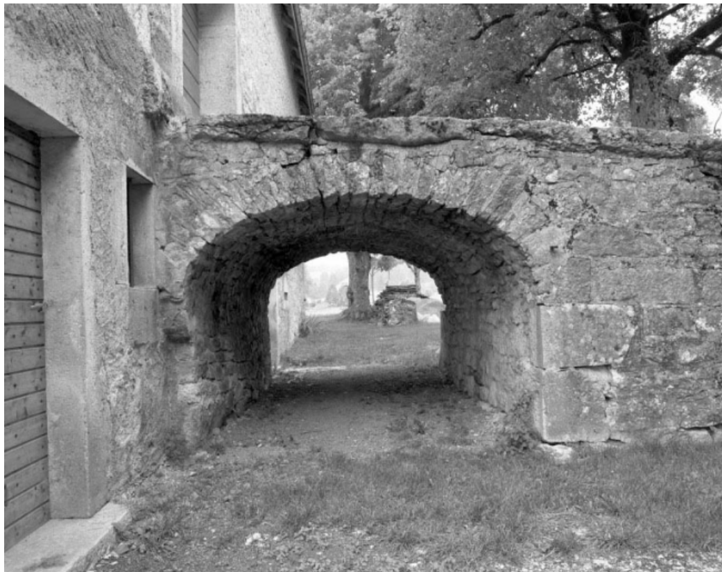
Détail du pont de grange sur la façade postérieure.