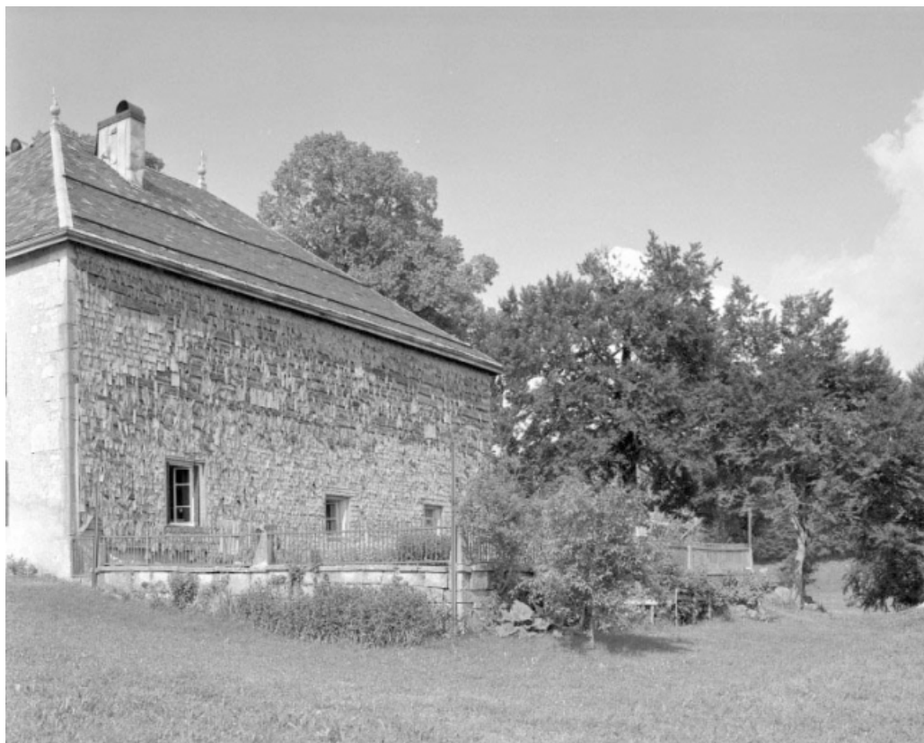
Face latérale droite et jardin.