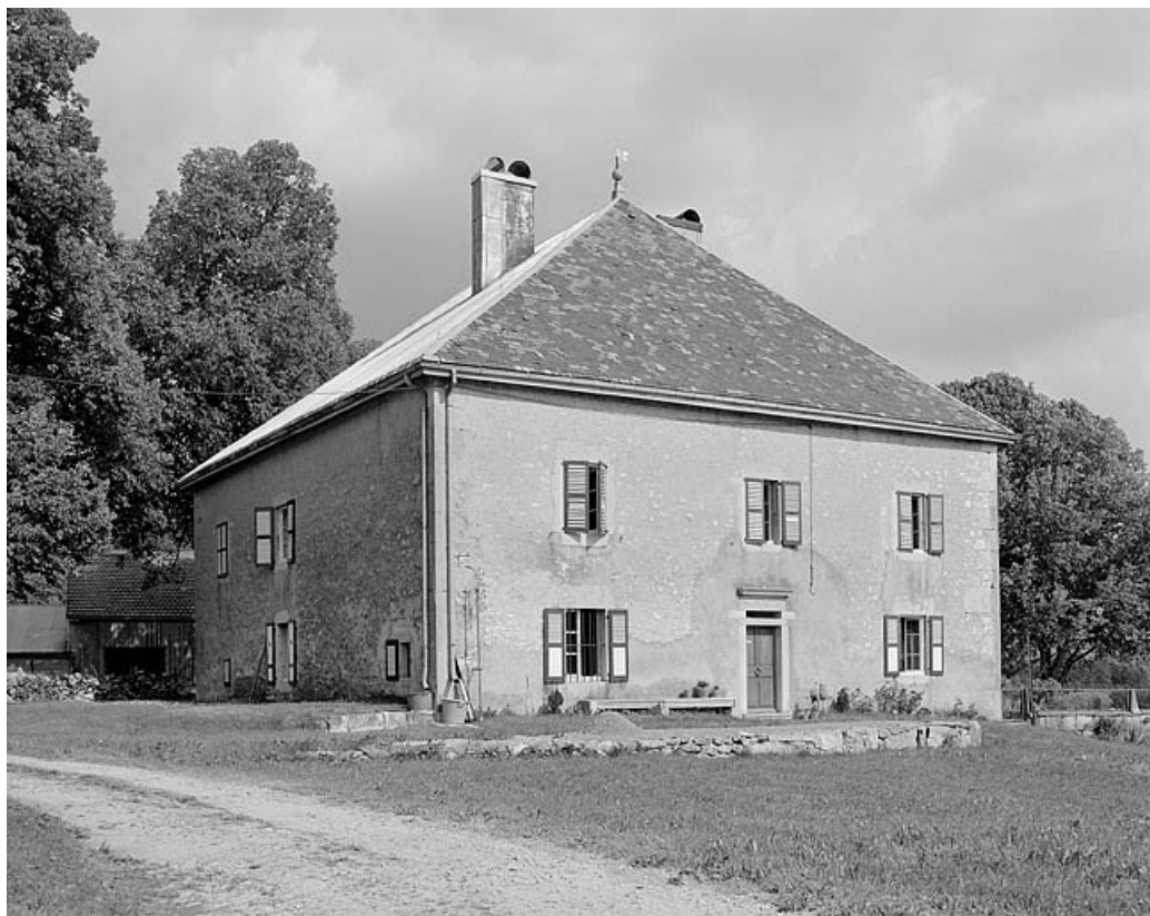
Façade antérieure et face latérale gauche.