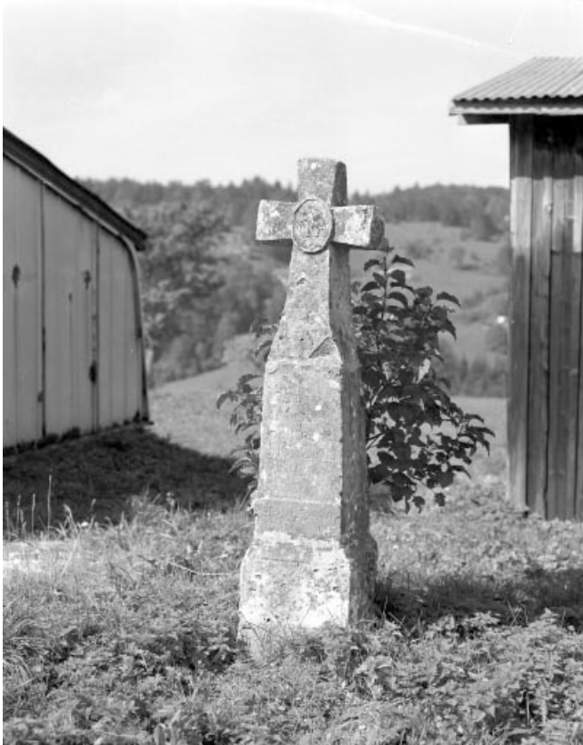
Vue générale de face.

39, Les Bouchoux, lieudit : Très-la-Ville