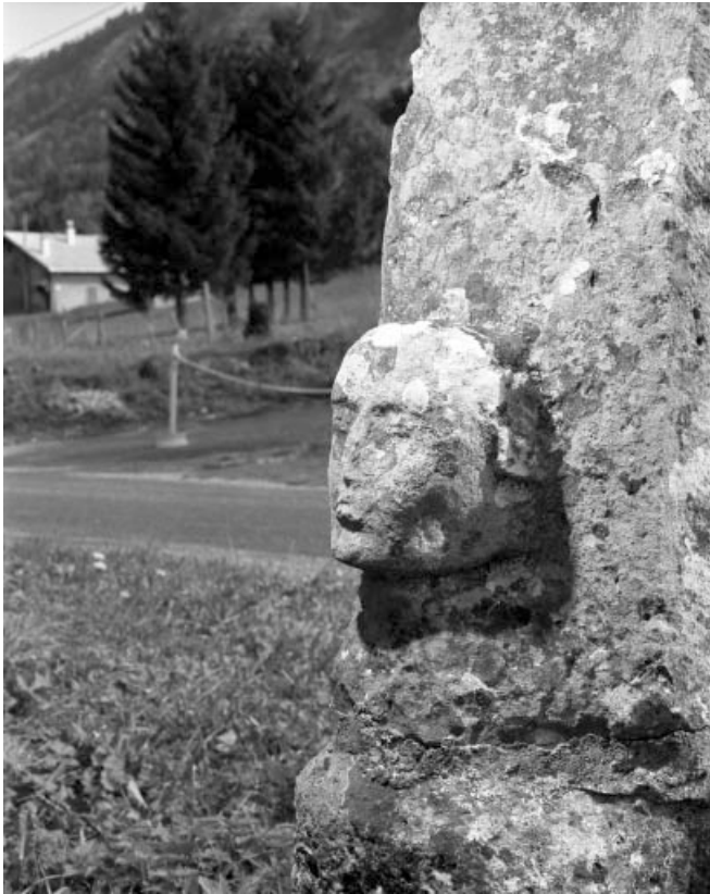
Tête sculptée sur la face postérieure de la croix, vue de profil.

39, Les Bouchoux, lieudit : Très-la-Ville