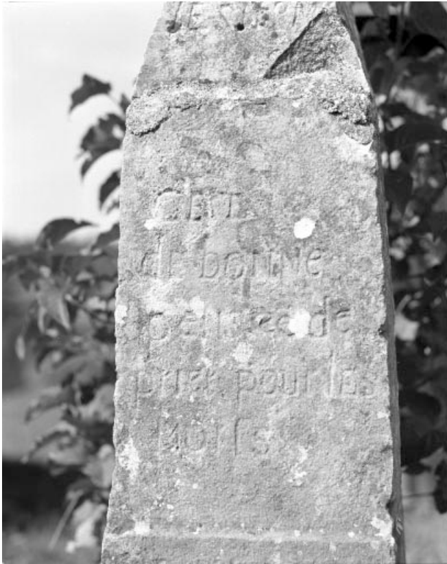
Inscription sur la face de la croix.

39, Les Bouchoux, lieudit : Très-la-Ville