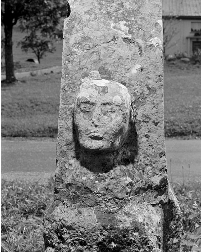
Tête sculptée sur la face postérieure de la croix, vue de face. 39, Les Bouchoux, lieudit : Très-la-Ville