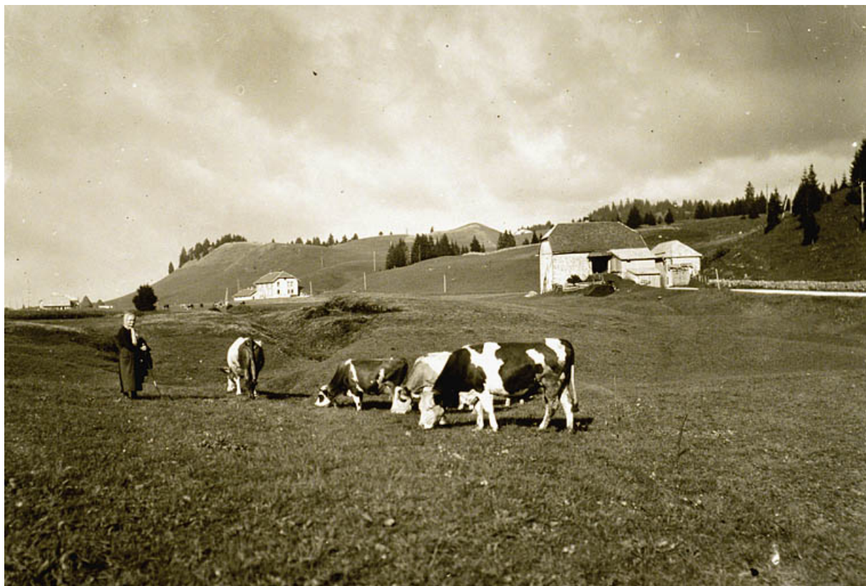
Troupeau de vaches avec la fromagerie des Mouilles en arrière-plan.