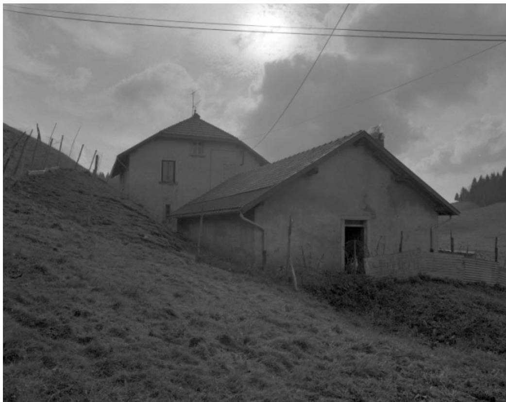
La porcherie et la face gauche de la fromagerie.