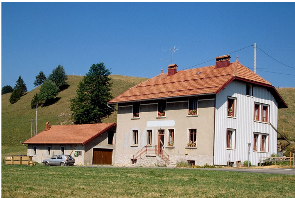
Façade antérieure et face droite de la fromagerie, à gauche la porcherie.