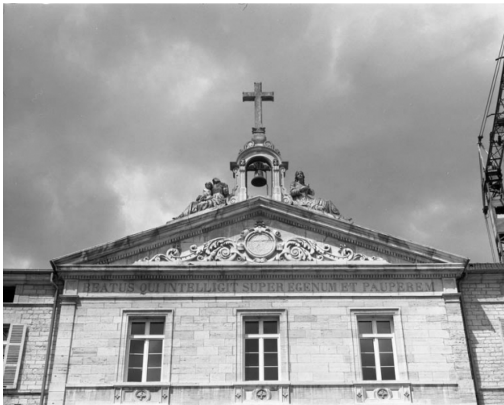
Façade principale : détail du fronton de l'avant-corps central.