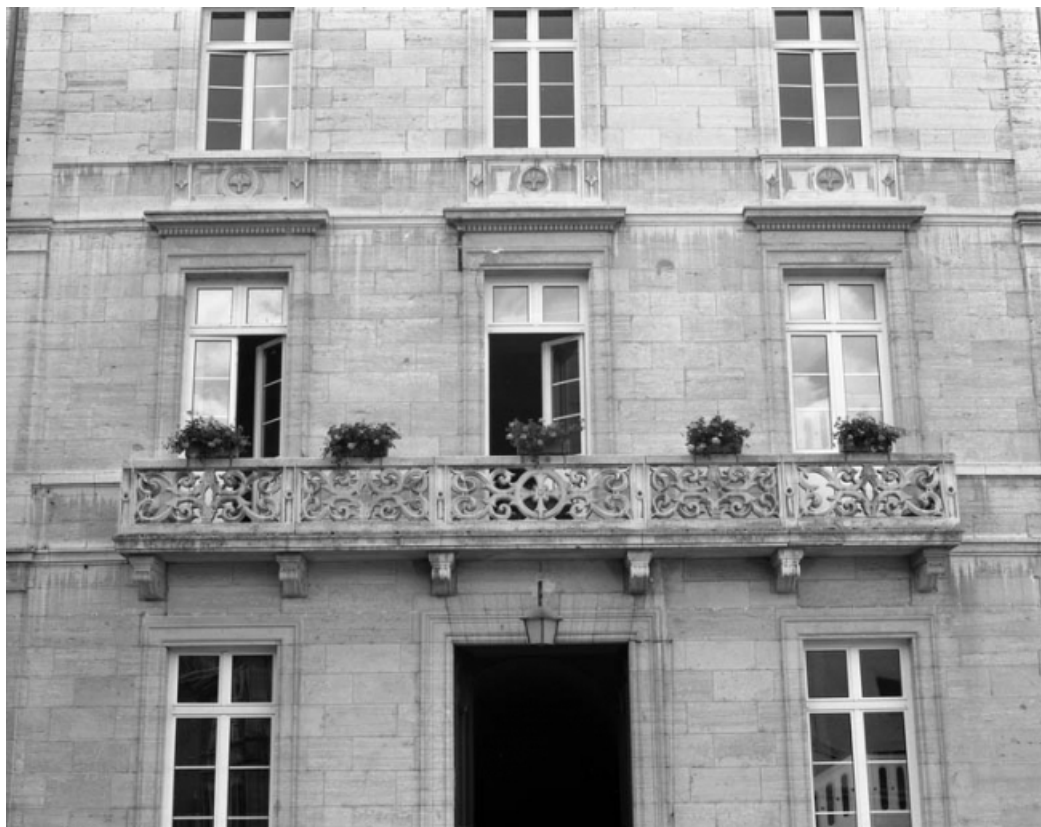
Façade principale : détail des baies du premier étage de l'avant-corps central. 70, Gray Grande Rue 87