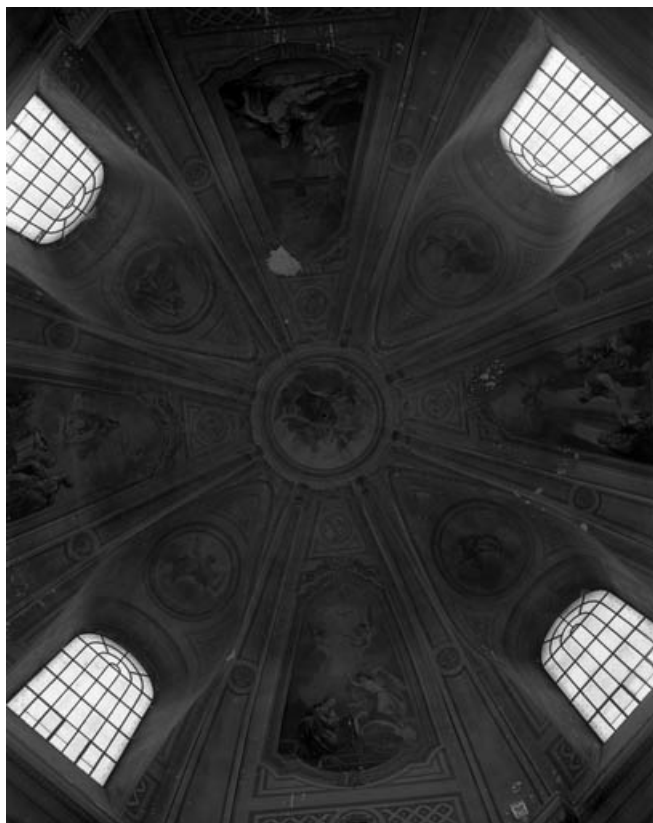
Intérieur : vue de la coupole de la chapelle.