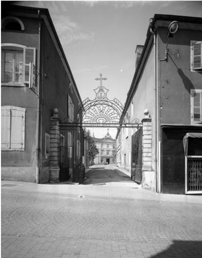
Grille d'entrée de la cour côté Grande Rue : ouverte et de face. 70, Gray Grande Rue 87