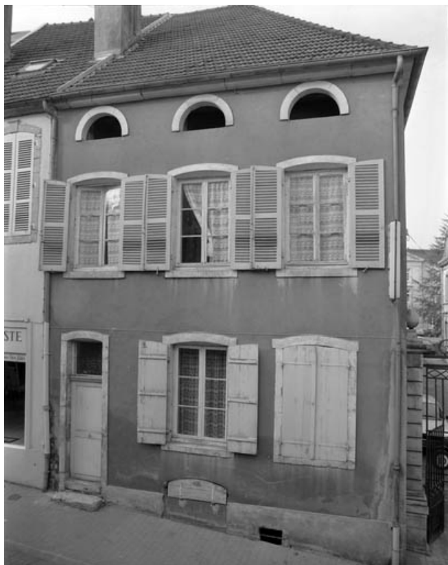
Logement de l'aumonier : façade antérieure de face.