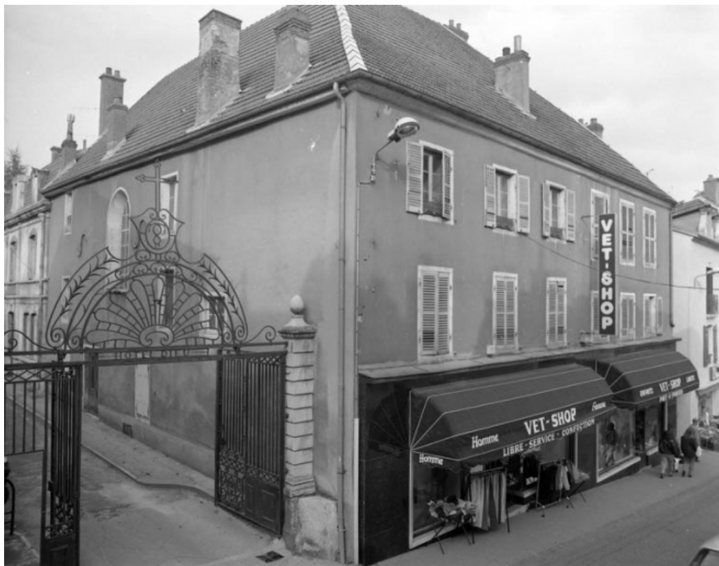
Grille d'entrée de la cour côté Grande Rue : ouverte et de trois quarts droite. 70, Gray Grande Rue 87