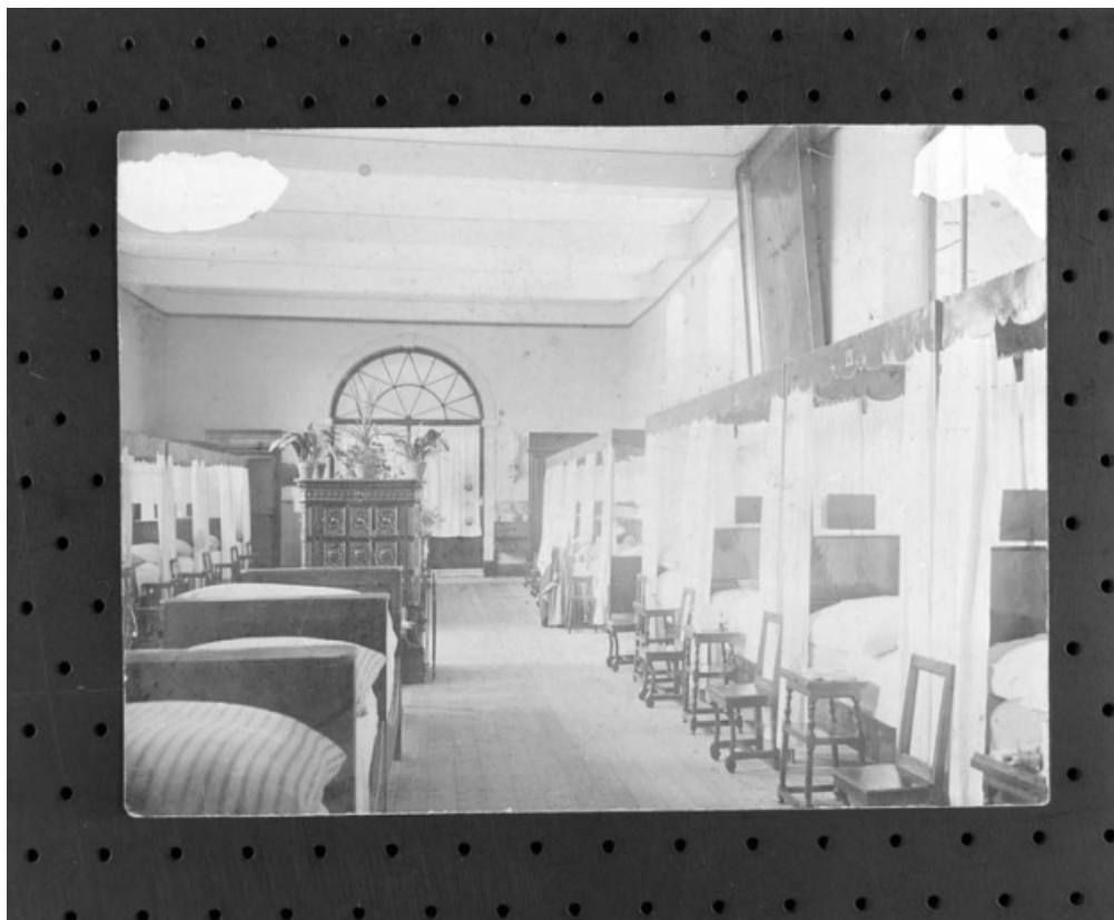
Intérieur de la salle Saint Martin.