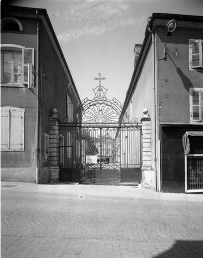
Grille d'entrée de la cour côté Grande Rue : fermée et de face. 70, Gray Grande Rue 87