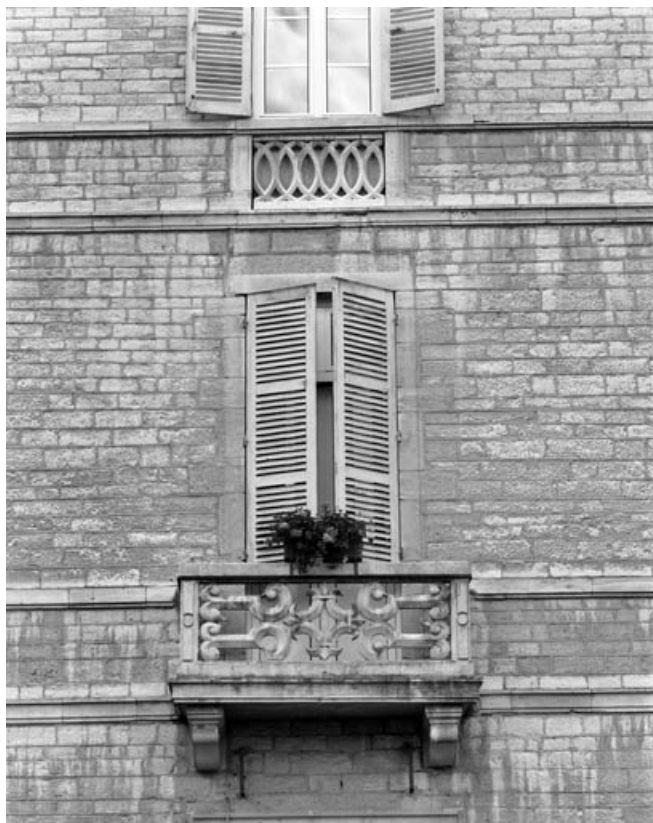
Façade principale : détail d'une baie du premier étage, partie droite. 70, Gray Grande Rue 87