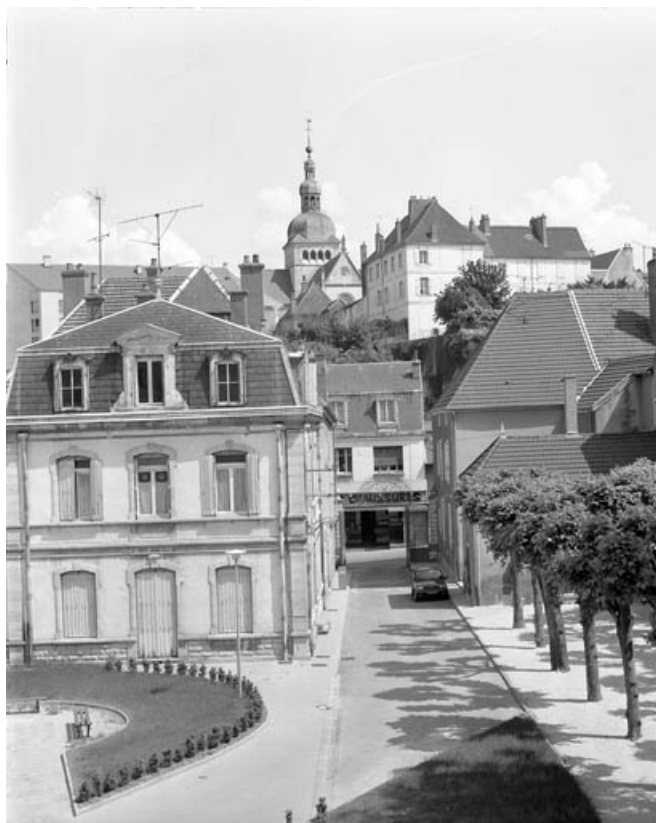
Vue du bâtiment administratif depuis l'hôtel-dieu.