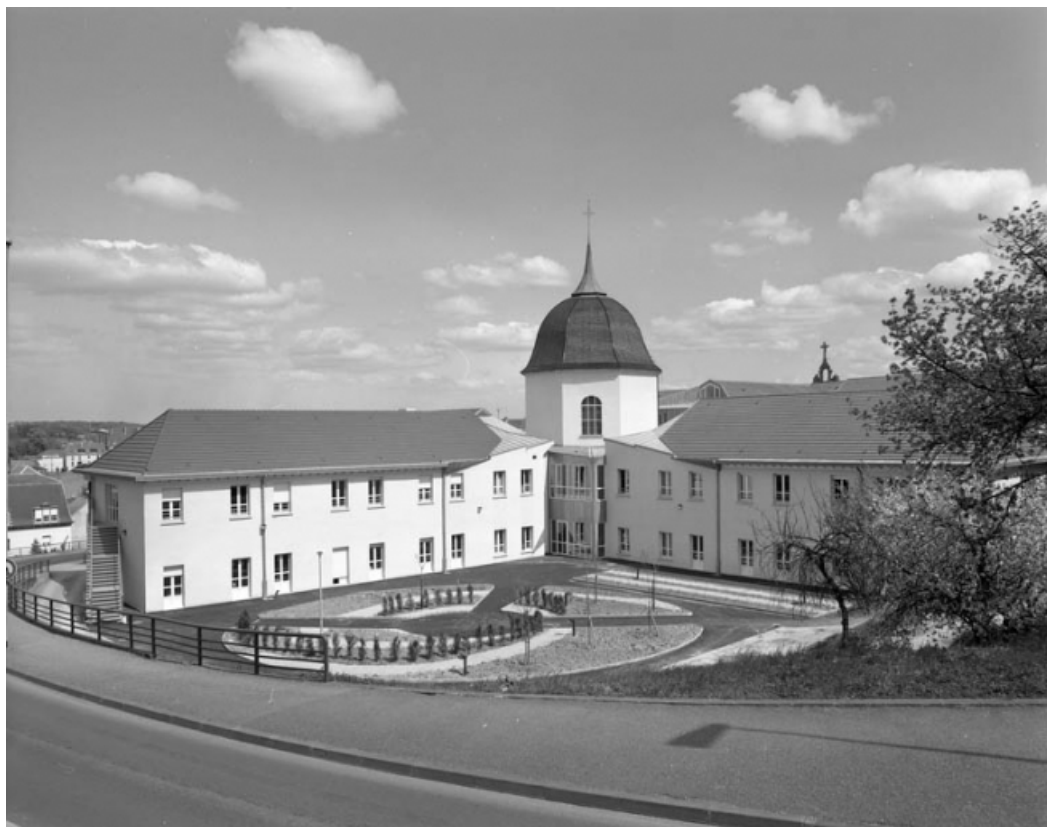
Cour à l'arrière de l'édifice : vue éloignée.