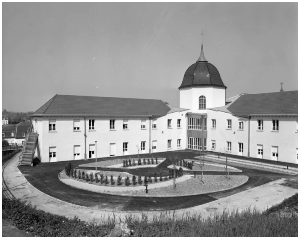
Cour à l'arrière de l'édifice : vue rapprochée.