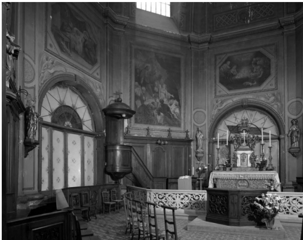
Vue de l'intérieur de la chapelle depuis l'entrée, de trois quarts gauche. 70, Gray Grande Rue 87