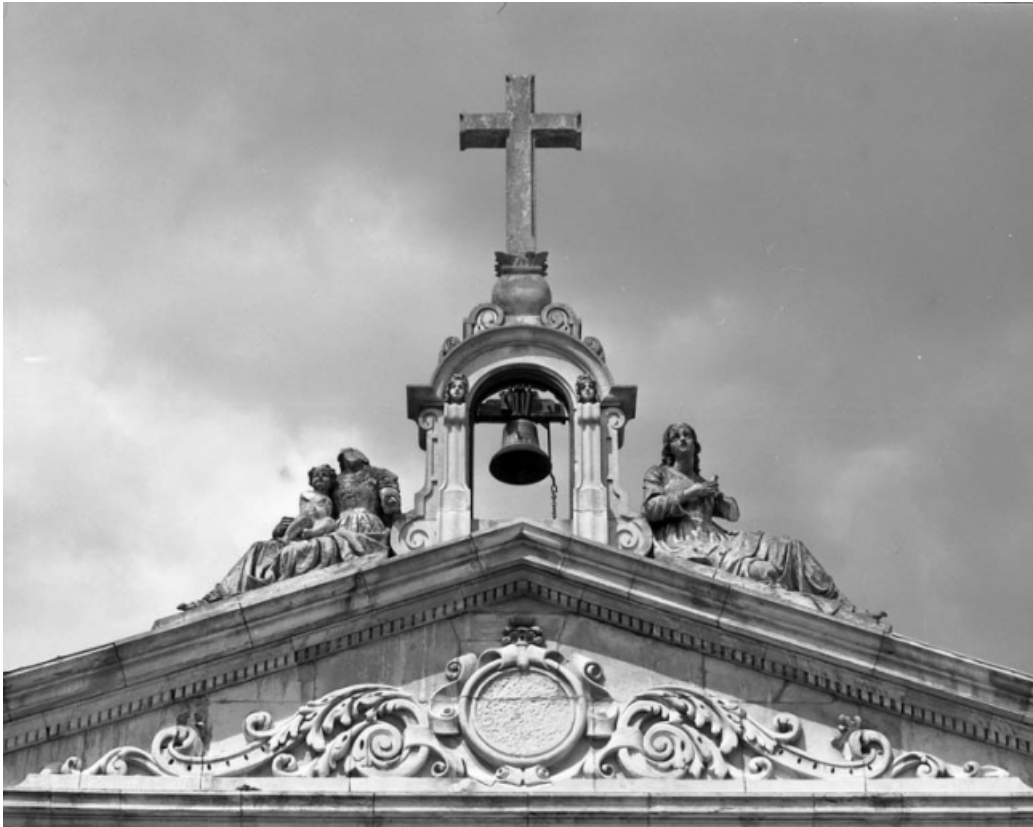
Façade principale : détail des rondes bosses de la Foi et la Charité. 70, Gray Grande Rue 87