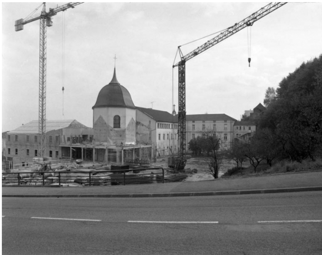
Chapelle vue depuis la rue de l'Arsenal pendant les travaux de démolition de l'année 1989. 70, Gray Grande Rue 87