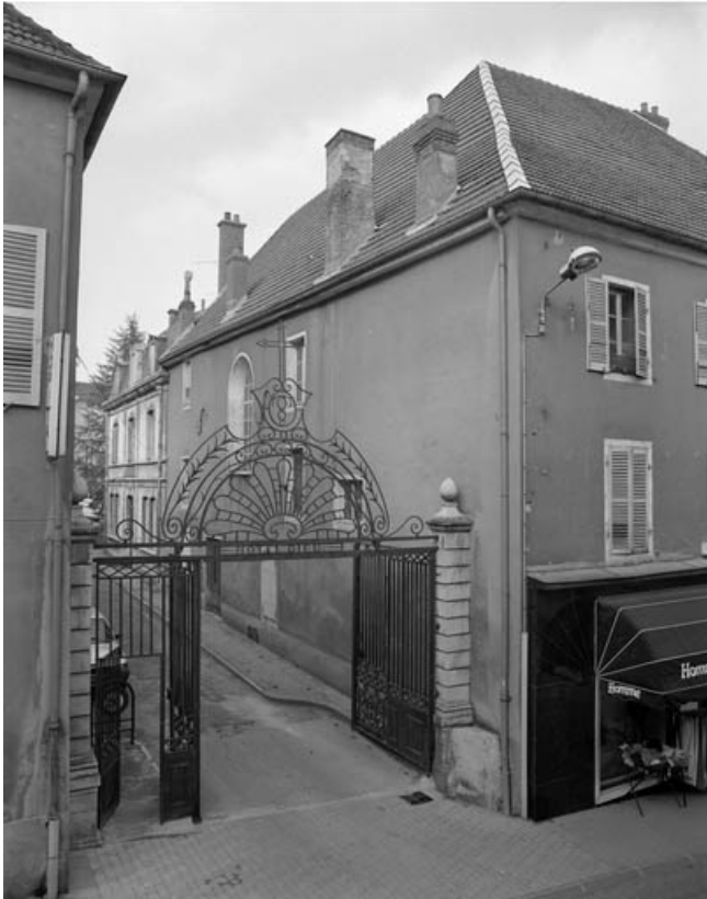
Grille d'entrée de la cour côté Grande Rue : ouverte et de trois quarts droite. 70, Gray Grande Rue 87