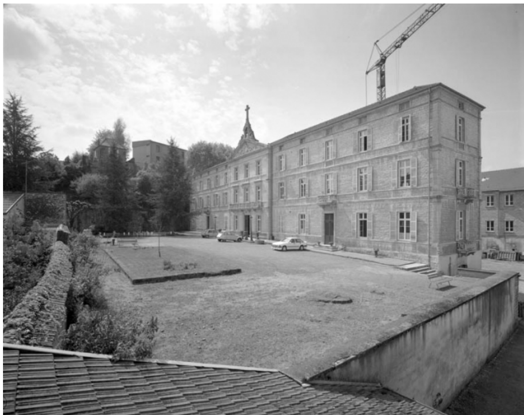
Façade principale de trois quarts droit.