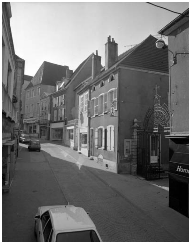
Logement de l'aumônier de trois quarts gauche depuis la Grande Rue. 70, Gray Grande Rue 87