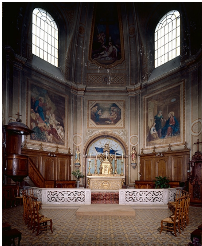
Vue d'ensemble de la chapelle.