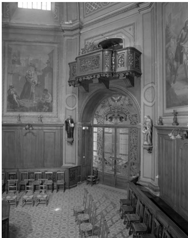
Intérieur : vue de l'entrée principale de la chapelle et de la tribune. 70, Gray Grande Rue 87