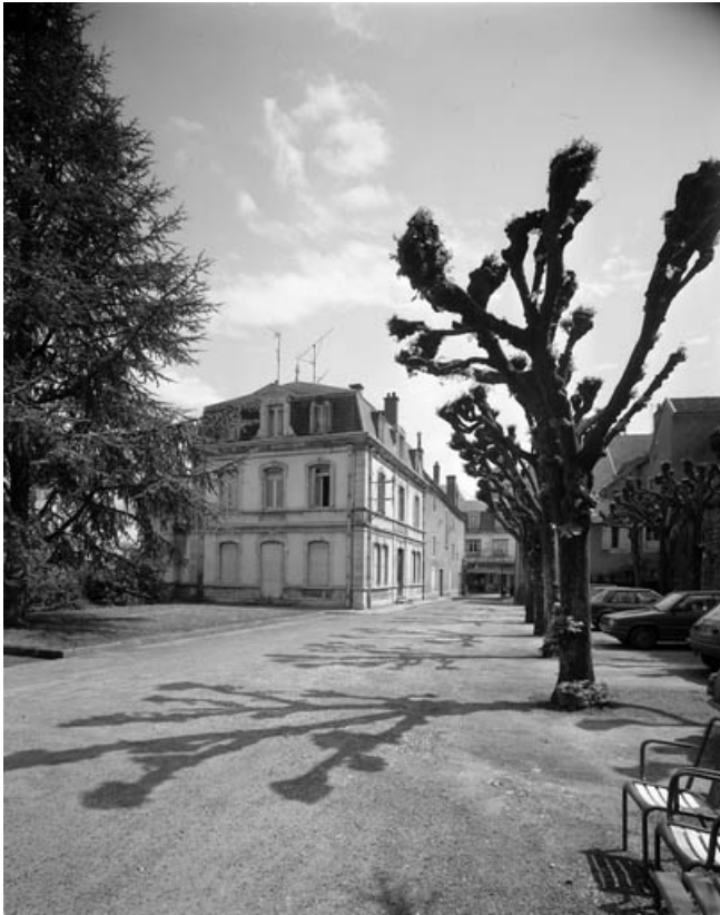
Bâtiment administratif : vue d'ensemble.