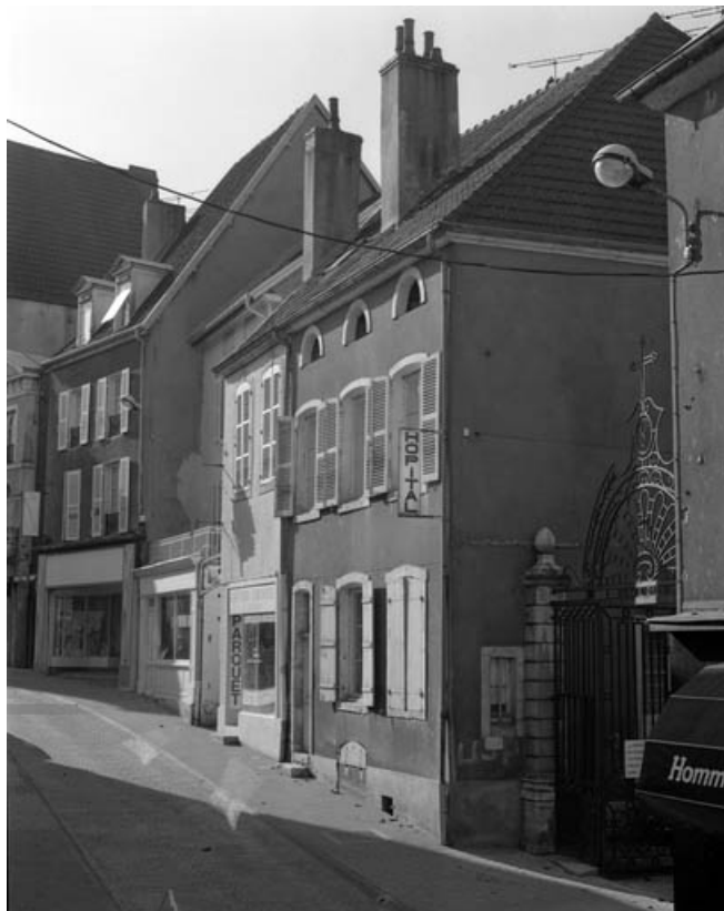
Logement de l'aumonier : façade antérieure de trois quarts gauche. 70, Gray Grande Rue 87