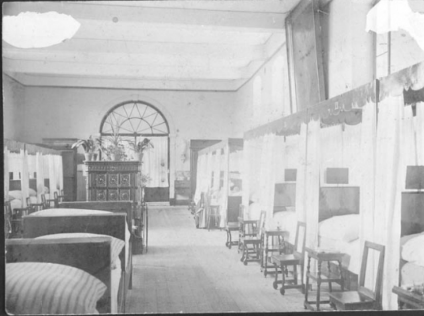
Intérieur de la salle Saint Martin.