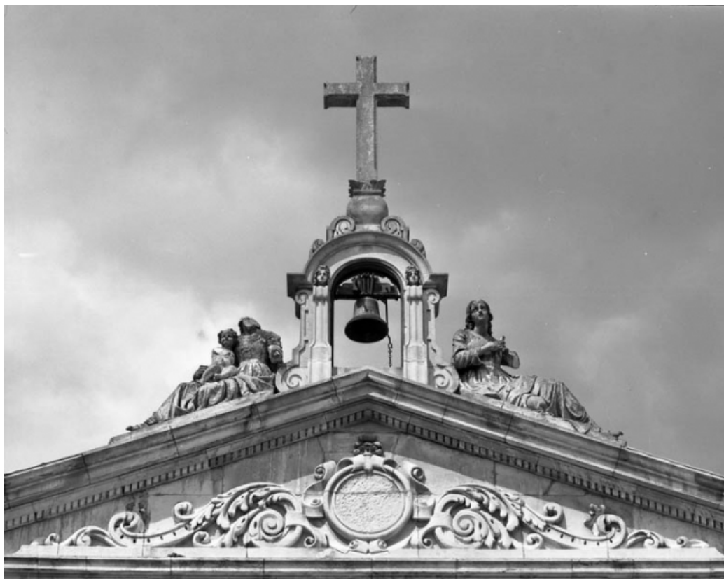
Façade principale : détail des rondes bosses de la Foi et la Charité.