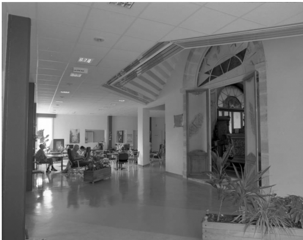
Vue d'une porte de la chapelle depuis le hall.