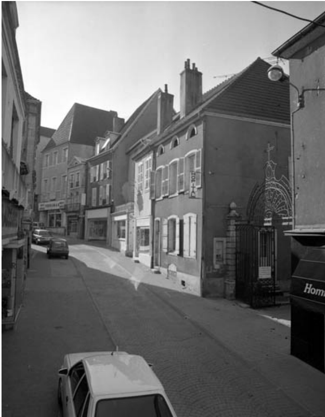
Logement de l'aumonier de trois quarts gauche depuis la Grande Rue. 70, Gray Grande Rue 87