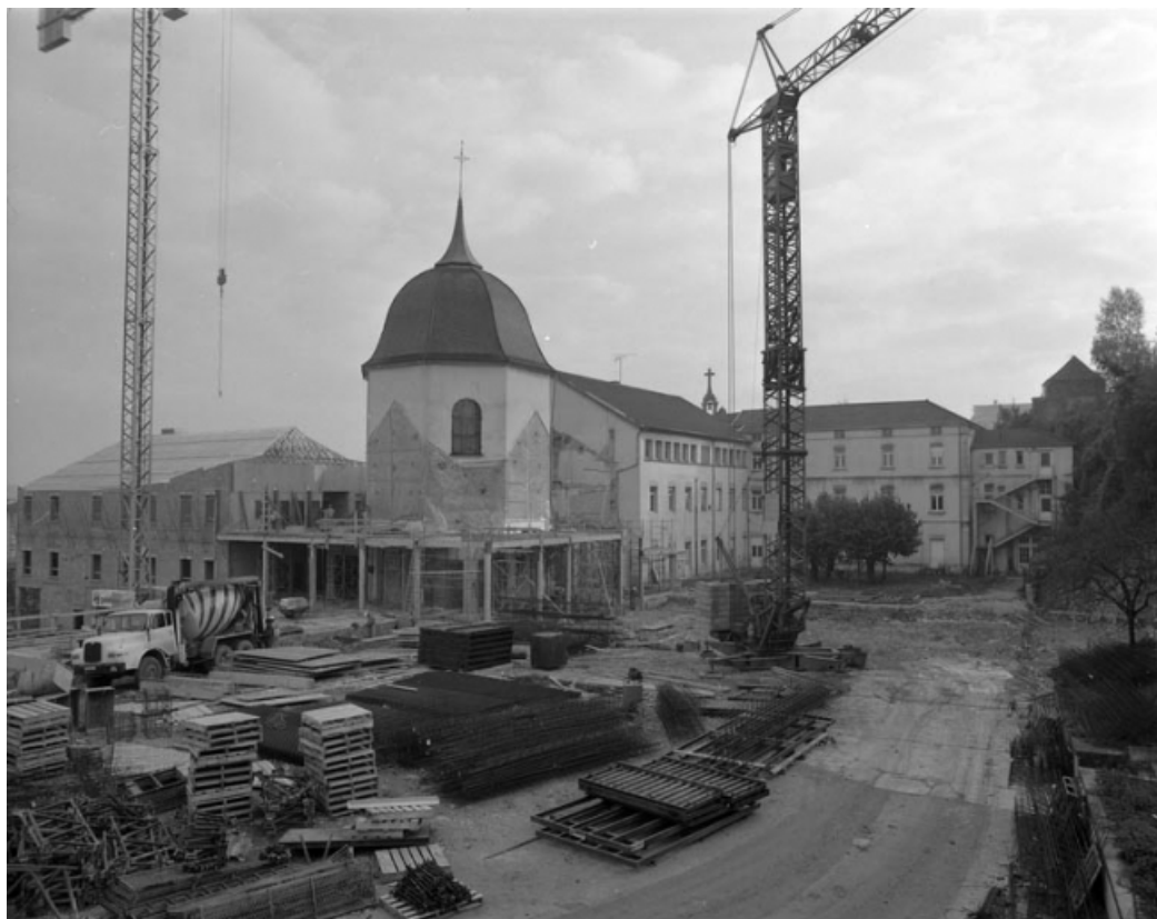
Chapelle depuis la cour donnant rue de l'Arsenal pendant les travaux de démolition de l'année 1989. 70, Gray Grande Rue 87