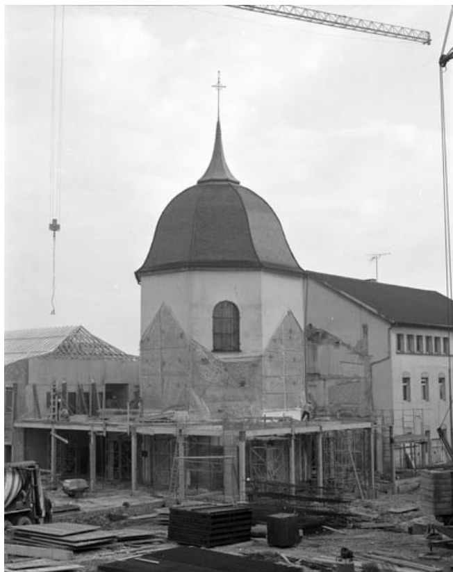
Chapelle en gros plan depuis la cour donnant rue de l'Arsenal pendant les travaux de démolition de l'année 1989. 70, Gray Grande Rue 87