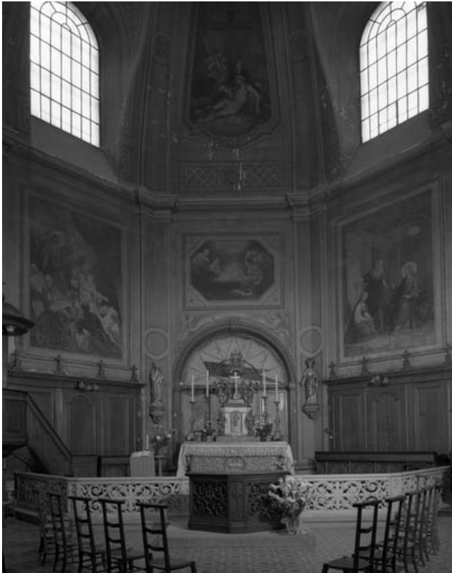
Vue de l'intérieur de la chapelle depuis l'entrée, de face.