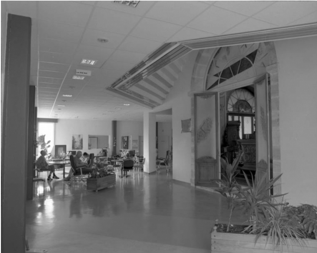
Vue d'une porte de la chapelle depuis le hall.