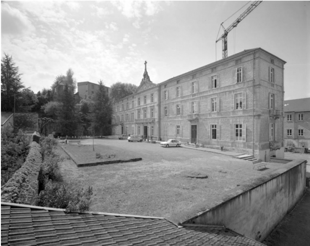
Façade principale de trois quarts droit.