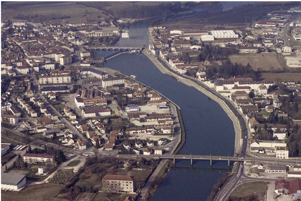
Vue aérienne de la ville basse et des deux ponts.