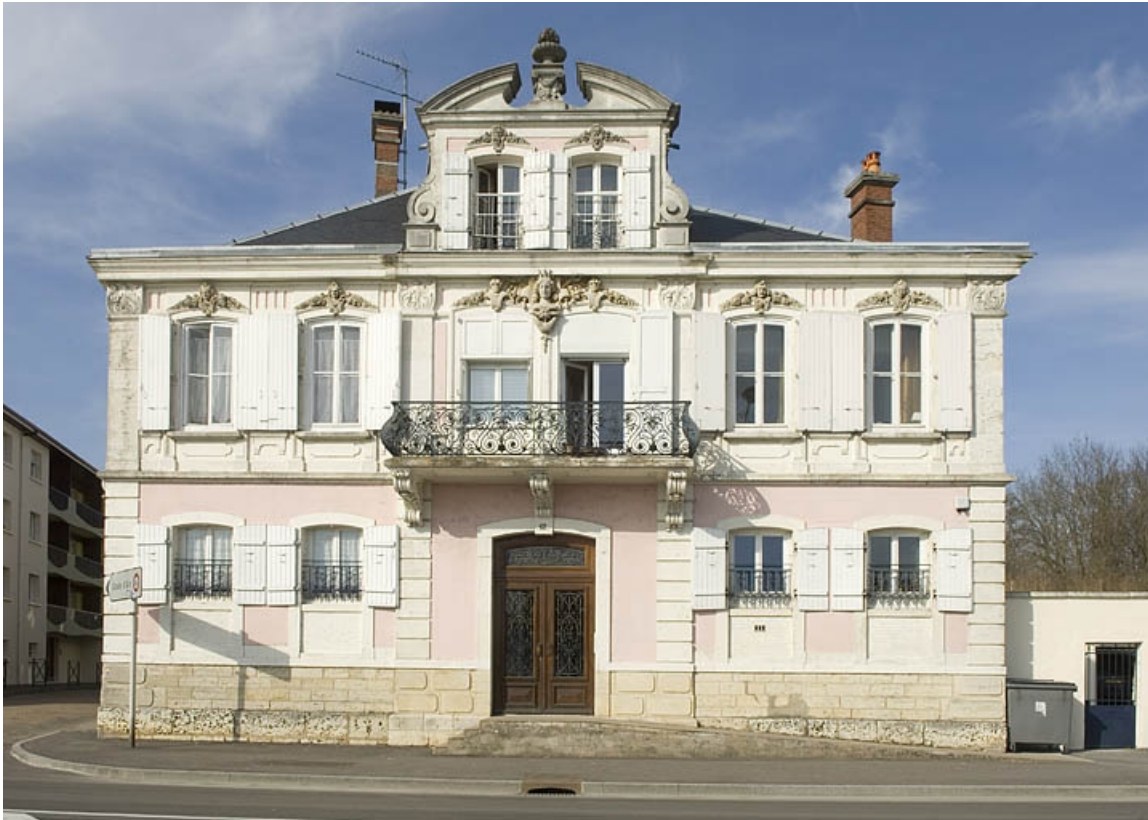
Pignon du logement patronal.