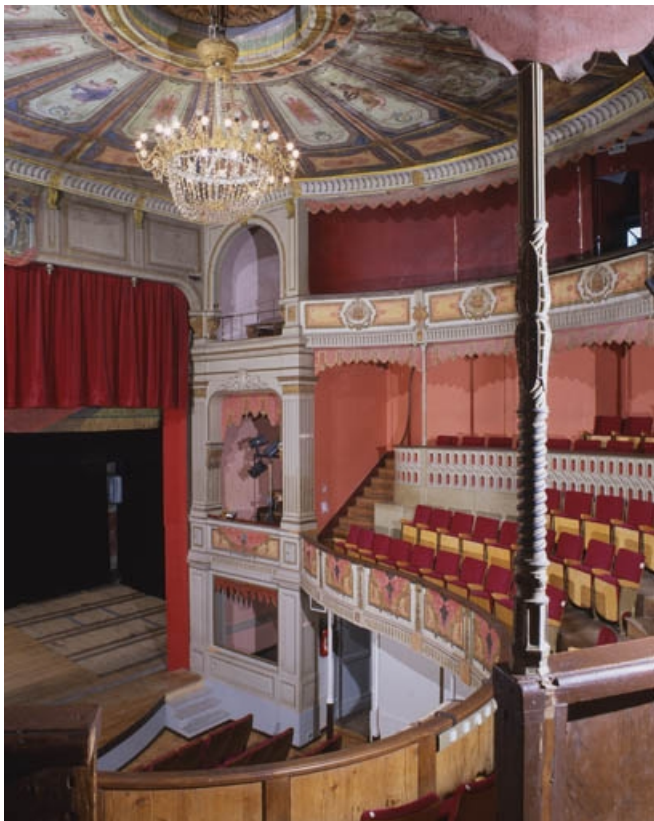
Intérieur : vue de la loge droite, des premier et second balcons, de trois quarts gauche. 70, Gray