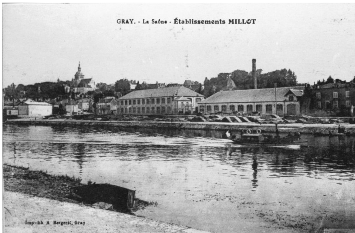
Gray.- La Saône. Etablissement Millot.