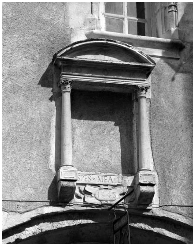
Façade antérieure : partie droite, détail de la niche au dessus du portail d'entrée. 70, Gray, 4, 6, 8 rue du Marché