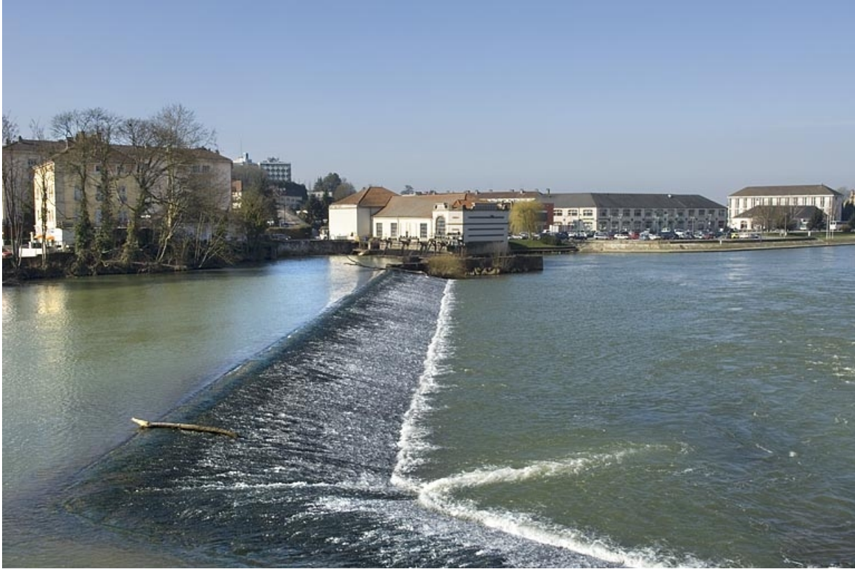
Le barrage depuis la rive droite de la Saône. 70, Gray