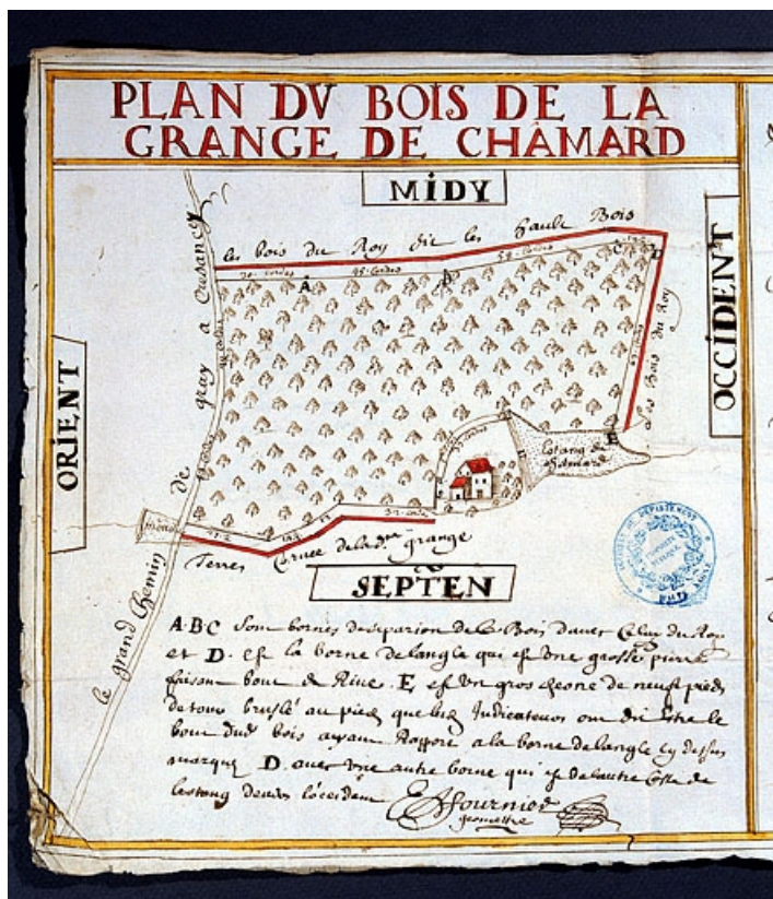
Plan du bois de la grange de Chamard.

70, Gray chemin rural dit de Chamard, lieudit : en Chamard