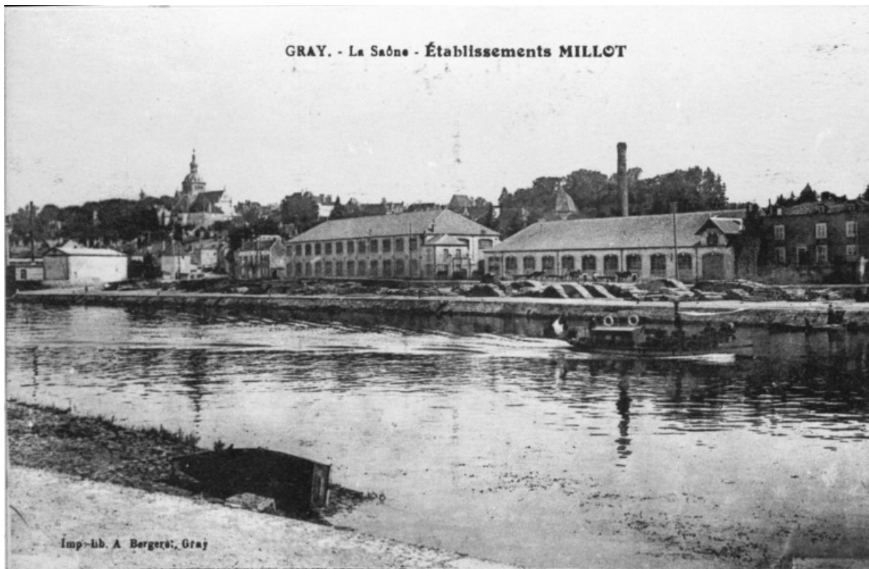
Gray.- La Saône. Etablissement Millot. 70, Gray