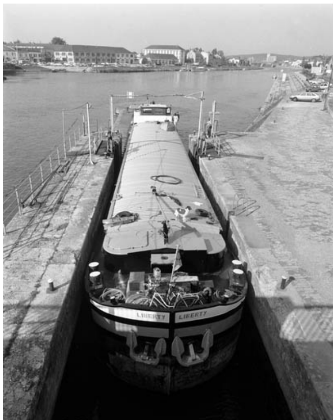
L'écluse, de face, avec péniche en gros plan s'engageant dans le chenal. 70, Gray