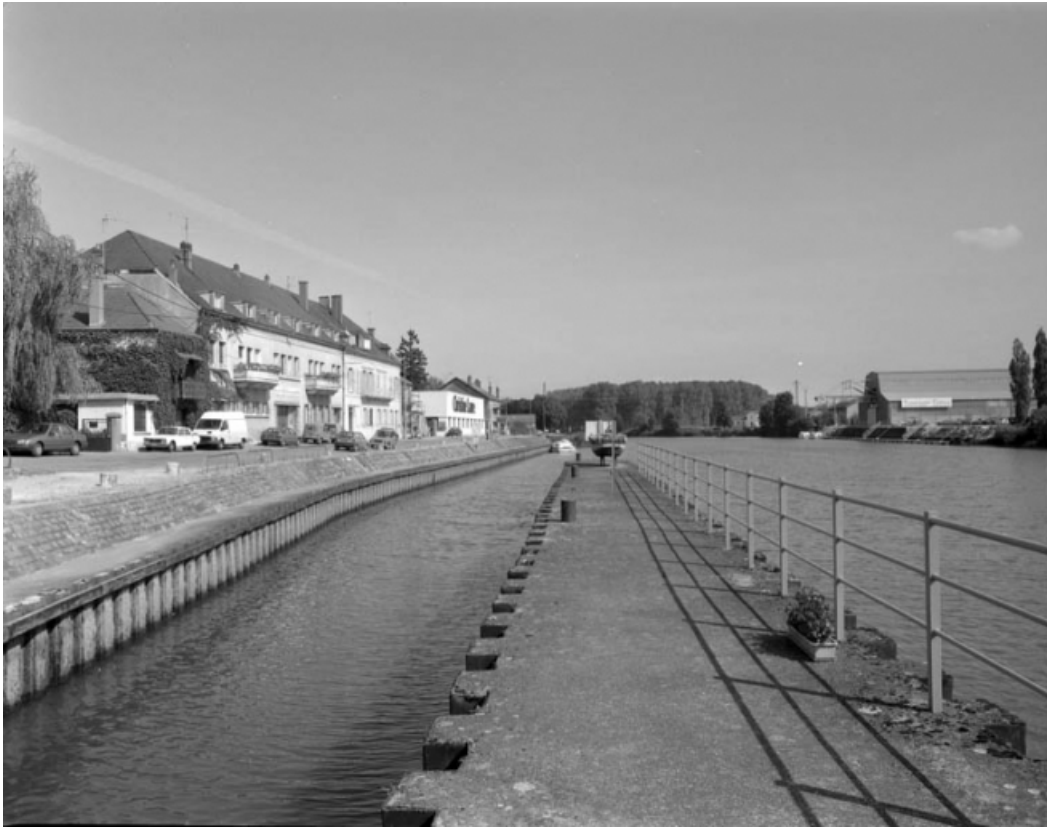
Vue de l'écluse le long du quai Vergy.