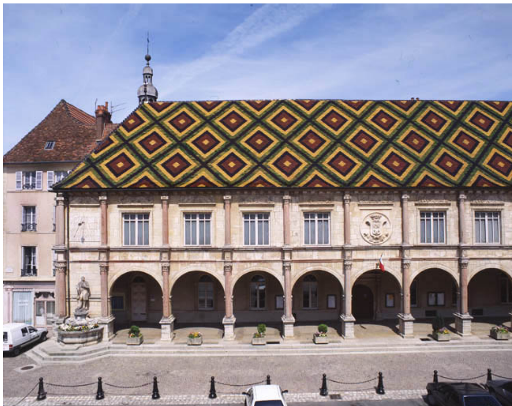
Vue de face : partie gauche. 70, Gray place De Gaulle