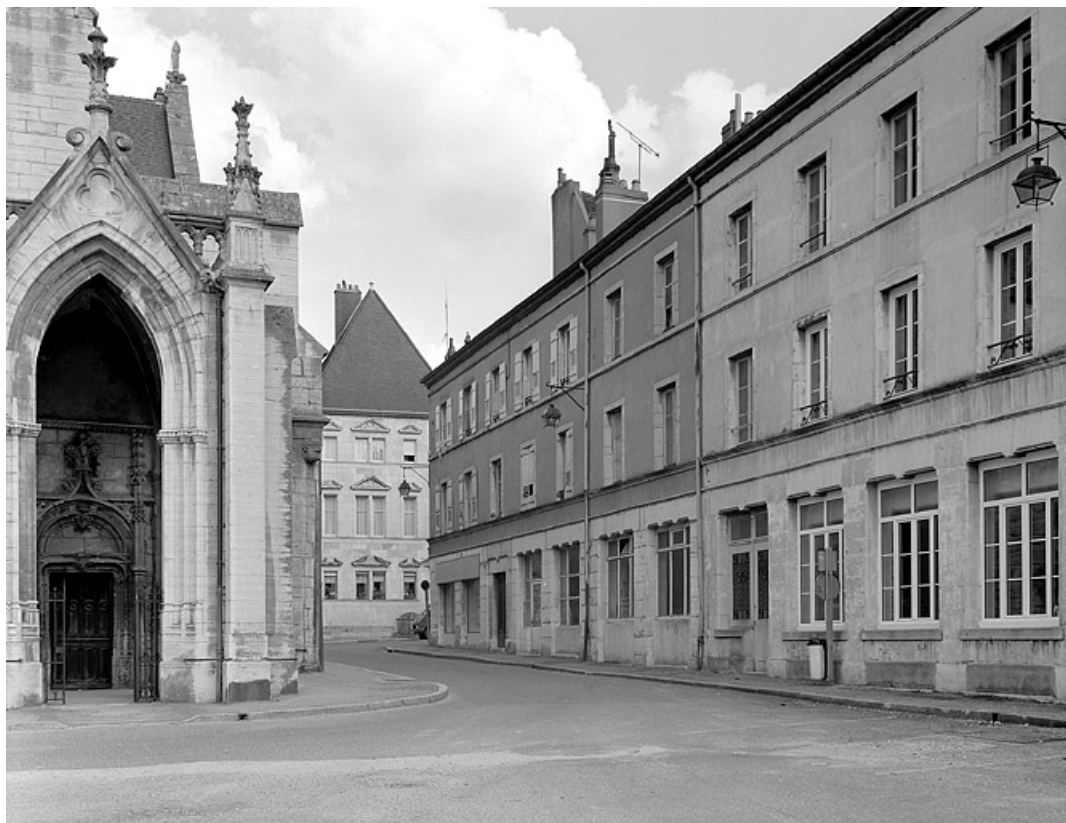
Façade latérale droite de trois quarts droit. 70, Gray