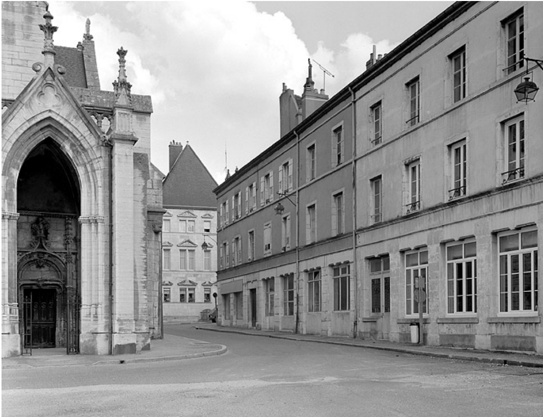
Façade latérale droite de trois quarts droit. 70, Gray