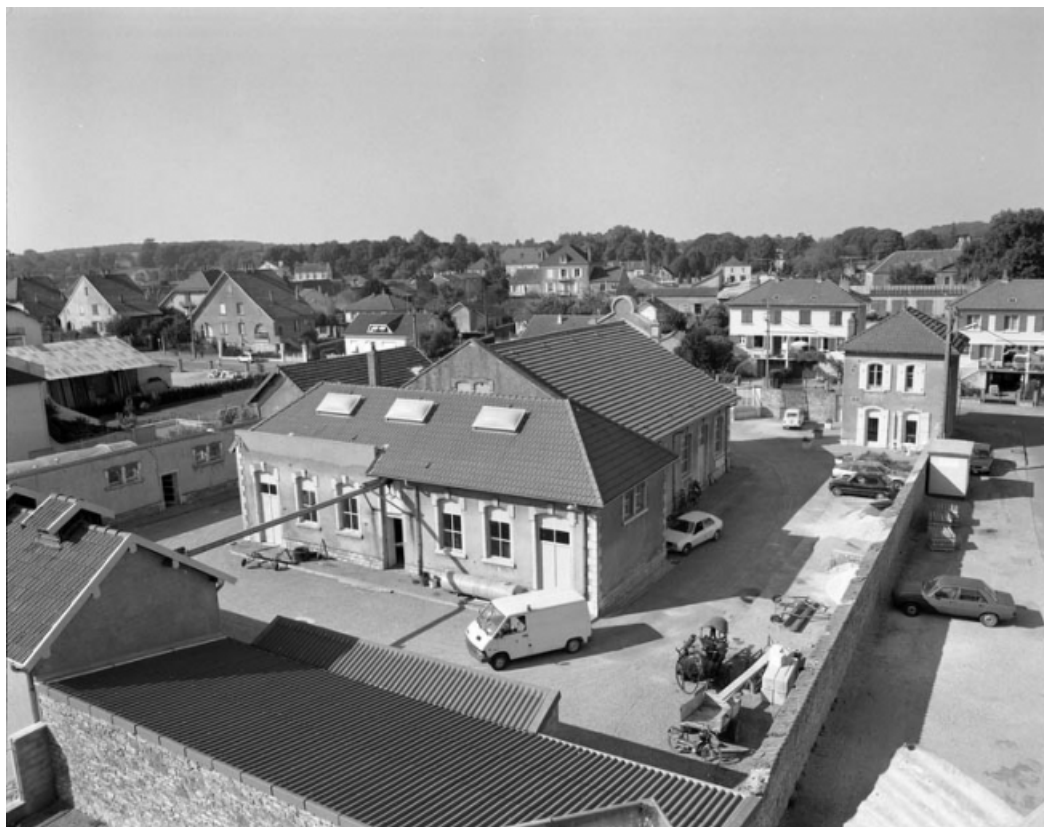
Vue d'ensemble depuis l'arrière de l'édifice.