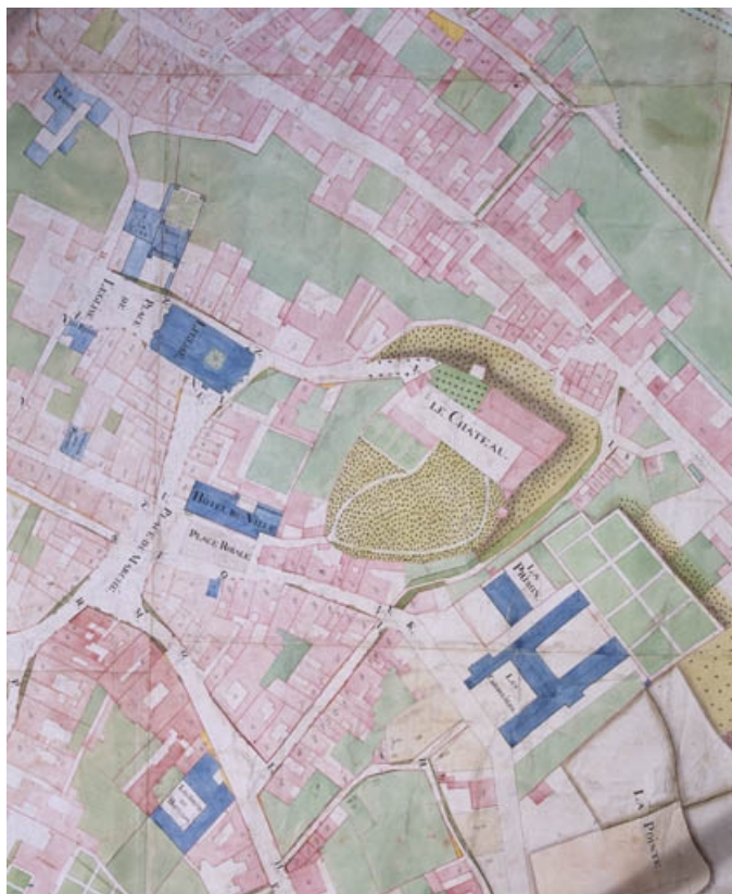
Plan du château dans la première moitié du 19e siècle.