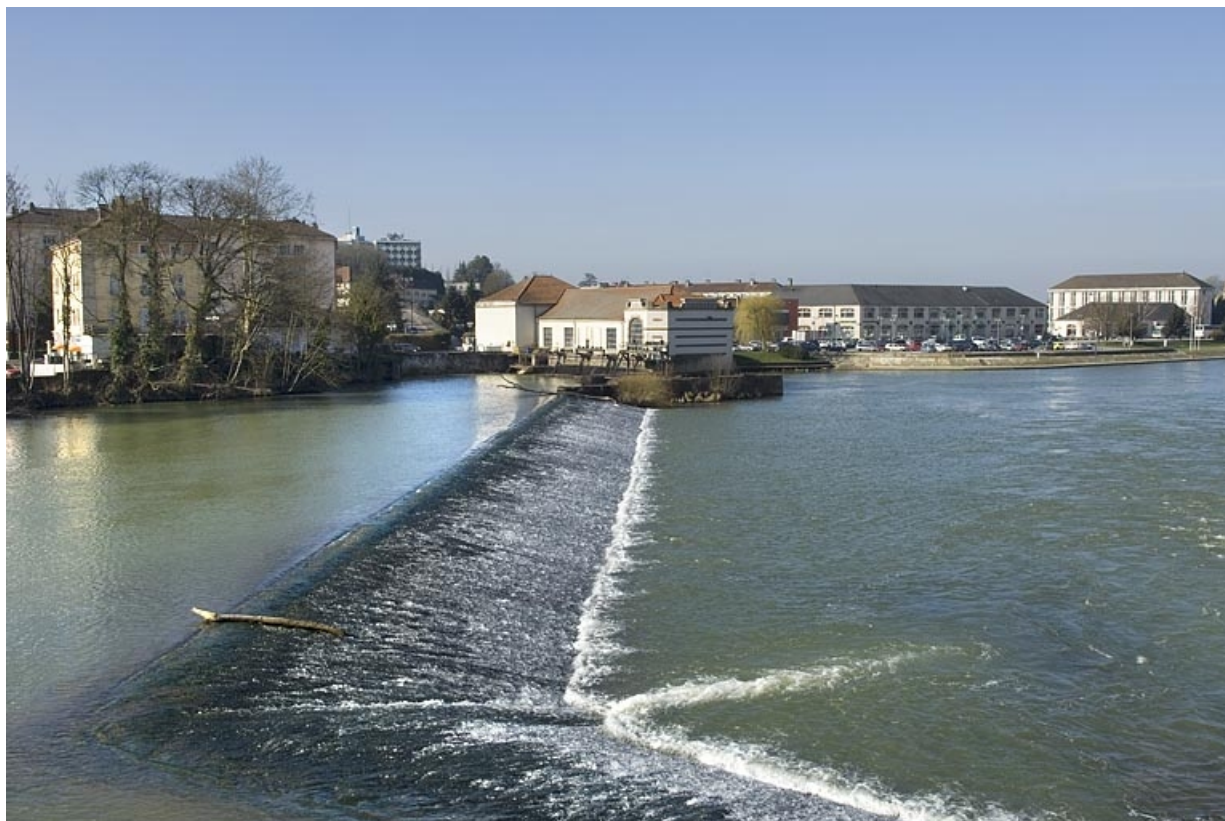
Le barrage depuis la rive droite de la Saône. 70, Gray