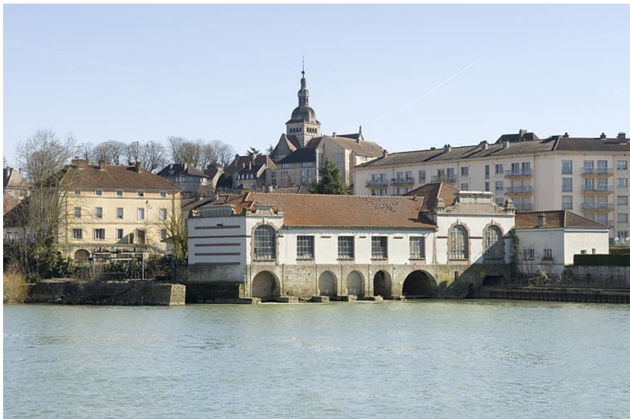
Vue d'ensemble depuis le nord-ouest. 70, Gray