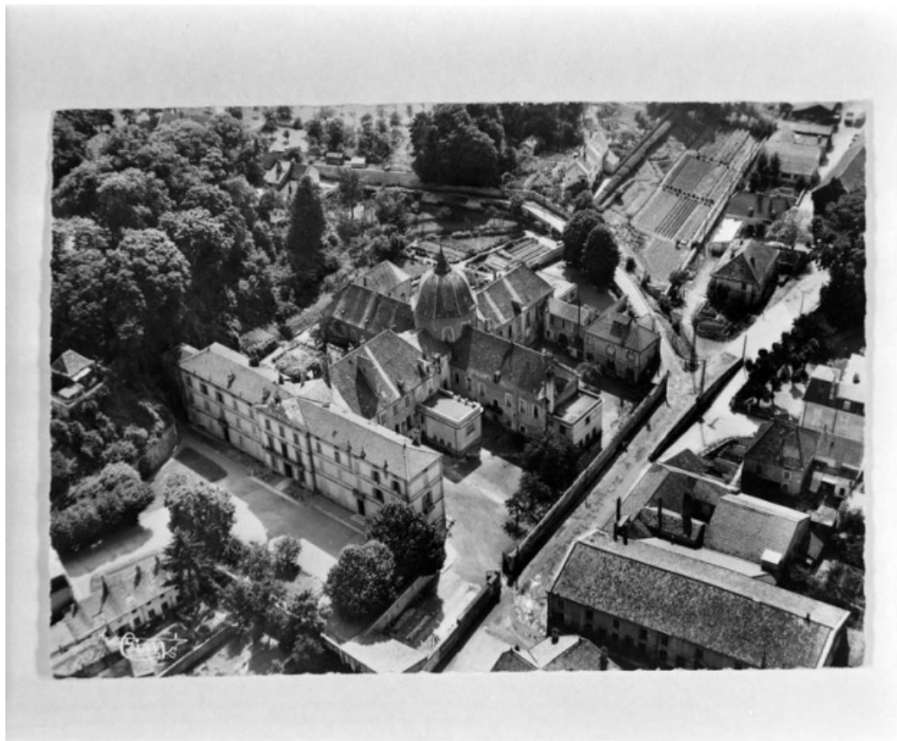
Vue aérienne de l'hôtel-Dieu.