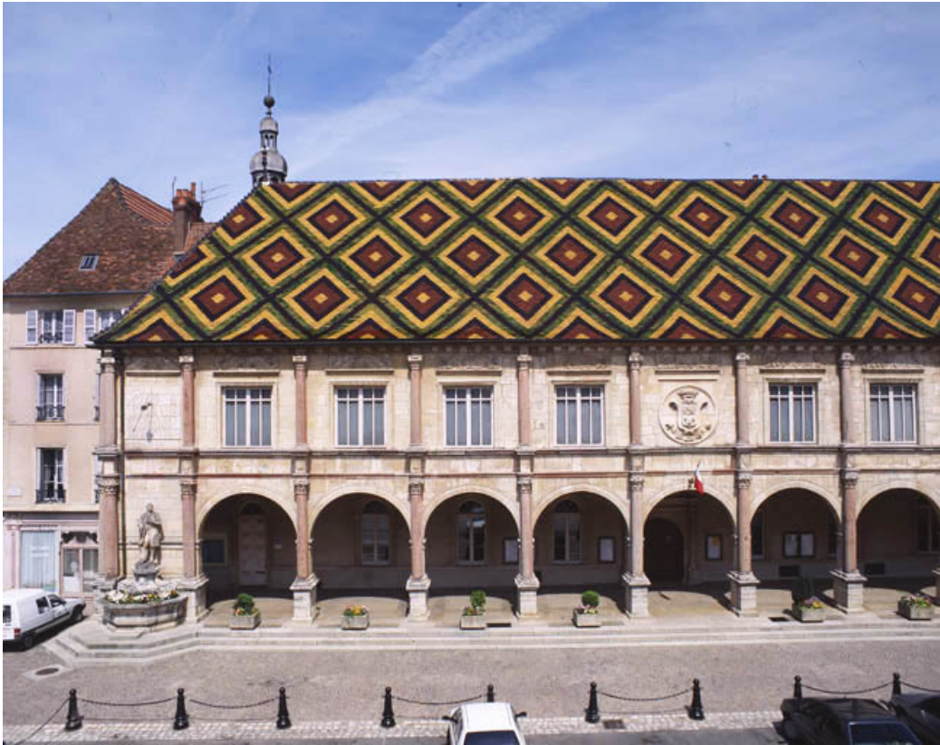
Vue de face : partie gauche.