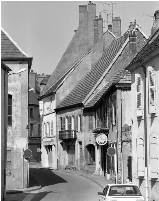
Vue d'ensemble éloignée de la façade sur rue.