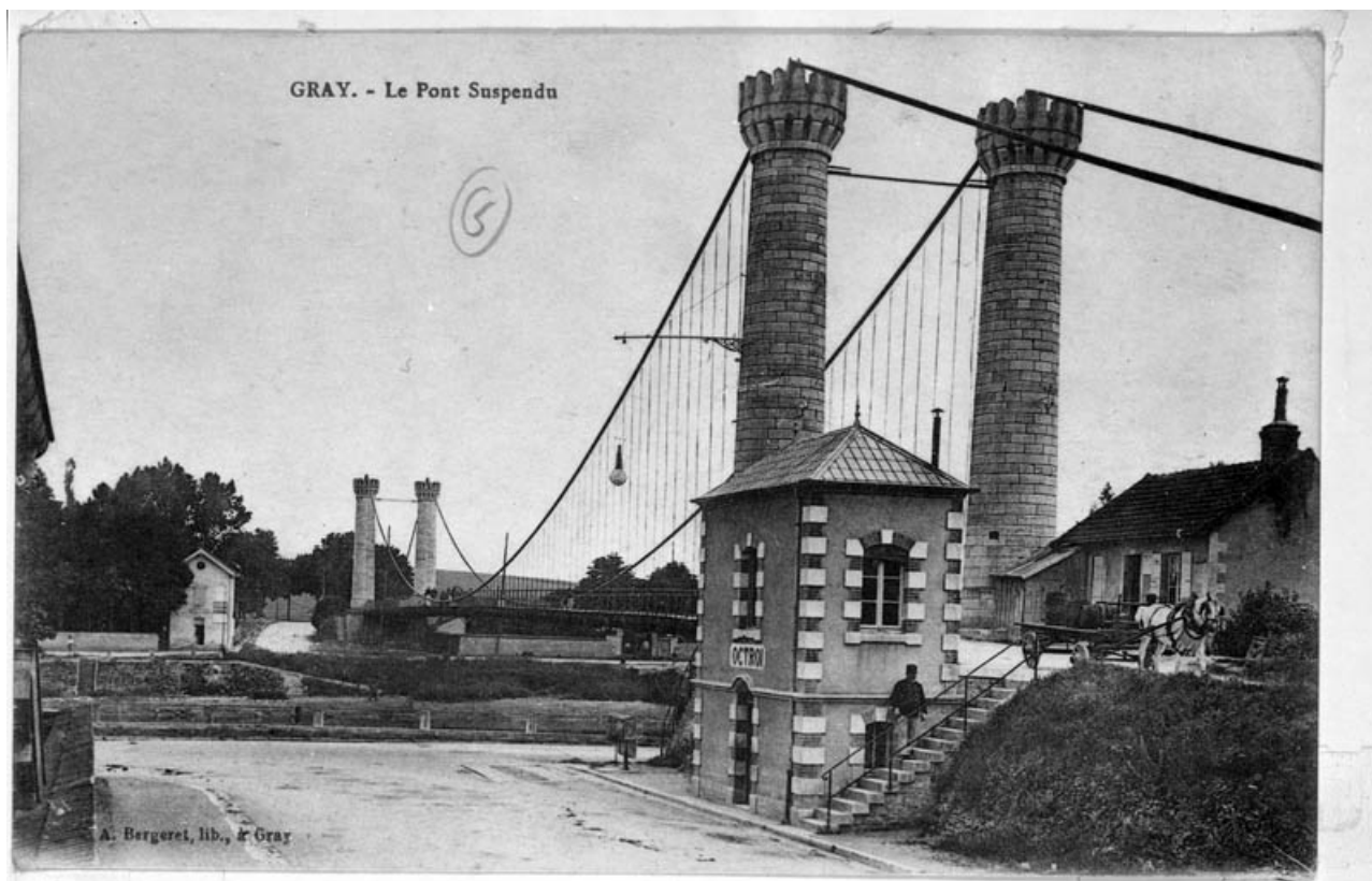
Gray.- le pont suspendu.