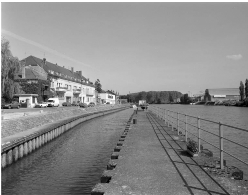
Vue de l'écluse le long du quai Vergy. 70, Gray