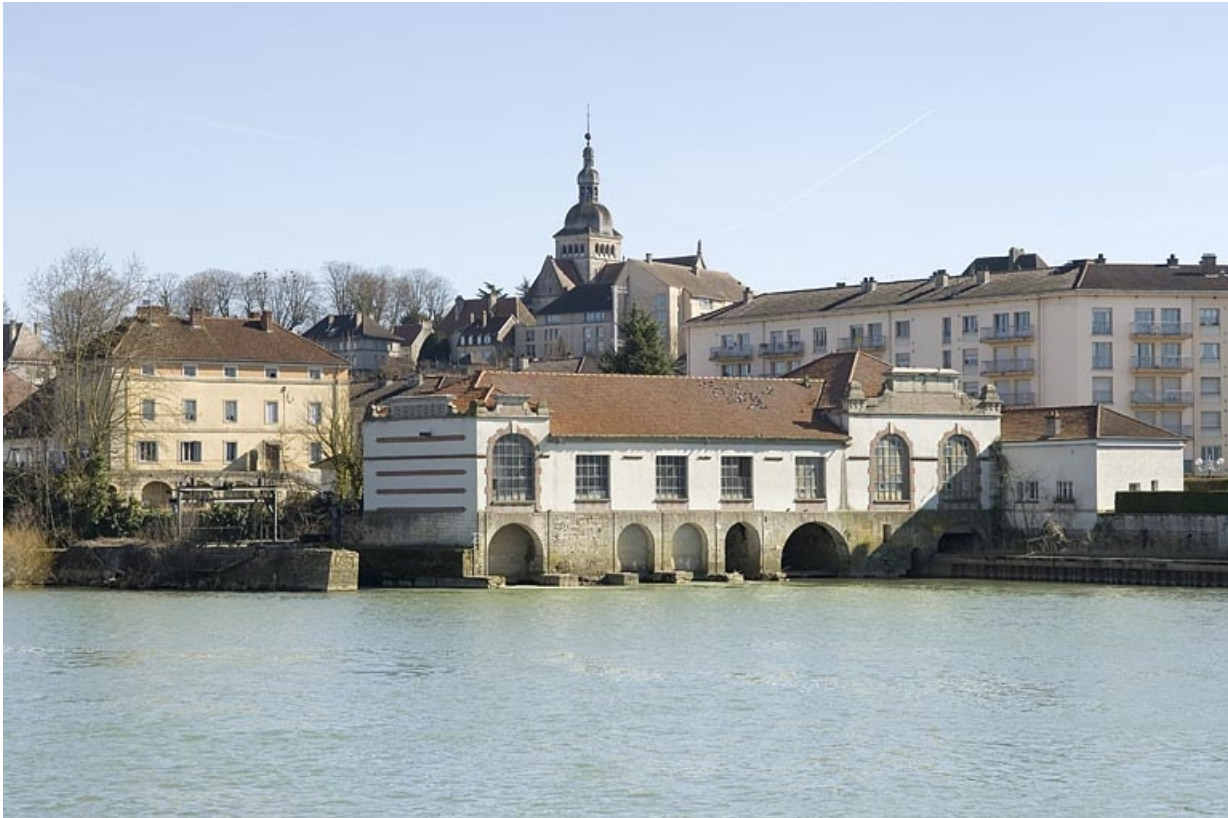
Vue d'ensemble depuis le nord-ouest.