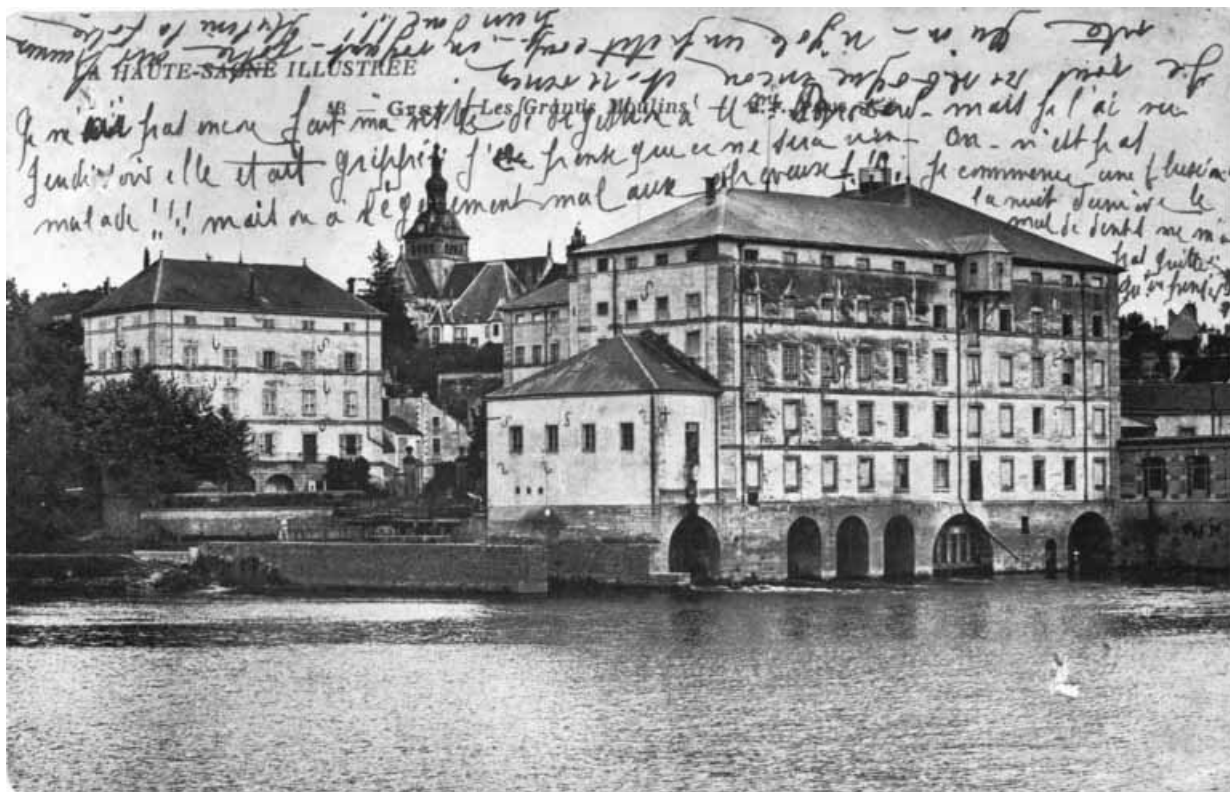
Gray.- Les Grands Moulins.