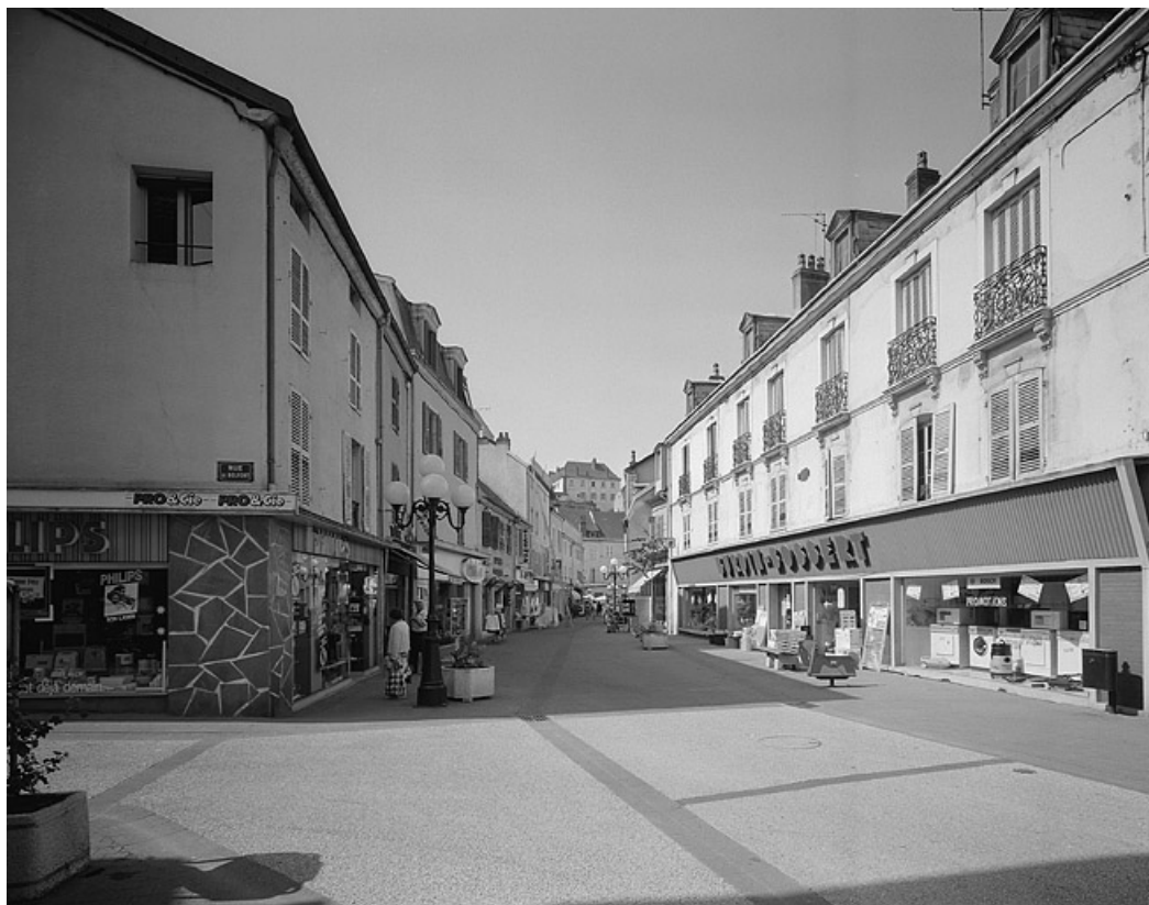
Façade antérieure depuis le carrefour entre rue de Belfort et rue Thiers. 70, Gray