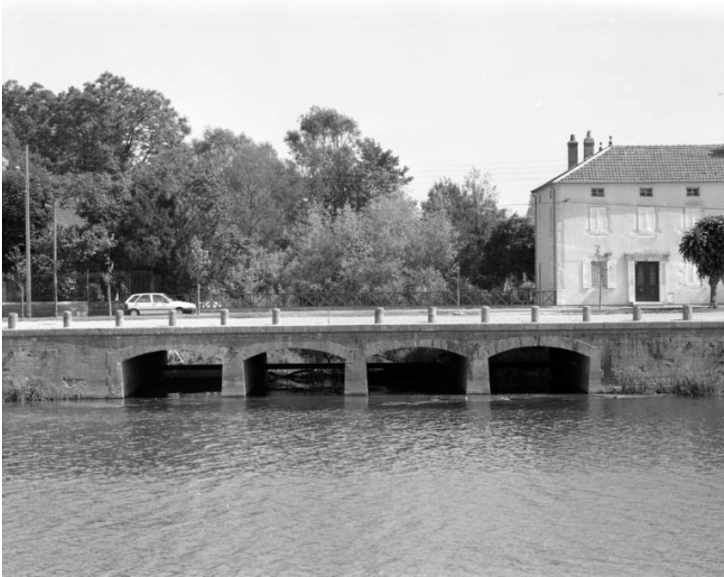
Vue d'ensemble, de face.