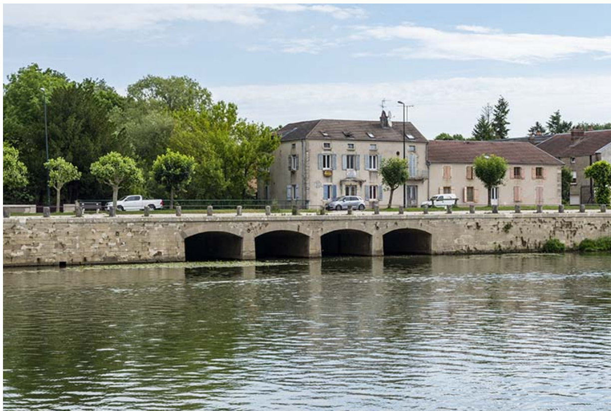
Pont surmontant le ruisseau des écoulottes, affluent de la Saône à Gray.