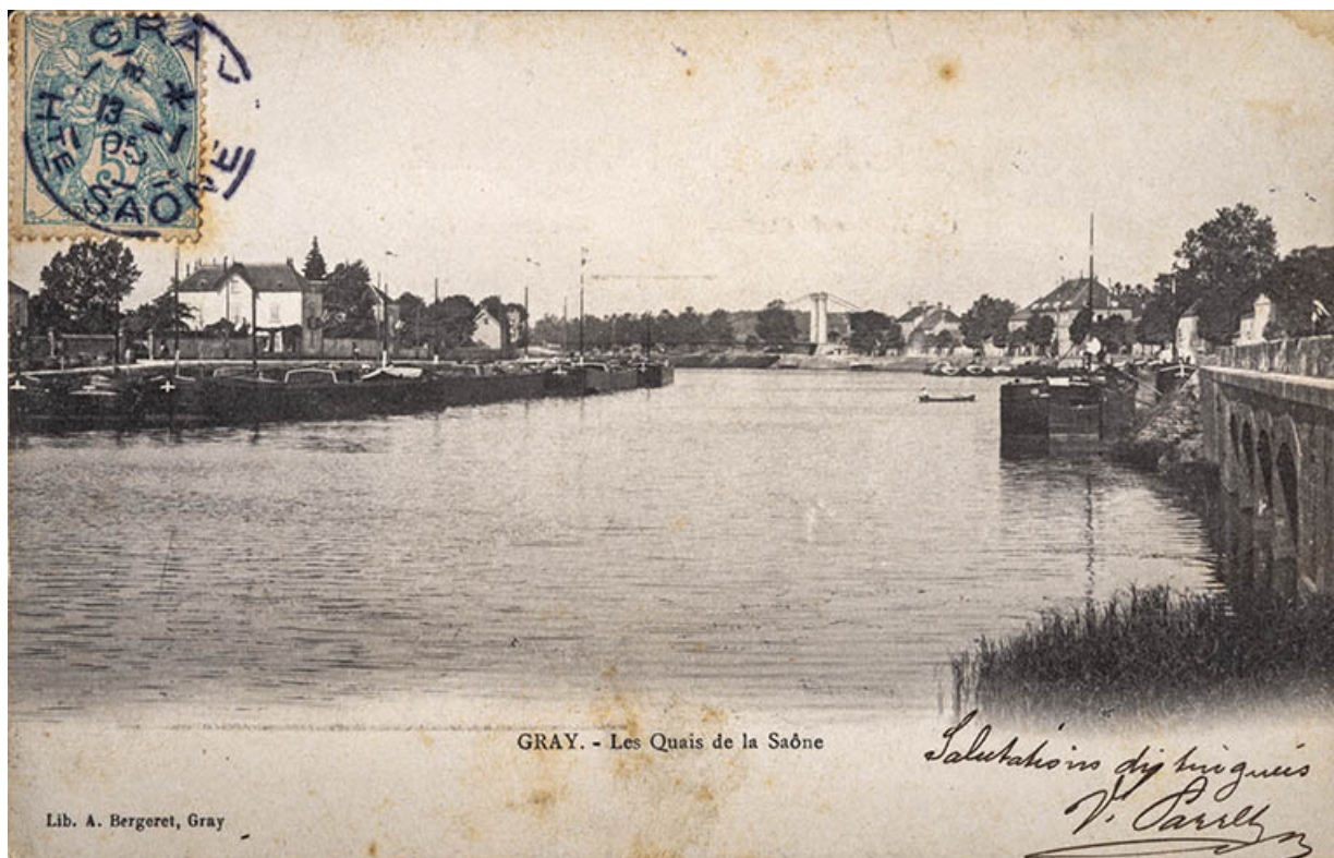
Les quais avec le pont au premier plan.