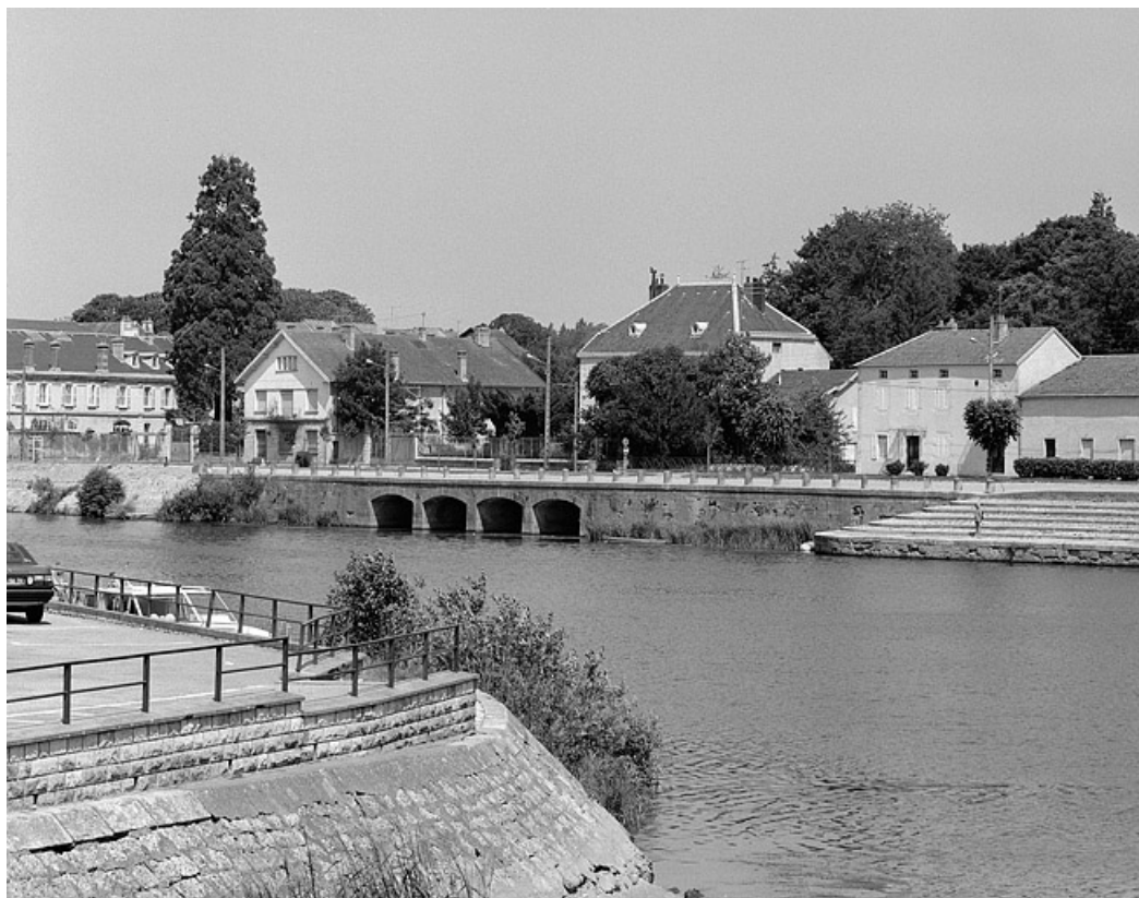
Vue d'ensemble éloignée de trois quarts droit.