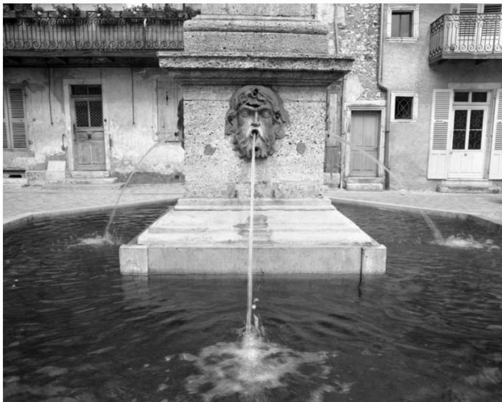
Détail du socle de l'obélisque.