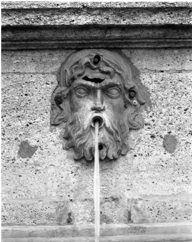
Détail : tête d'homme bouche ouverte sur le socle de l'obélisque, de face. 70, Gray rue de la Petite Fontaine