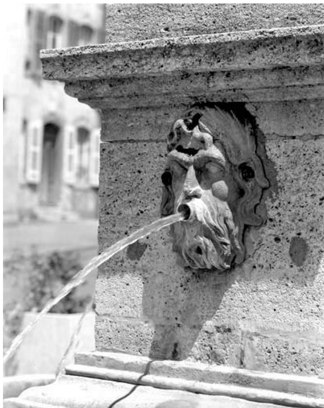
Détail : tête d'homme bouche ouverte, de trois quarts droit, avec angle du socle. 70, Gray rue de la Petite Fontaine