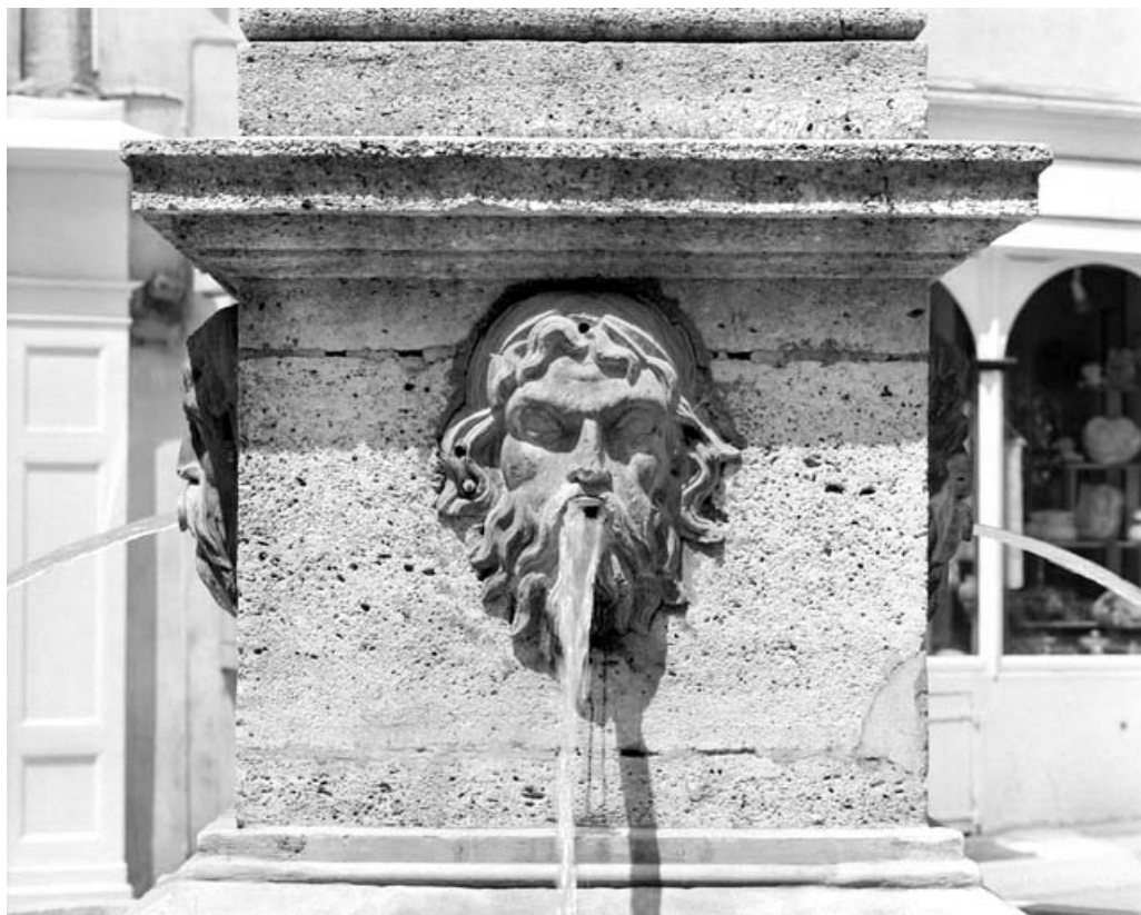
Détail : socle de l'obélisque, tête d'homme bouche fermée. 70, Gray rue de la Petite Fontaine