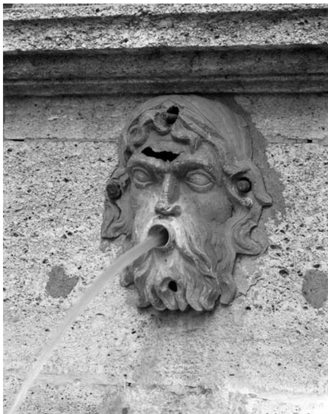
Détail : tête d'homme bouche ouverte, sur le socle de l'obélisque, de trois quarts droit. 70, Gray rue de la Petite Fontaine