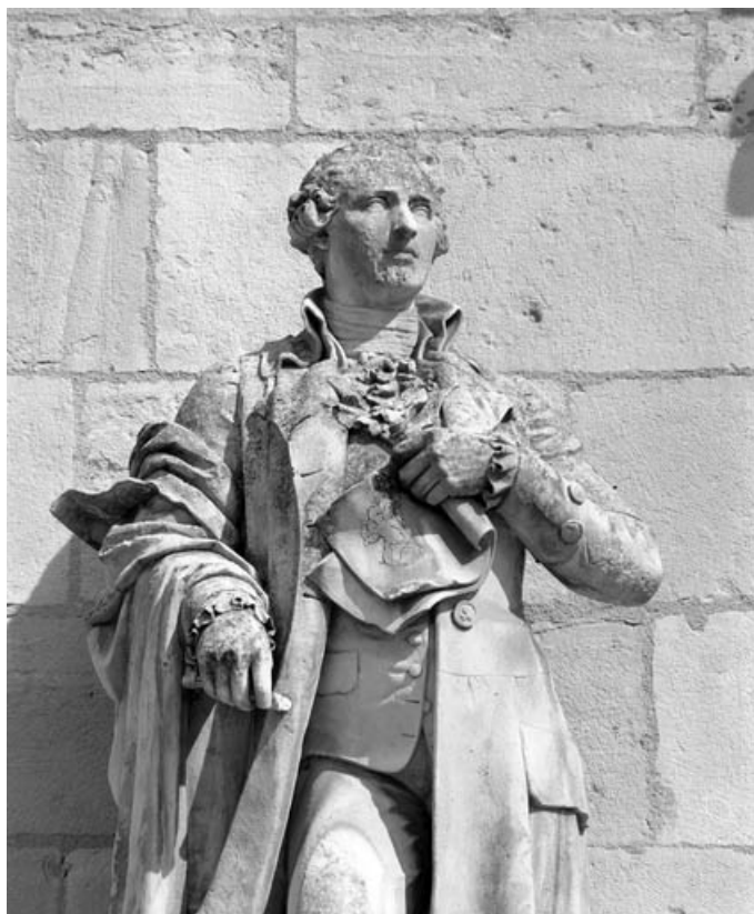
Détail du buste de la statue, de face.