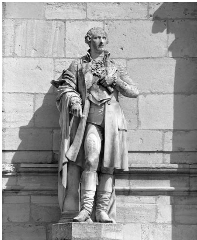
Détail de la statue, de face.