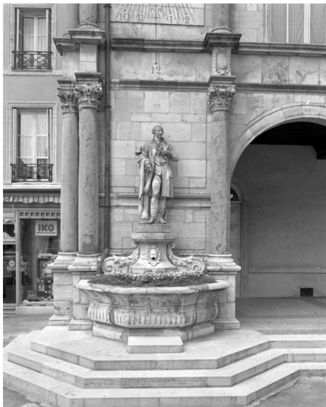
Vue d'ensemble, de face.