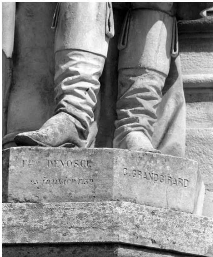
Détail du socle de la statue.