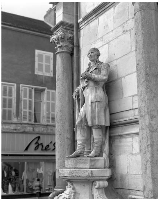
Détail de la statue, de trois quarts droit.