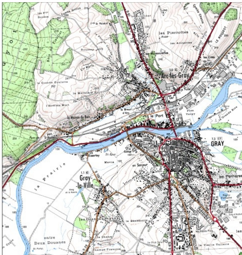
Carte de localisation. Carte topographique au 1:25000, I.G.N., Gray, 3222 E. SCAN 25 70, Gray, 12 quai Villeneuve