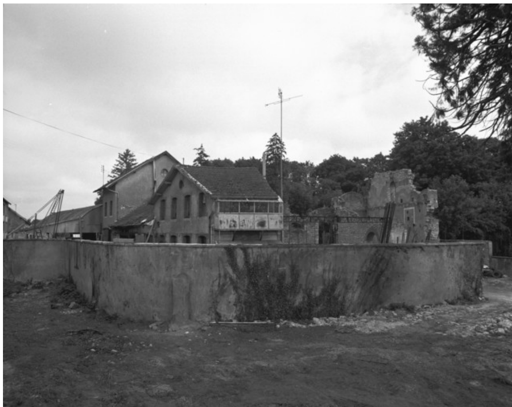
Vestiges de l'atelier de fabrication en 1988.