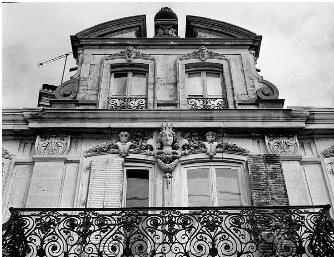
Façade antérieure de l'habitation. Détail du premier étage et du couronnement en 1988.