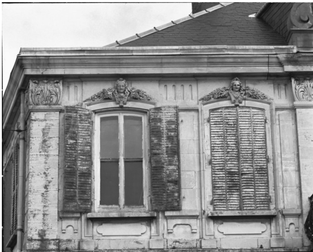
Façade antérieure de l'habitation. Détail des baies gauches de l'étage en 1988. 70, Gray, 12 quai Villeneuve