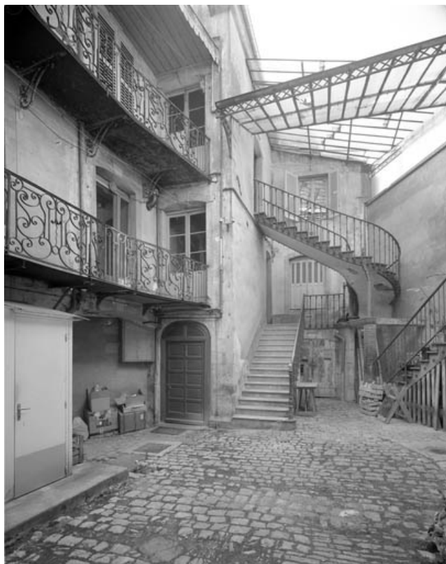
Façade postérieure sur cour.