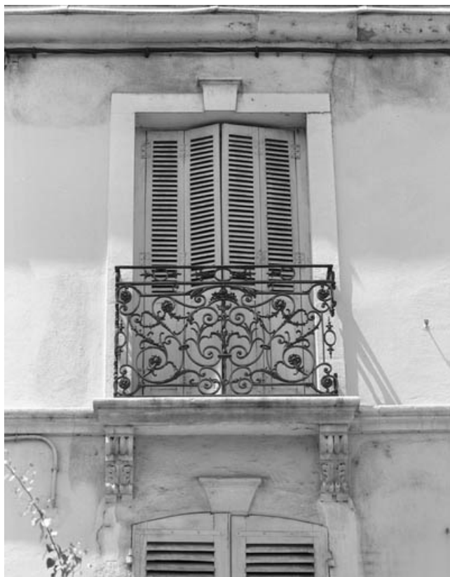
Façade antérieure : détail d'une baie du deuxième étage.