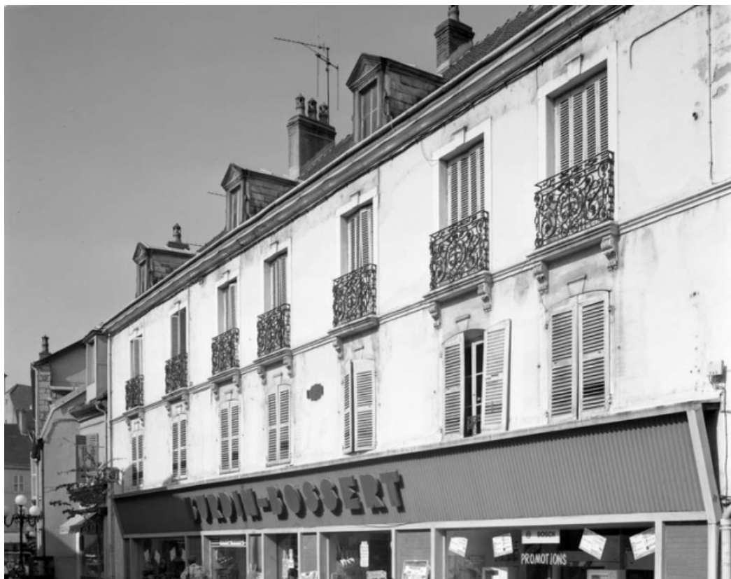
Façade antérieure de trois quarts droit à partir du premier étage.