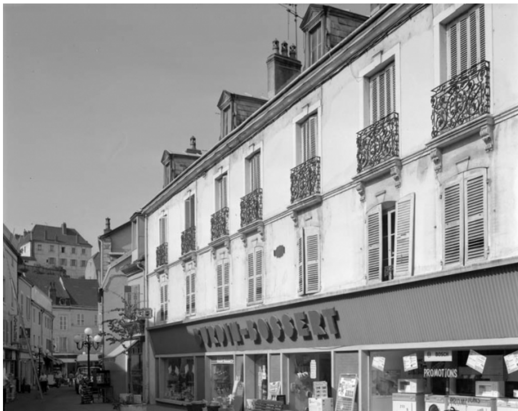
Façade antérieure de trois quarts droit.