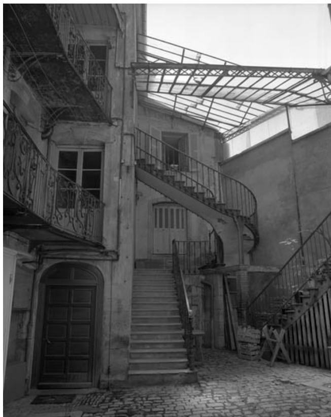
Détail de l'escalier de distribution extérieure.