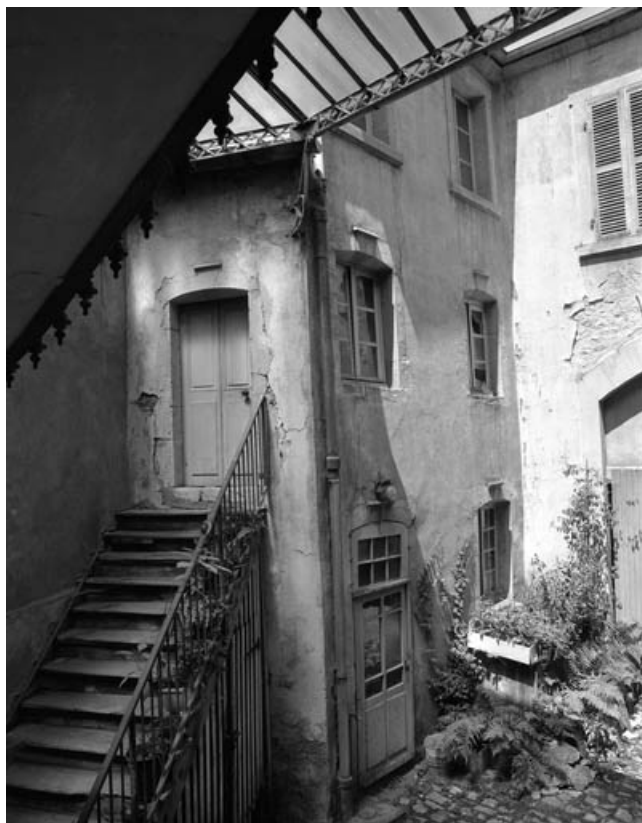
Logement indépendant à droite de la cour : de trois quarts gauche. 70, Gray, 11 rue Thiers