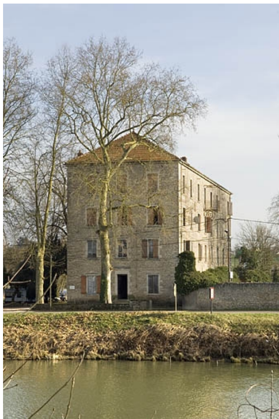
Vue d'ensemble depuis le nord-ouest.