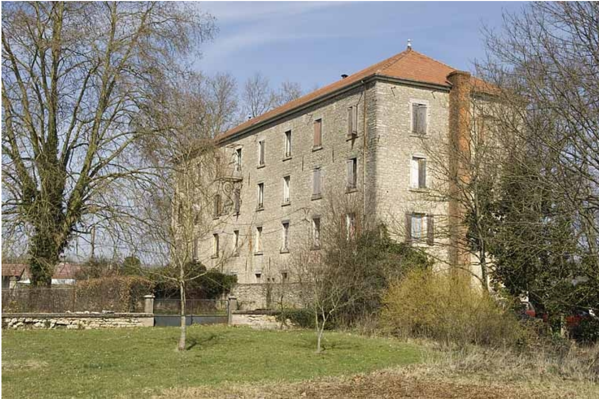
Vue depuis le sud-ouest.