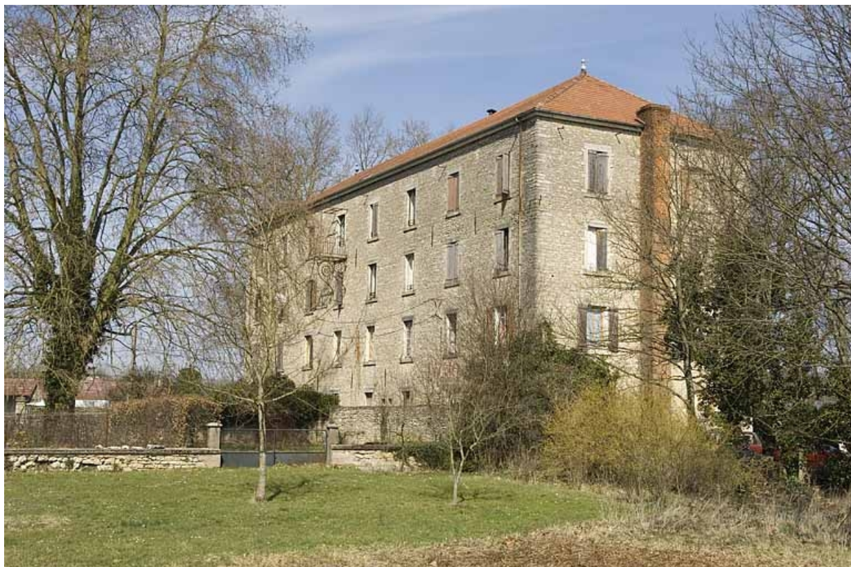
Vue depuis le sud-ouest.