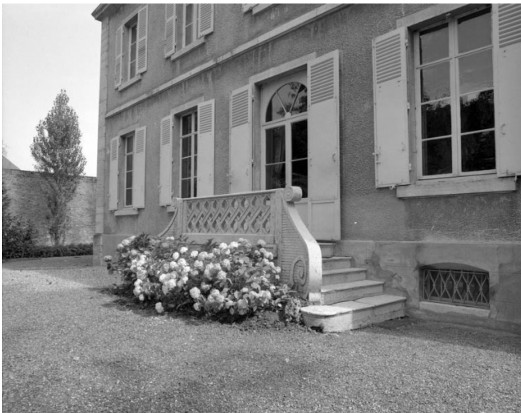
Détail : perron sur la façade postérieure de l'habitation.