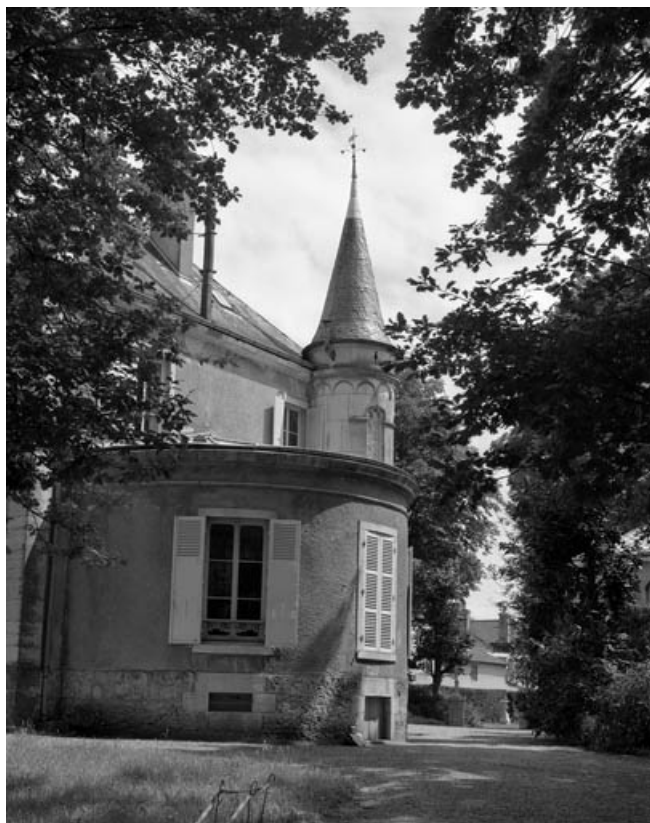
Façade latérale gauche de l'habitation.