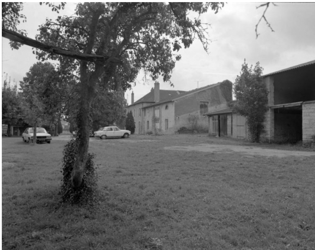
Cour des parties commerciales : bâtiments gauches depuis le fond de la parcelle.