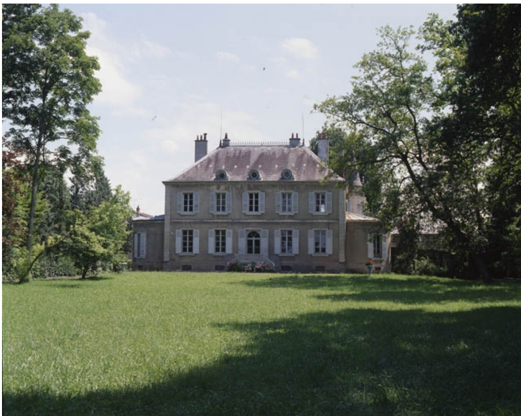
Intérieur de l'habitation : salon dans la rotonde de la façade latérale gauche. 70, Gray, 17, 18 quai Villeneuve