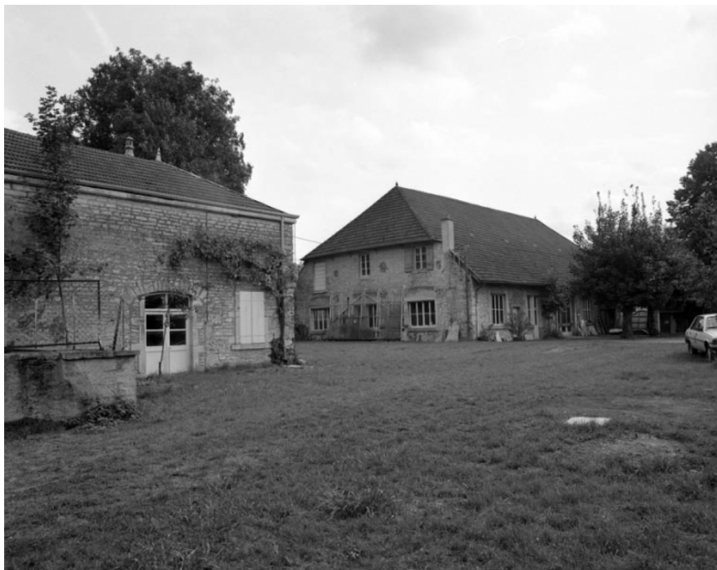
Bâtiments droits depuis le fond de la cour des parties commerciales.