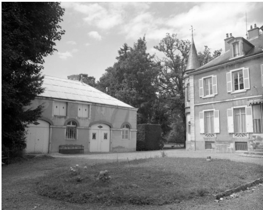
Ecurie et partie gauche de l'habitation dans la deuxième cour.