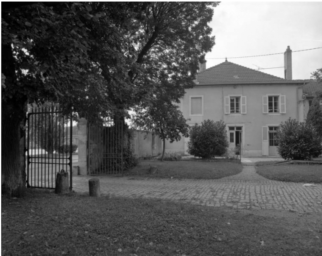
Entrée de la cour des parties commerciales avec l'ancien bureau à gauche.