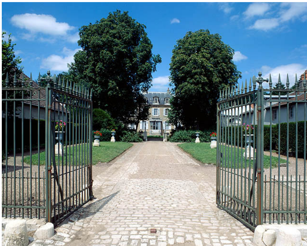
Bâtiment d'habitation depuis la grille d'entrée ouverte.