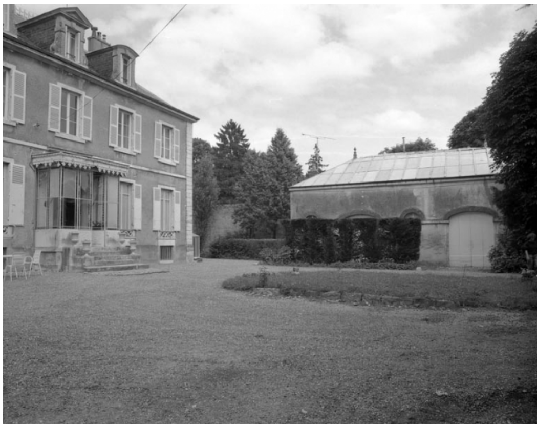
Remise à droite et habitation de trois quarts droit.