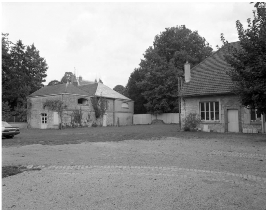
Bâtiments droits dans la cour des parties commerciales.