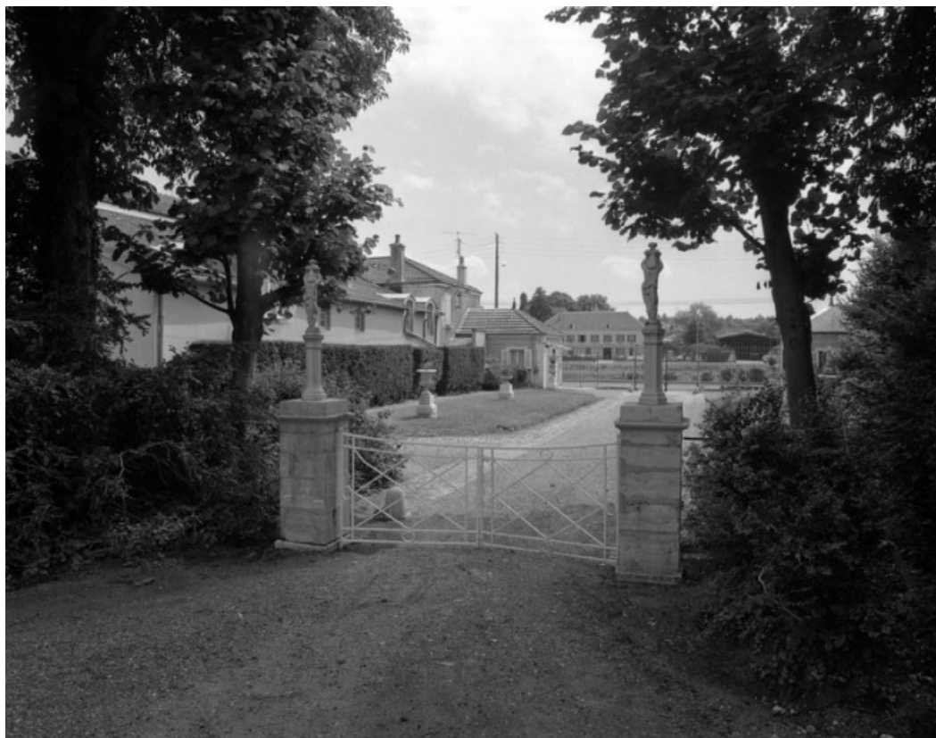
Communs de la première cour depuis l'entrée de la deuxième cour : bâtiments droits.