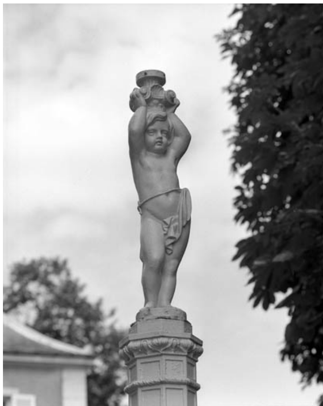
Détail du système d'éclairage de la cour de l'habitation : enfant porte-torchère. 70, Gray, 17, 18 quai Villeneuve