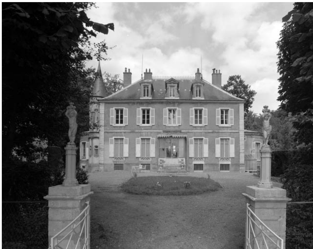
Façade antérieure de l'habitation depuis l'entrée de la deuxième cour.