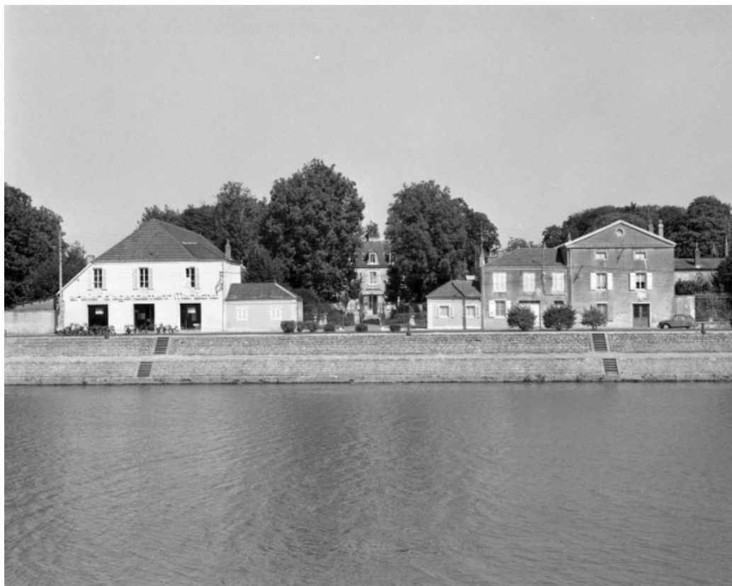
Vue d'ensemble depuis le quai Mavia.