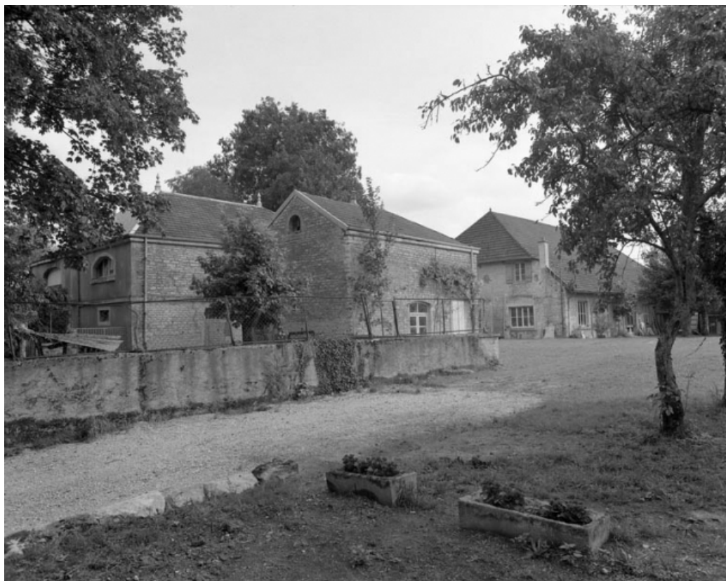
Cour des parties commerciales : bâtiment droit depuis le fond de la cour.