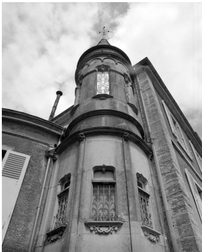
Détail de la tour néo-gothique à l'angle gauche de l'habitation. 70, Gray, 17, 18 quai Villeneuve