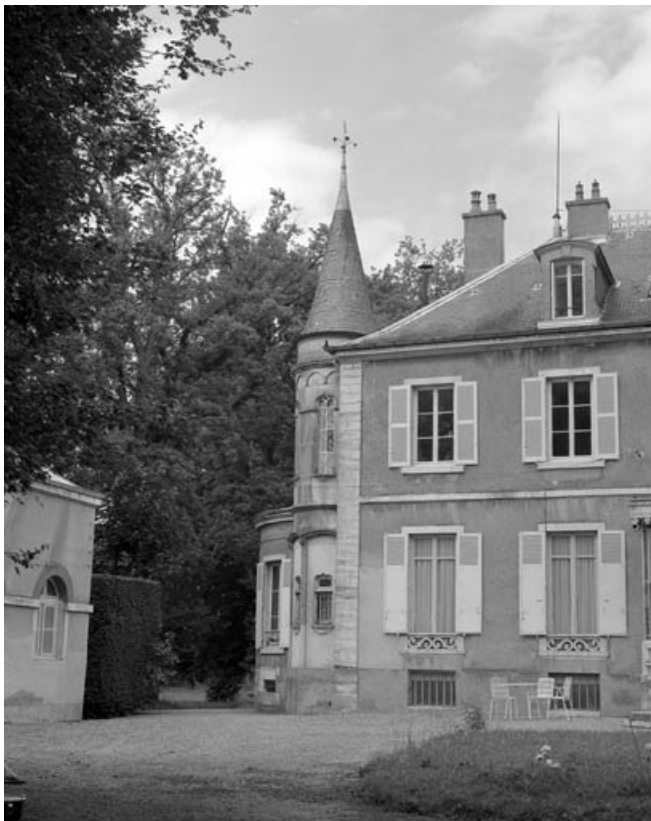
Partie gauche de la façade antérieure de l'habitation.