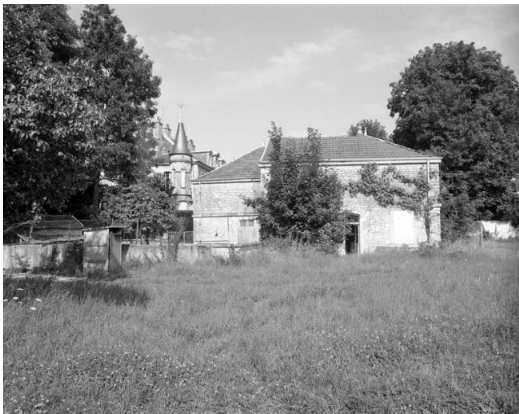
Façade postérieure de l'écurie depuis la cour des parties commerciales.