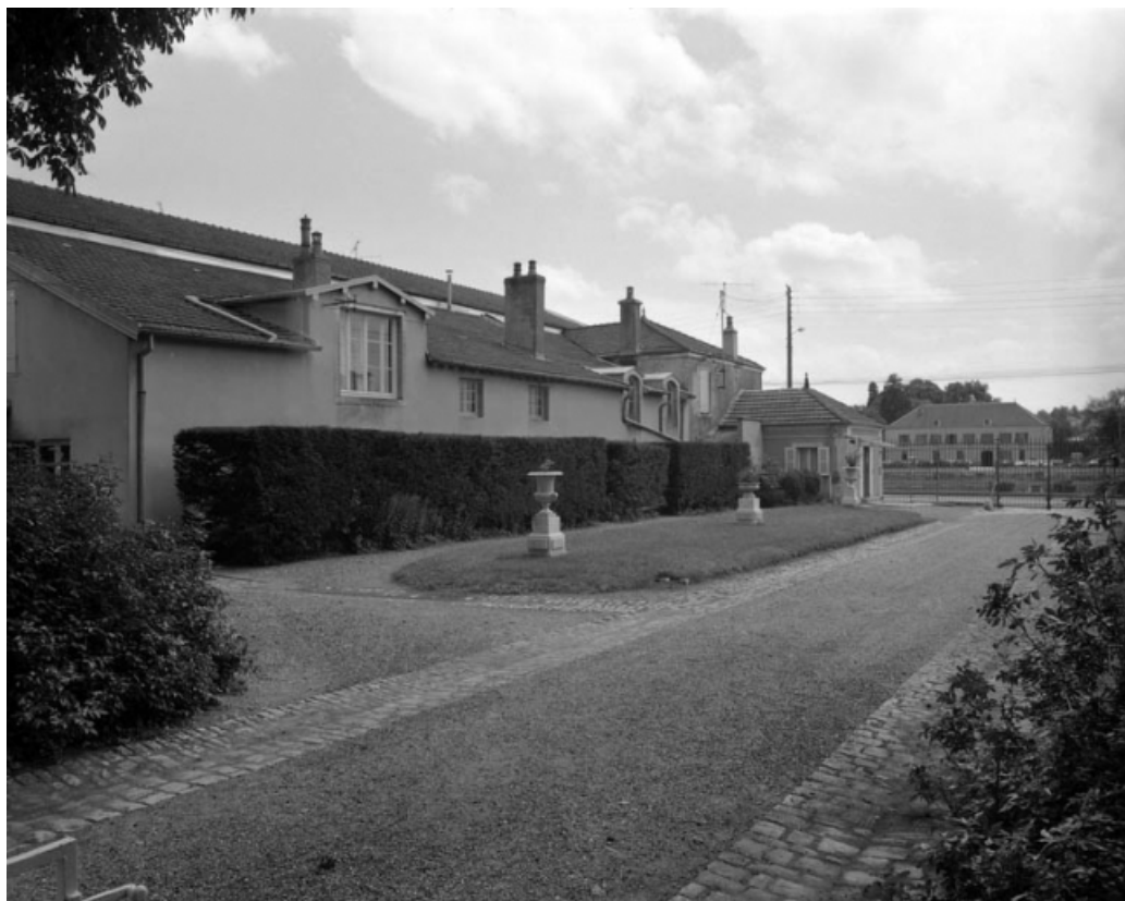
Communs, partie droite, depuis le fond de la première cour.