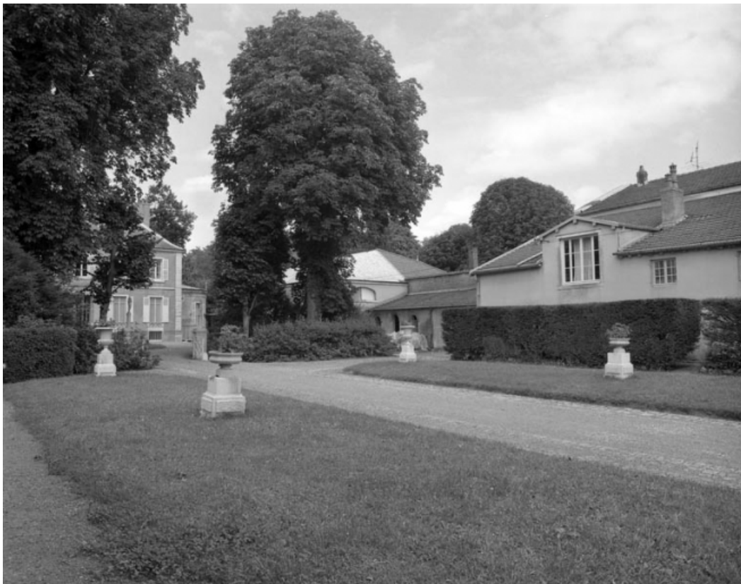
Communs, partie droite, et habitation depuis la première cour.