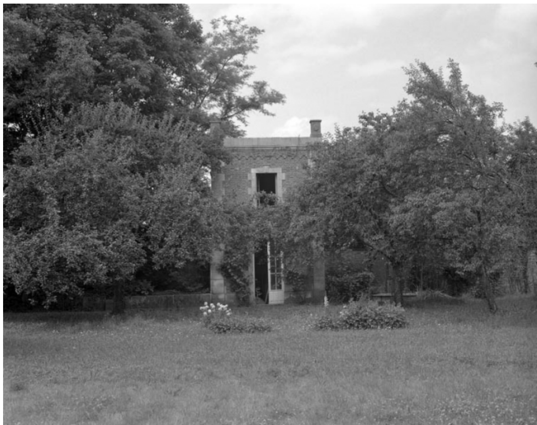
Vue de l'orangerie au fond du parc.