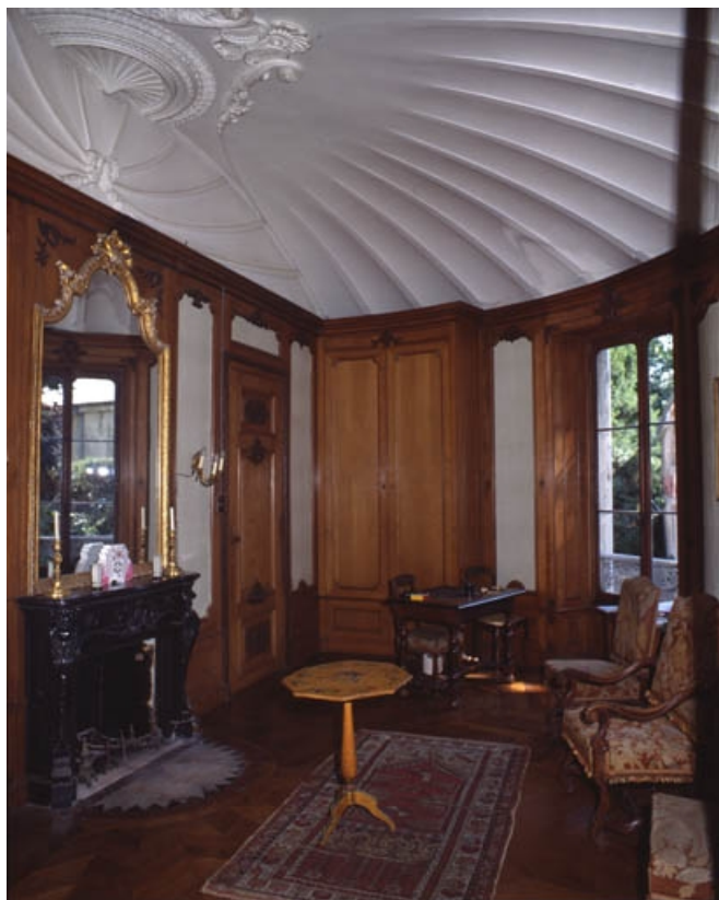
Façade postérieure de l'habitation.