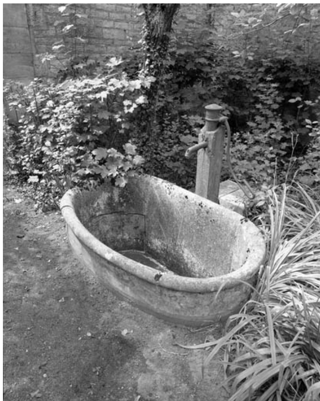
Vue de la borne-fontaine au fond du parc.