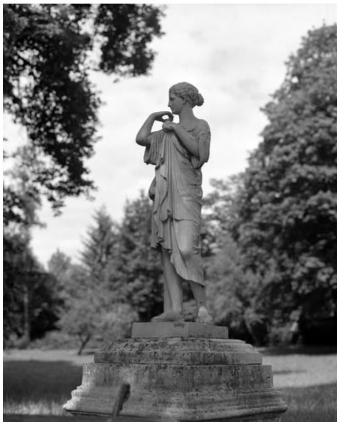
Détail : statue en fonte située dans le parc et provenant du Val d'Osne. 70, Gray, 17, 18 quai Villeneuve