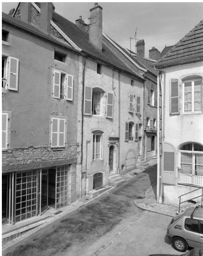
Façade antérieure de trois quarts gauche.