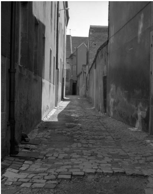
Vue éloignée d'une partie de la façade postérieure depuis la ruelle du Château Grillot. 70, Gray, 16 rue des Terreaux