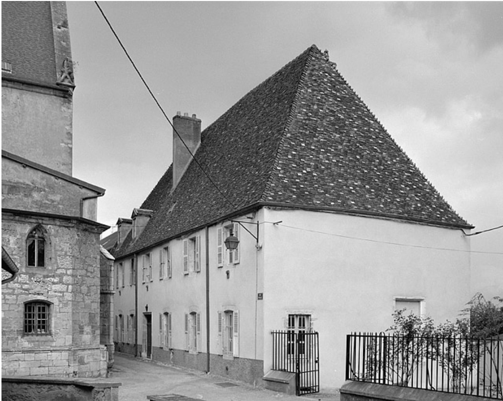
Vue d'ensemble de trois quarts droit. 70, Gray