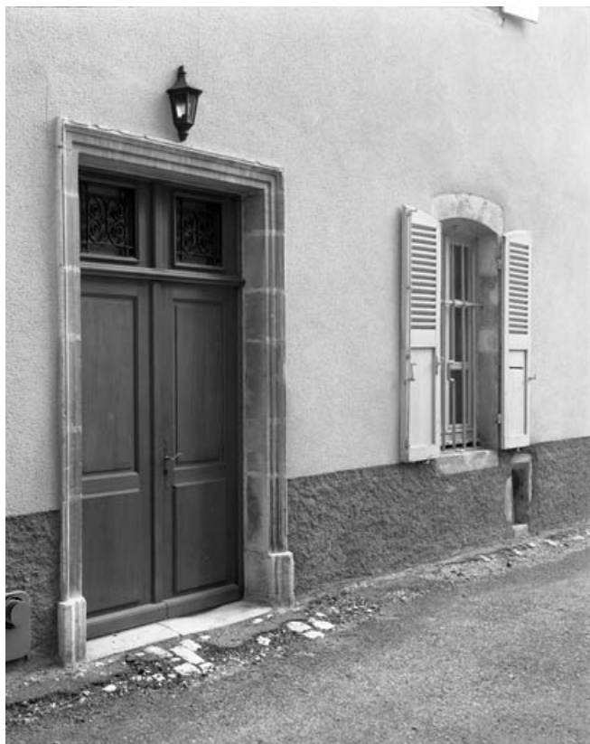
Portail d'entrée de trois quarts gauche.