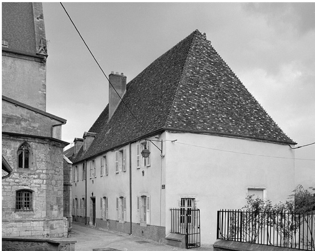
Vue d'ensemble de trois quarts droit. 70, Gray