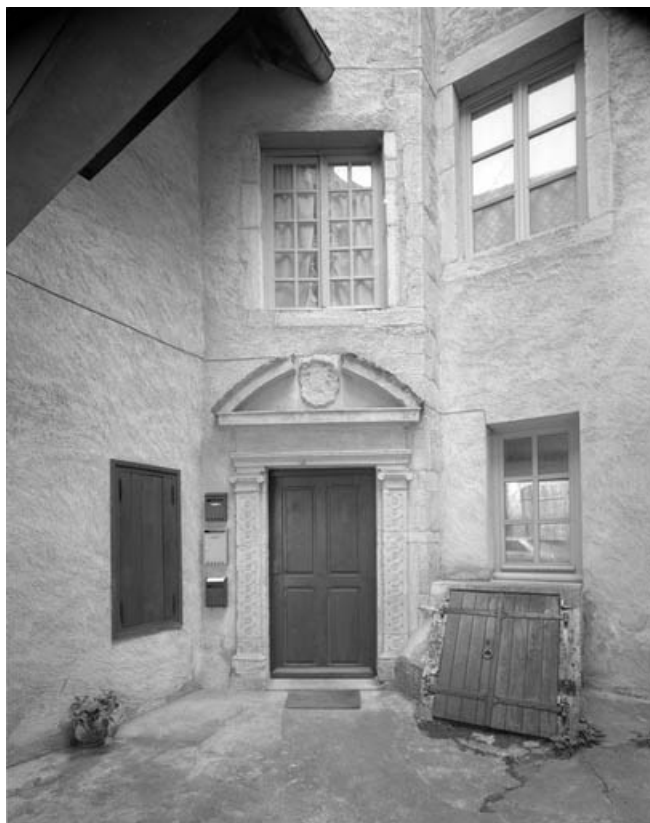
Détail : porte d'entrée de l'escalier en vis.