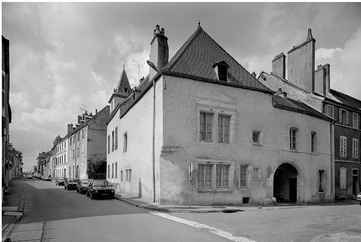
Vue d'ensemble depuis la rue Victor Hugo. 70, Gray