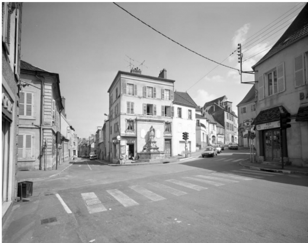
Vue d'ensemble depuis le carrefour des rues Rossen et Grande Rue. 70, Gray, 26 rue du Marché