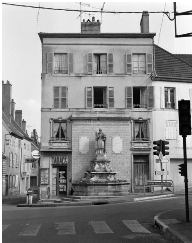
Façade antérieure, de face.