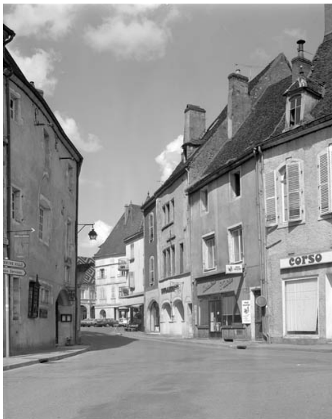
Façade antérieure de trois quarts droit.