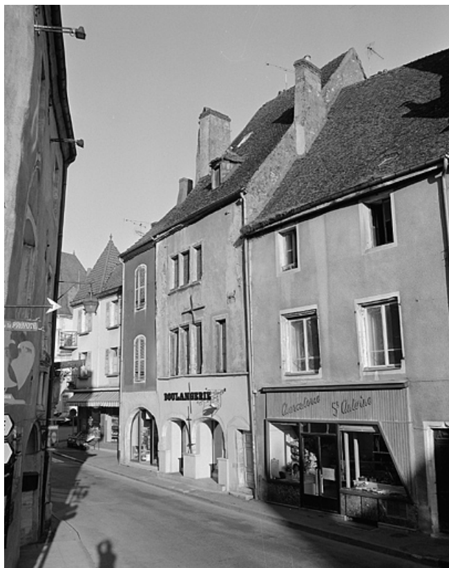
Façade antérieure de trois quarts droit.